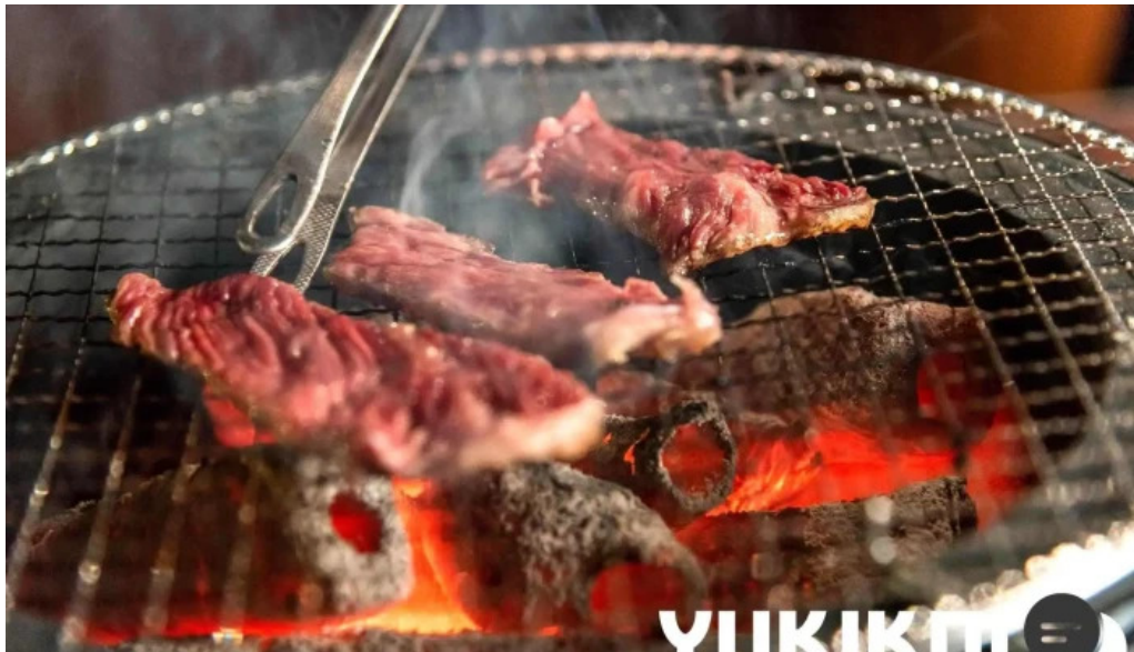
肉匠坂井 福井二の宮店 ステーキ