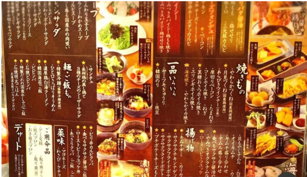
肉匠坂井 福井二の宮店 メニュー