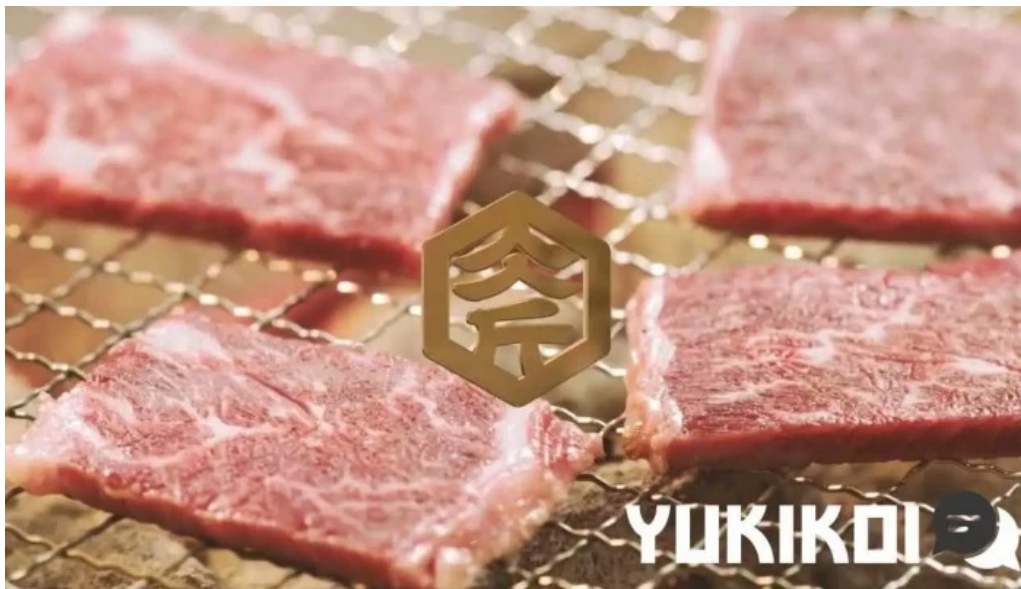
肉匠坂井 福井二の宮店 オーナー提供