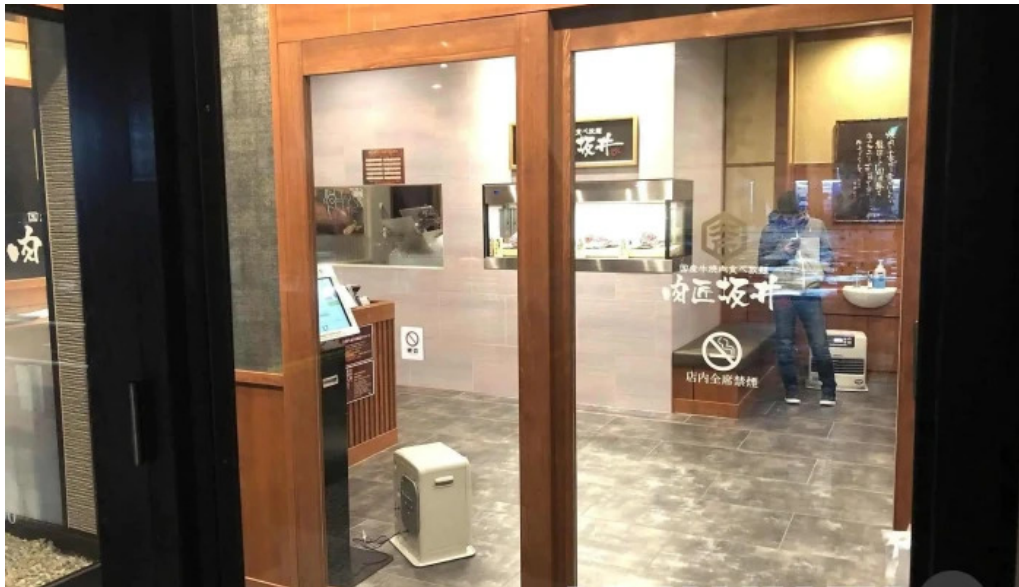
肉匠坂井 福井二の宮店 すべて