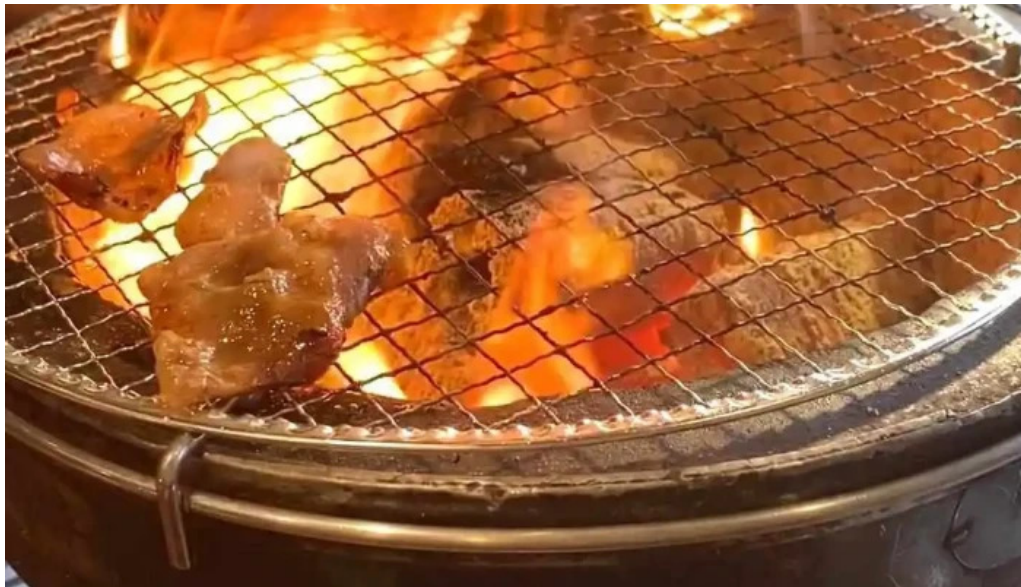
肉匠坂井 福井二の宮店 動画