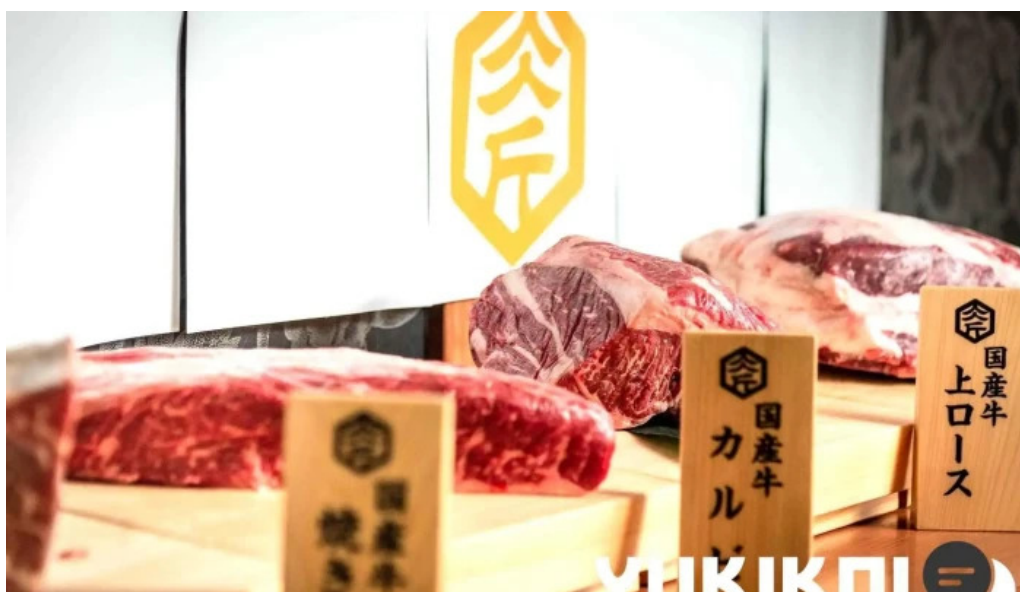
肉匠坂井 福井二の宮店 料理飲み物