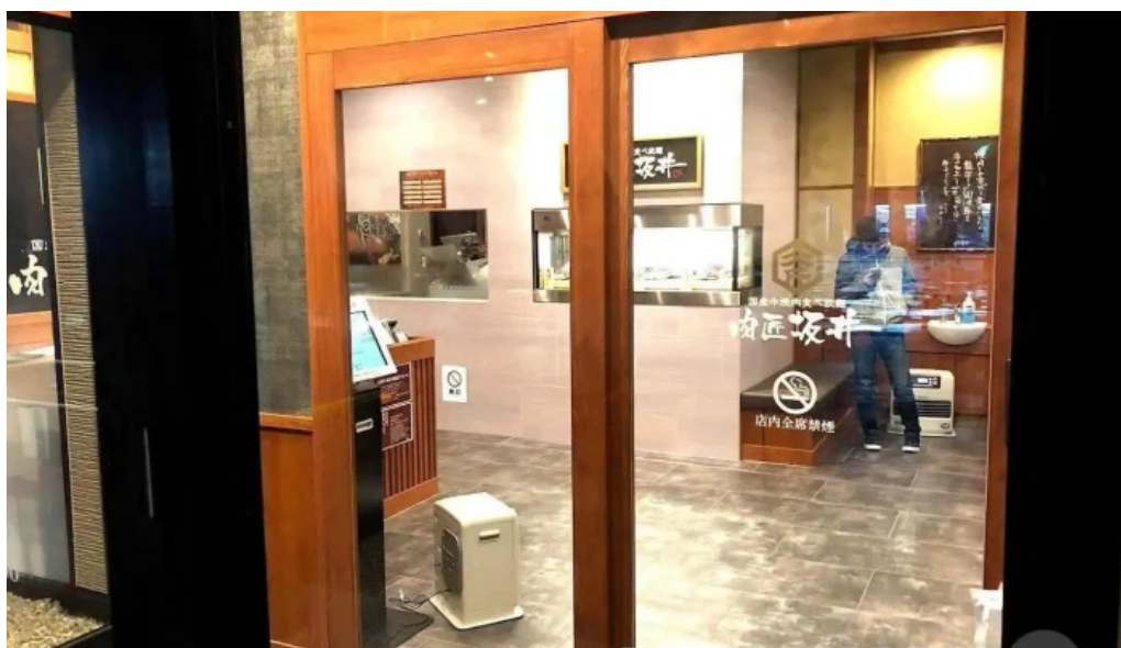
肉匠坂井 福井二の宮店 福井市