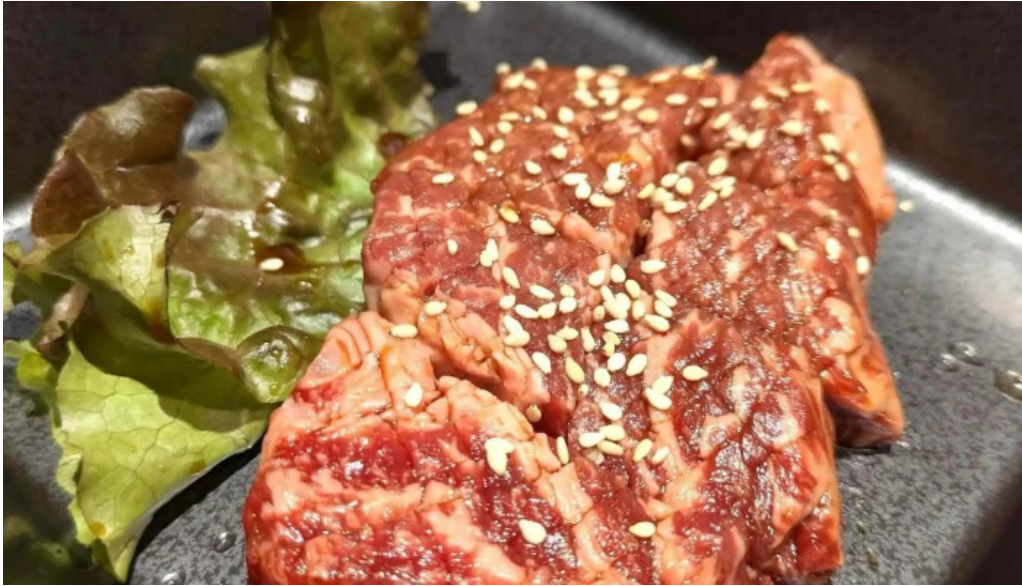
清香苑 comentario 2