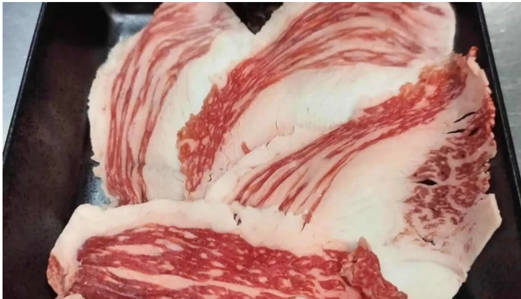
清香苑 料理飲み物