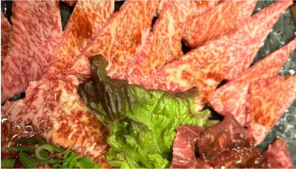
清香苑 comentario 6