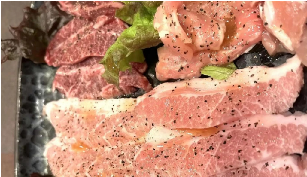
清香苑 comentario 3