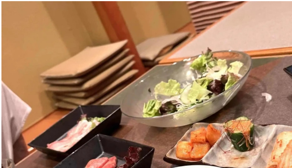
清香苑 comentario 9