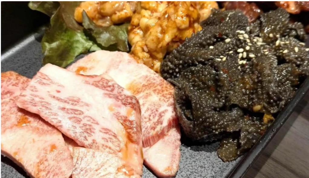
清香苑 comentario 1