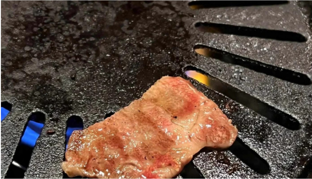
清香苑 comentario 8