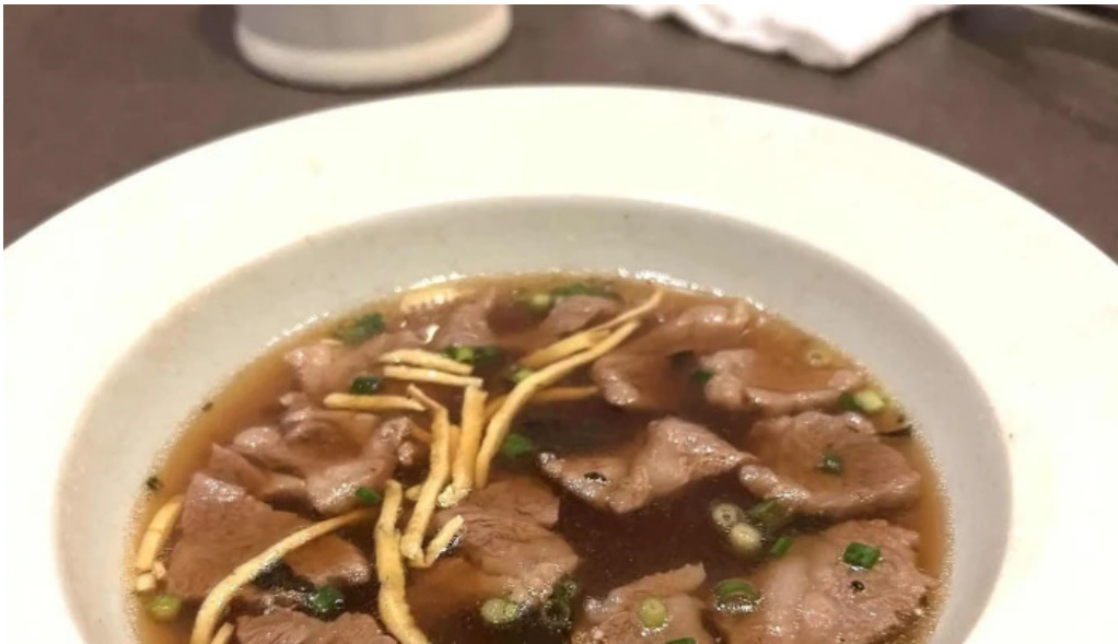
清香苑 comentario 7