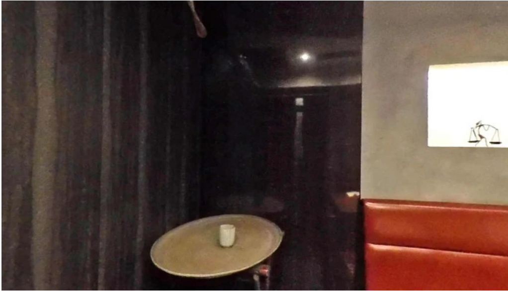
清香苑 ストリートビューと 360 ビュー