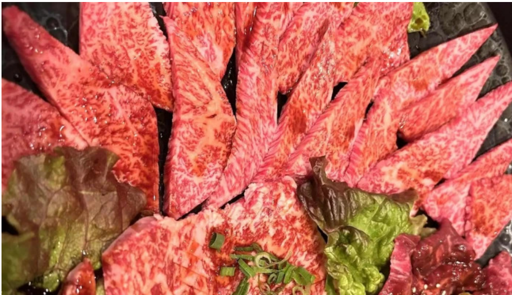
清香苑 comentario 5