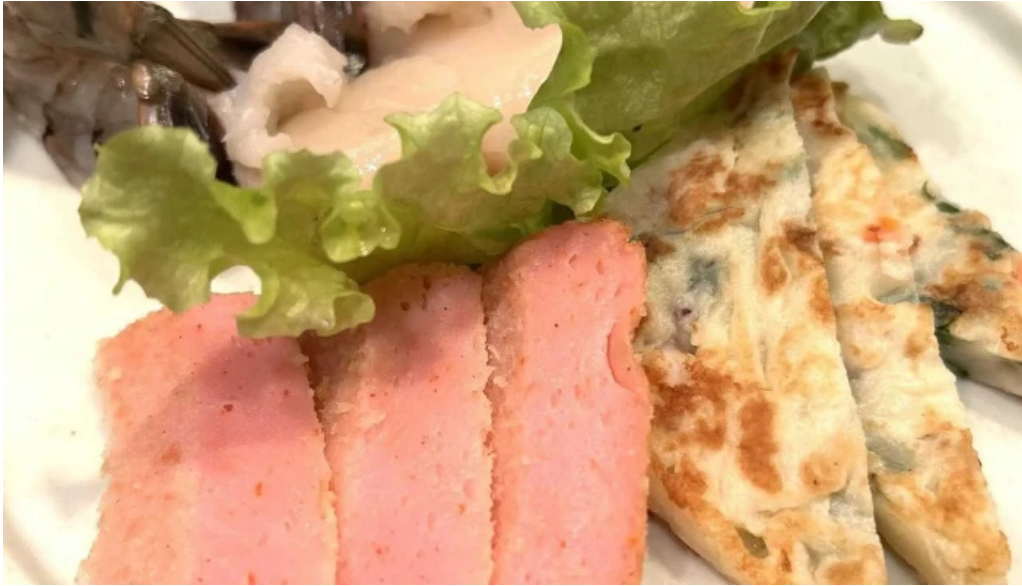
清香苑 comentario 4