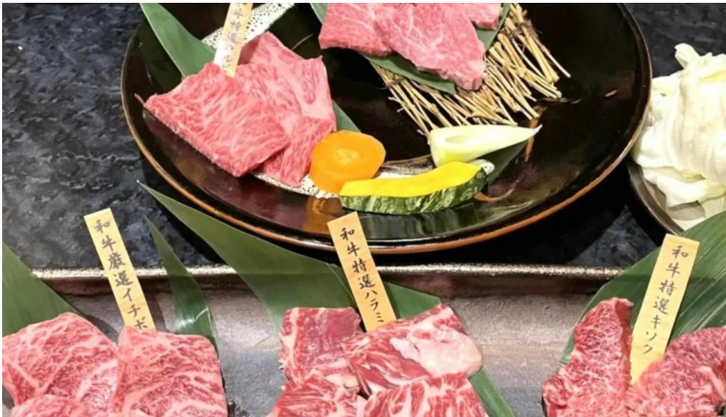
熟鮮 焼肉かず comentario 5