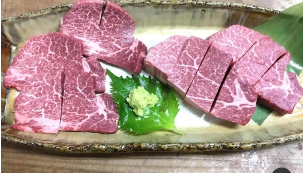
熟鮮 焼肉かず オーナー提供