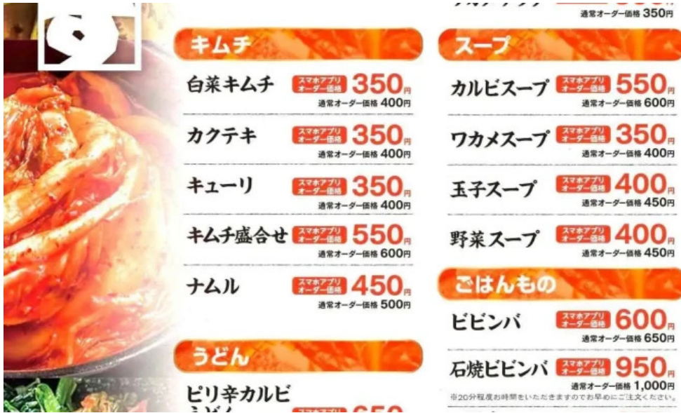
熟鮮 焼肉かず メニュー