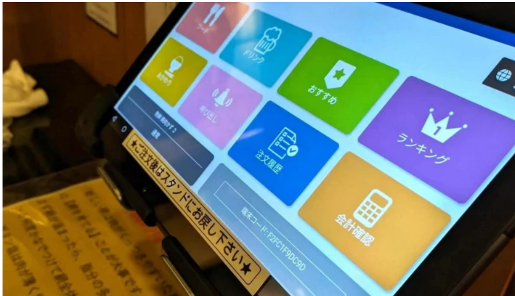
熟鮮 焼肉かず comentario 1