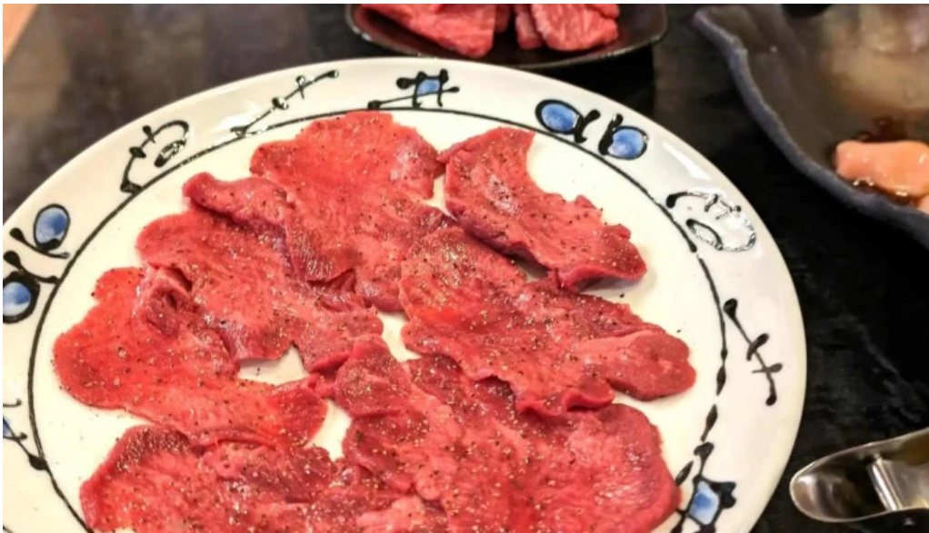
熟鮮 焼肉かず comentario 4