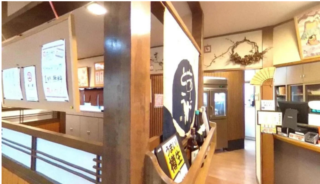
熟鮮 焼肉かず ストリートビューと 360 ビュー