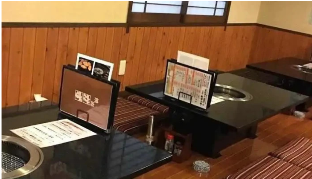
熟鮮 焼肉かず 江津市