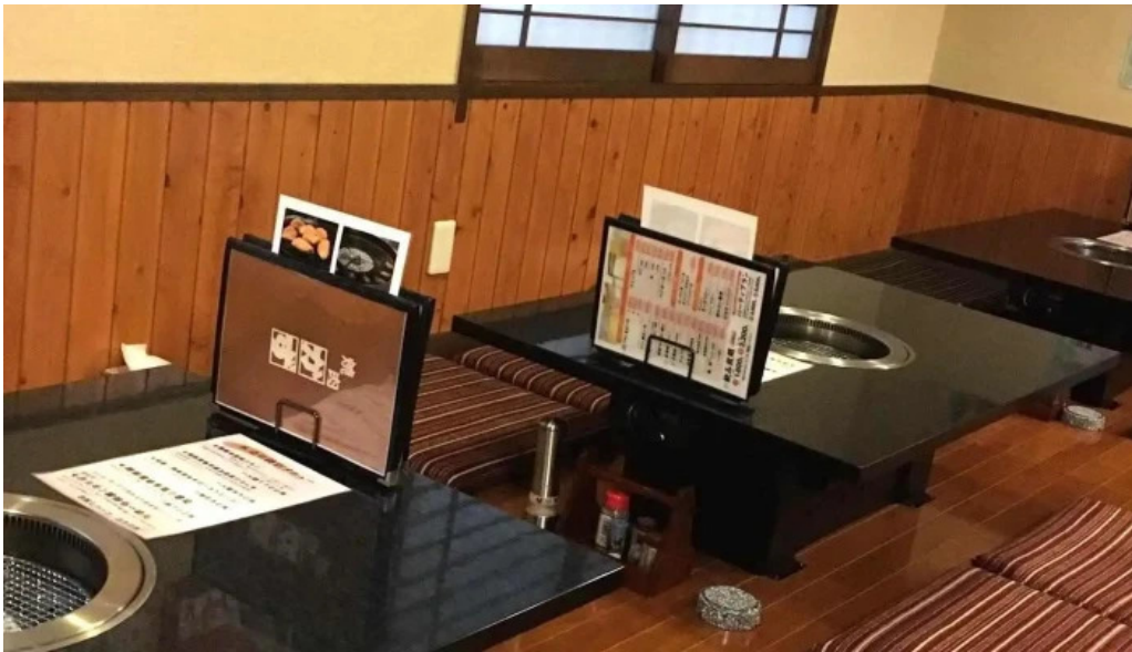
熟鮮 焼肉かず すべて