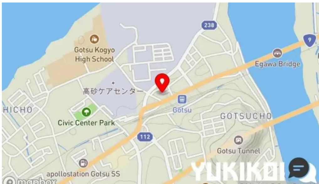
熟鮮 焼肉かず地図