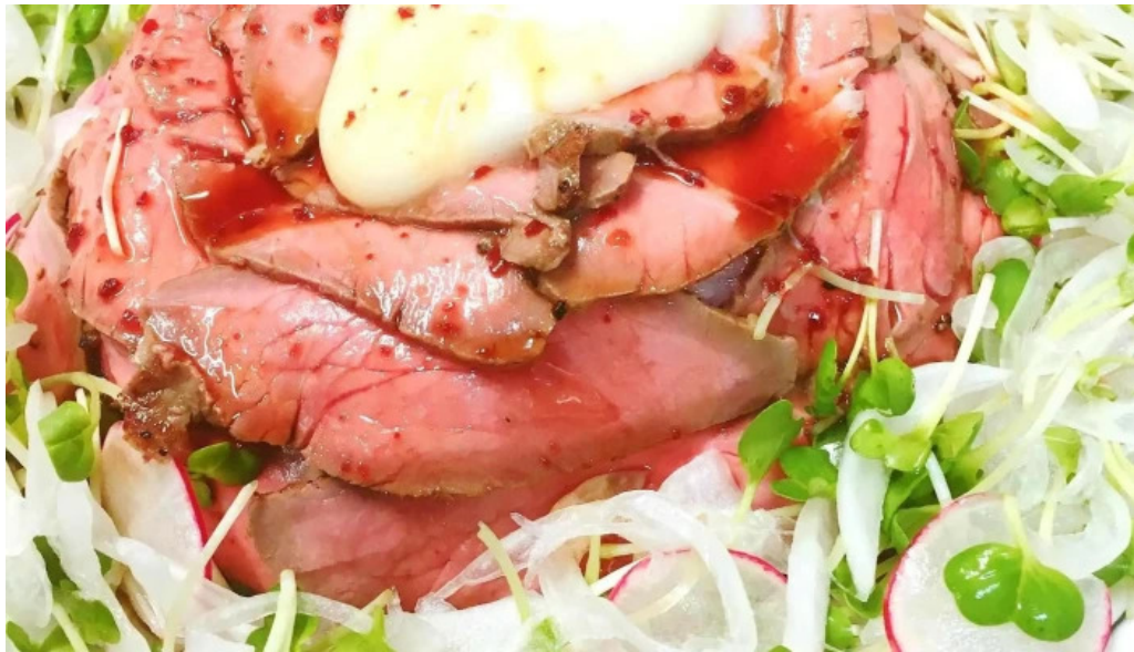
熟鮮 焼肉かず 料理飲み物