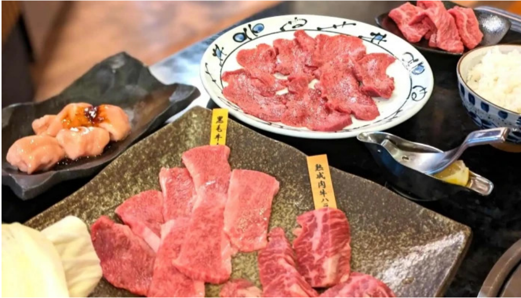
熟鮮 焼肉かず comentario 3