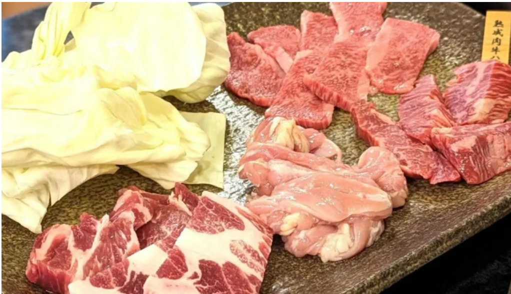
熟鮮 焼肉かず comentario 2