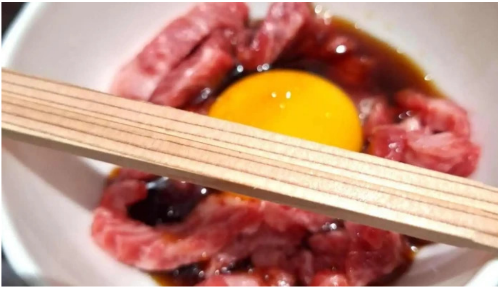
焼肉桂司 料理飲み物