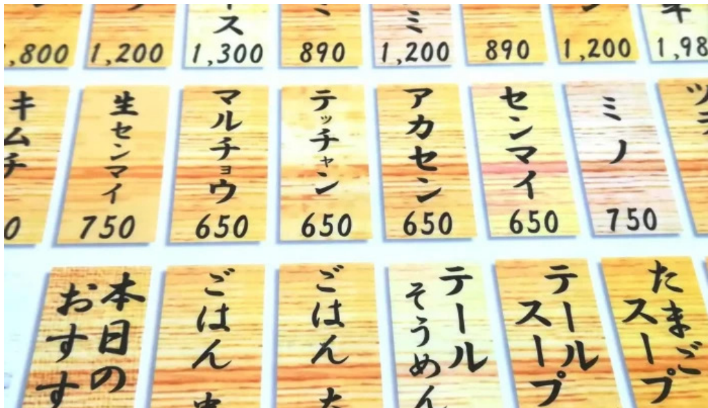
焼肉桂司 カタログ