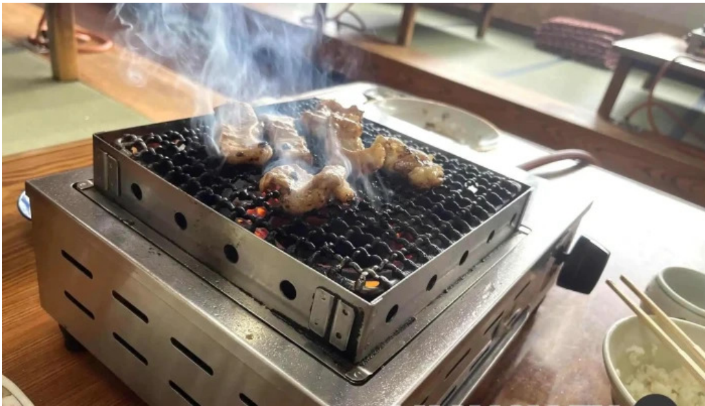
だるまや バーベキュー