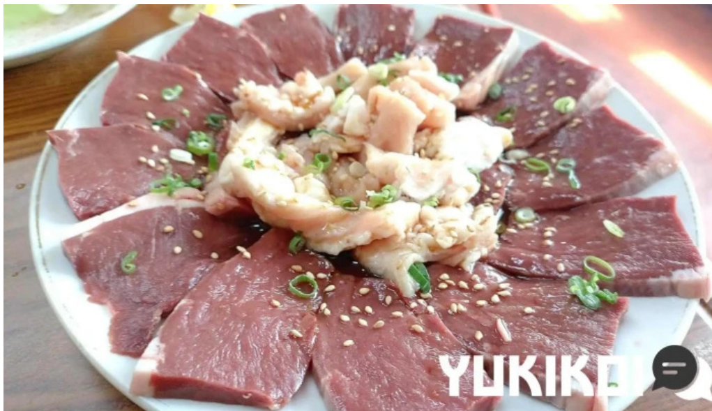
だるまや ホルモン焼き