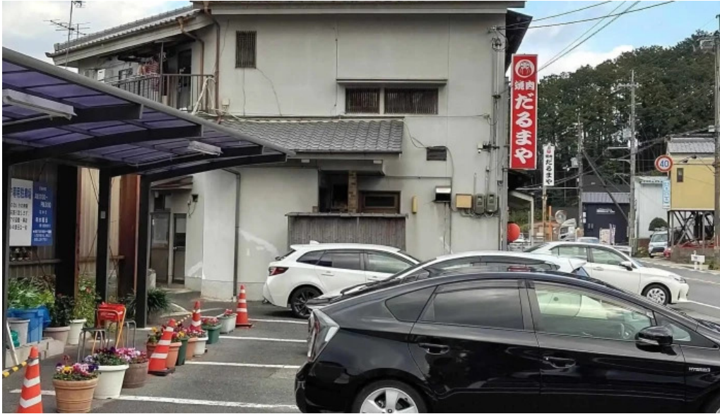
だるまや カタログ