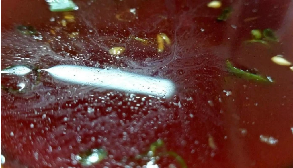
だるまや プロモーション