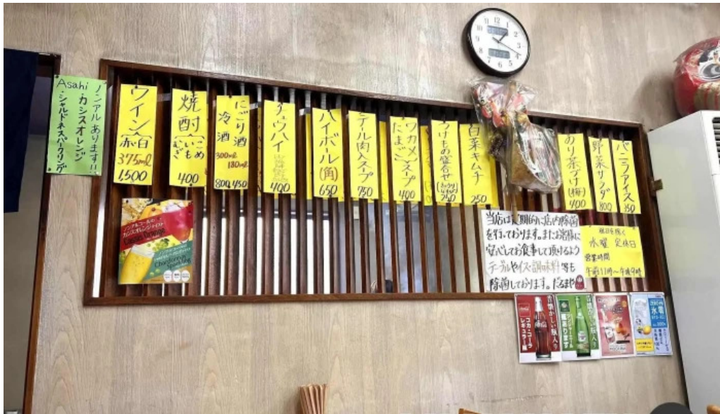
だるまやメニュー