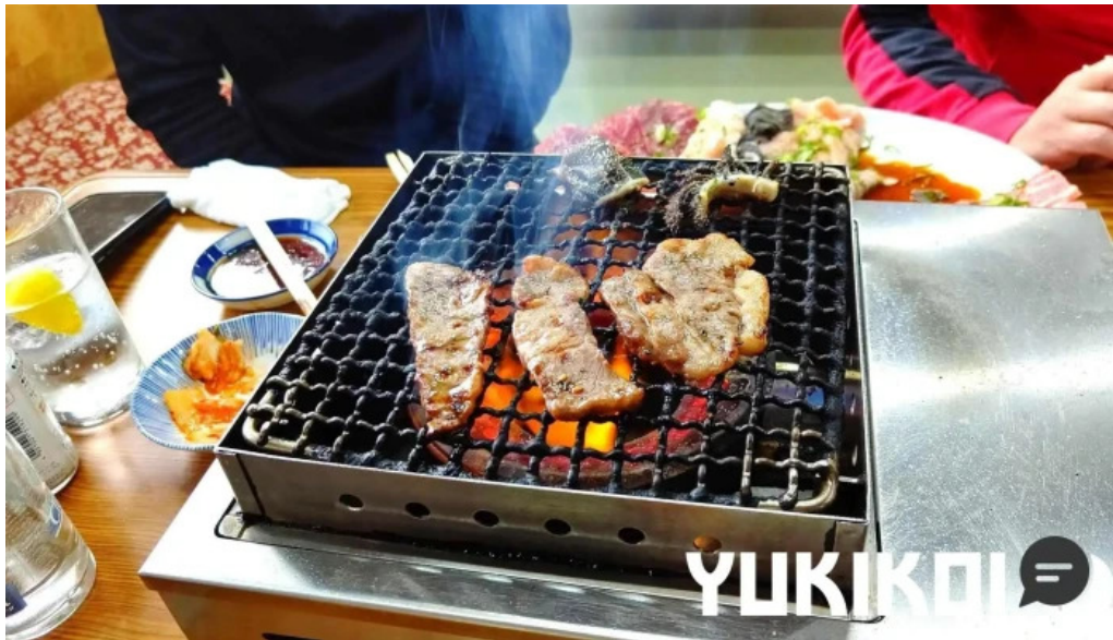
だるまや 料理飲み物