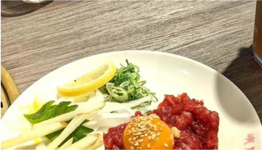
明月館 枚方店 タルタルステーキ