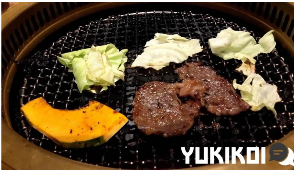
明月館 枚方店 バーベキュー