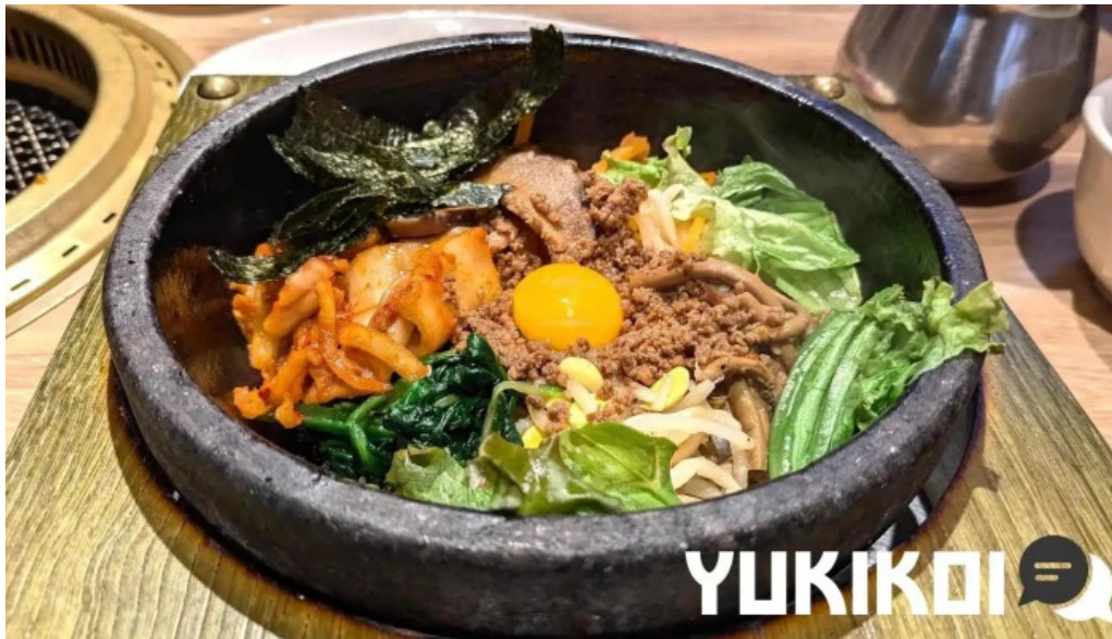
明月館 枚方店 ビビンバ