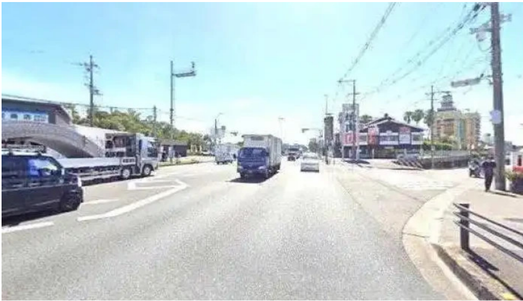
明月館 枚方店 枚方市