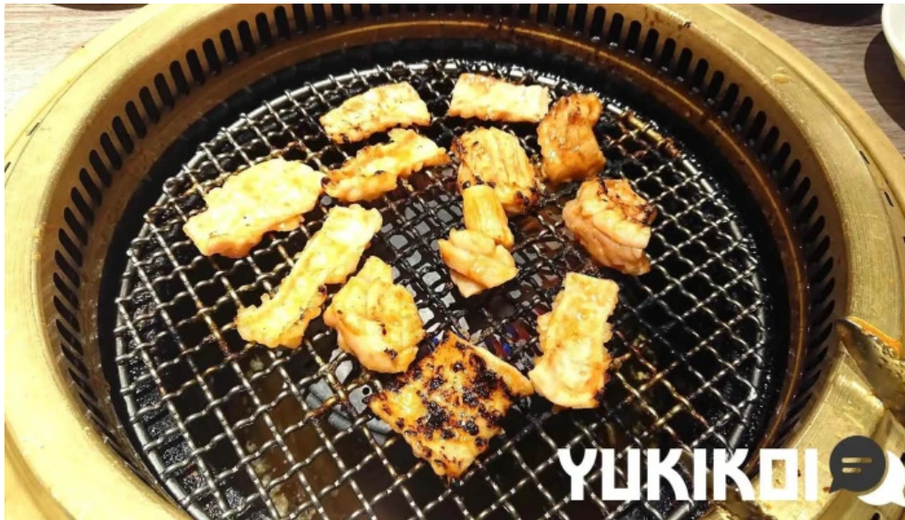
明月館 枚方店 料理飲み物