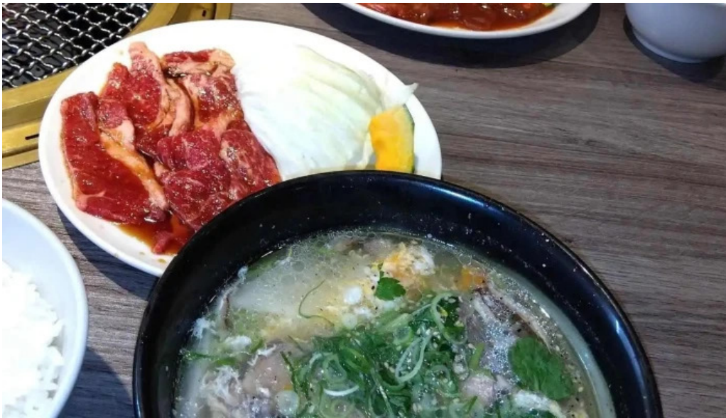
明月館 枚方店 最新