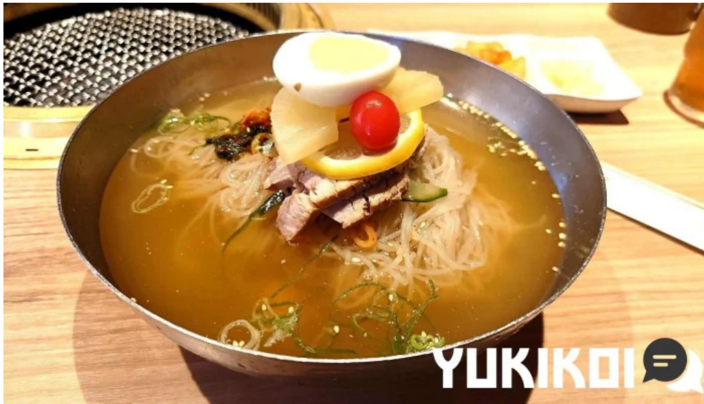
明月館 枚方店 冷麺