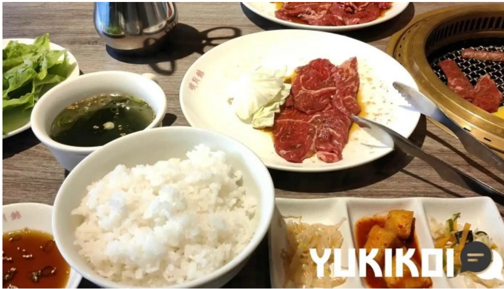
明月館 枚方店 動画