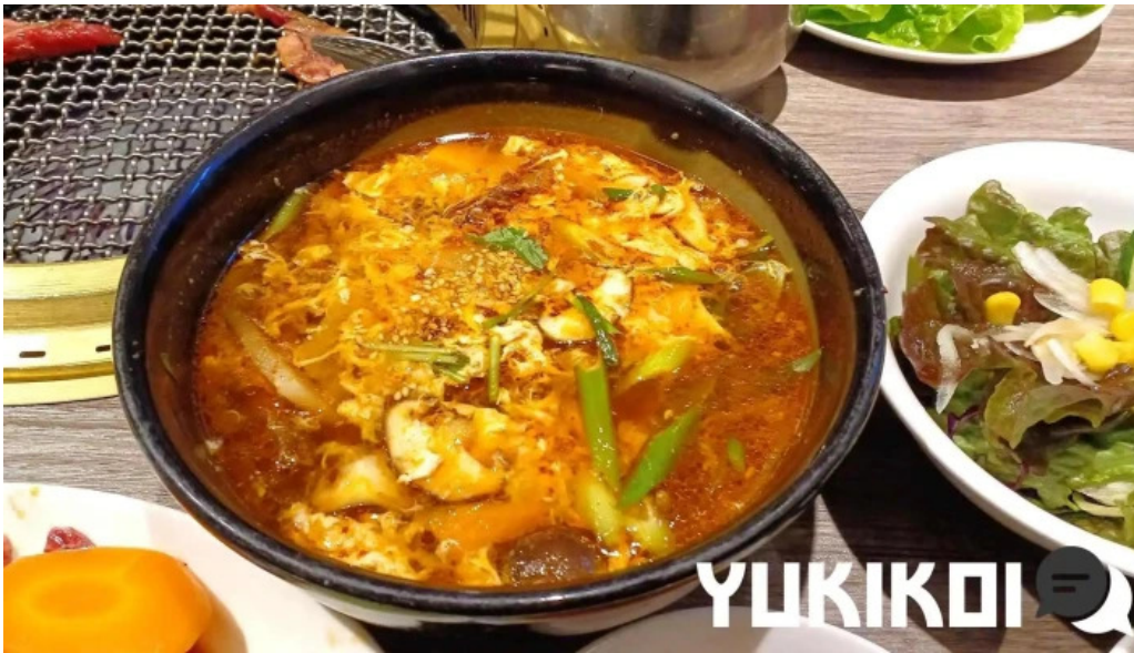
明月館 枚方店 キムチ