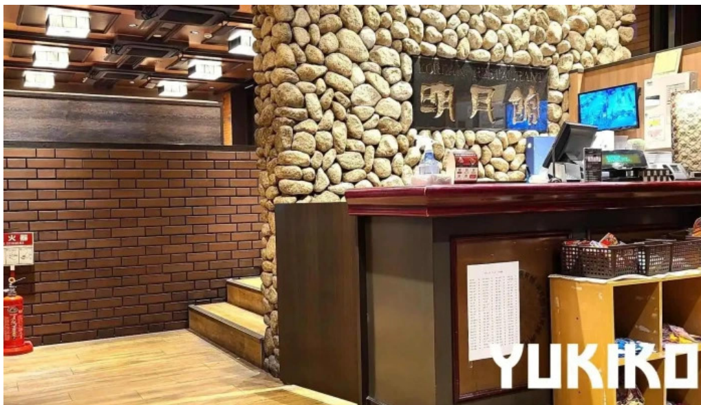
明月館 枚方店 雰囲気