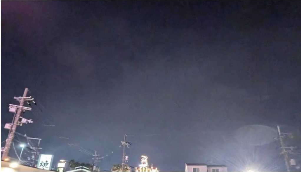
明月館 枚方店 エリア