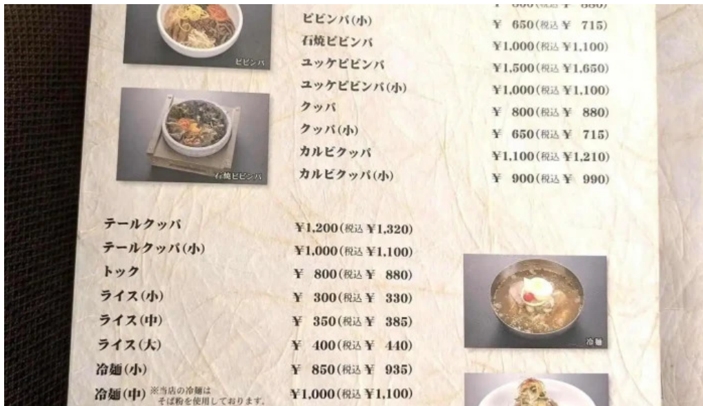
明月館 枚方店 メニュー