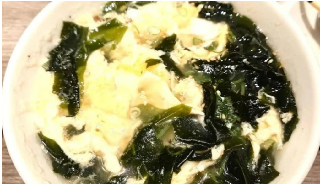
明月館 枚方店 ミヨックク