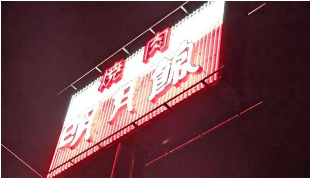
明月館 枚方店 instagram