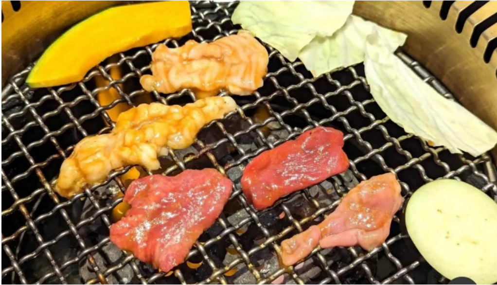
がんでつ 枚方店 バーベキュー