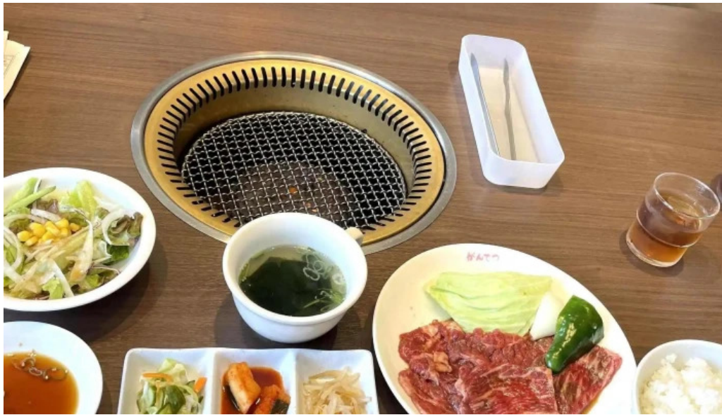
がんでつ 枚方店 営業中