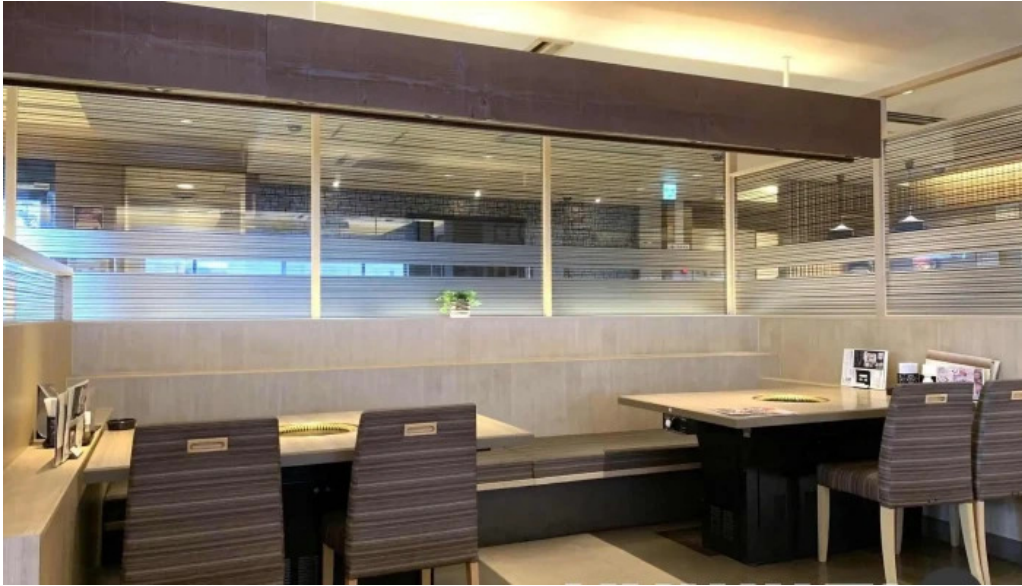
がんでつ 枚方店 雰囲気