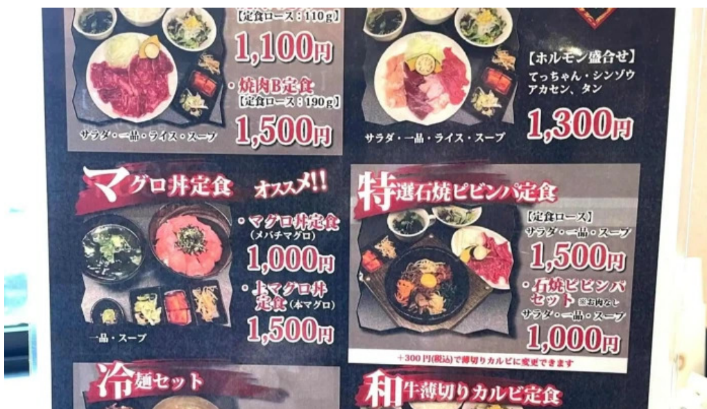
がんでつ 枚方店 どこ