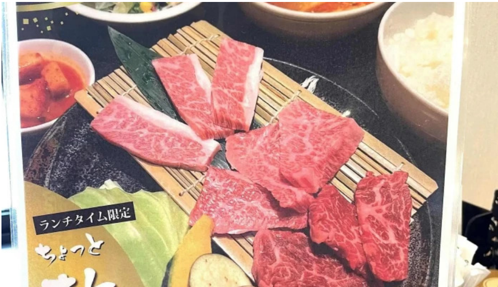
がんでつ 枚方店 番号