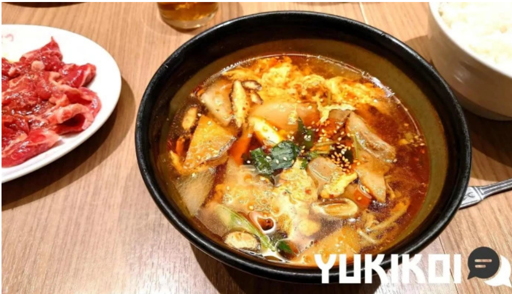
がんでつ 枚方店 キムチ