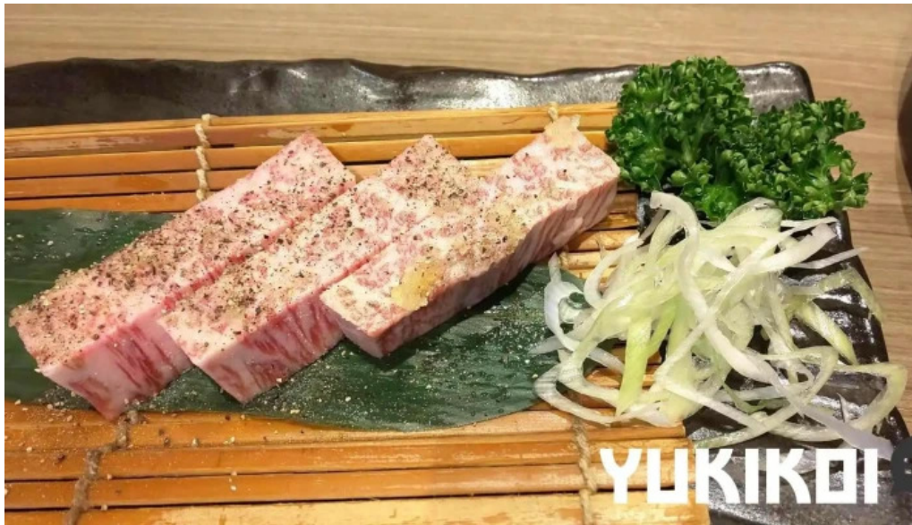
がんでつ 枚方店 料理飲み物