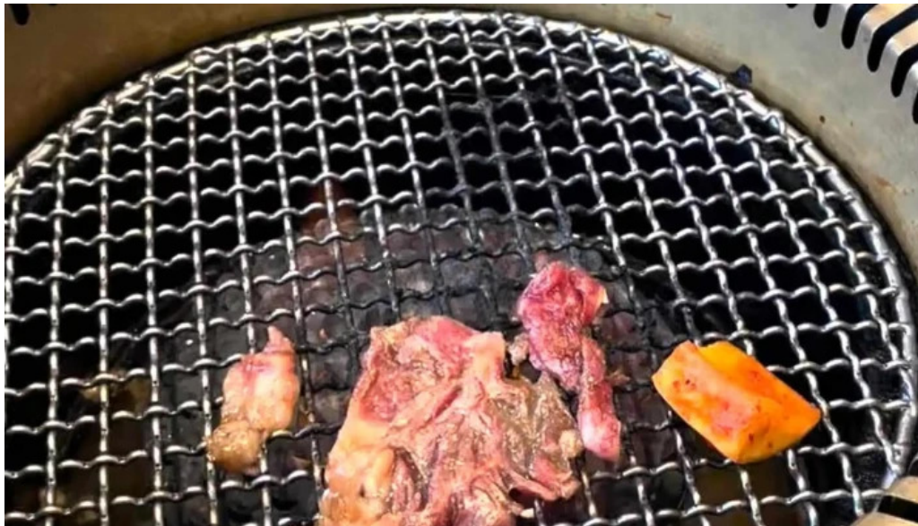
がんでつ 枚方店 口コミ