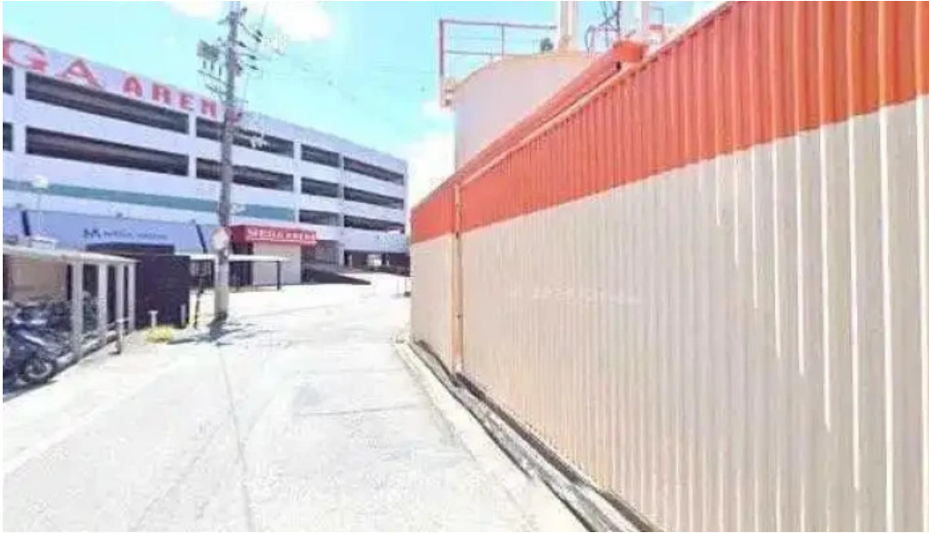
がんでつ 枚方店 枚方市