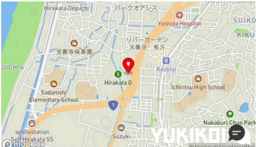
がんでつ 枚方店 地図