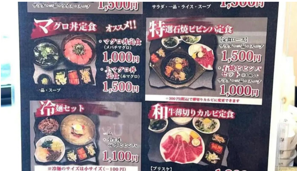
がんでつ 枚方店 メニュー