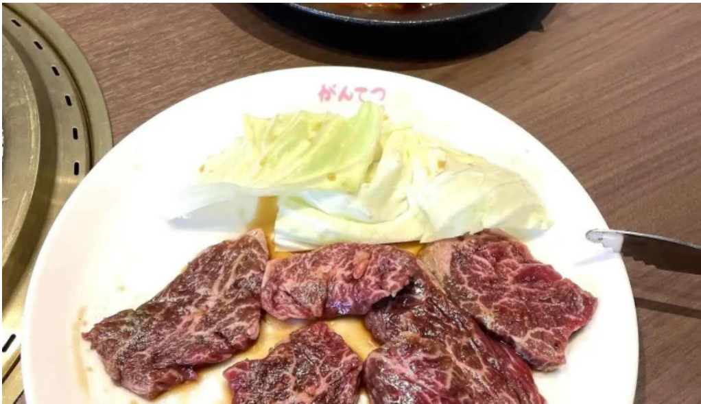
がんでつ 枚方店 最新