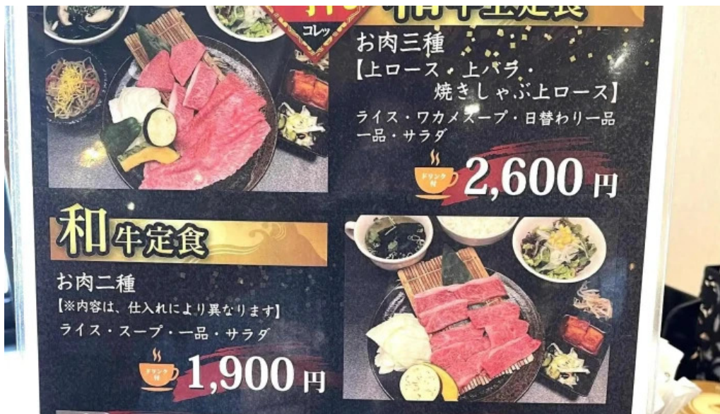
がんでつ 枚方店 カタログ