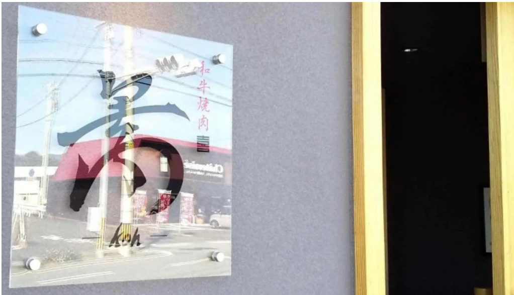
和牛焼肉 鬯こう ウェブサイト