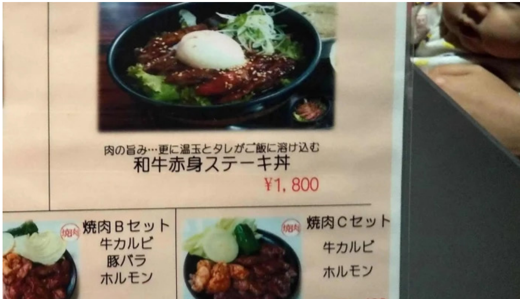
和牛焼肉 鬻こう コメント