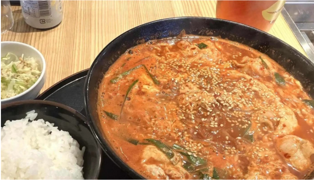
和牛焼肉 鬯こう エリア