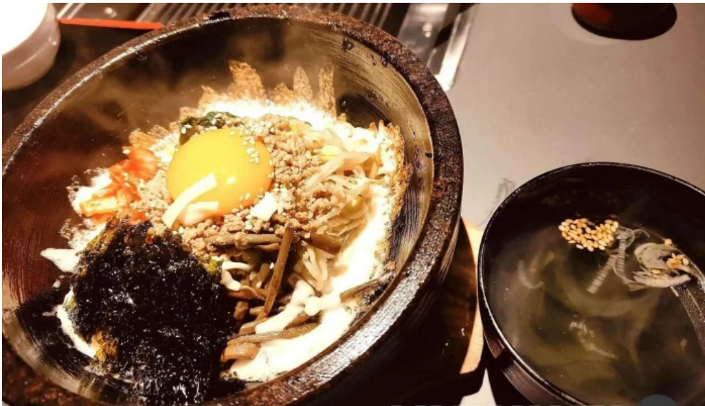
和牛焼肉 曇こう ラーメン