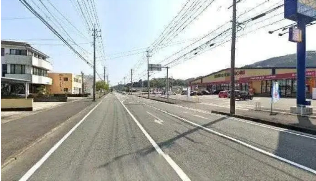
和牛焼肉 鬯こう 日南市