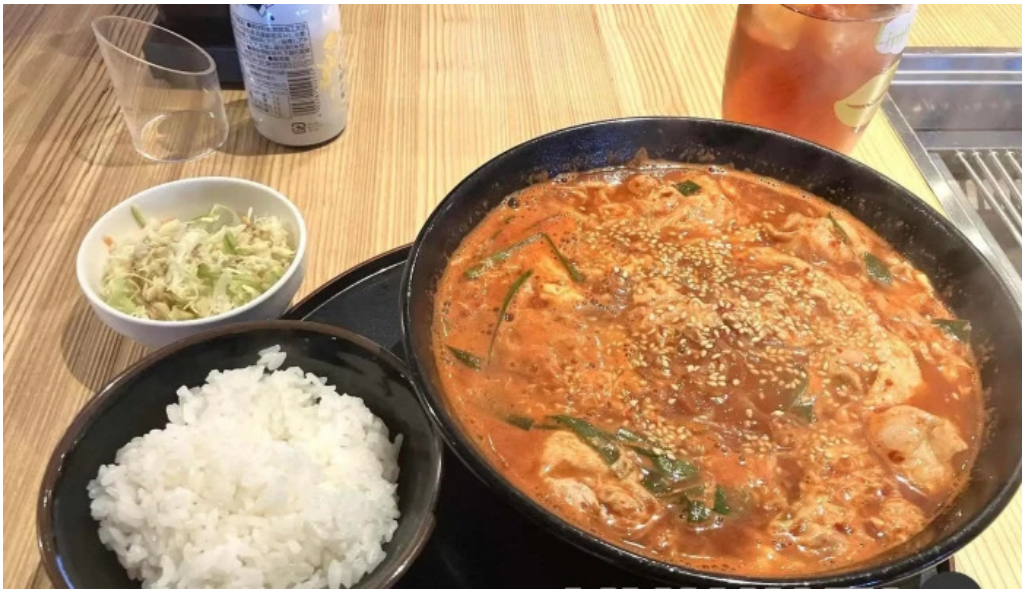
和牛焼肉 鬻こう 最新