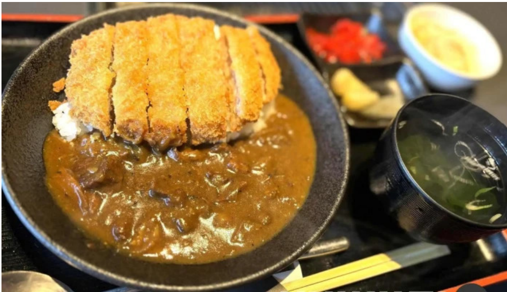
和牛焼肉 鬯こう 料理飲み物