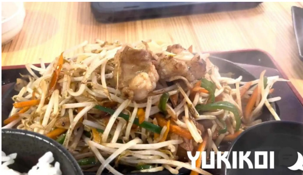
和牛焼肉 曇こう 動画