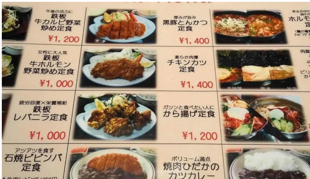
和牛焼肉 鬯こう 近く