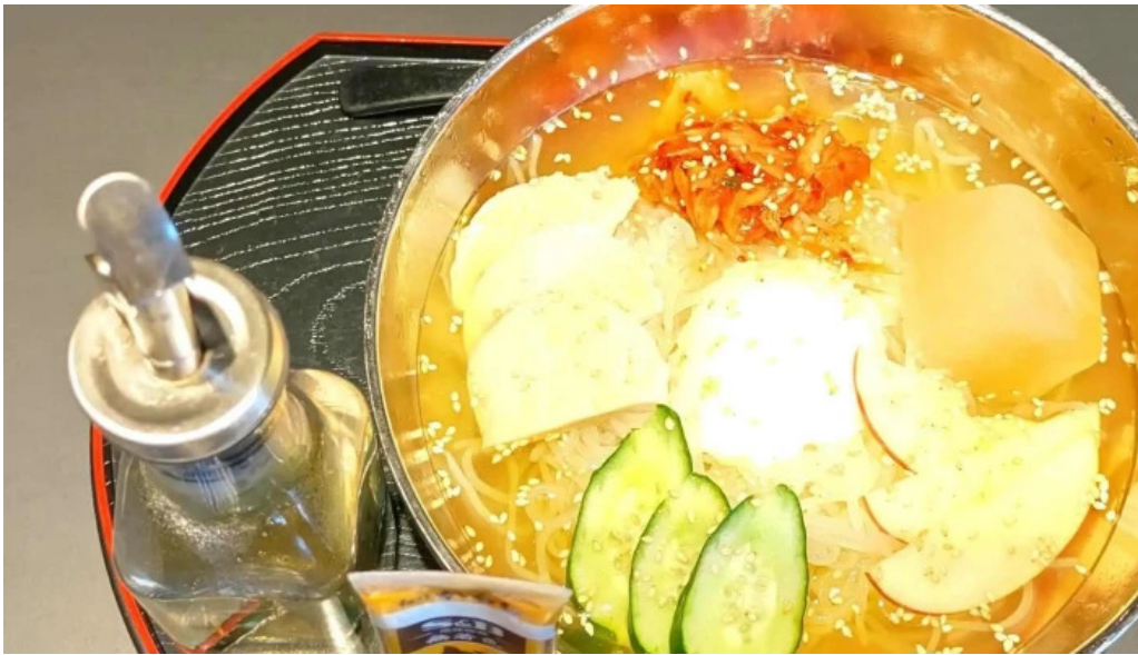
和牛焼肉 鬻こう 番号