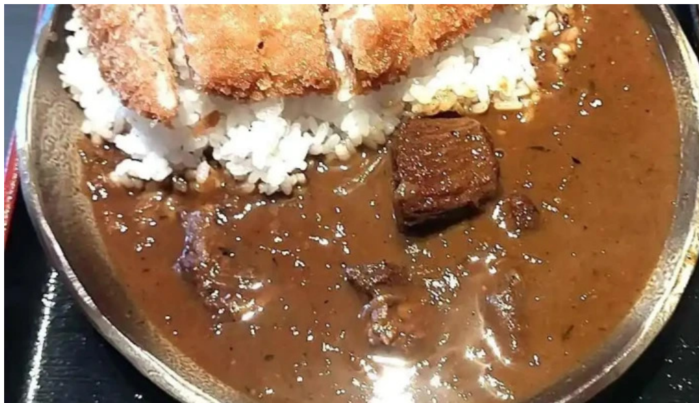
和牛焼肉 鬯こう 豚カツ