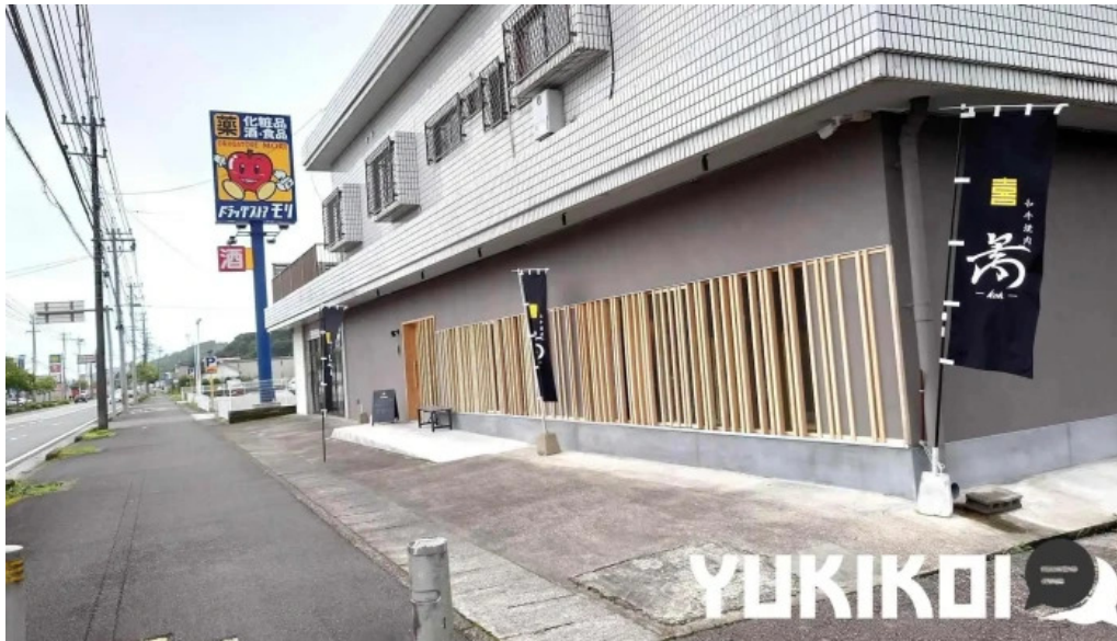
和牛焼肉 鬯 こう 日南市