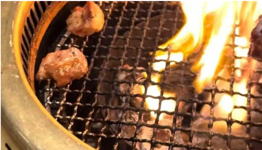
炭火焼肉enよしの本店 動画