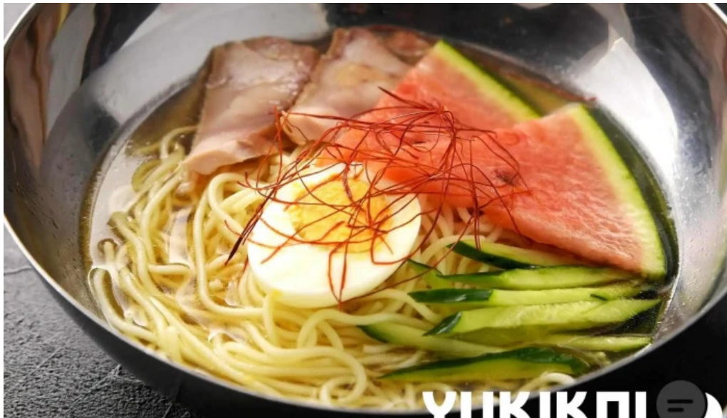
炭火焼肉enよしの本店 ラーメン