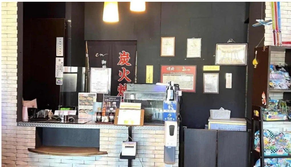
炭火焼肉enよしの本店 雰囲気