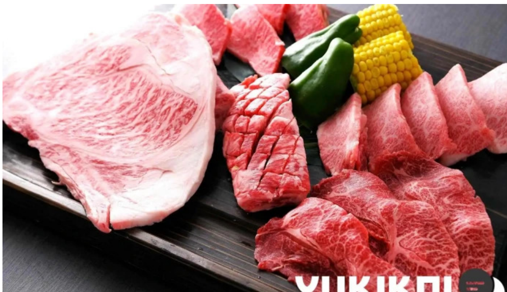
炭火焼肉enよしの本店 オーナー提供