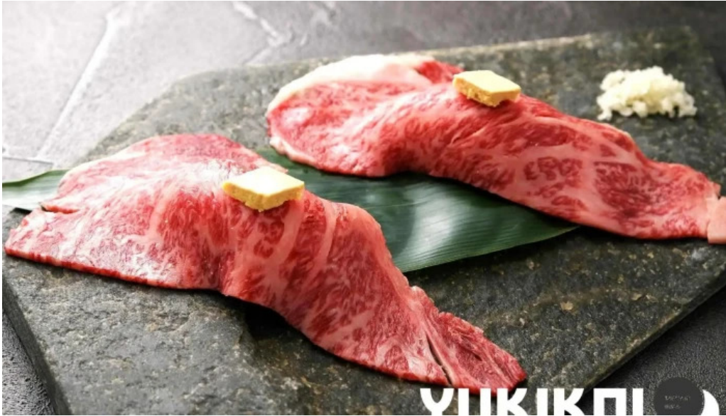
炭火焼肉enよしの本店 料理飲み物