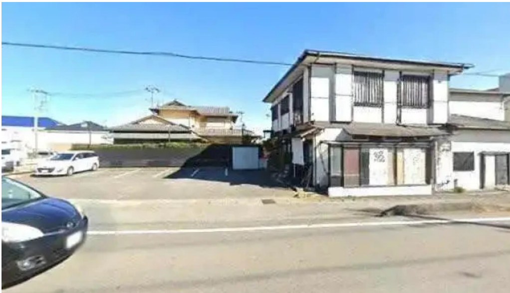
炭火焼肉enよしの本店 御殿場市