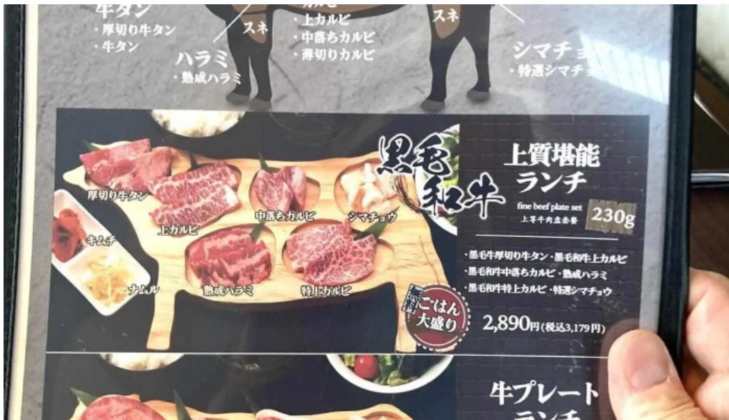
炭火焼肉enよしの本店 メニュー