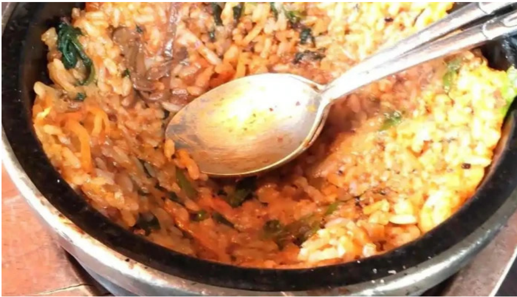
炭火焼肉enよしの本店 キムチポックムパプ