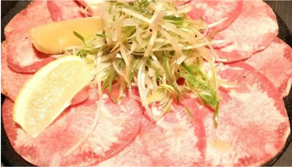
炭火焼肉enよしの本店 牛タン