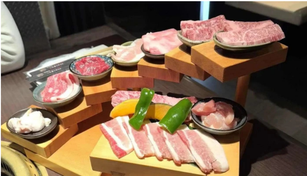
炭火焼肉enよしの本店 シャルキュトリー