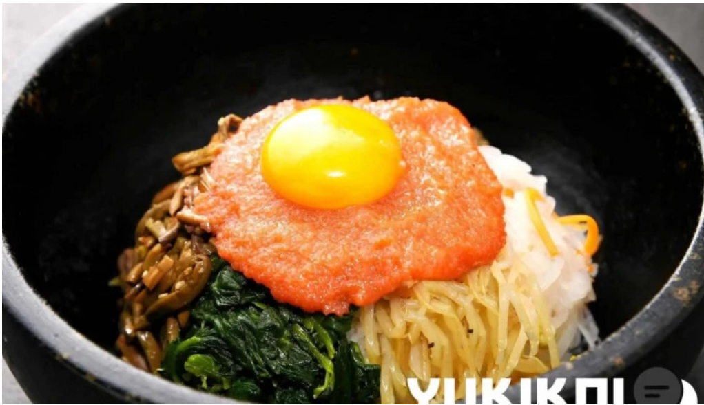
炭火焼肉enよしの本店 ビビンバ