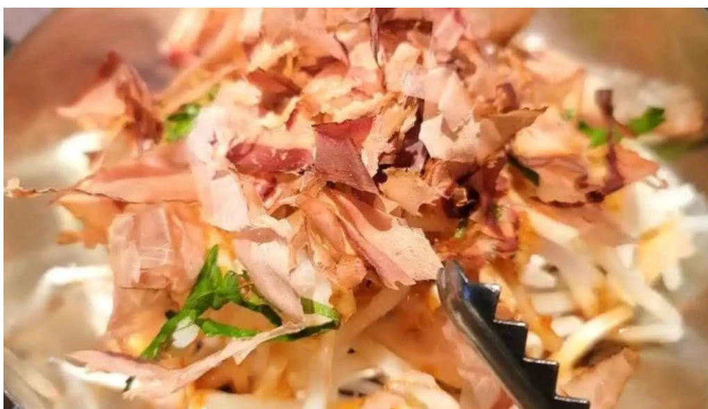
炭火焼肉enよしの本店 たこ焼き