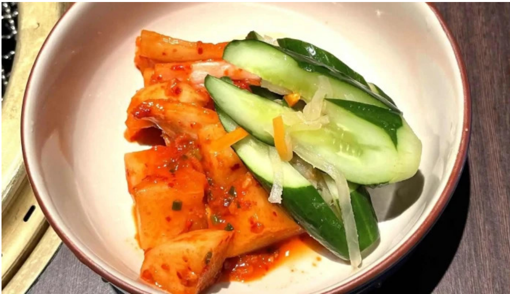
炭火焼肉enよしの本店 キムチ