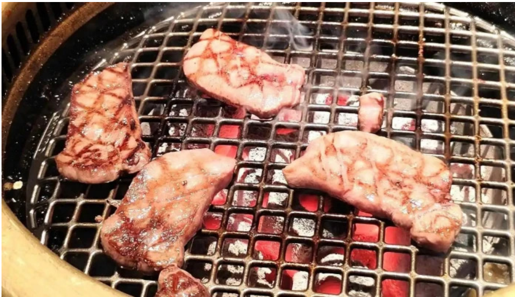
炭火焼肉enよしの本店 最新