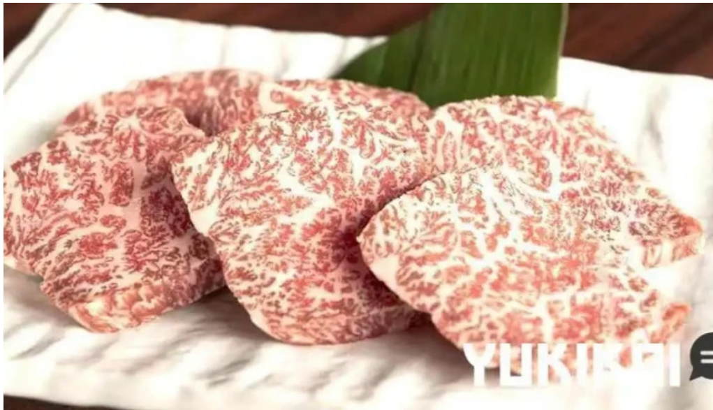
炭火焼肉 おおむら 料理飲み物