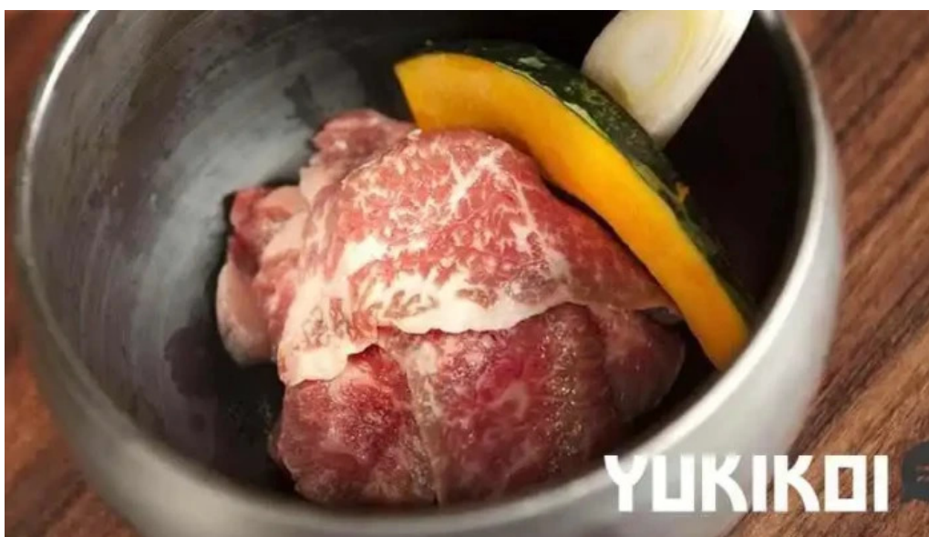
炭火烧肉 おおむら