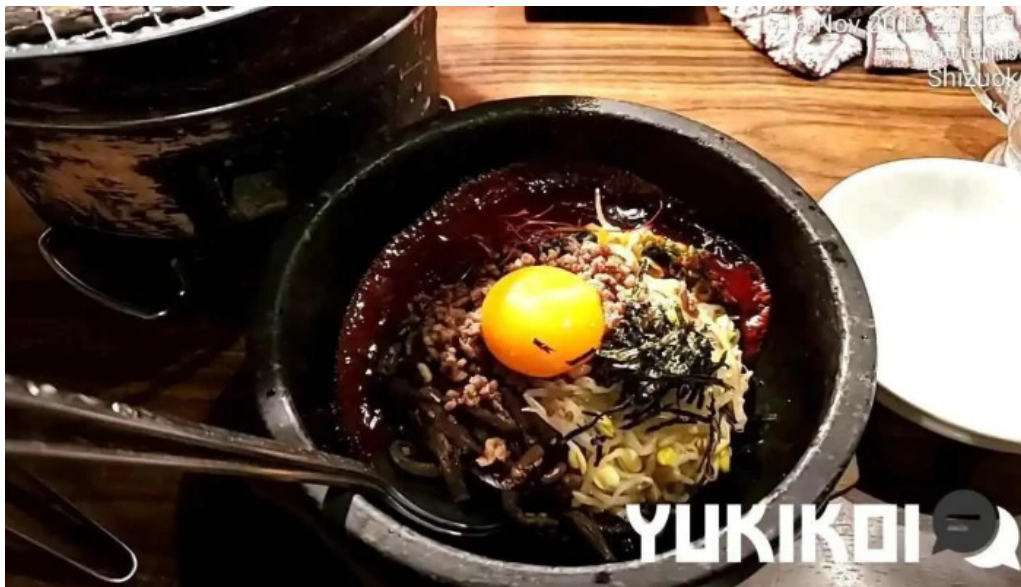
炭火焼肉 おおむら 動画