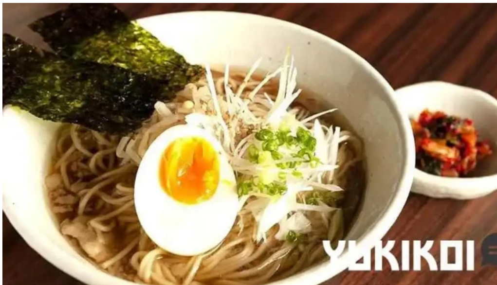
炭火焼肉 おおむら ラーメン