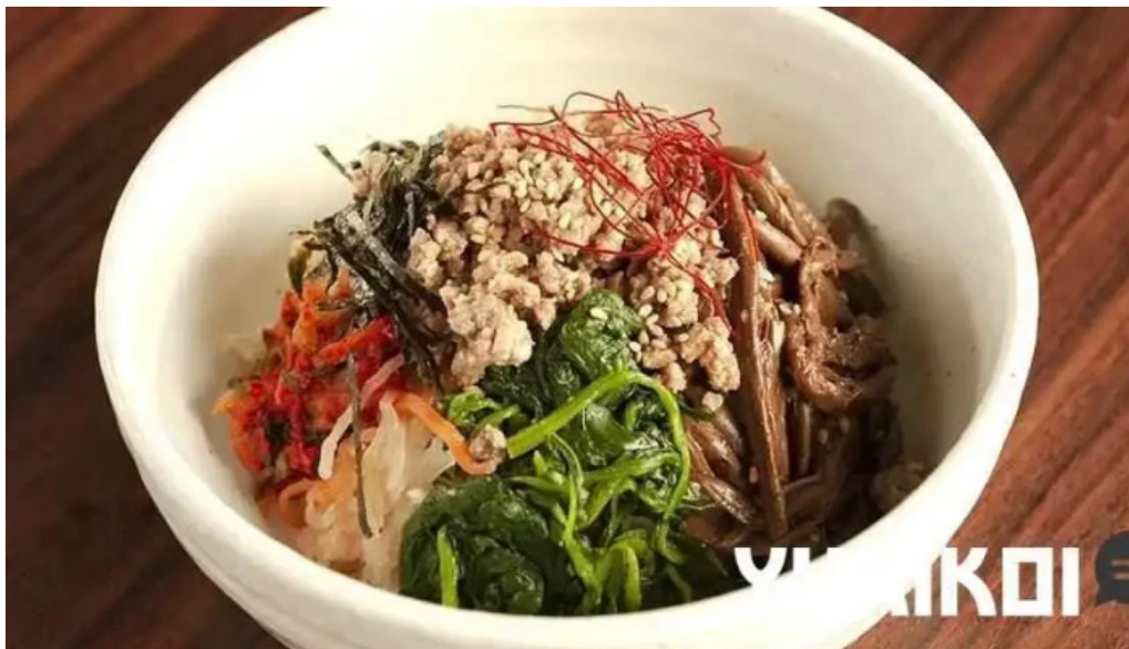
炭火烧肉 おおむら ビビンバ