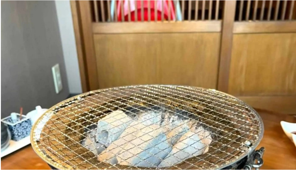
炭火焼肉 おおむら 近く