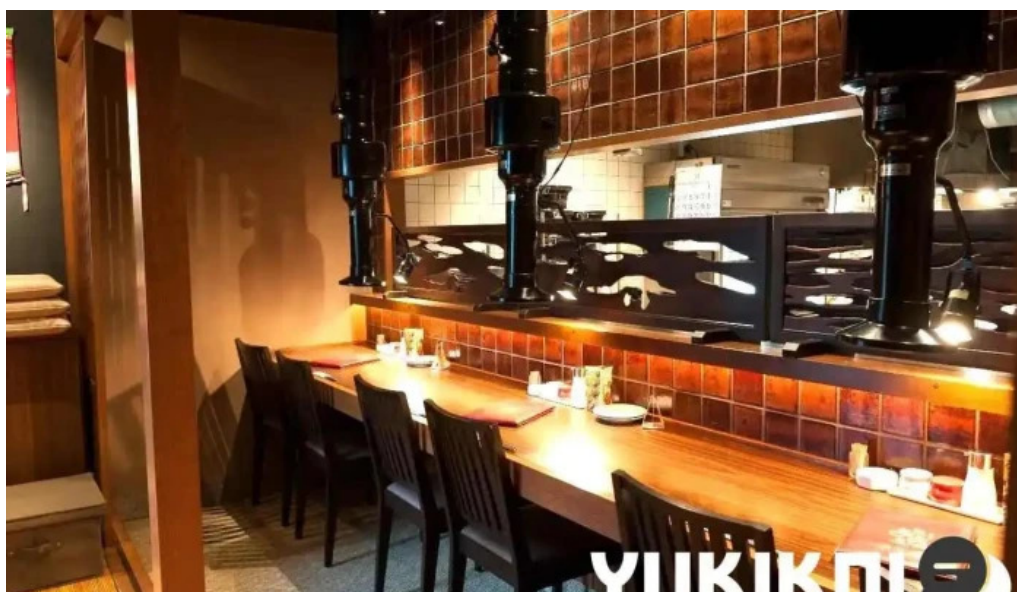
炭火焼肉 おおむら 雰囲気