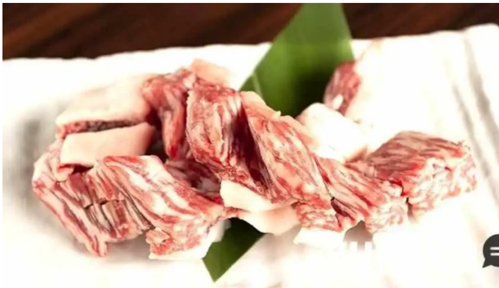
炭火焼肉 おおむら 和牛