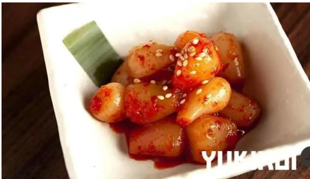
炭火烧肉 おおむら カクトウギ