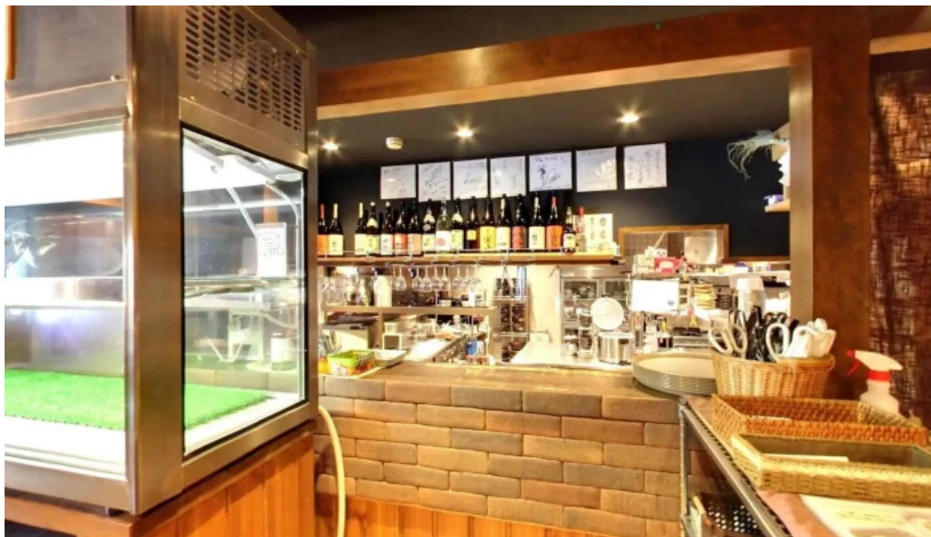
炭火焼肉 おおむら 御殿場市