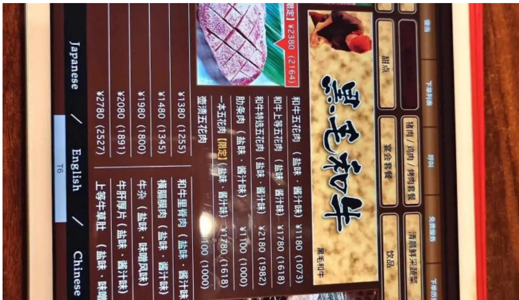
炭火烧肉 おおむら メニュー