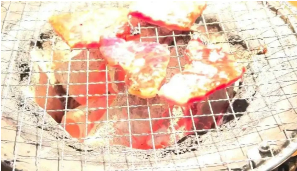
炭火焼肉 おおむら 最新