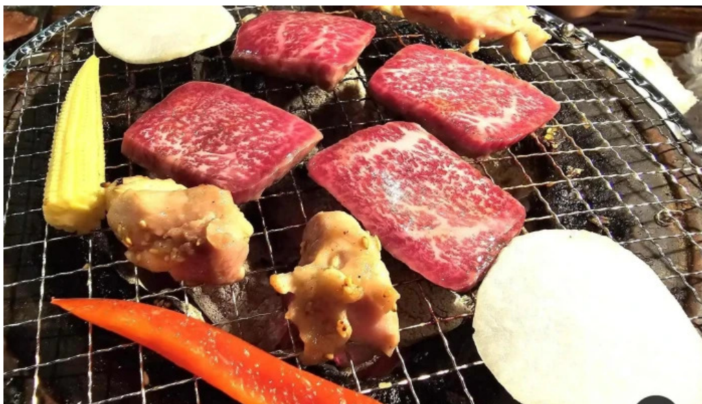
炭火焼肉 おおむら バーベキュー