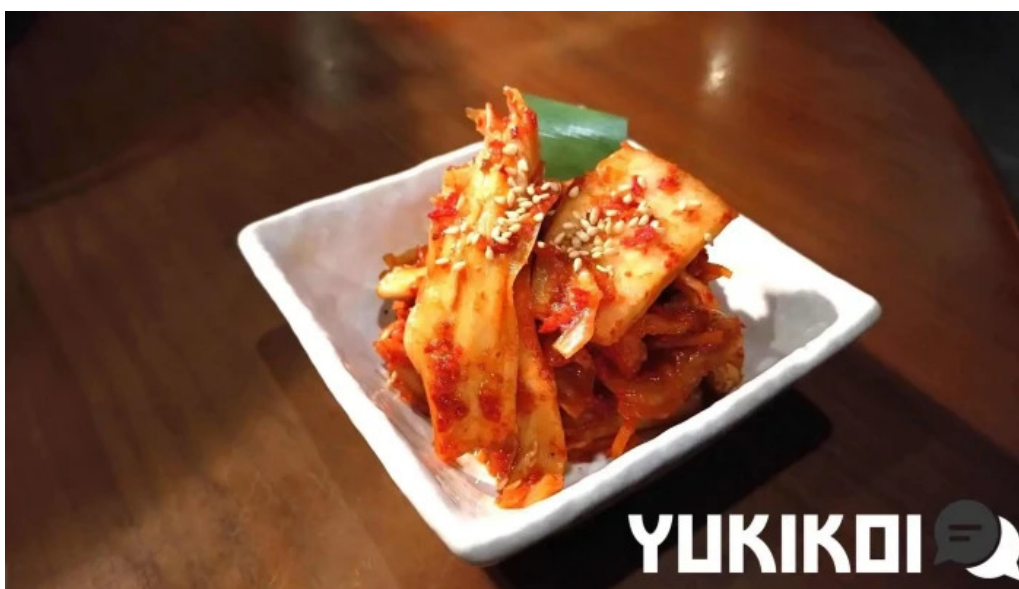
炭火焼肉 おおむら キムチ