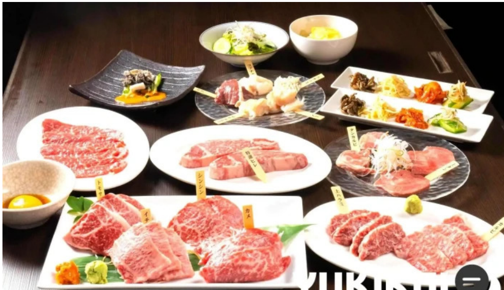
富士山溶岩焼肉 あぶり 料理飲み物