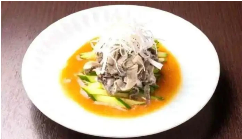
富士山溶岩焼肉 あぶり 動画