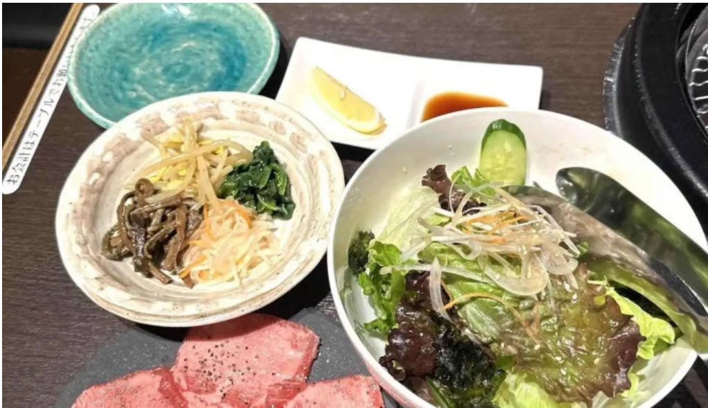
富士山溶岩焼肉 あぶり 最新