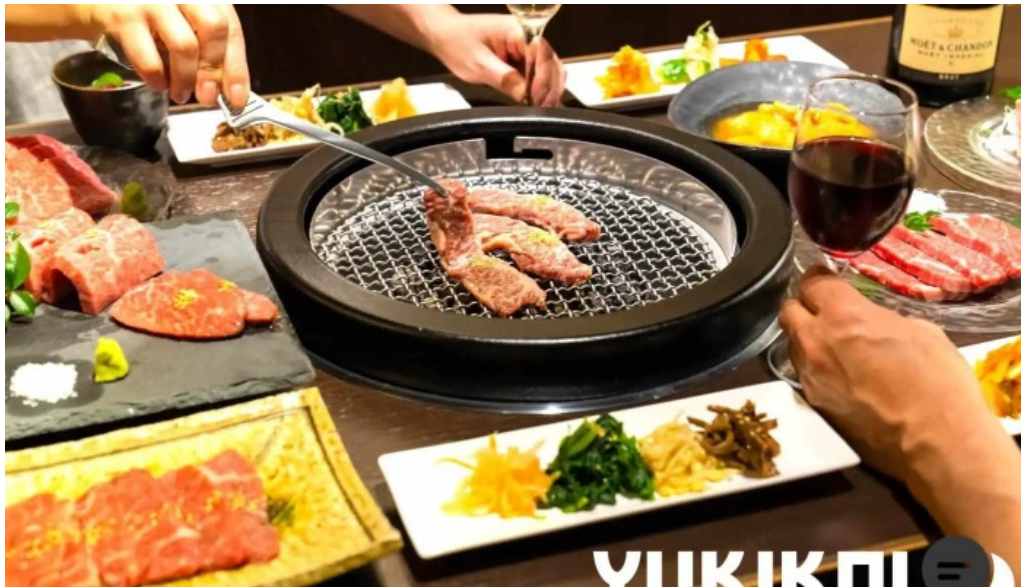
富士山溶岩焼肉 あぶり バーベキュー