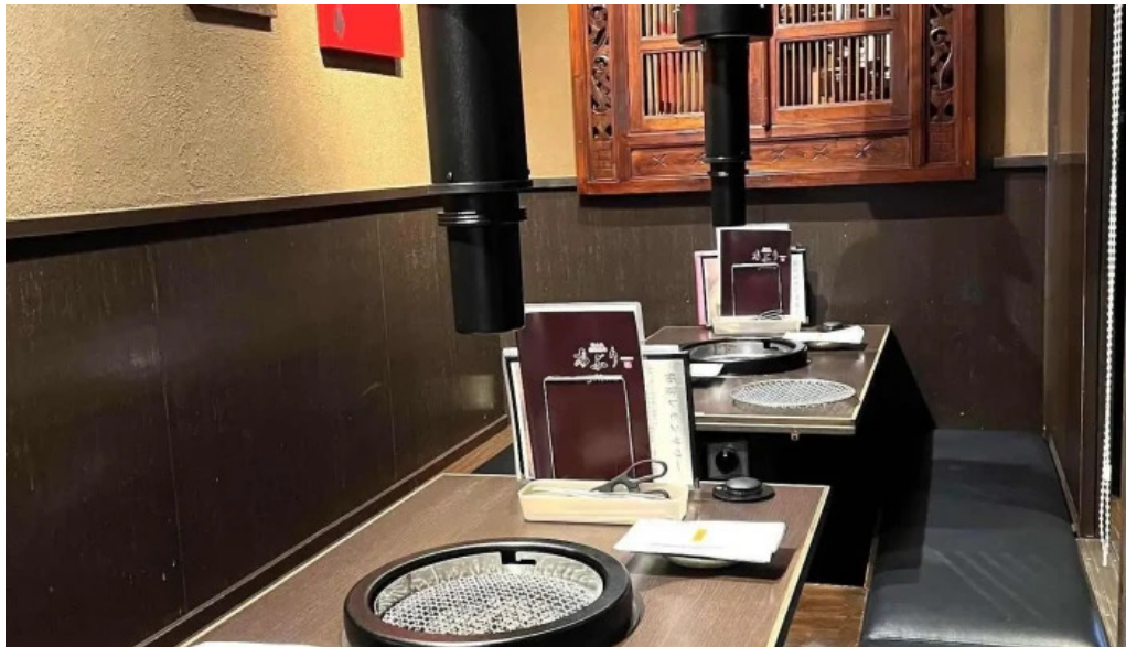
富士山溶岩焼肉 あぶり 雰囲気