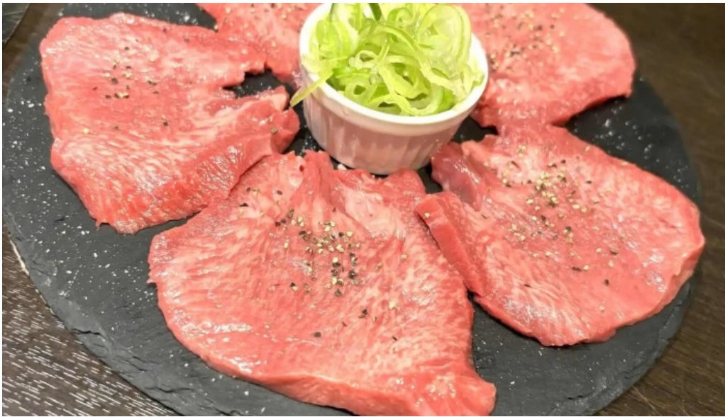
富士山溶岩焼肉 あぶり 牛タン