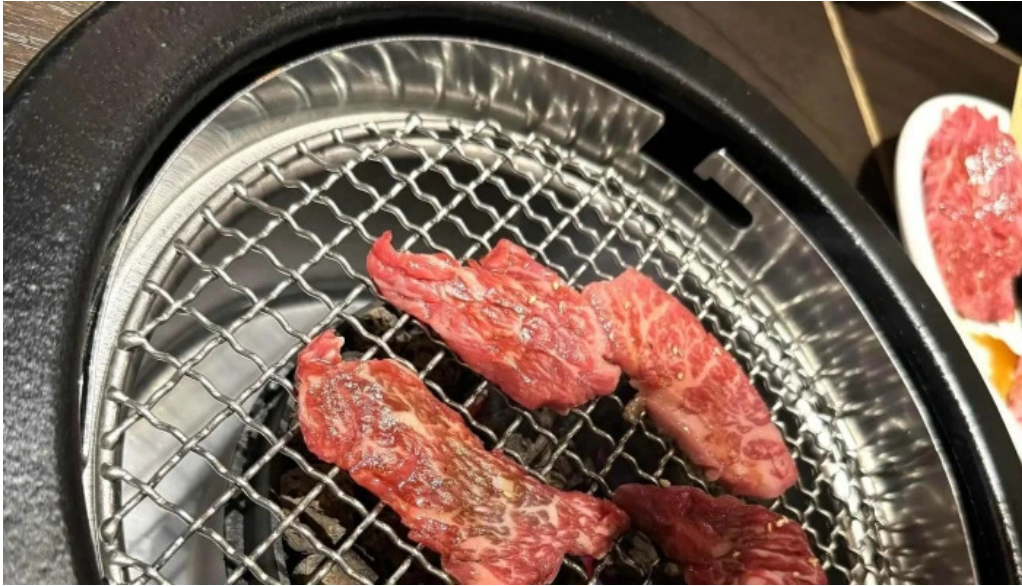
富士山溶岩焼肉 あぶり 営業時間