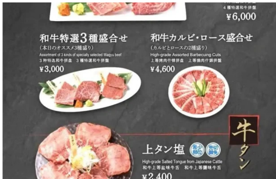
富士山溶岩焼肉 あぶりメニュー