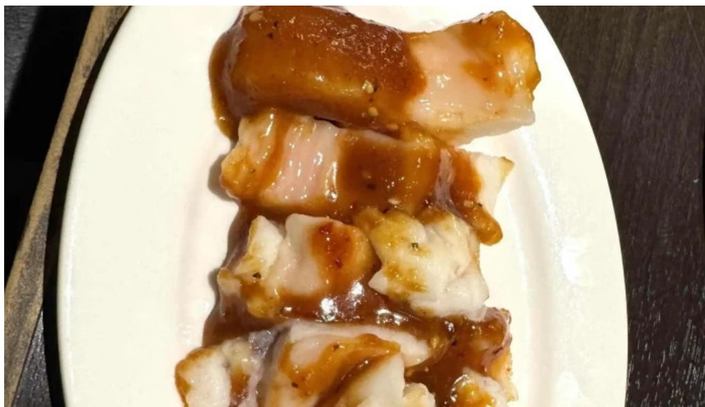
富士山溶岩焼肉 あぶり 電話