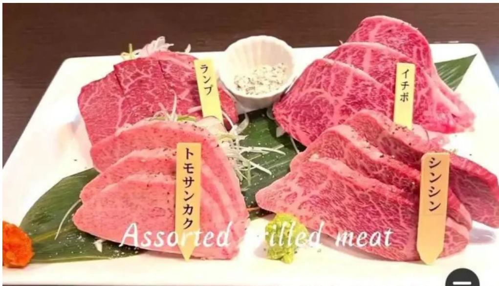
富士山溶岩焼肉 あぶり