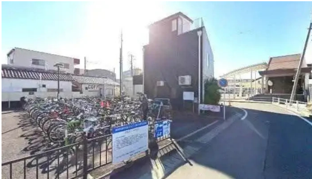
富士山溶岩焼肉 あぶり 御殿場市