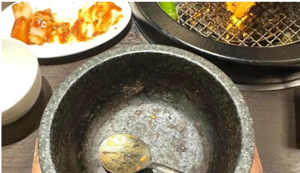
富士山溶岩焼肉 あぶり 所在地