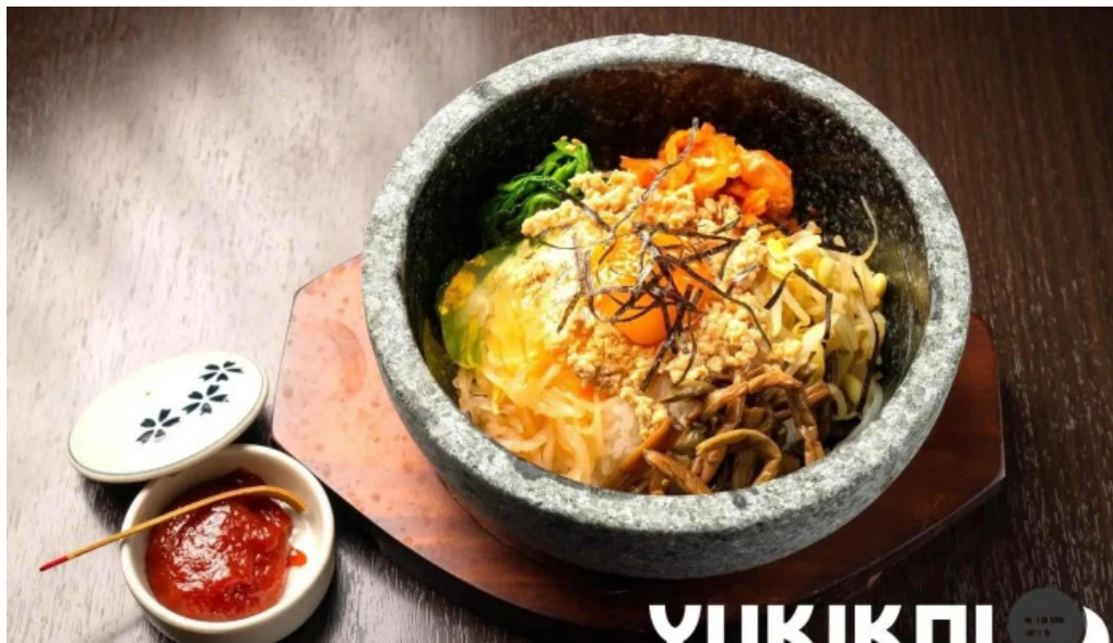
富士山溶岩焼肉 あぶり ビビンバ