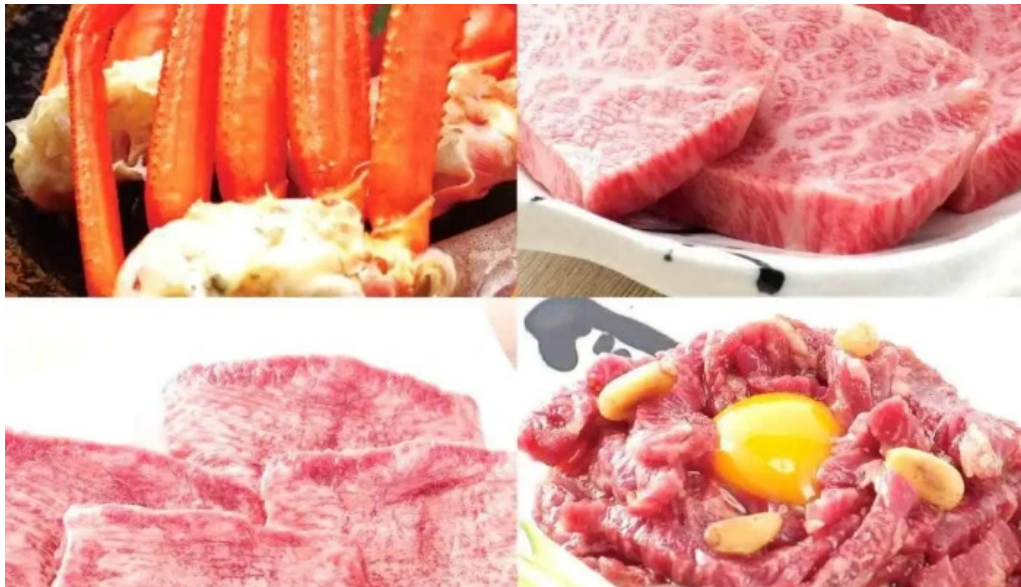
カルビー一丁 御殿場店 牛肉