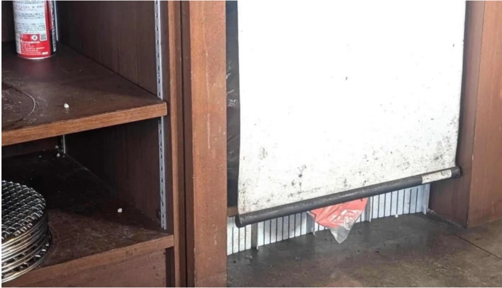
カルビー丁 御殿場店 営業中