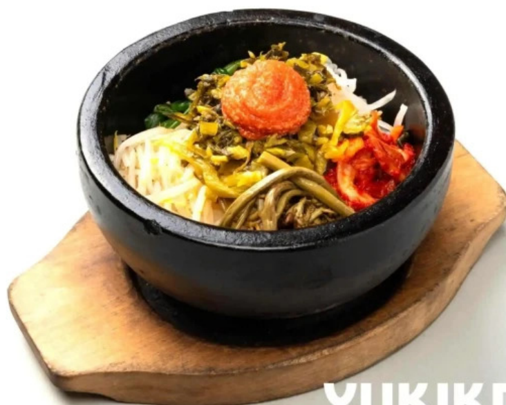
カルビー丁 御殿場店 料理飲み物