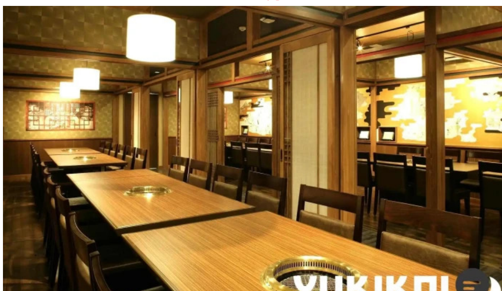
カルビー丁 御殿場店 雰囲気