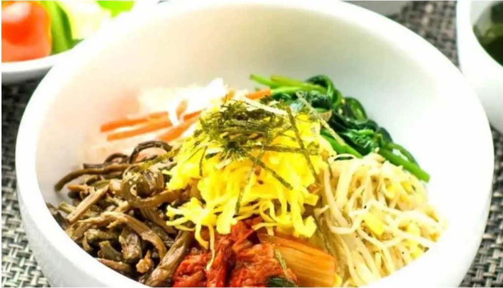
カルビー丁 御殿場店 ビビンバ