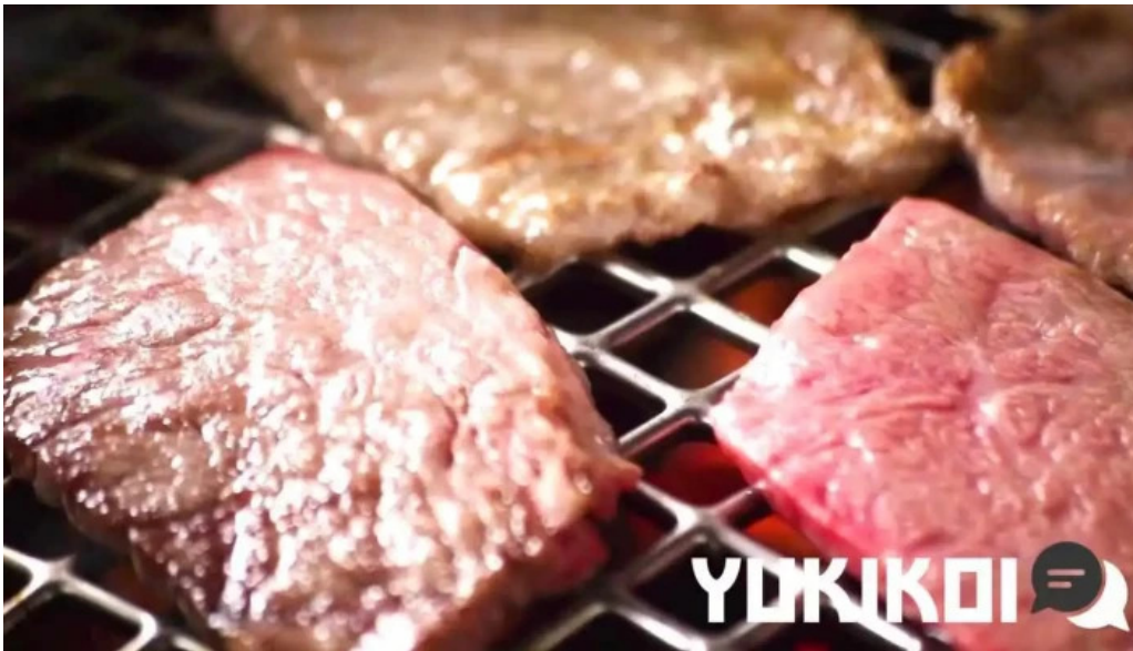
カルビー丁 御殿場店 バーベキュー