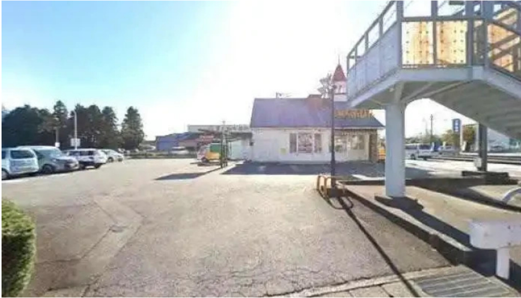
カルビー丁 御殿場店 御殿場市