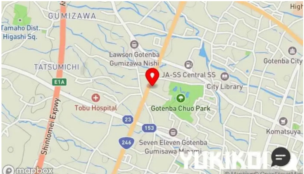
カルビー丁 御殿場店 地図