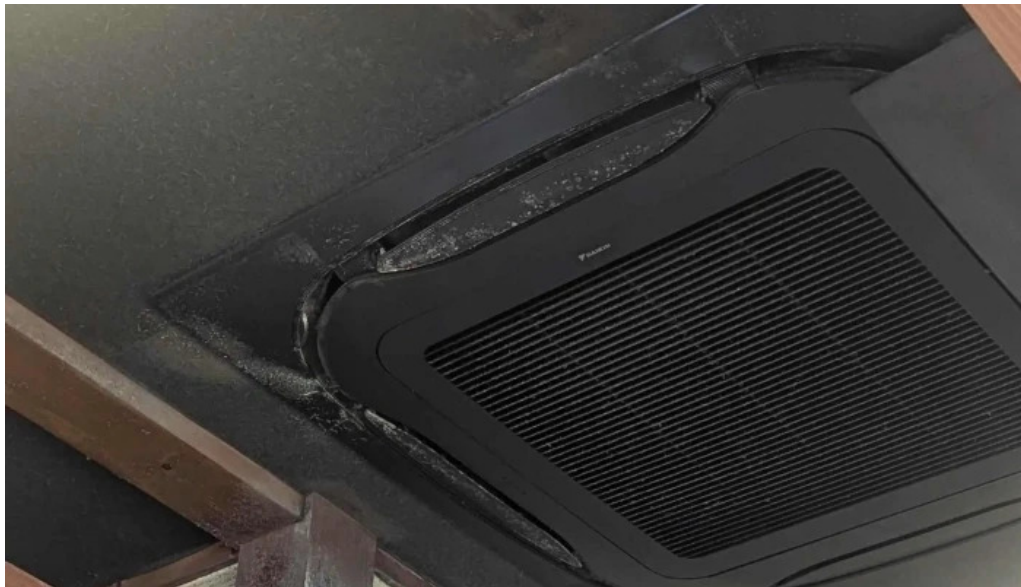
カルビー丁 御殿場店 写真