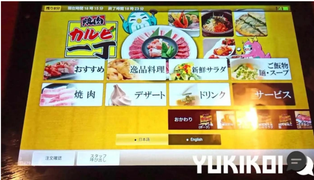
カルビー丁 御殿場店 動画