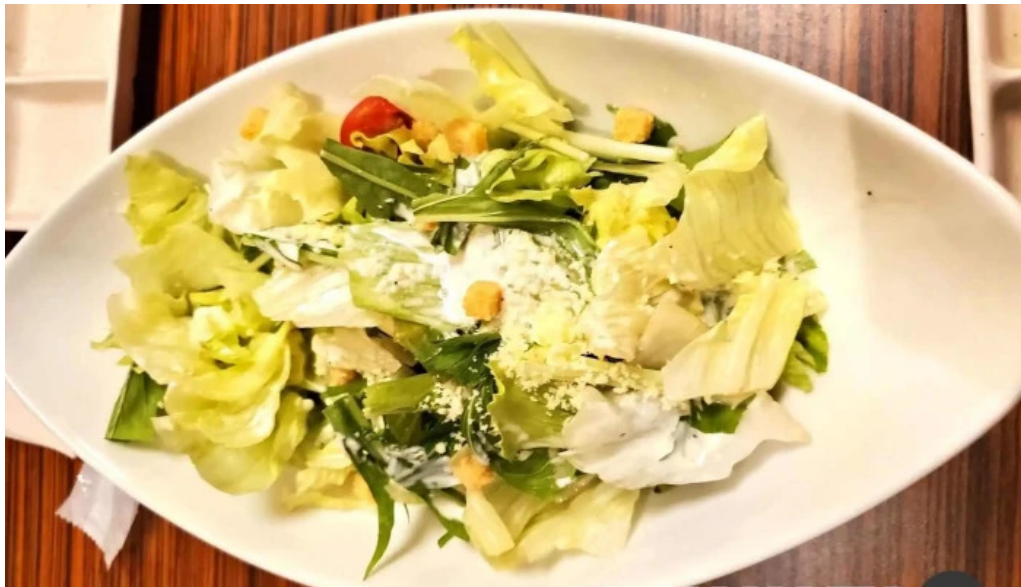
カルビー一丁 御殿場店 サラダ