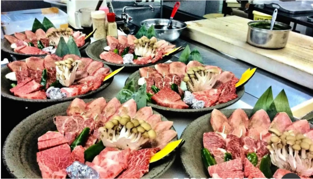
焼肉の船一 料理飲み物