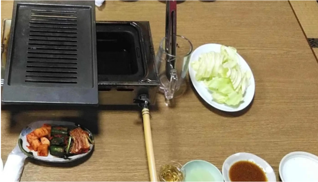
焼肉の船一 行き方