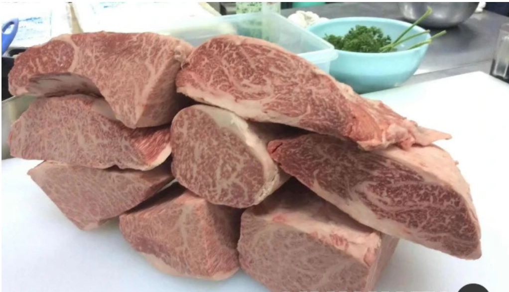
焼肉の船ー オーナー提供