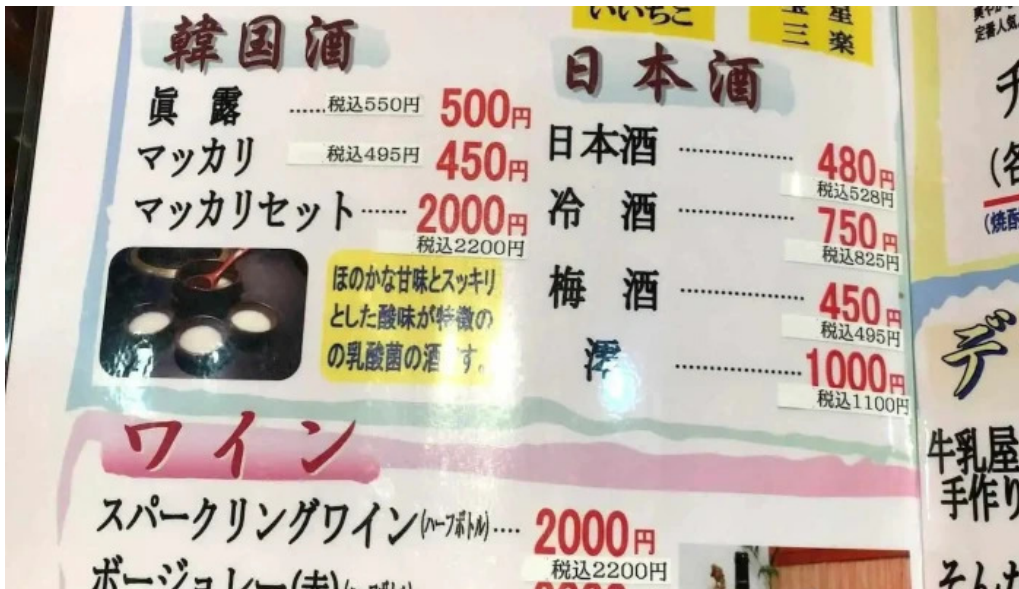
焼肉の船一 メニュー