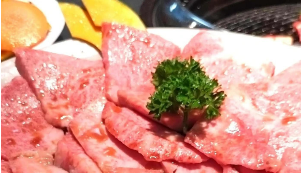
焼肉の船ー プロモーション