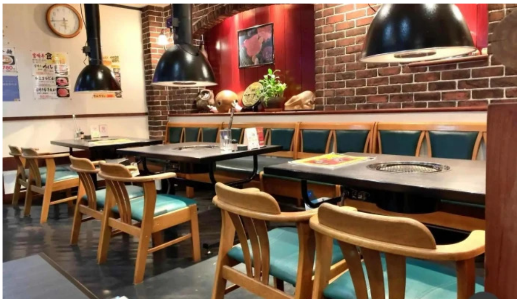
焼肉の船一 雰囲気