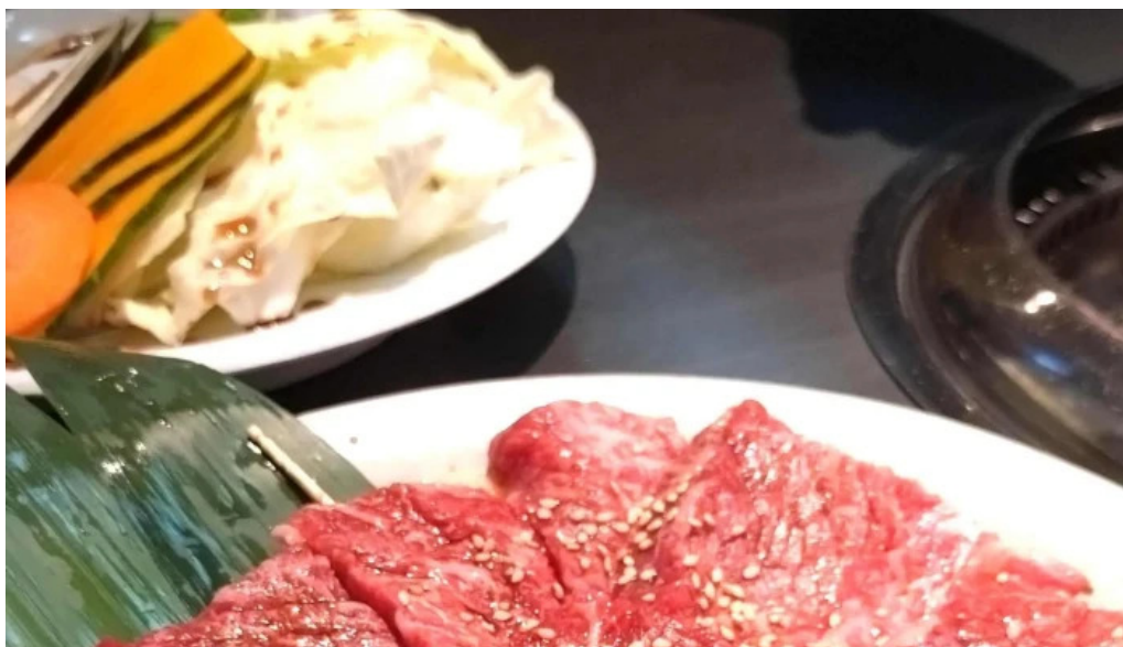
焼肉の船ーウェブサイト