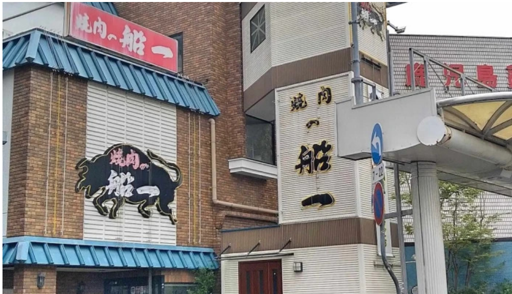
焼肉の船一 営業時間