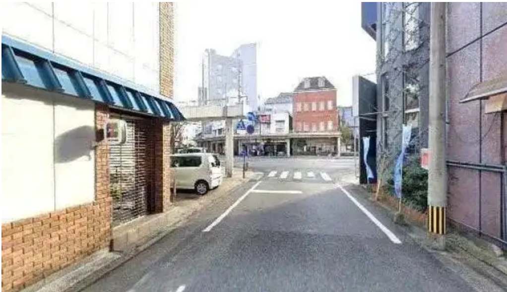
焼肉の船一 延岡市