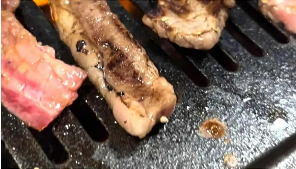
焼肉の船一 口コミ