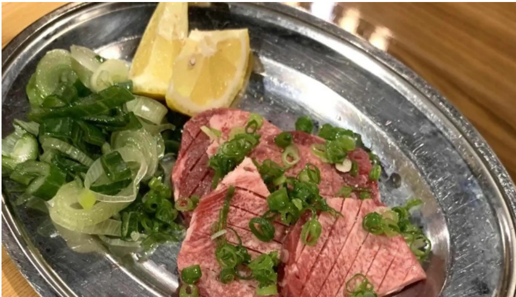
七輪焼 炭壺 写真