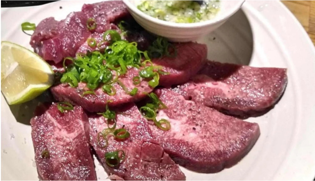
七輪焼 炭吉 番号