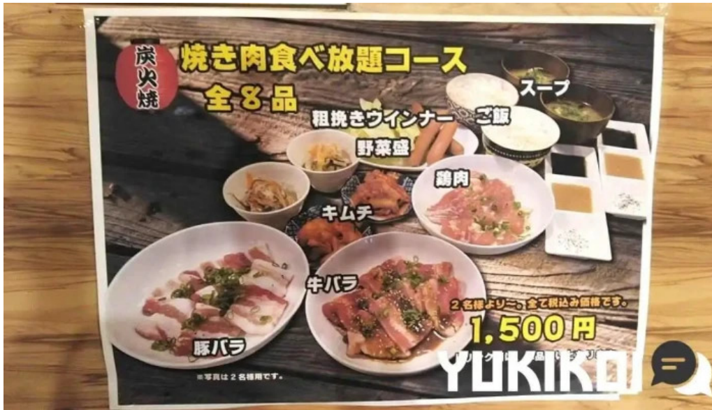
七輪焼 炭舎 メニュー