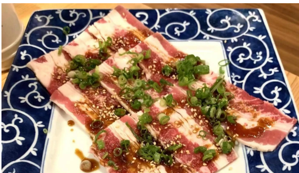
七輪焼 炭壺 エリア