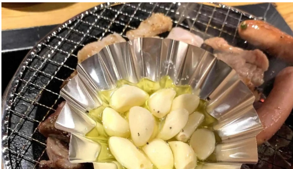
七輪焼 炭壺 コメント