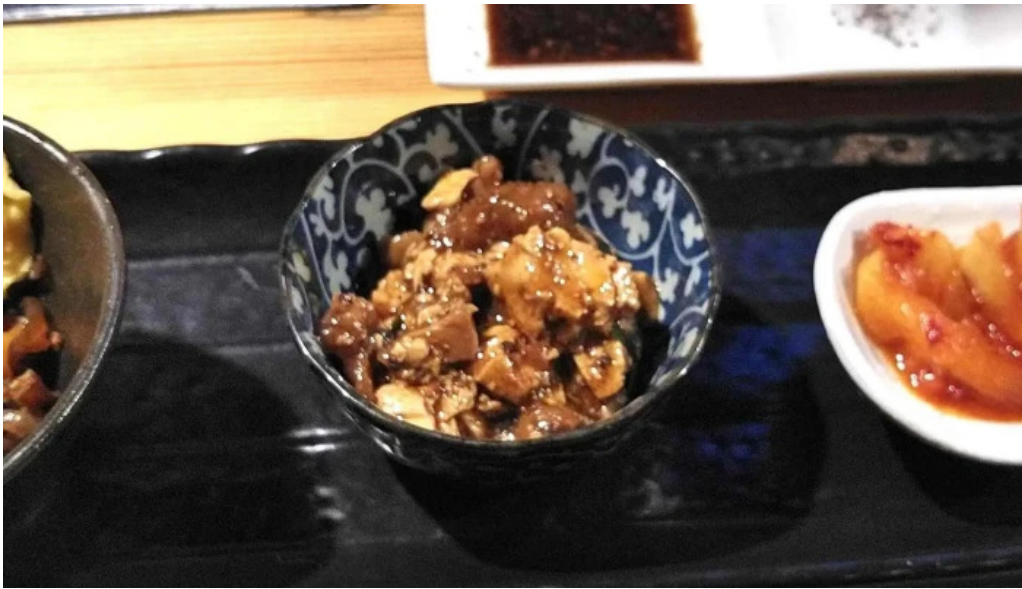
七輪焼 炭壺 所在地