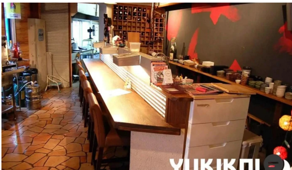
七輪焼 炭吉 雰囲気