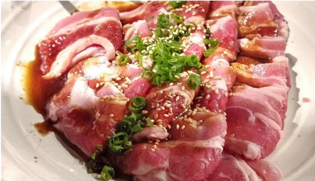
七輪焼 炭舎 プロモーション