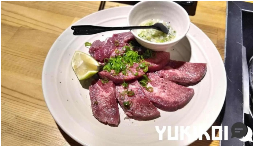
七輪焼 炭吉 料理飲み物