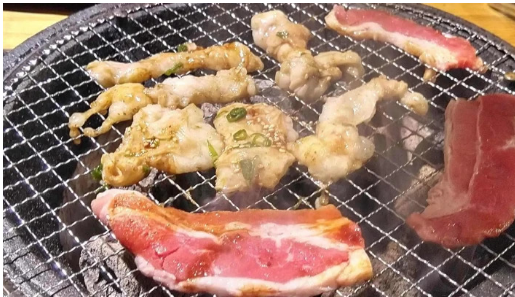
七輪焼 炭舎 口コミ