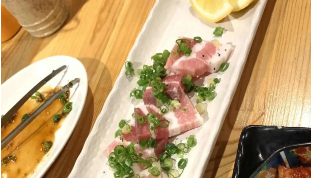
七輪焼 炭壺 動画