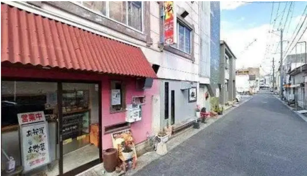
七輪焼 炭壺 延岡市