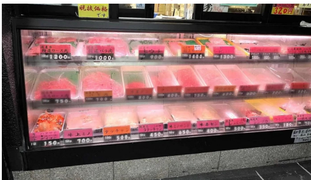
薩摩の牛太 寝屋川店 雰囲気