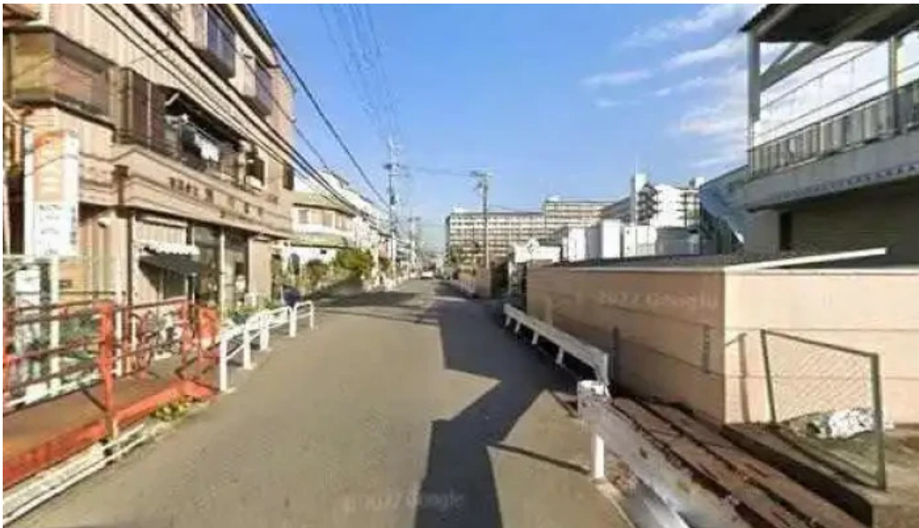
薩摩の牛太 寝屋川店 寝屋川市