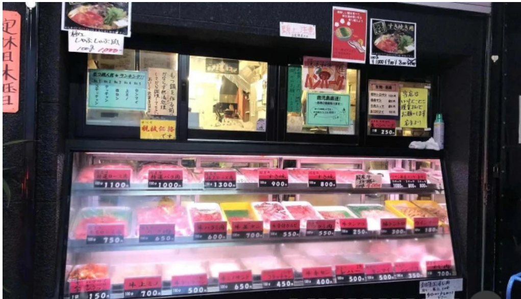
薩摩の牛太 寝屋川店 メニュー