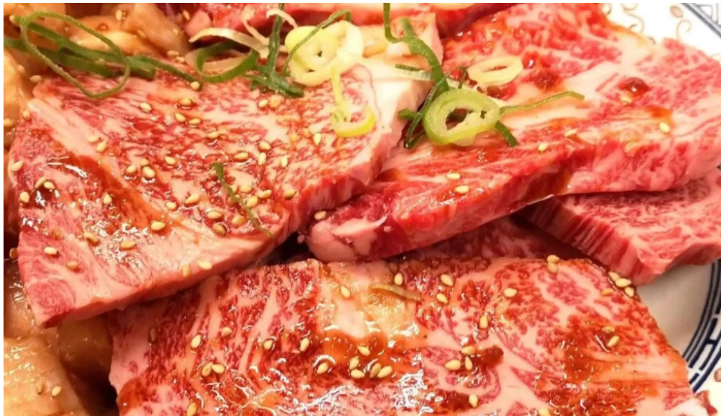
薩摩の牛太 寝屋川店 プロモーション