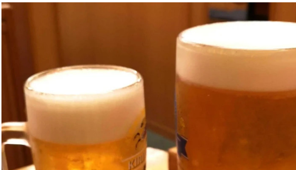
薩摩の牛太 寝屋川店 ウェブサイト