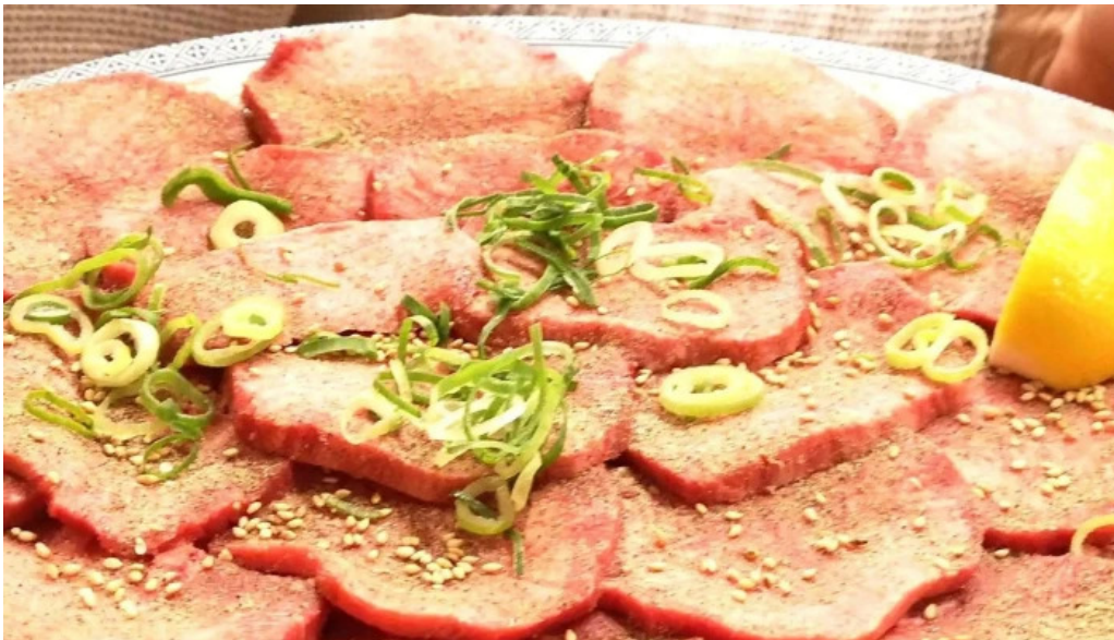
薩摩の牛太 寝屋川店 動画