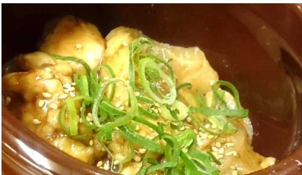
薩摩の牛太 寝屋川店 どこ