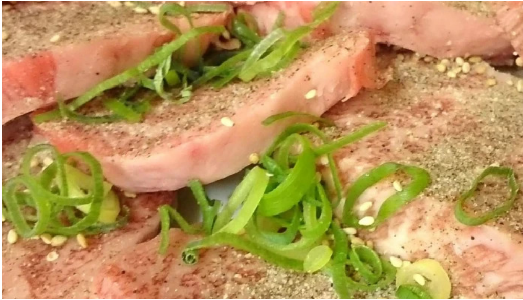
薩摩の牛太 寝屋川店 営業時間