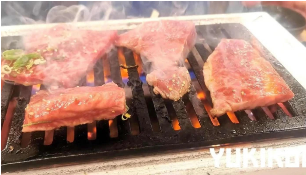
薩摩の牛太 寝屋川店 バーベキュー