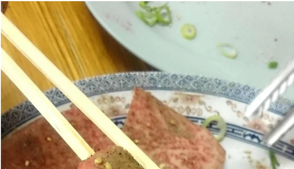
薩摩の牛太 寝屋川店 コメント