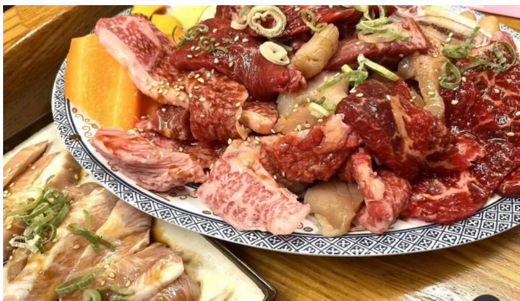
薩摩の牛太 寝屋川店 料理飲み物