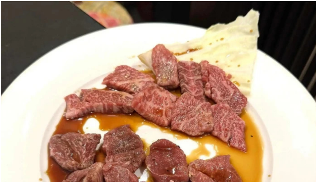
伊勢屋 ウェブサイト