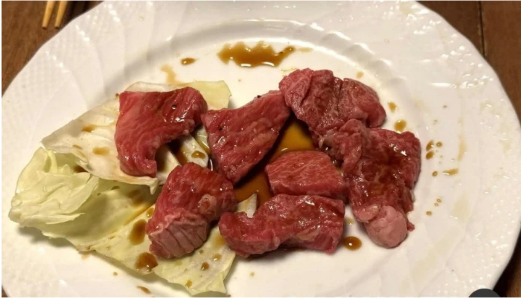
伊勢屋 料理飲み物