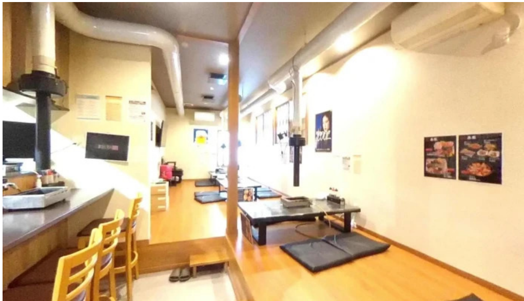
網焼きホルモン暴豚 南陽市