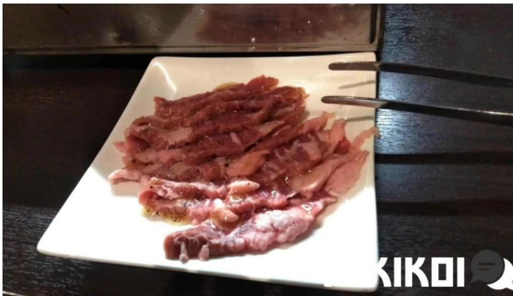
網焼きホルモン暴豚 料理飲み物