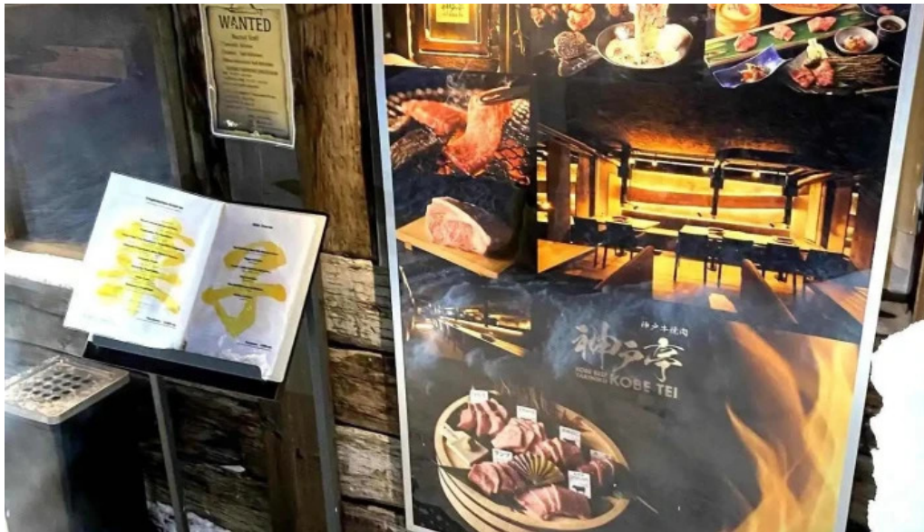
神戸牛焼肉 神戸亭 kobebeef yakiniku kobetei 雰囲気