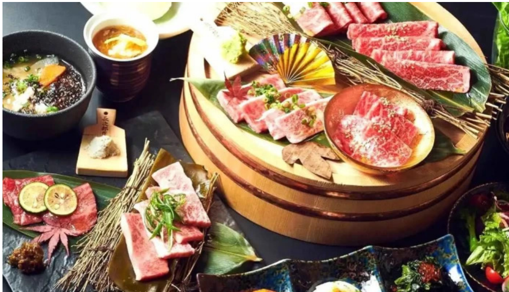
神戸牛焼肉 神戸亭 kobebeef yakiniku kobetei 料理飲み物