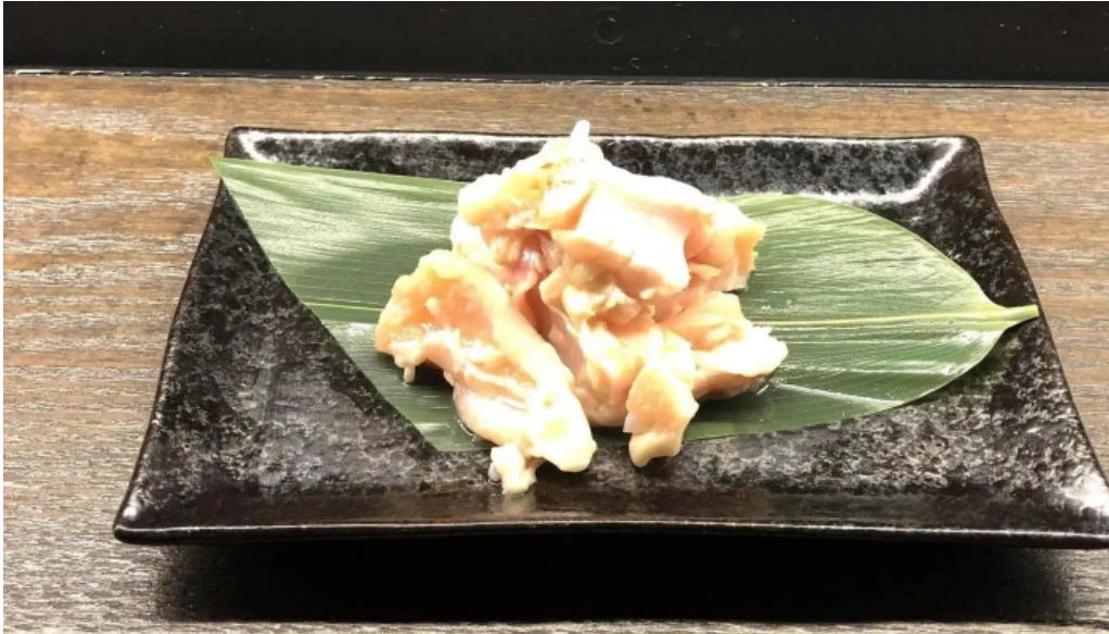
神戸牛焼肉 神戸亭 kobebeef yakiniku kobetei 動画