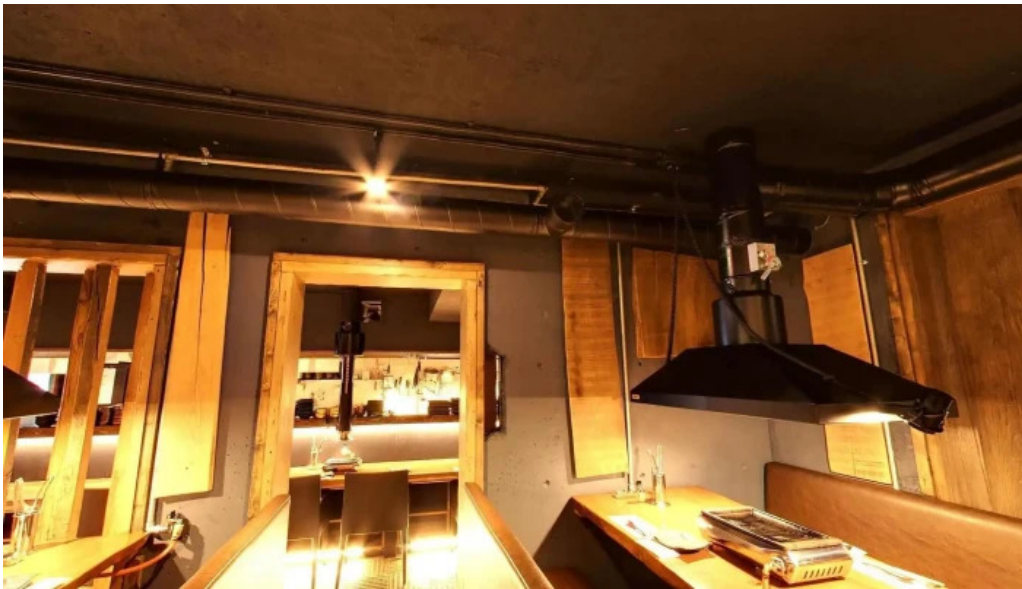
神戸牛焼肉 神戸亭 kobebeef yakiniku kobetei 倶知安町