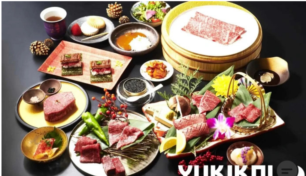
神戸牛焼肉 神戸亭 kobebeef yakiniku kobetei