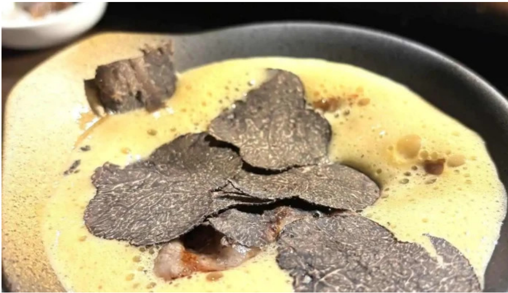
神戸牛焼肉 神戸亭 kobebeef yakiniku kobetei トリュフ