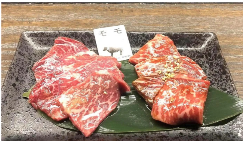
神戸牛焼肉 神戸亭 kobebeef yakiniku kobetei 電話