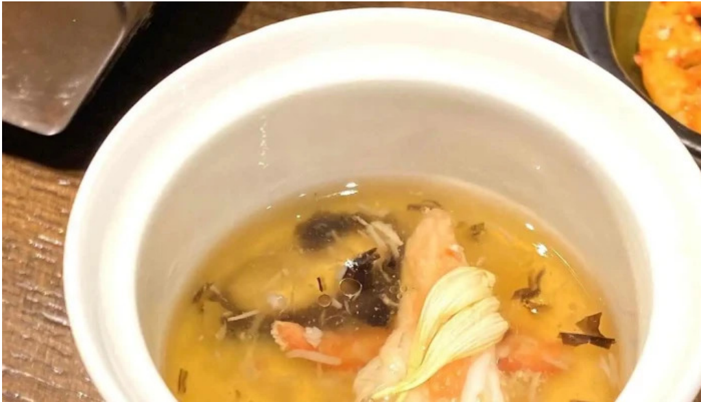
神戸牛焼肉 神戸亭 kobebeef yakiniku kobetei 味噌汁