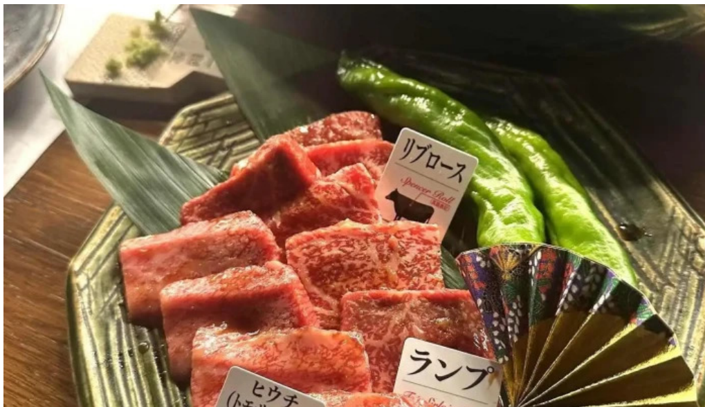
神戸牛焼肉 神戸亭 kobebeef yakiniku kobetei 最新