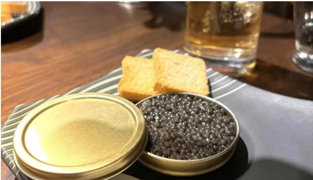
神戸牛焼肉 神戸亭 kobebeef yakiniku kobetei キャビア