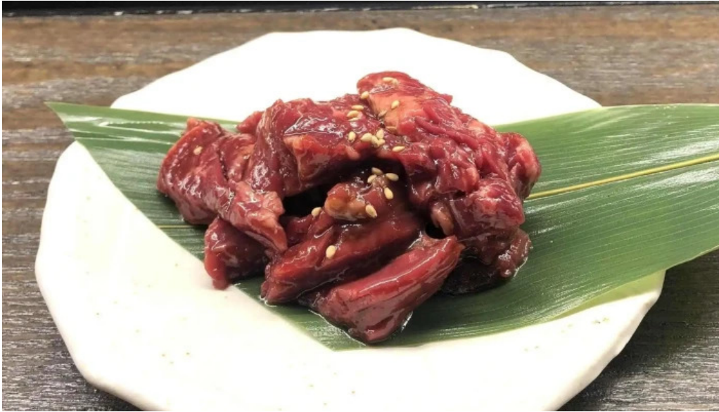
神戸牛焼肉 神戸亭 kobebeef yakiniku kobetei 営業時間