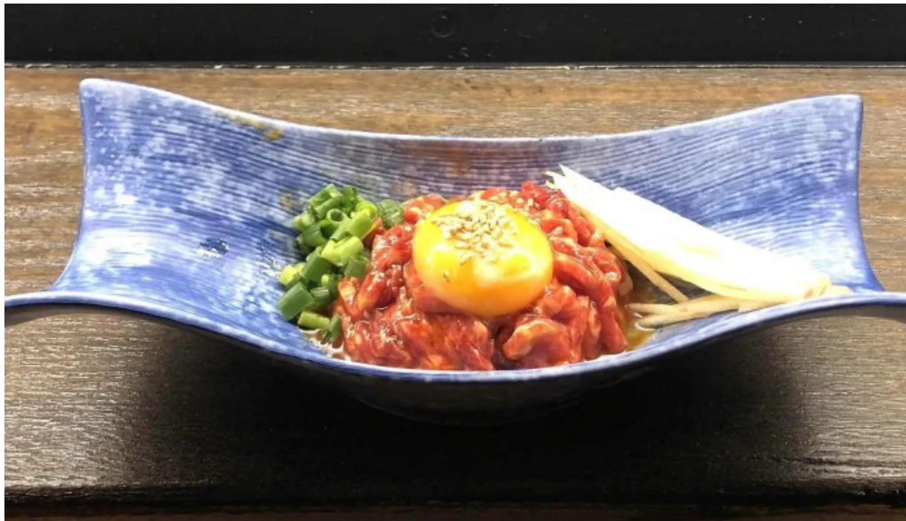
神戸牛焼肉 神戸亭 kobebeef yakiniku kobetei 住所