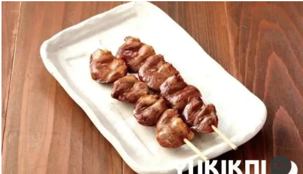
鳥貴族 長岡天神店 オーナー提供