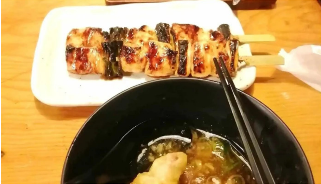
鳥貴族 長岡天神店 焼き鳥