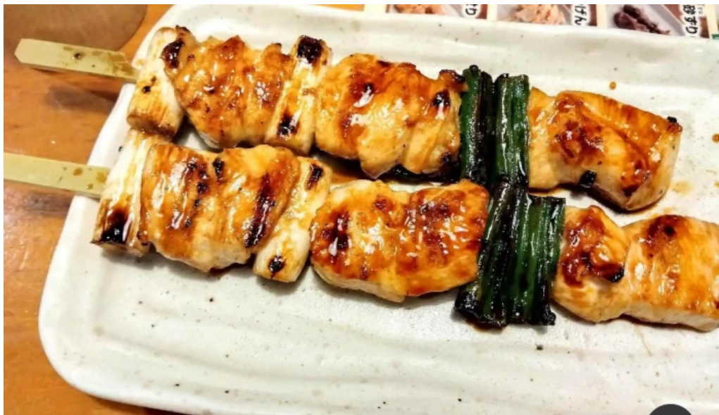
鳥貴族 長岡天神店 サテ