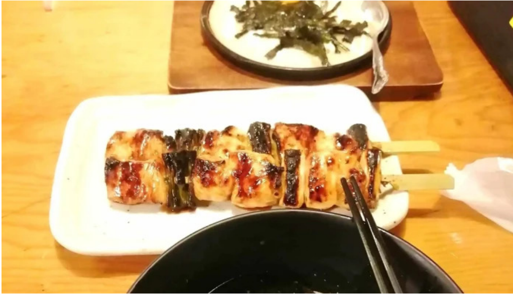
鳥貴族 長岡天神店 動画