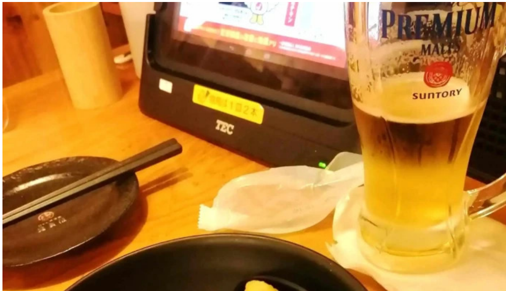
鳥貴族 長岡天神店 コメント