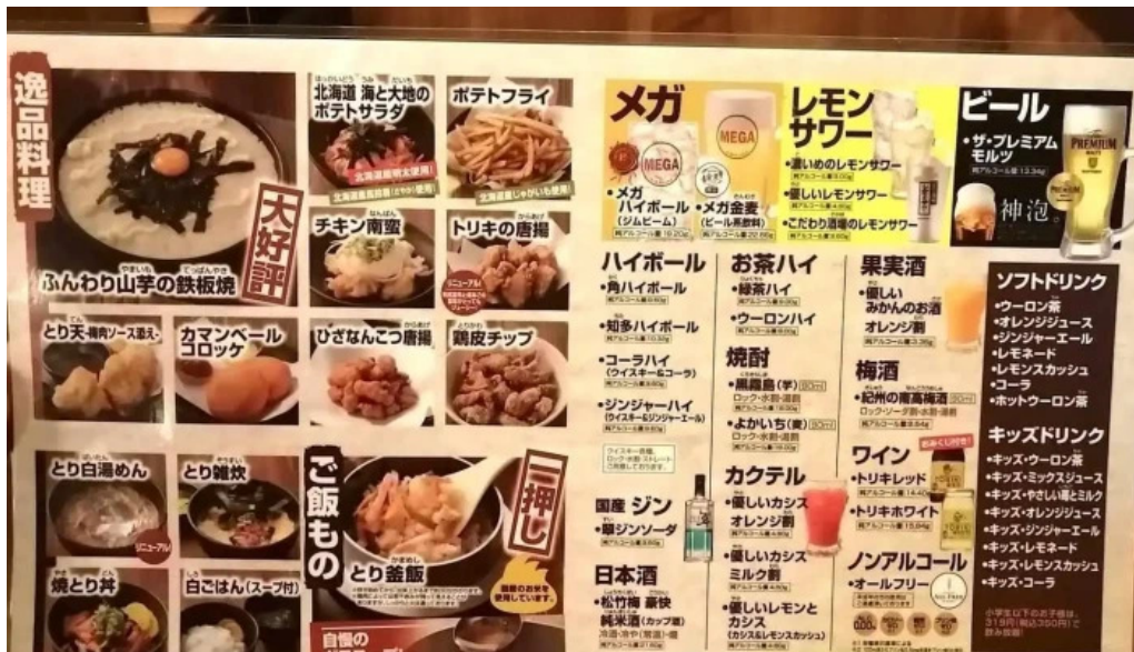
鳥貴族 長岡天神店 メニュー