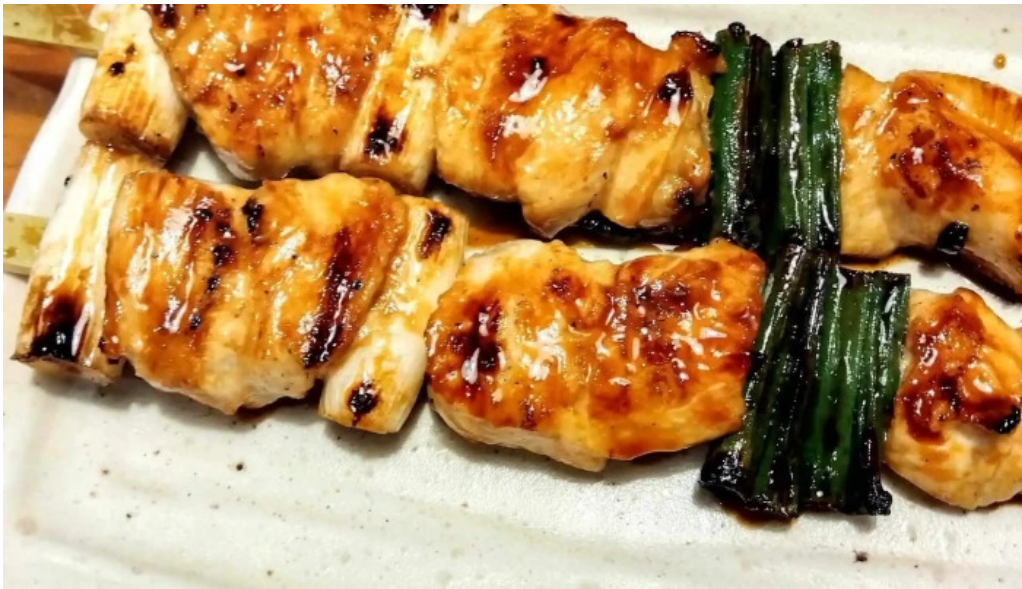
鳥貴族 長岡天神店 住所