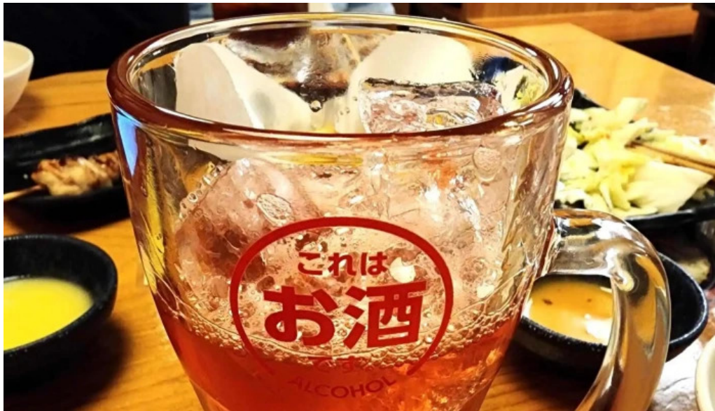
鳥貴族 長岡天神店 営業中