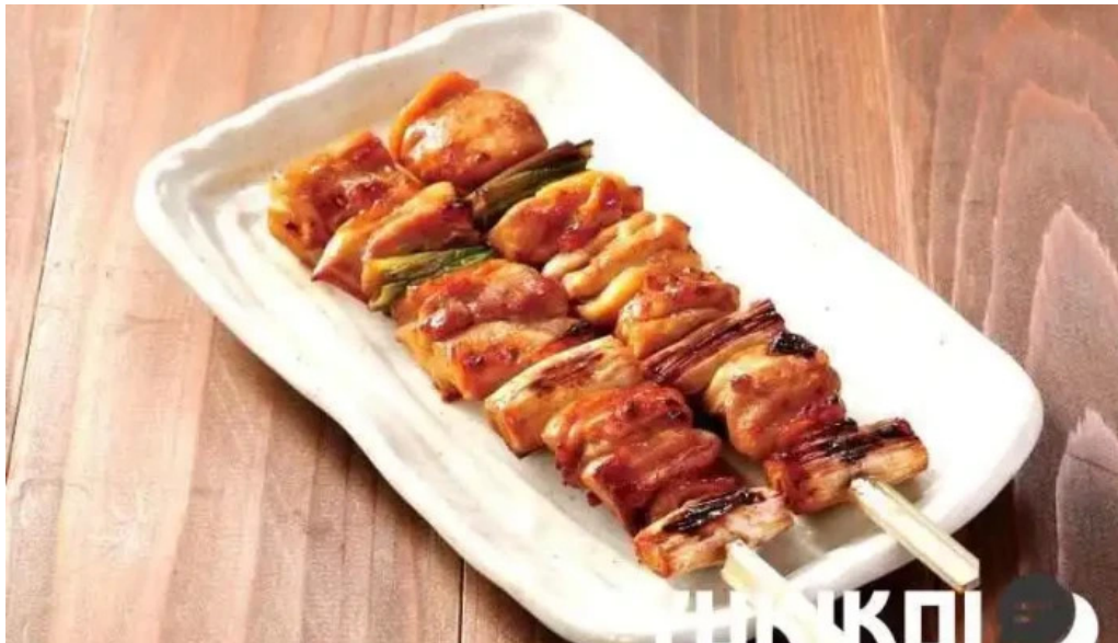
鳥貴族 長岡天神店 料理飲み物