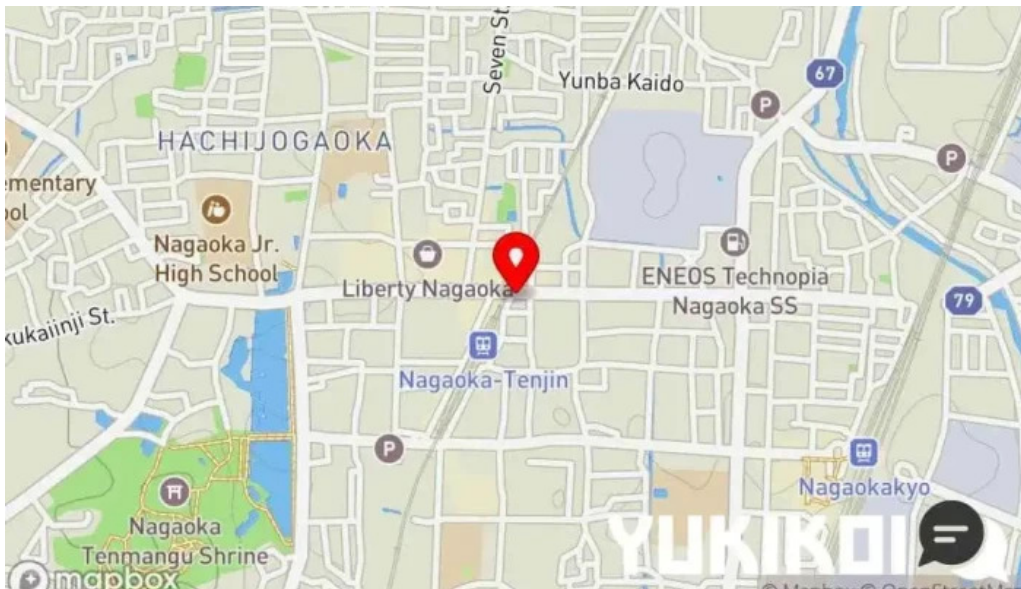
鳥貴族 長岡天神店 地図