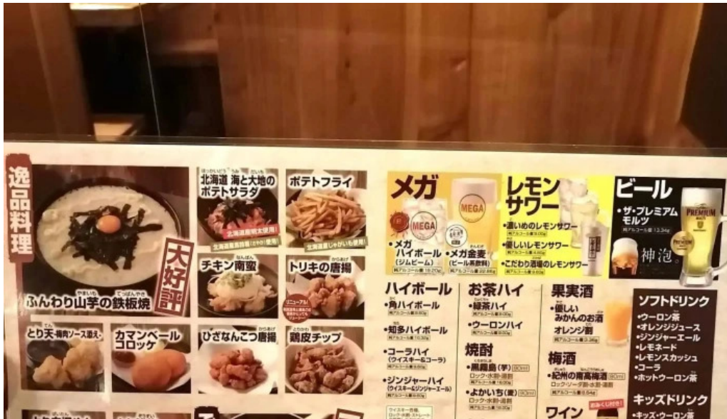
鳥貴族 長岡天神店 ウェブサイト