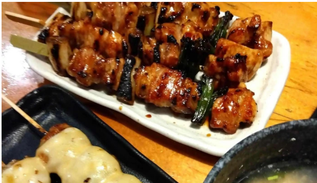
鳥貴族 長岡天神店 口コミ