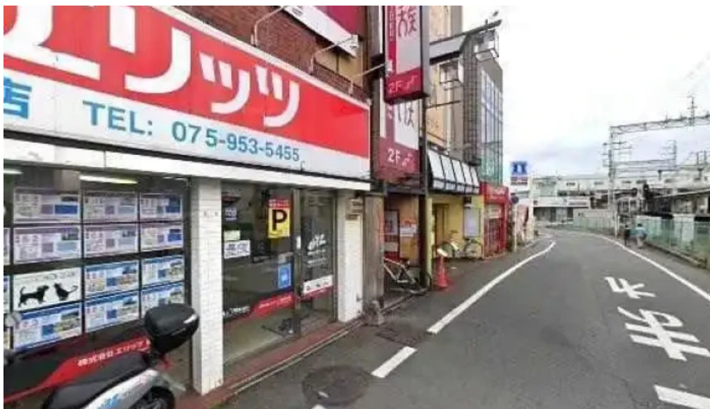
鳥貴族 長岡天神店 長岡京市