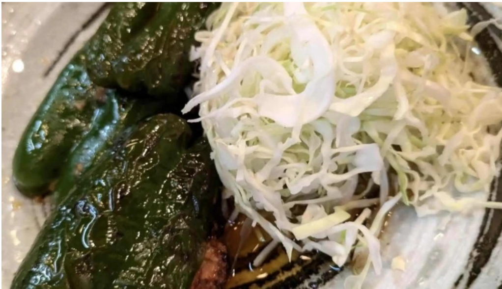
かじ庵 ウェブサイト