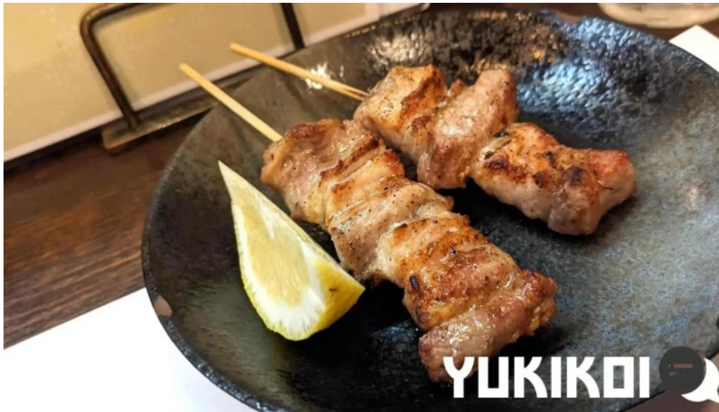
かじ庵 料理飲み物