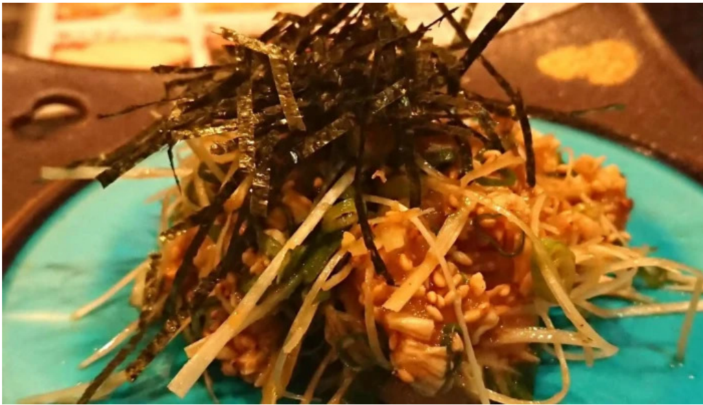
Niao hiro comentario 4