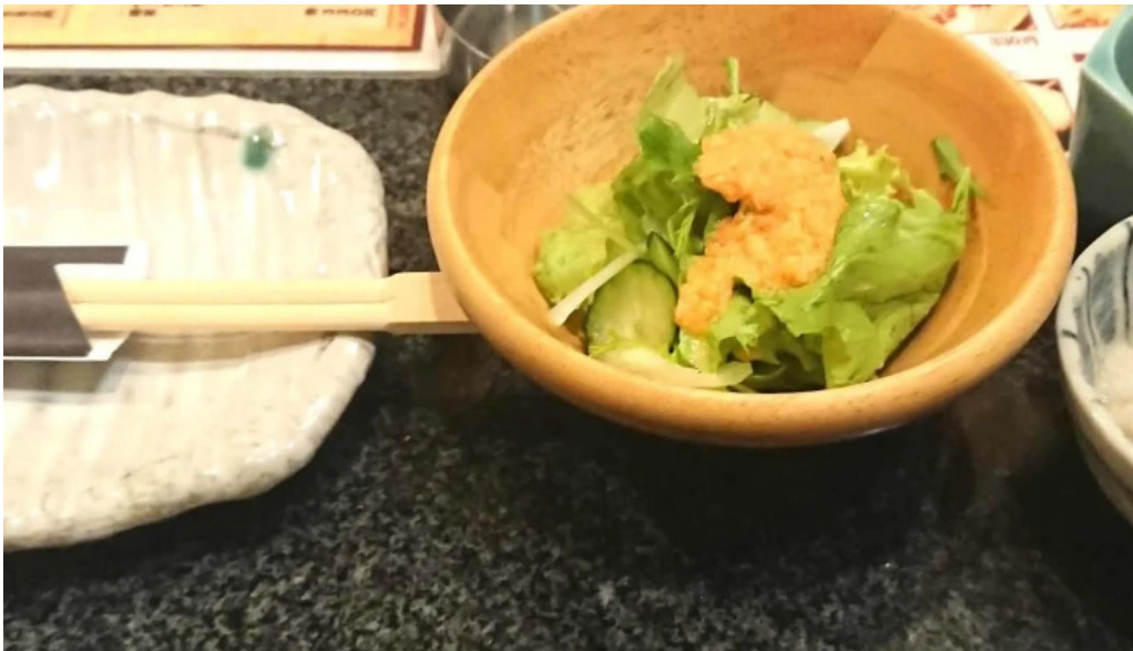
Niao hiro comentario 1