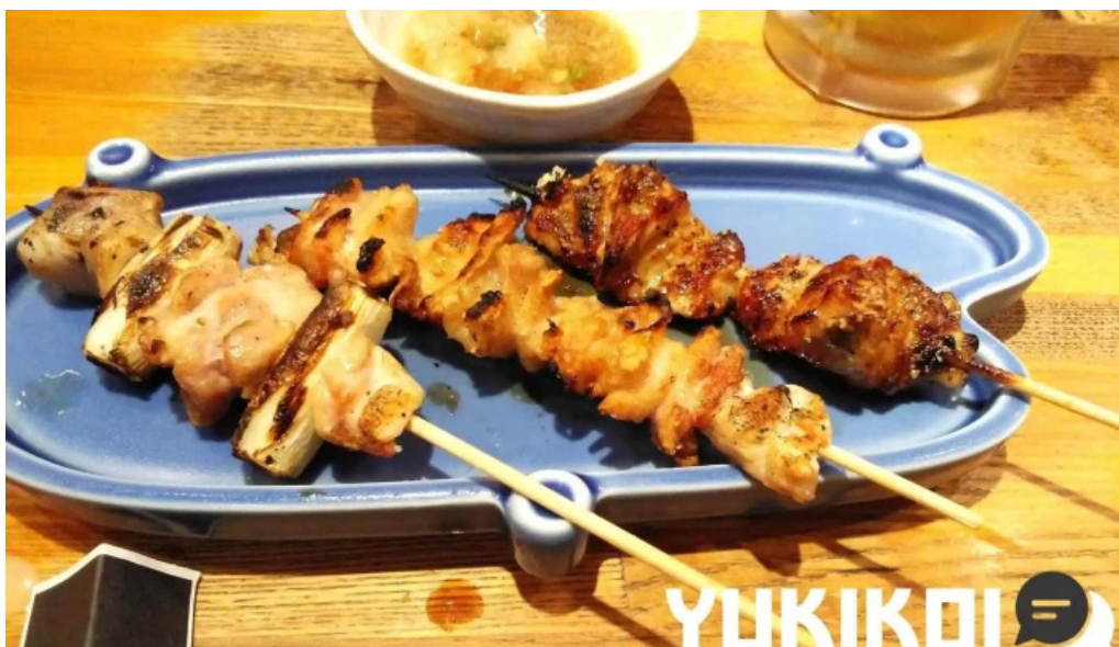
Niao hiro sate