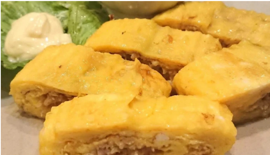
Niao hiro comentario 2