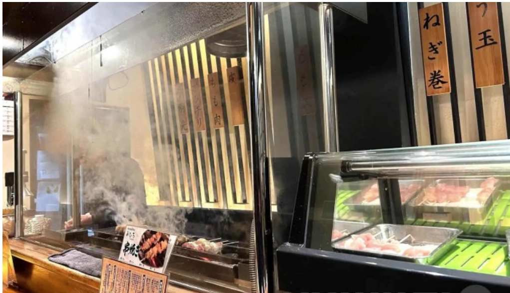
Niao hiro Fen Wei Qi