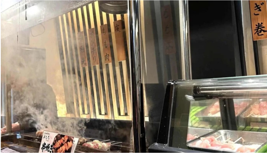
Niao hiro comentario 6