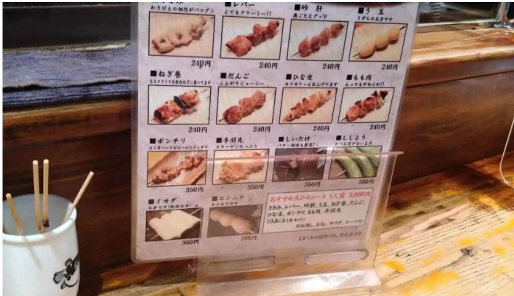
Niao hiro meniyu