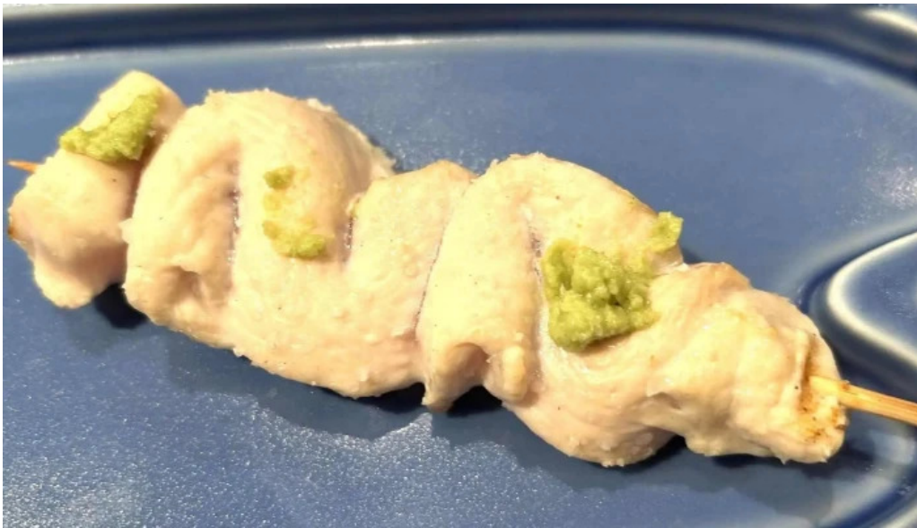
Niao hiro comentario 5