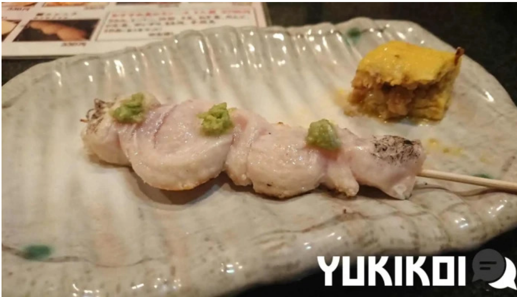
Niao hiro Shao kiNiao