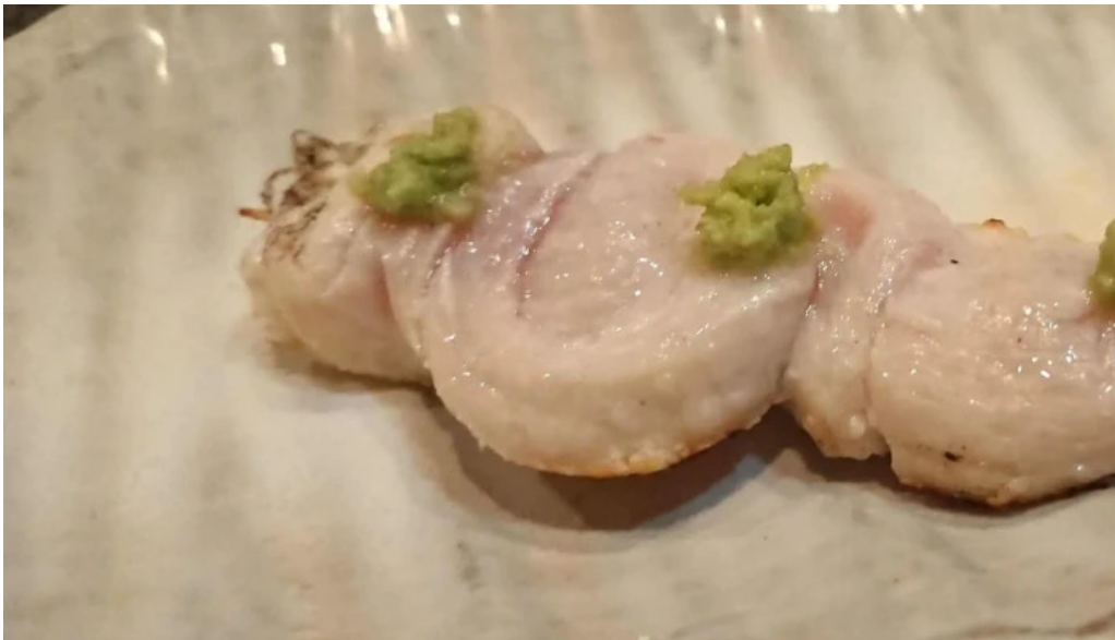
Niao hiro comentario 3