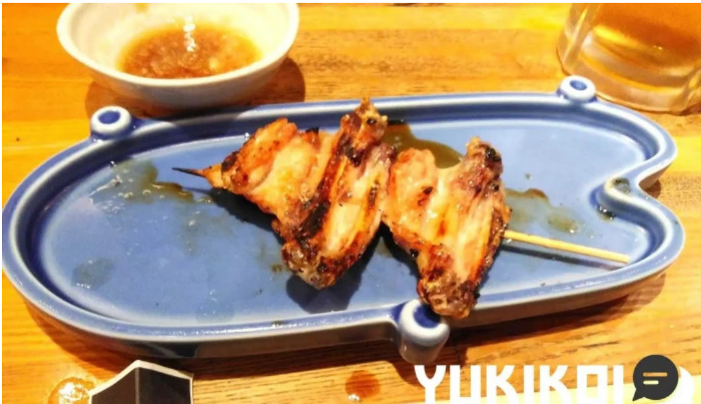
Niao hiro Liao Li Yin miWu