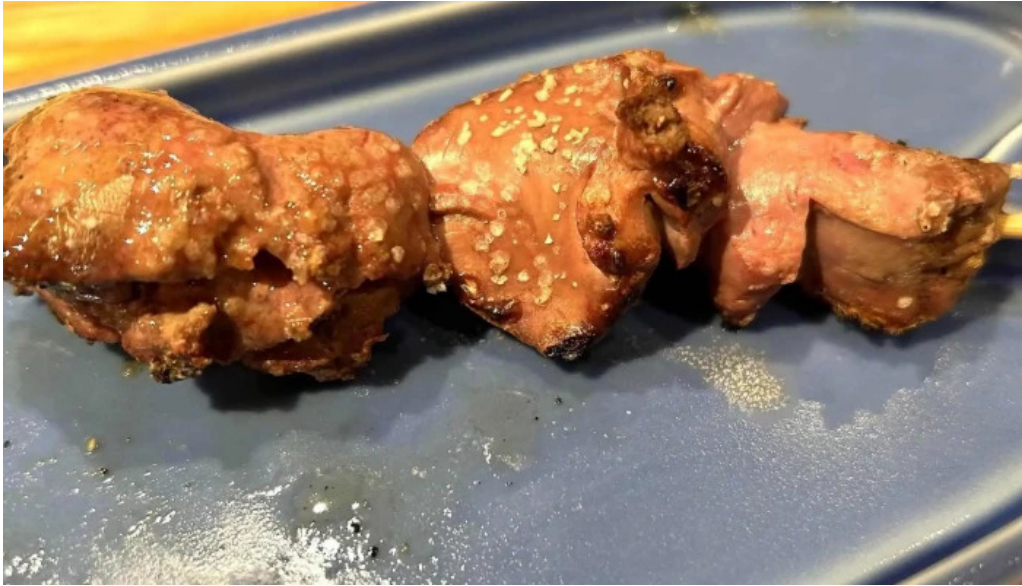
Niao hiro comentario 8