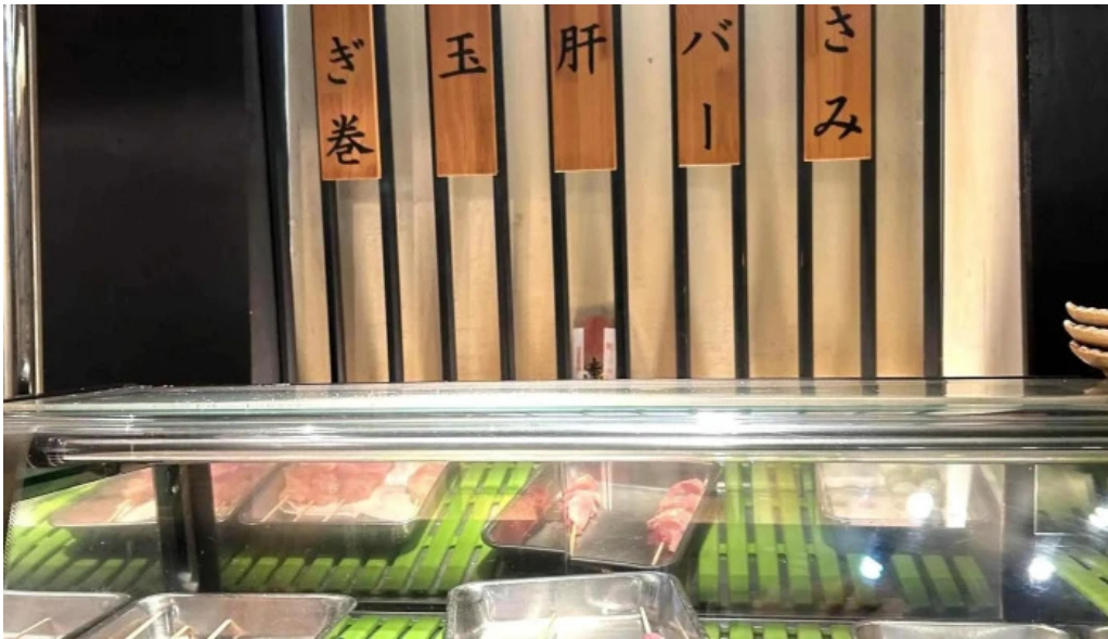
Niao hiro comentario 7