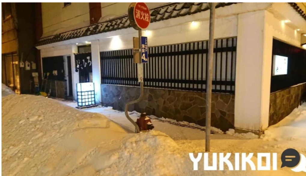
Niao hiro subete