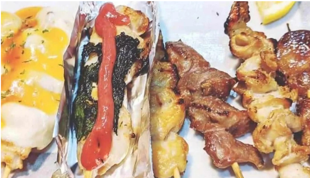
やきとり 紘 comentario 6