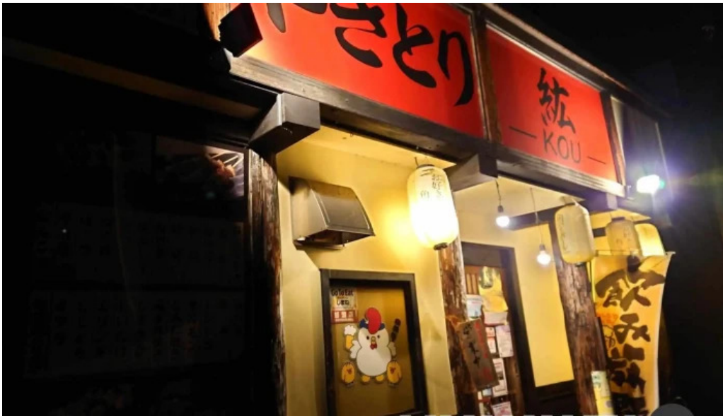
やきとり 紘すべて