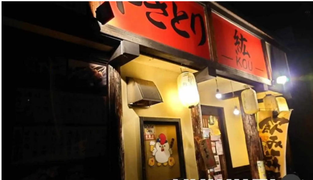
やきとり 紅 浜田市