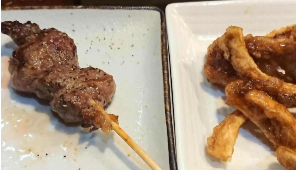
やきとり 紘 comentario 1