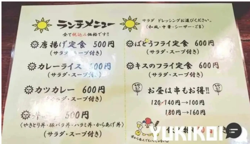
やきとり 360°メニュー