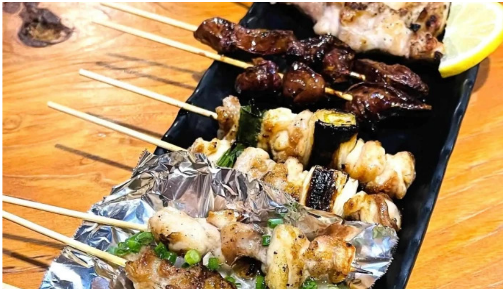
やきとり 紘 comentario 9