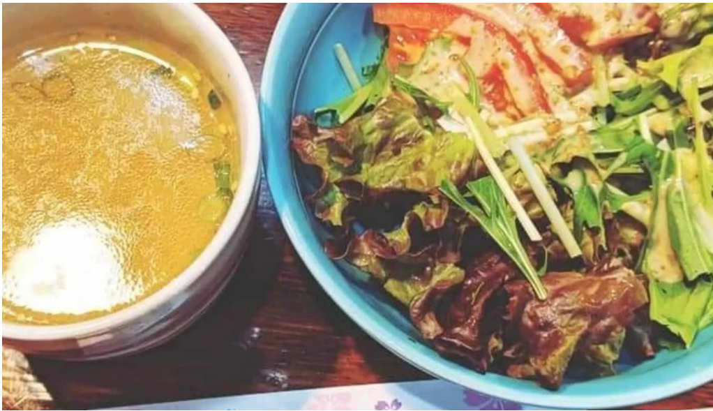
やきとり 紘 comentario 7