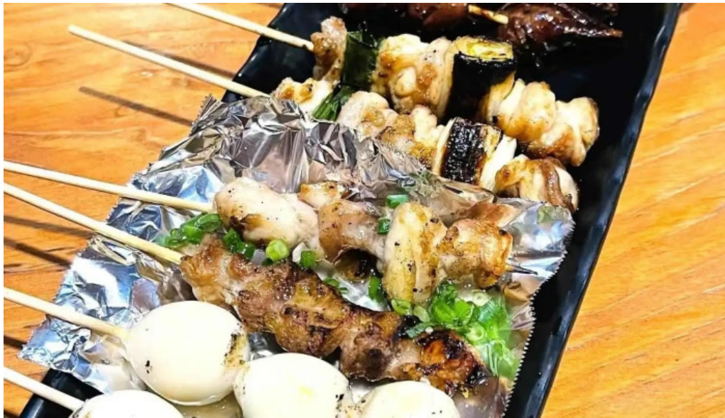
やきとり 紅 料理飲み物