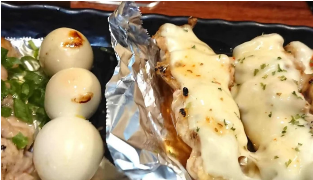
やきとり 紘 comentario 2