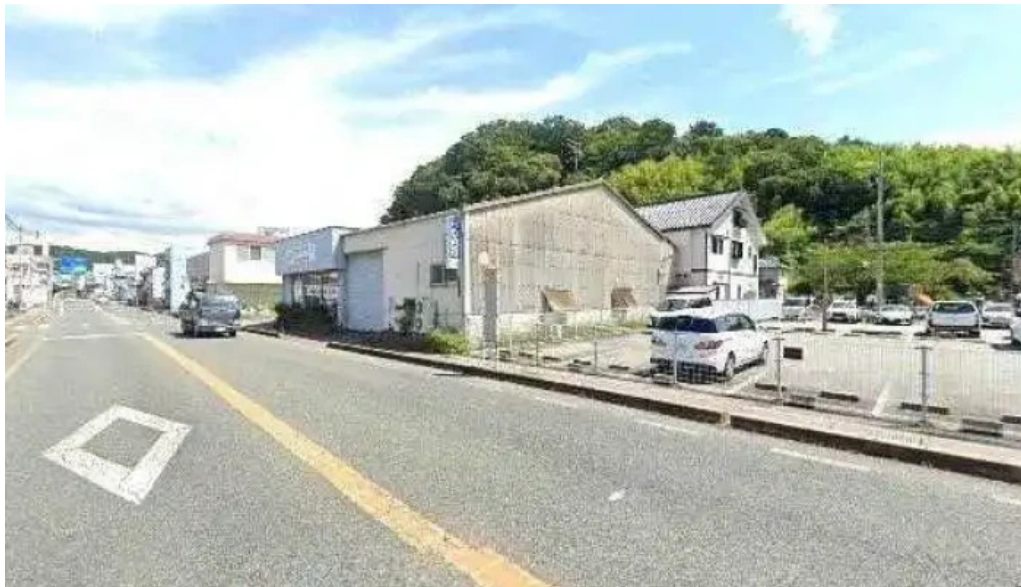
やきとり 360° ストリートビューと 360°ビュー