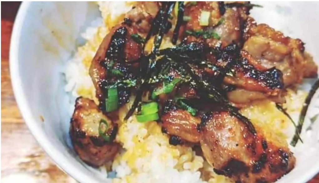
やきとり 紘 comentario 5