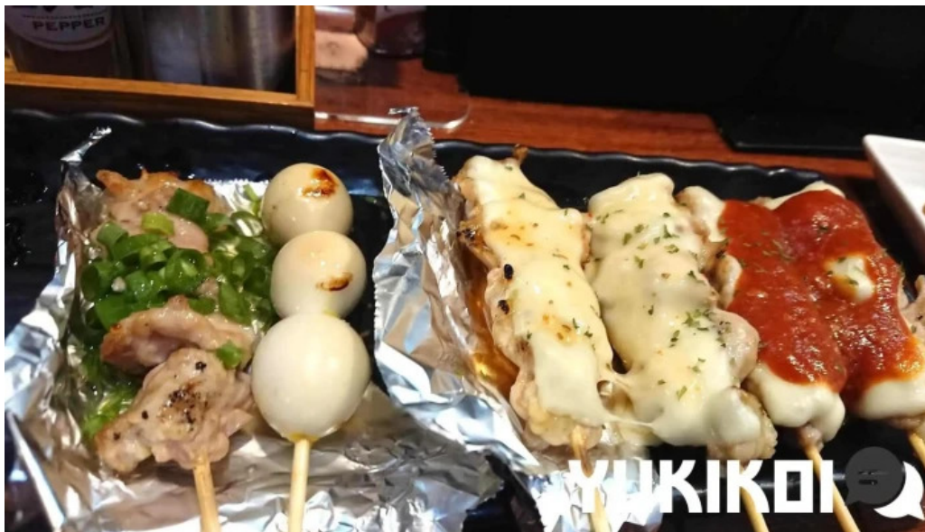
やきとり 紘 焼き鳥