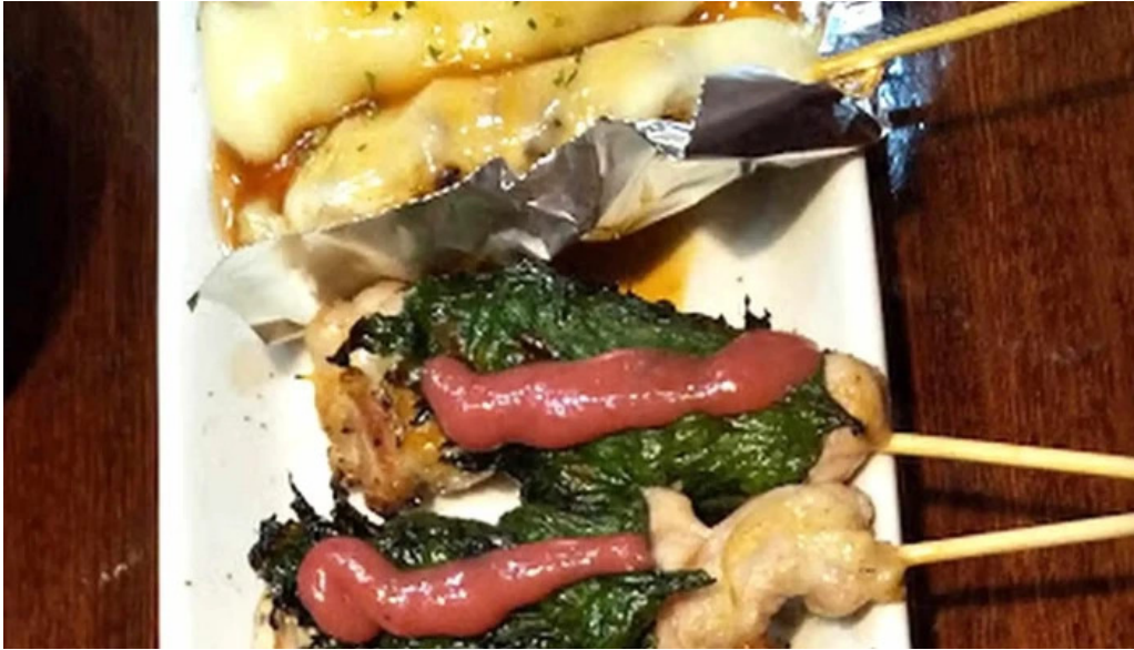
やきとり 紘 comentario 3