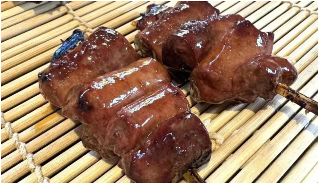
炭火烧鳥 備長 焼き鳥