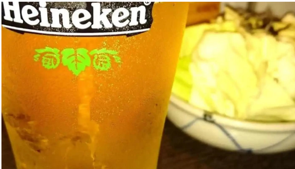
炭火焼鳥 備長 ビール