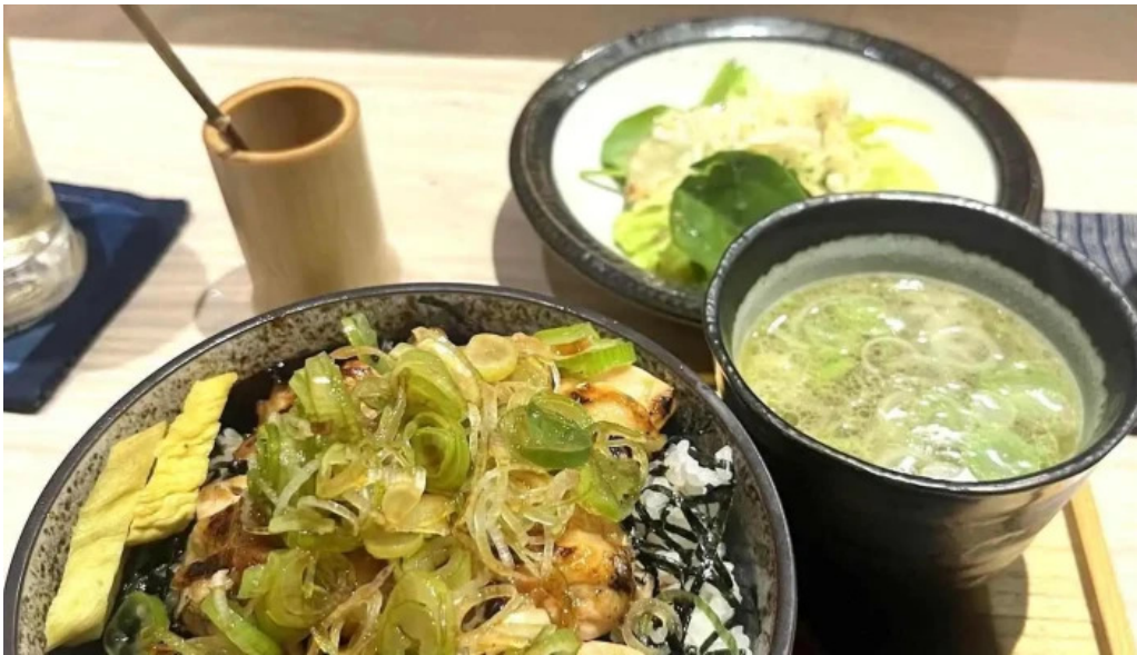
炭火焼鳥 備長 丼物