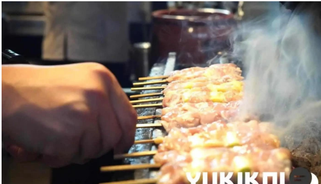
炭火烧鳥 備長 料理飲み物