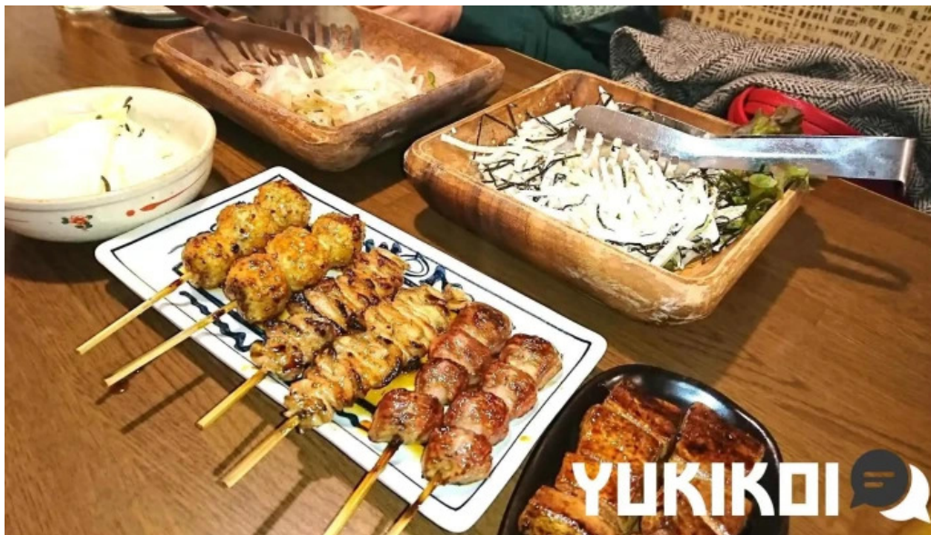
炭火焼鳥 備長 サテ