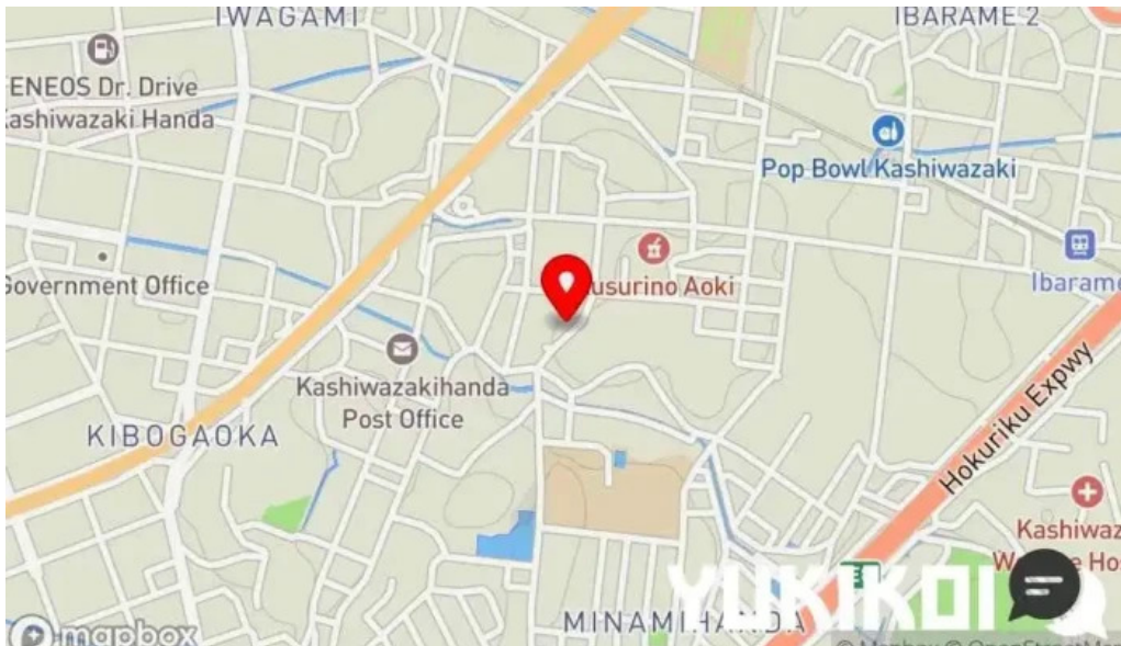
炭火烧鳥 備長 地図