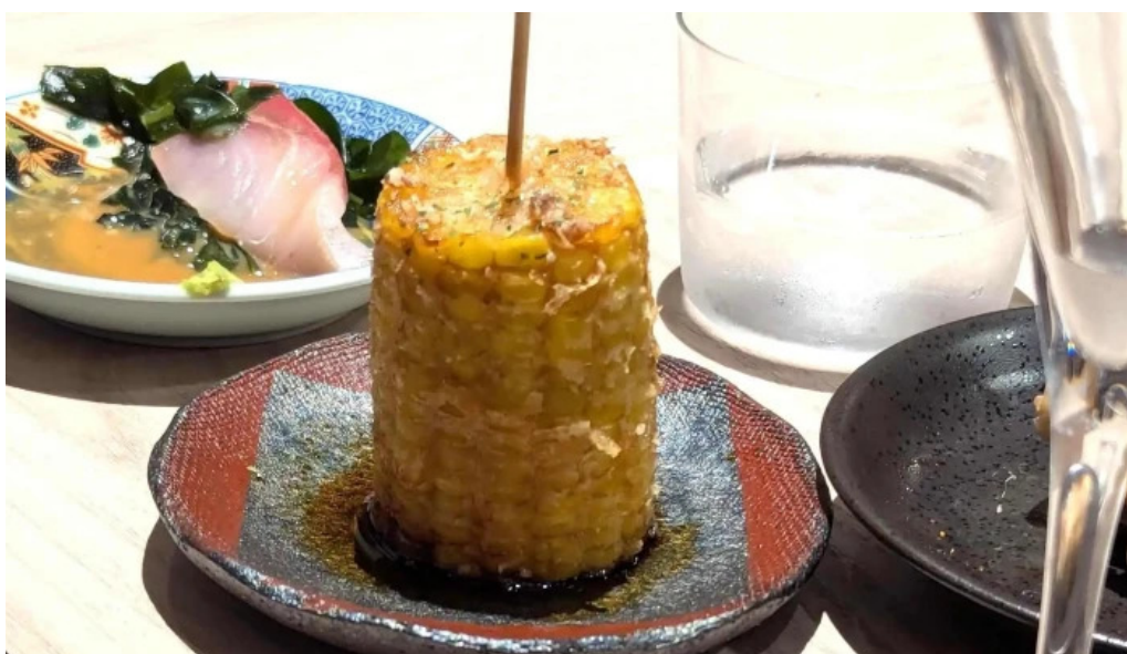
炭火烧鳥 備長 instagram