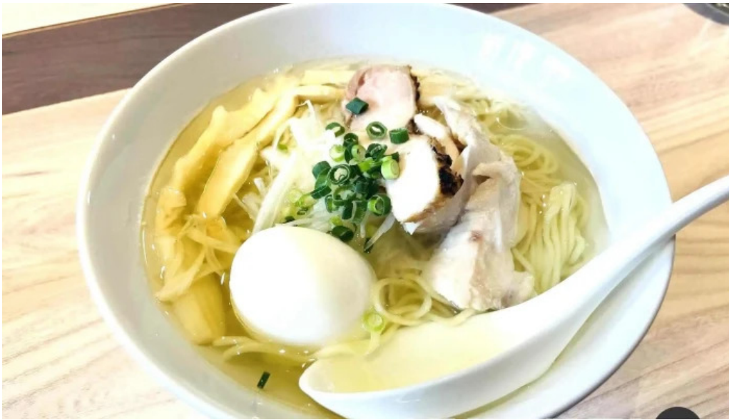
炭火烧鳥 備長 ラーメン