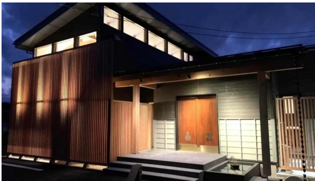
炭火烧鳥 備長