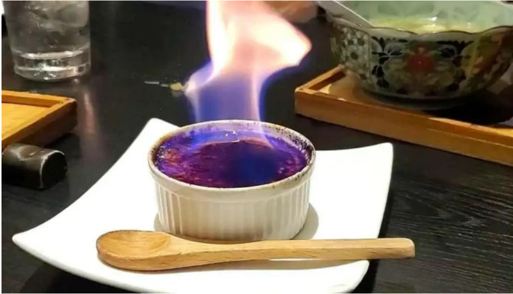
炭火焼鳥 備長 動画