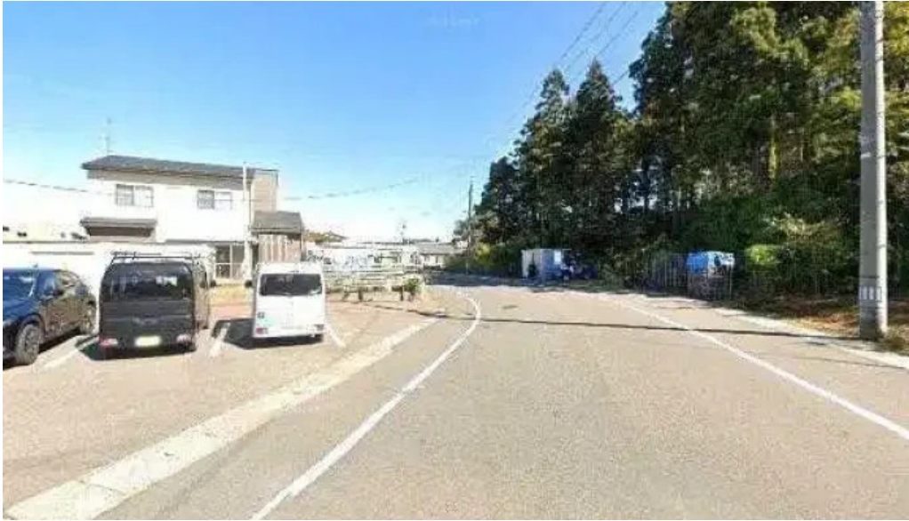
炭火烧鳥 備長 柏崎市