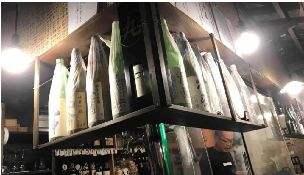
炭火焼鳥 備長 雰囲気