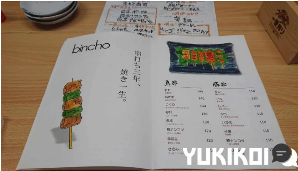
炭火烧鳥 備長 メニュー