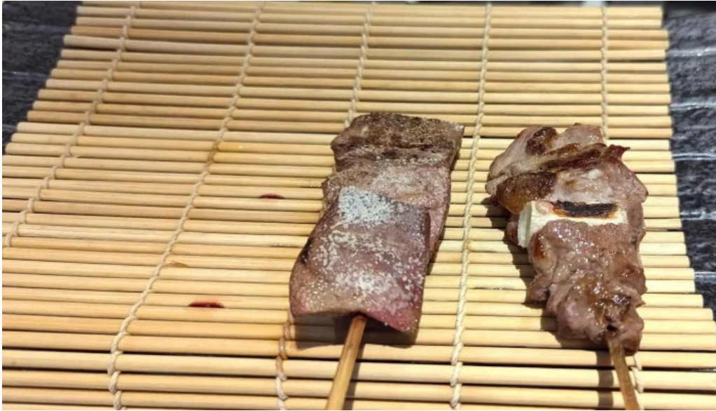
炭火烧鳥 備長 行き方