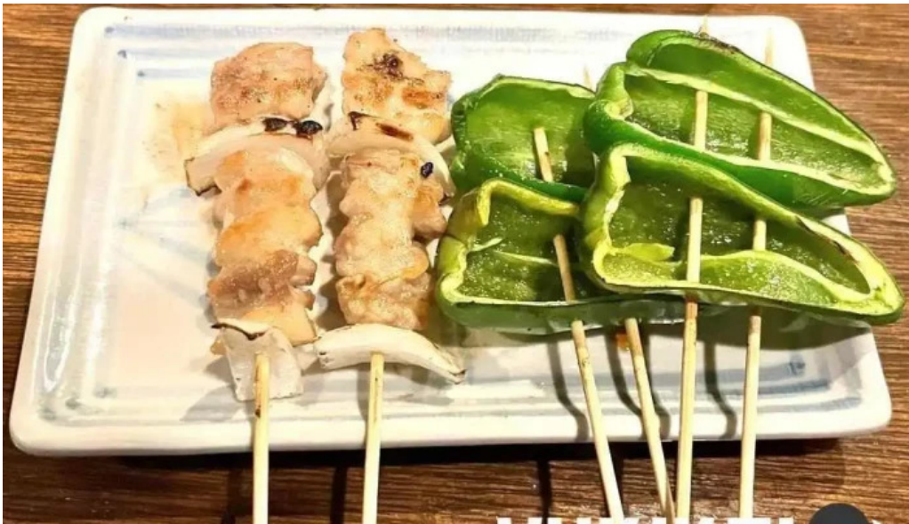
おいでやす 料理飲み物