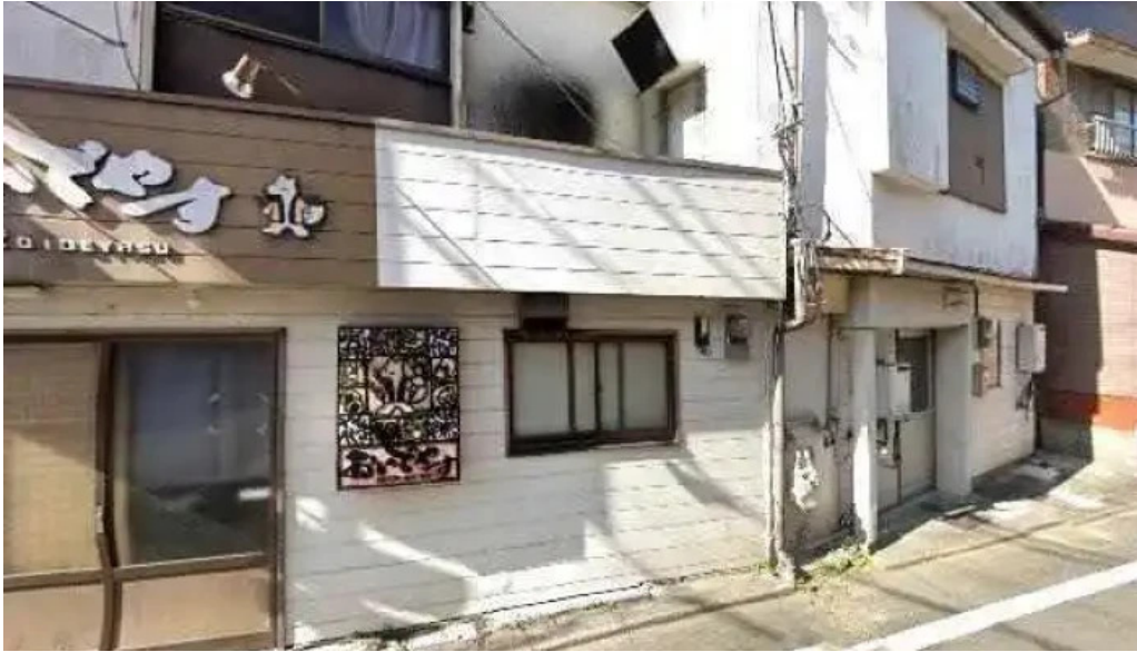
おいでやす 延岡市