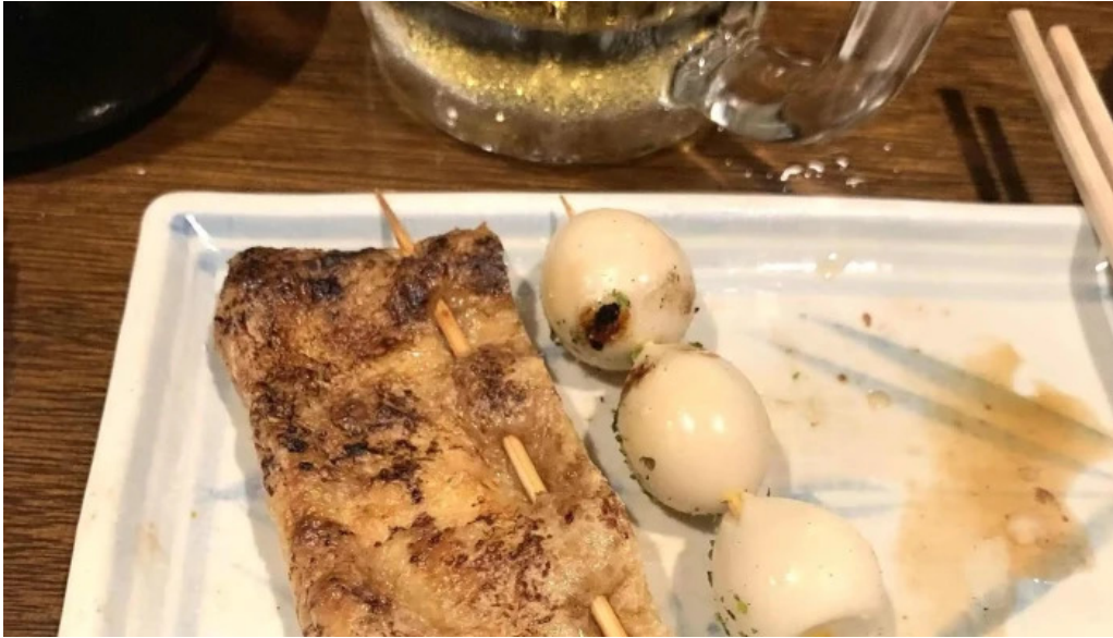
おいでやす 営業中