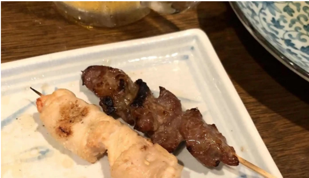
おいでやす コメント