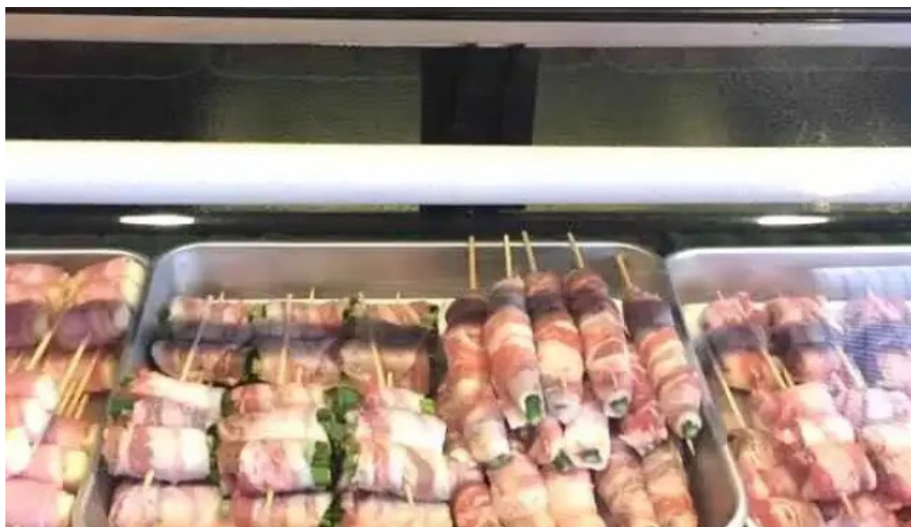
おいでやす 霧田気