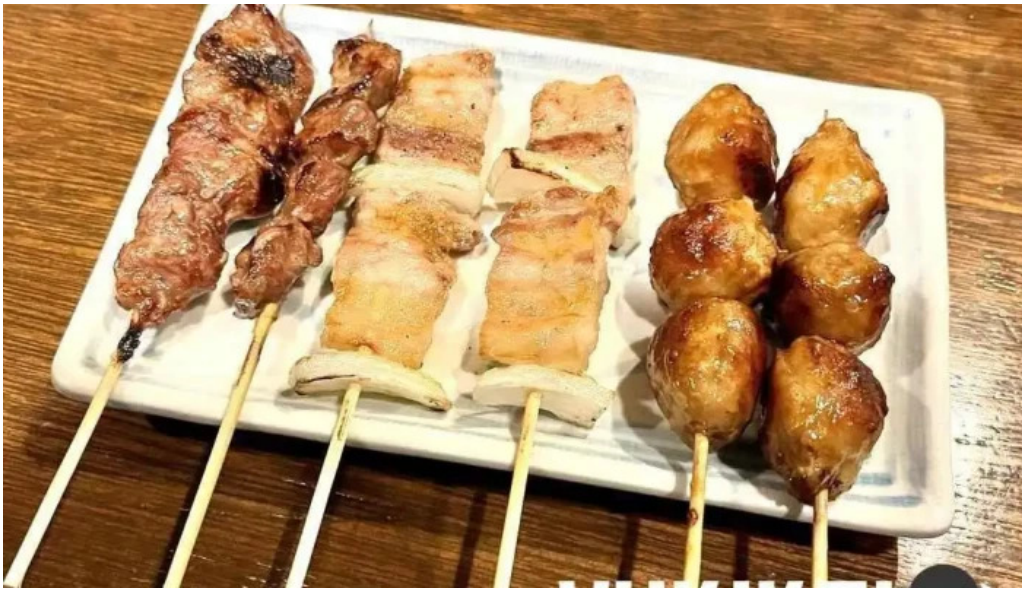
おいでやす 焼き鳥