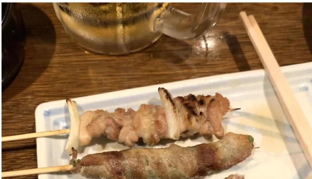
おいでやす カタログ