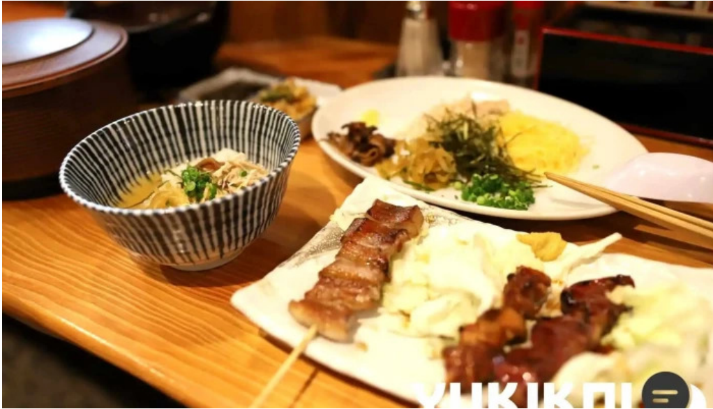
鳥しん 料理飲み物