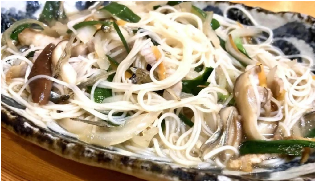
鳥しん チャプチェ