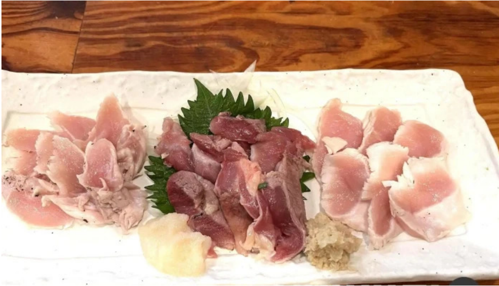
鳥しん プロシュット