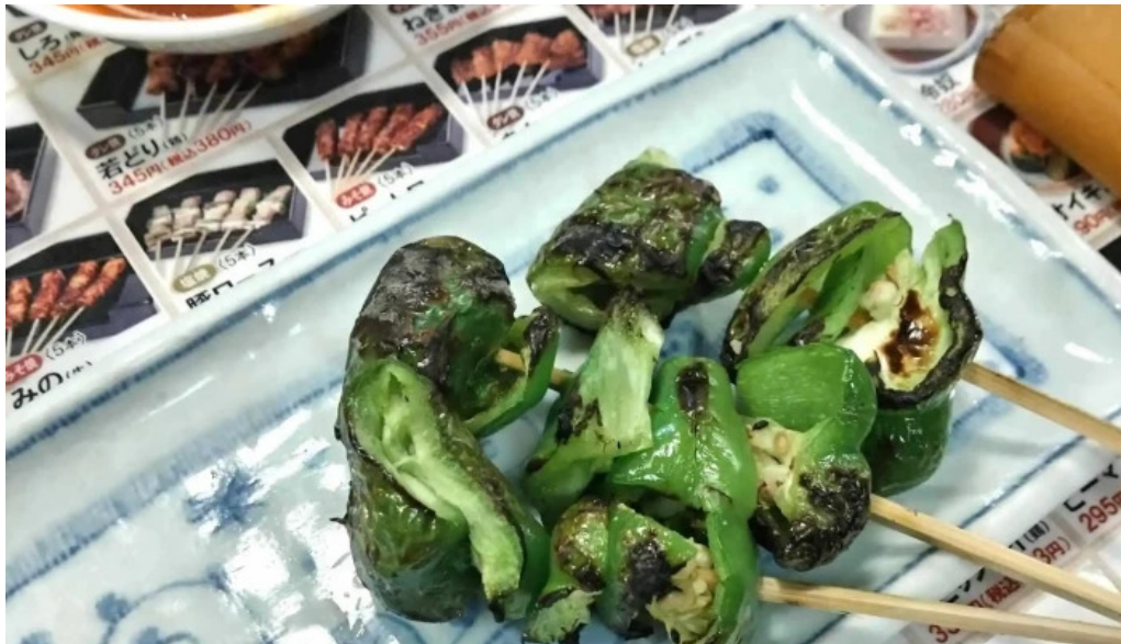
やきとりの名門秋吉 春江店 comentario 4