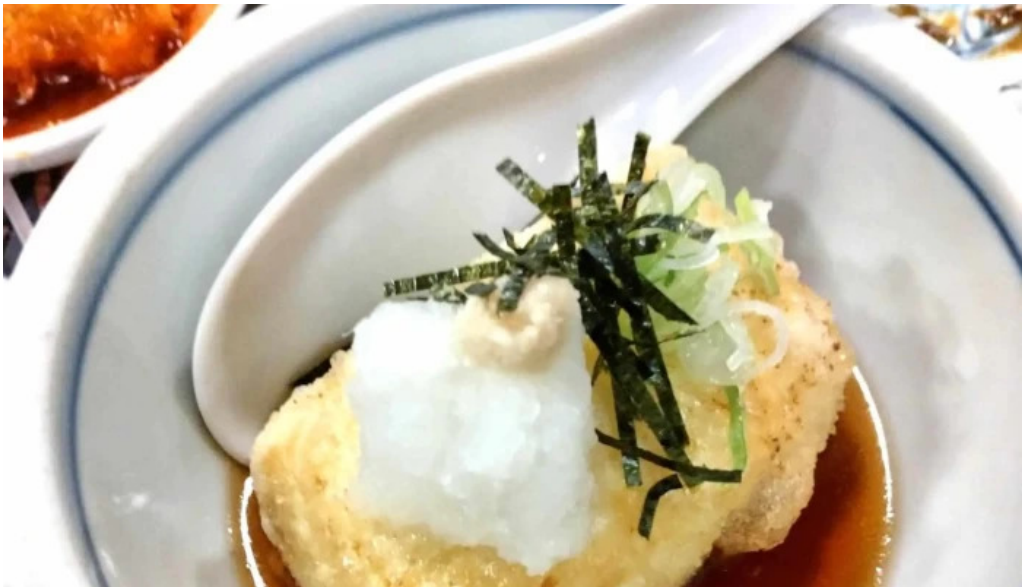
やきとりの名門秋吉 春江店 comentario 2