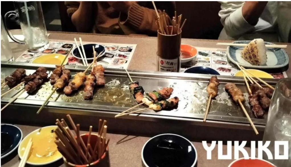
やきとりの名門秋吉 春江店 料理飲み物