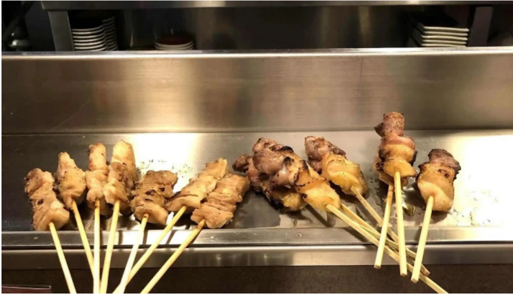
やきとりの名門秋吉 春江店 comentario 7