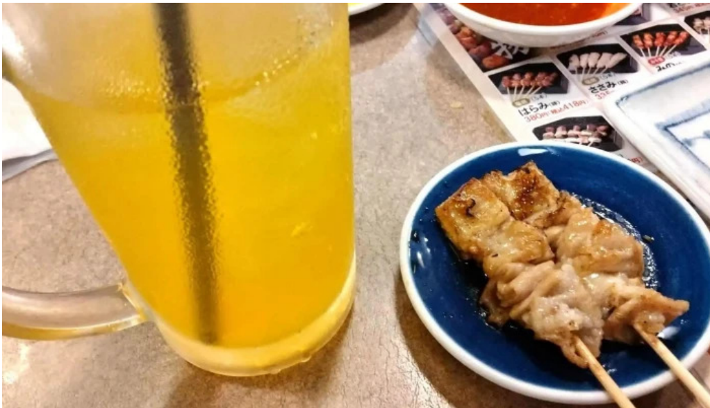
やきとりの名門秋吉 春江店 comentario 3