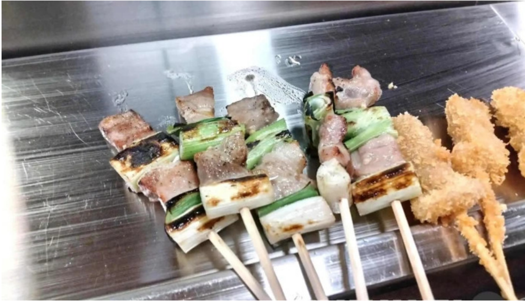
やきとりの名門秋吉 春江店 焼き鳥