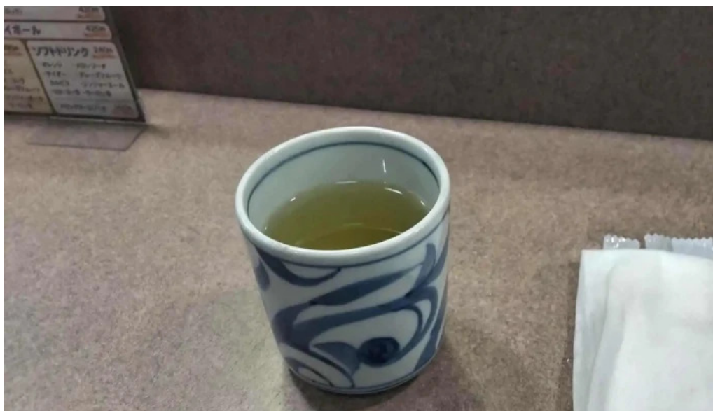
やきとりの名門秋吉 春江店 comentario 1