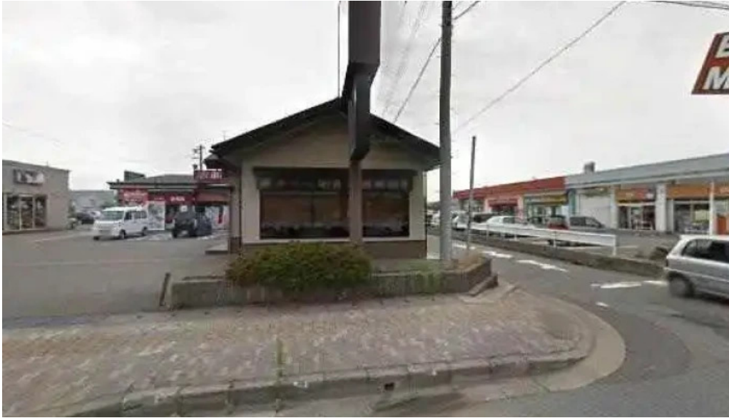
やきとりの名門秋吉 春江店 ストリートビューと 360 ビュー