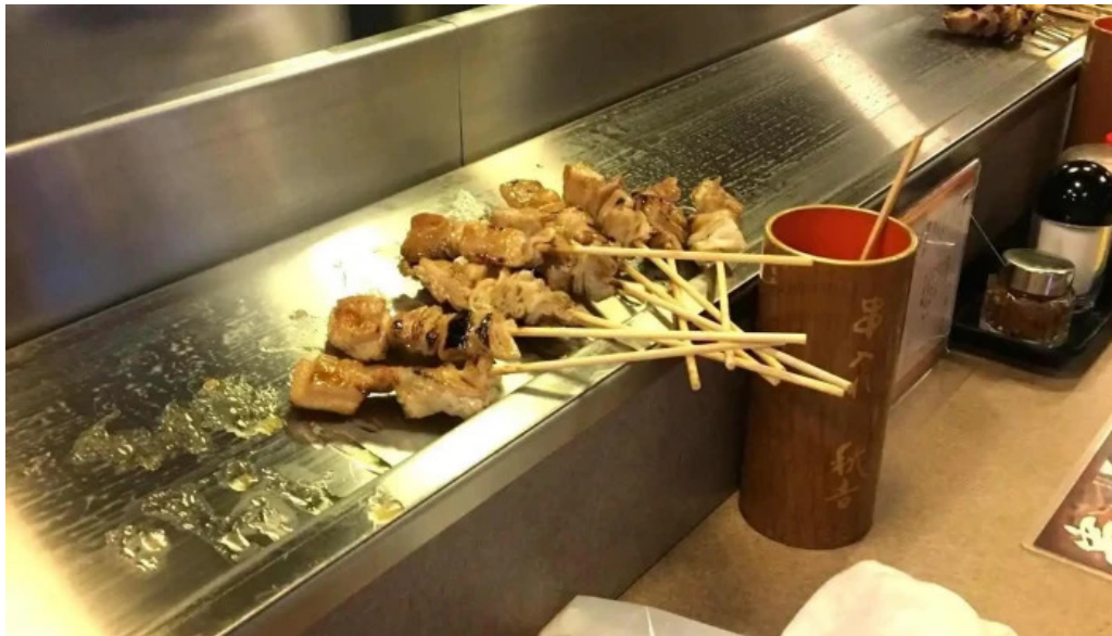
やきとりの名門秋吉 春江店 雰囲気