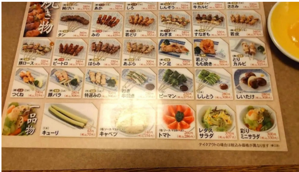
やきとりの名門秋吉 春江店 メニュー