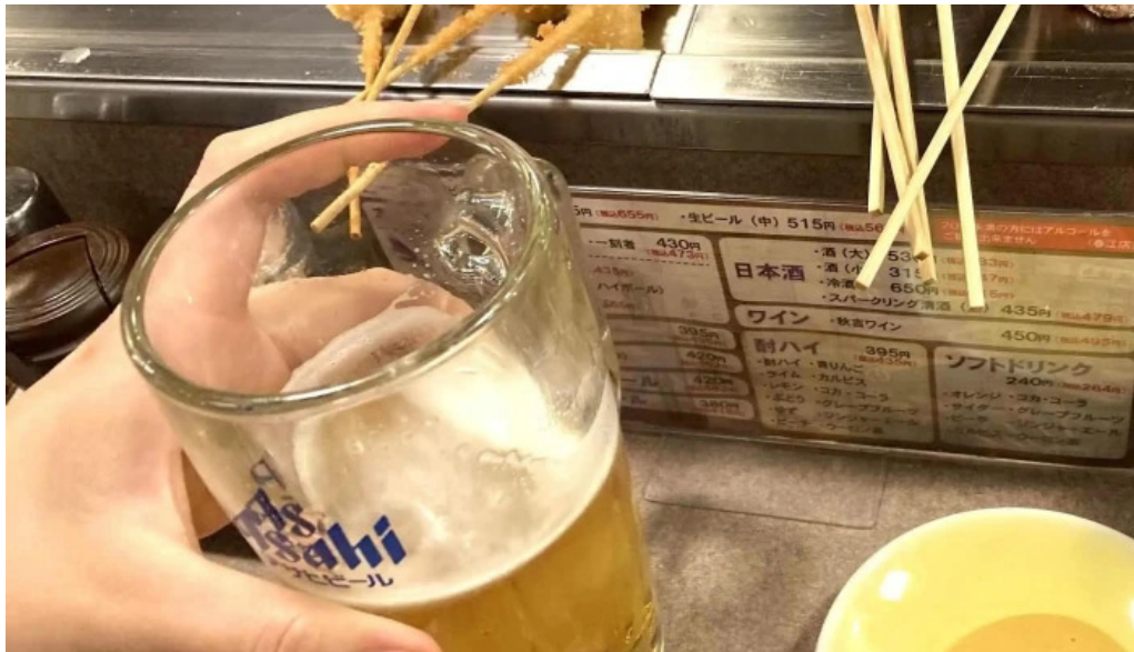
やきとりの名門秋吉 春江店 comentario 5