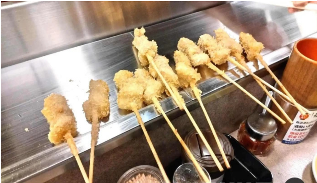
やきとりの名門秋吉 春江店 サテ