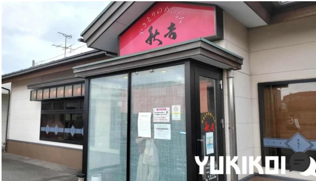
やきとりの名門秋吉 春江店 すべて