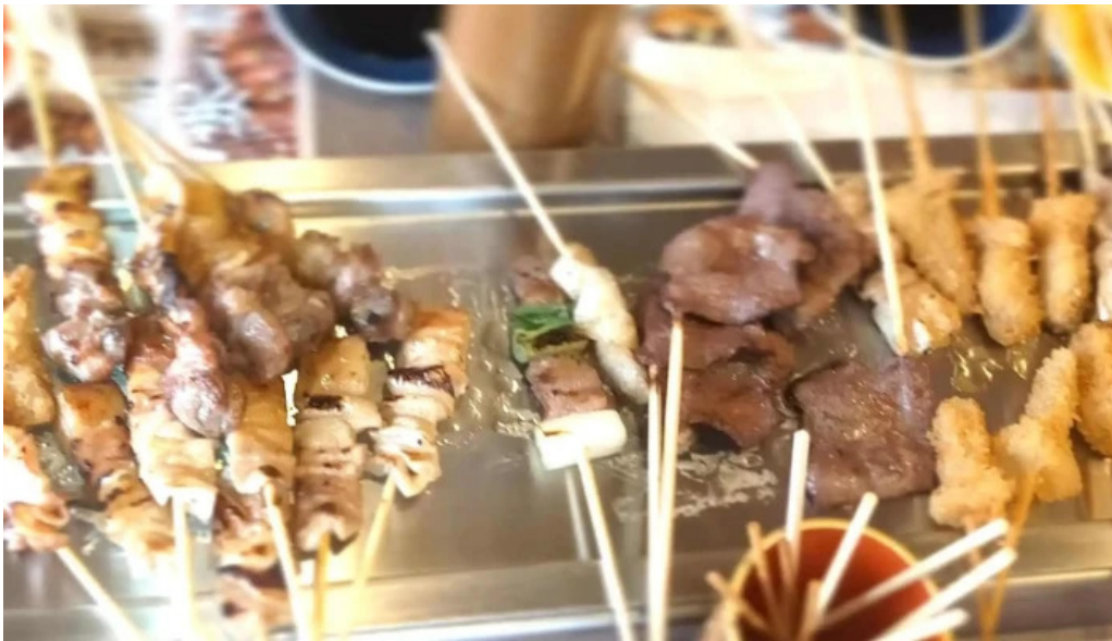
やきとりの名門秋吉 春江店 comentario 6