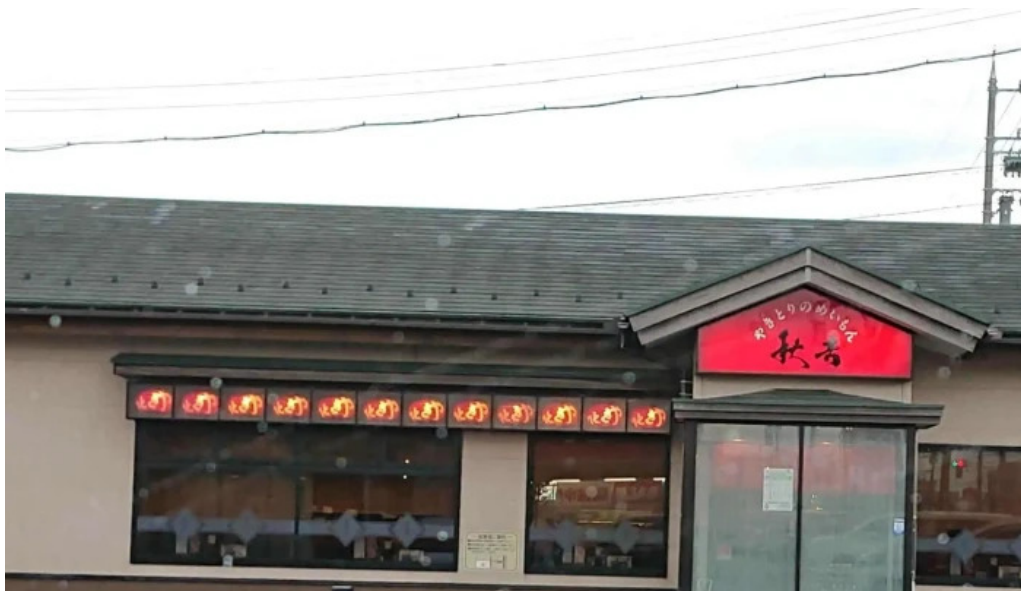
やきとりの名門秋吉 春江店 comentario 8