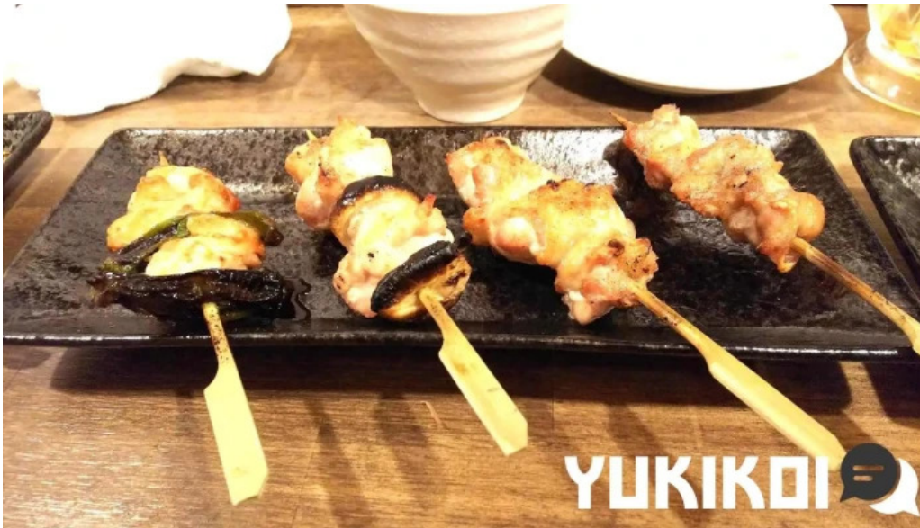
松もと 料理飲み物