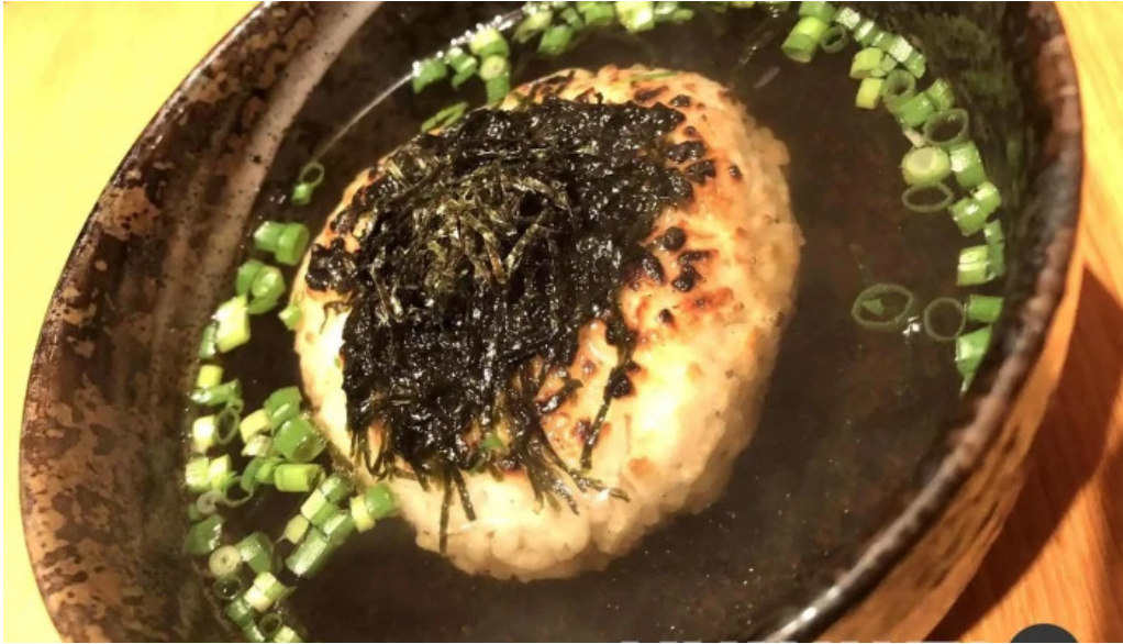
串焼きひがし 人吉本店 茶漬け