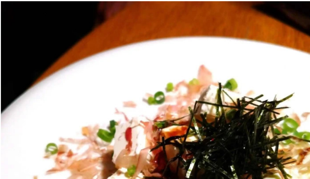
串焼きひがし 人吉本店 ウェブサイト