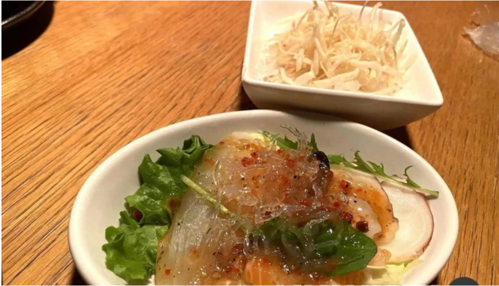
串焼きひがし 人吉本店 料理飲み物