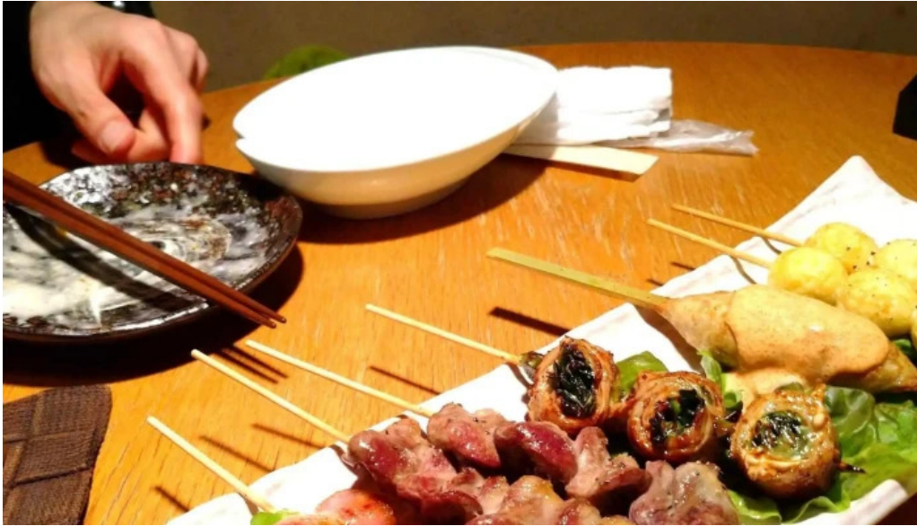
串焼きひがし 人吉本店 カタログ