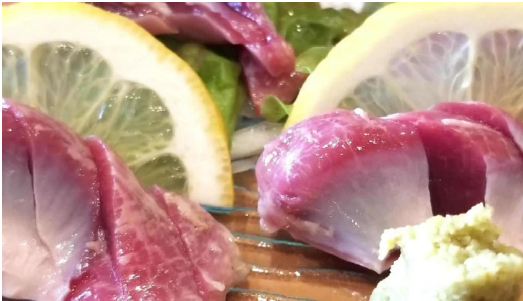
串焼きひがし 人吉本店 instagram