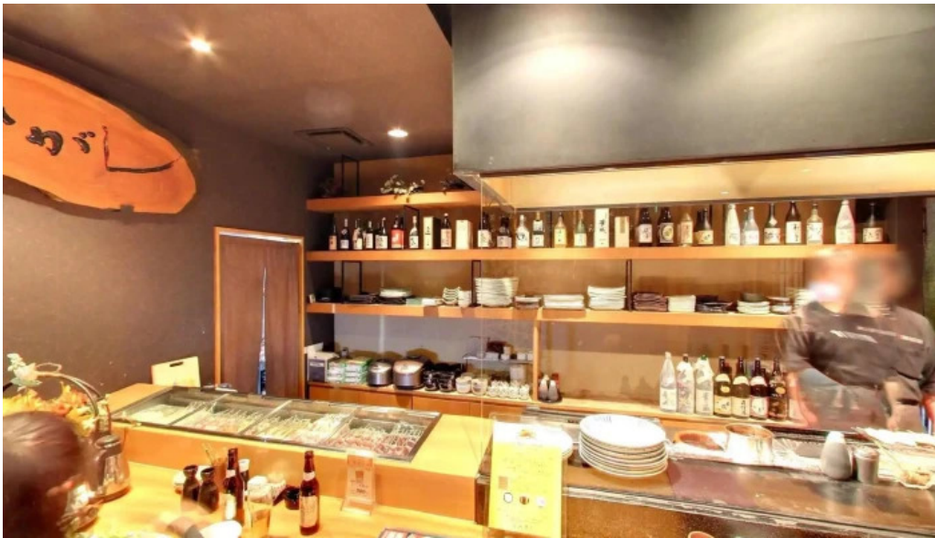
串焼きひがし 人吉本店 人吉市