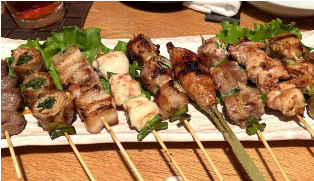
串焼きひがし 人吉本店 営業中