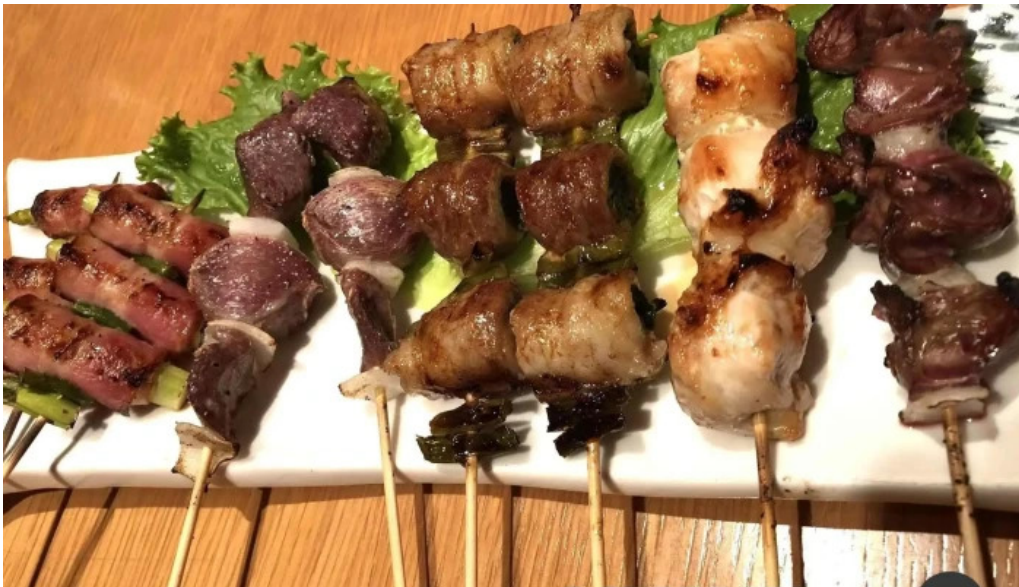
串焼きひがし 人吉本店 サテ