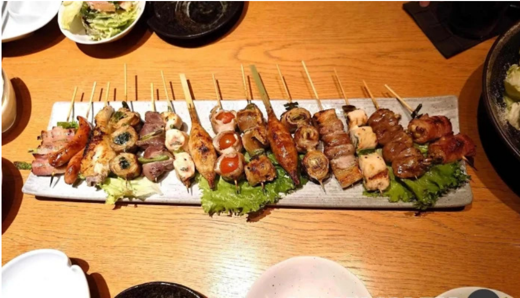
串焼きひがし 人吉本店 焼き鳥