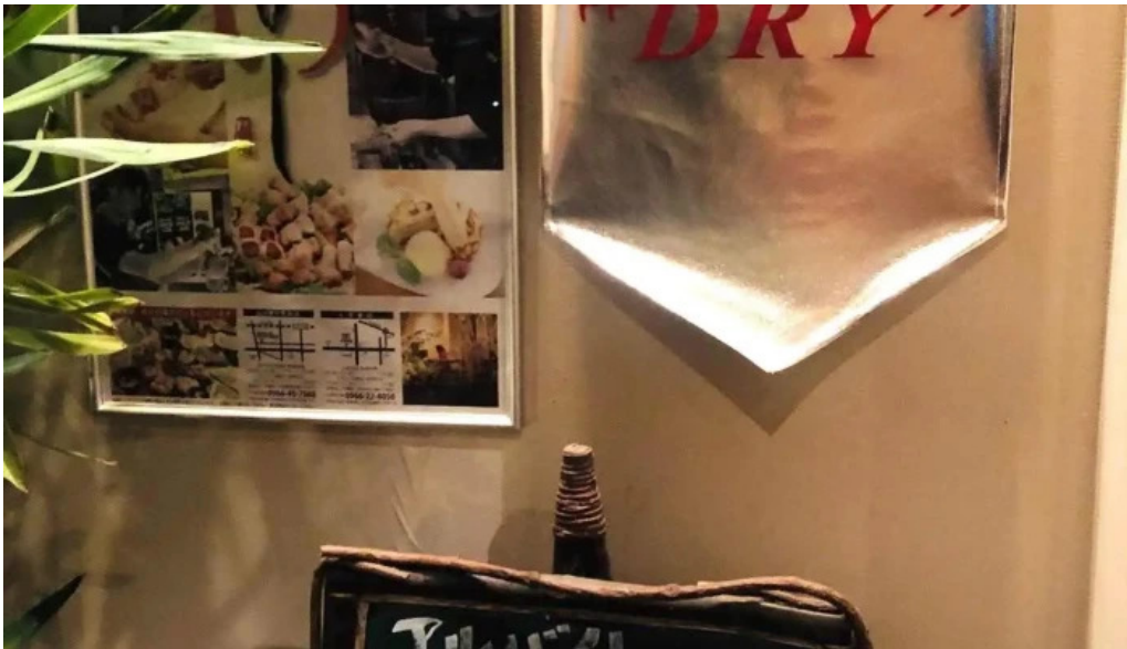
串焼きひがし 人吉本店 メニュー