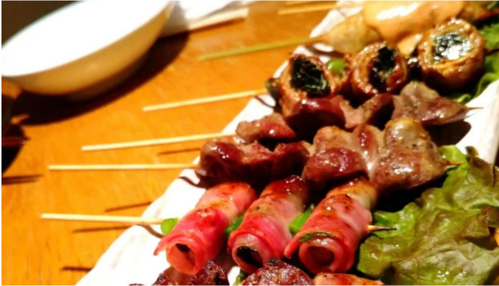
串焼きひがし 人吉本店 どこ