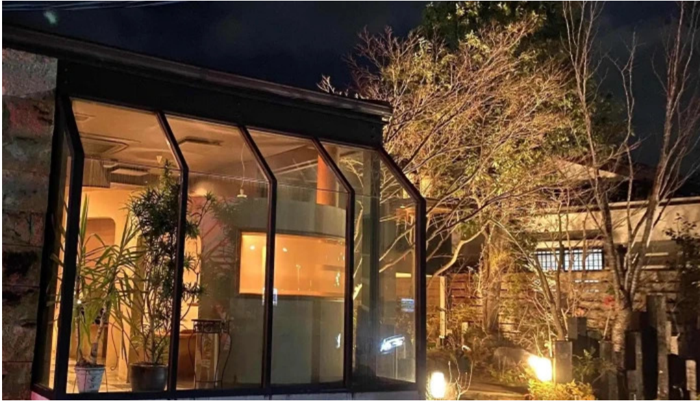
串焼きひがし 人吉本店 営業時間