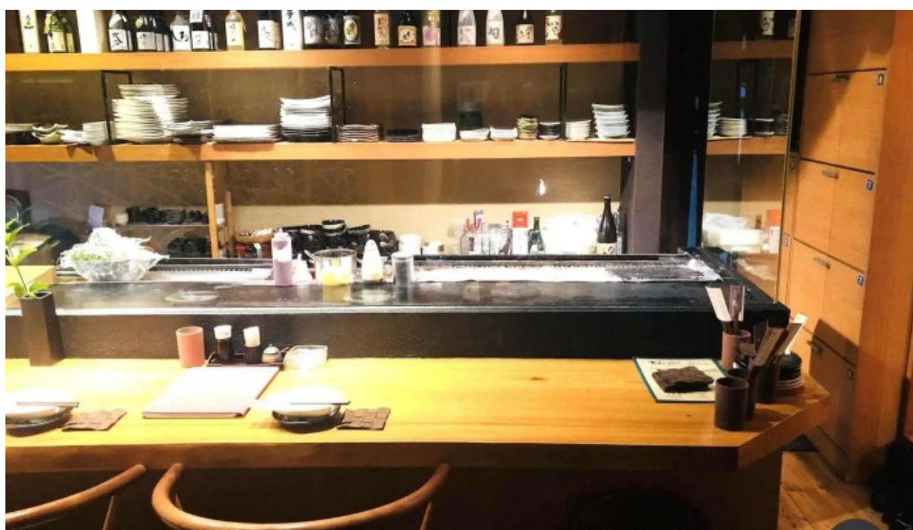
串焼きひがし 人吉本店 雰囲気