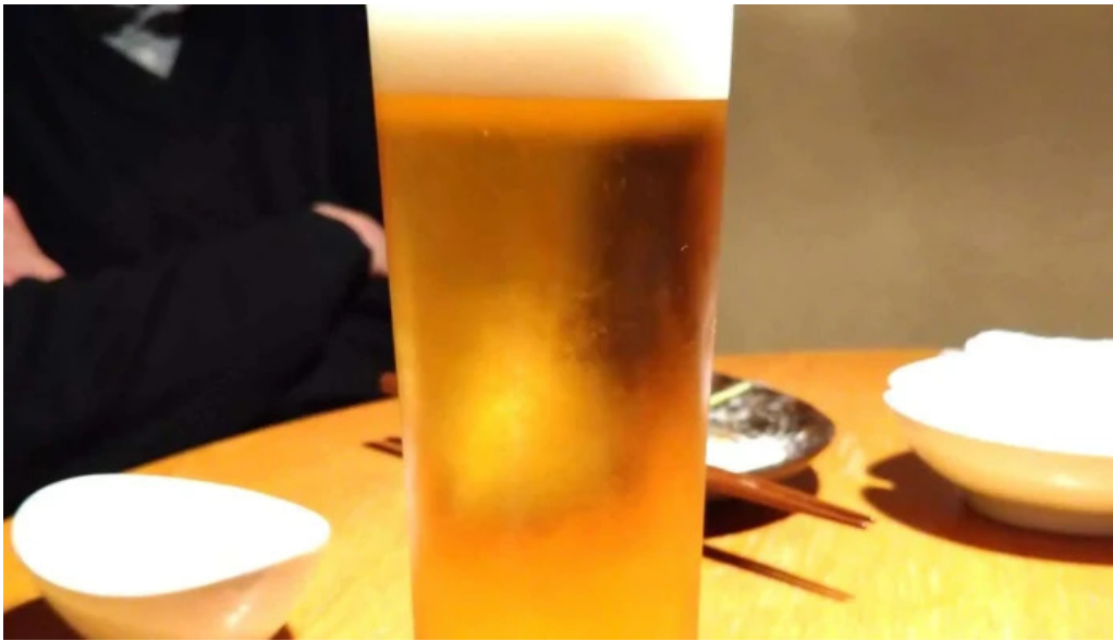
串焼きひがし 人吉本店 動画