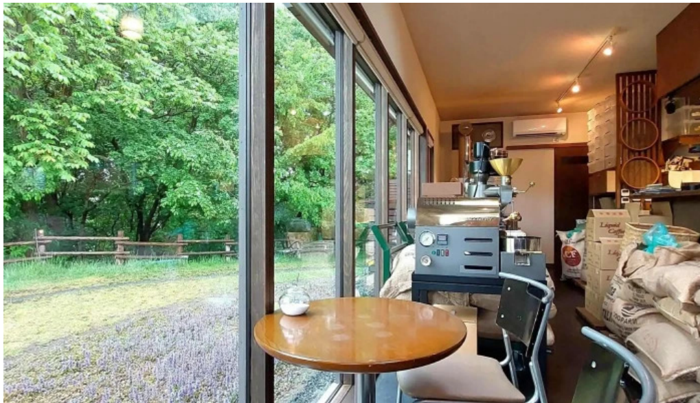
はげや珈琲 comentario 10