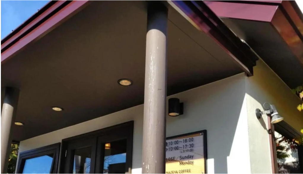
はぜや珈琲 comentario 7