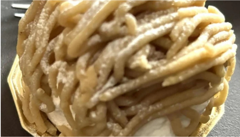
はぜや珈琲 comentario 1