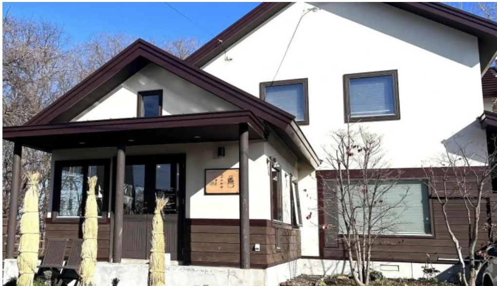
はぜや珈琲 comentario 5