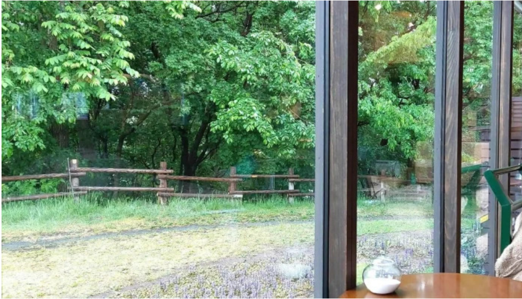
はぜや珈琲 comentario 9