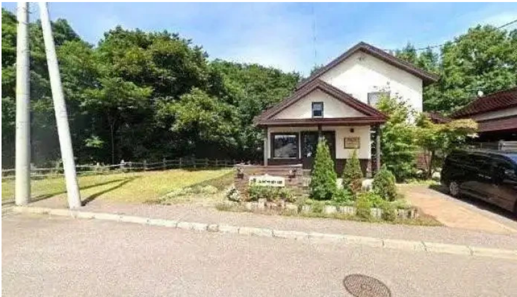
はぜや珈琲 ストリートビューと 360 ビュー