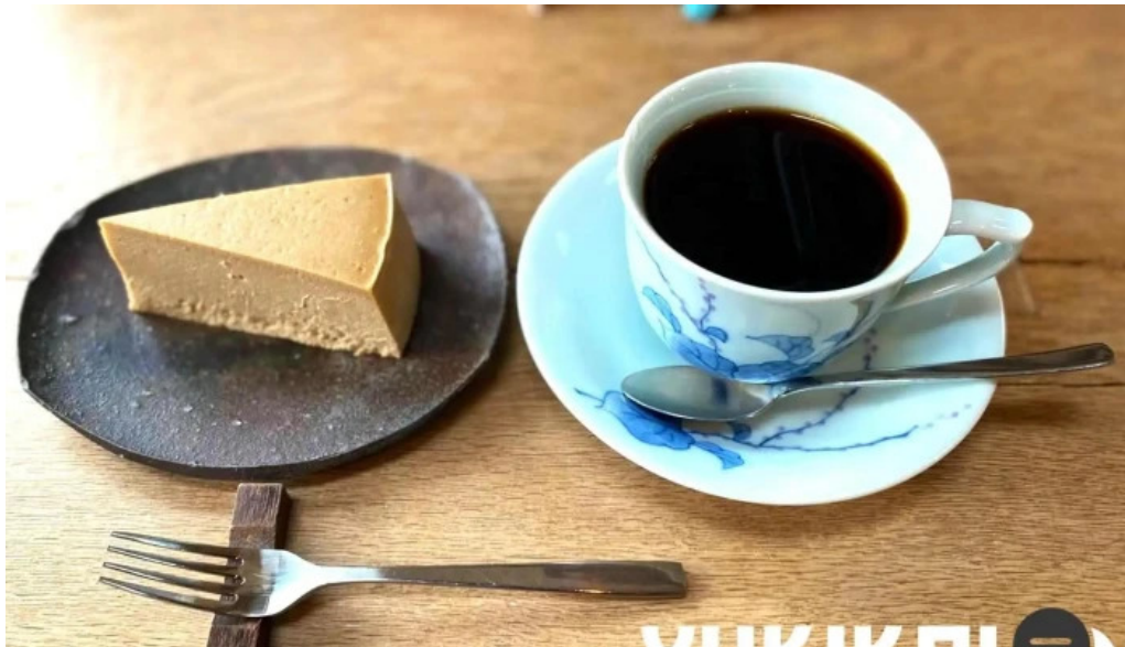
はぜや珈琲 コーヒー