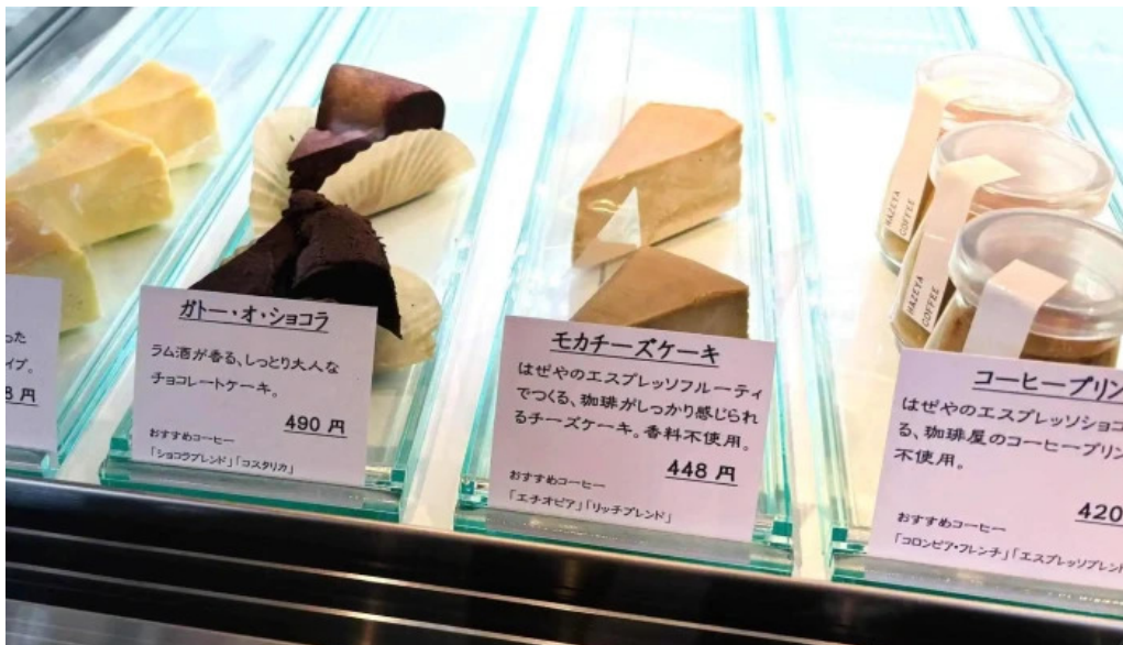
はぜや珈琲 comentario 2