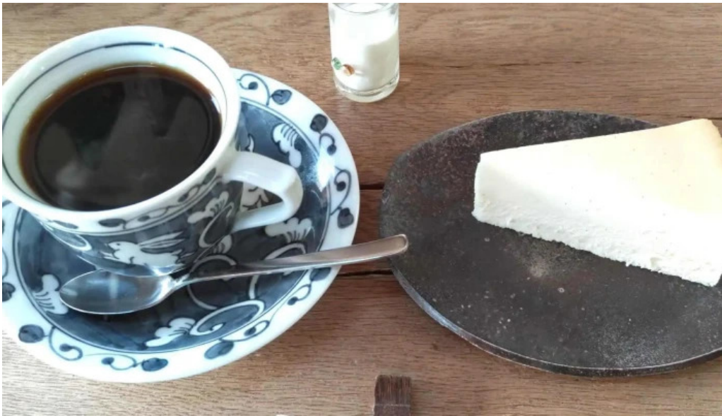
はぜや珈琲 comentario 8