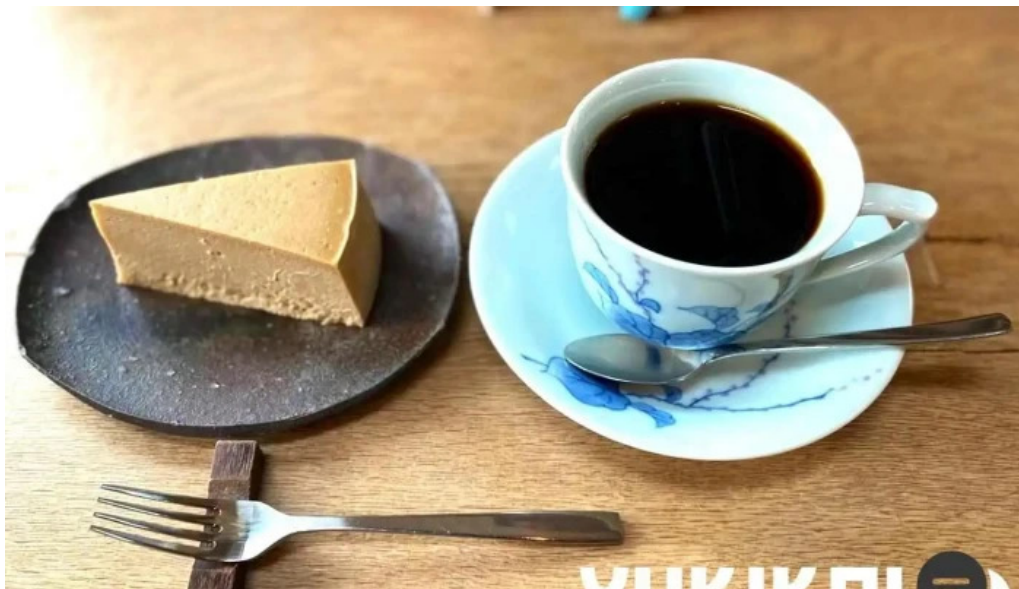
はげや珈琲 網走市