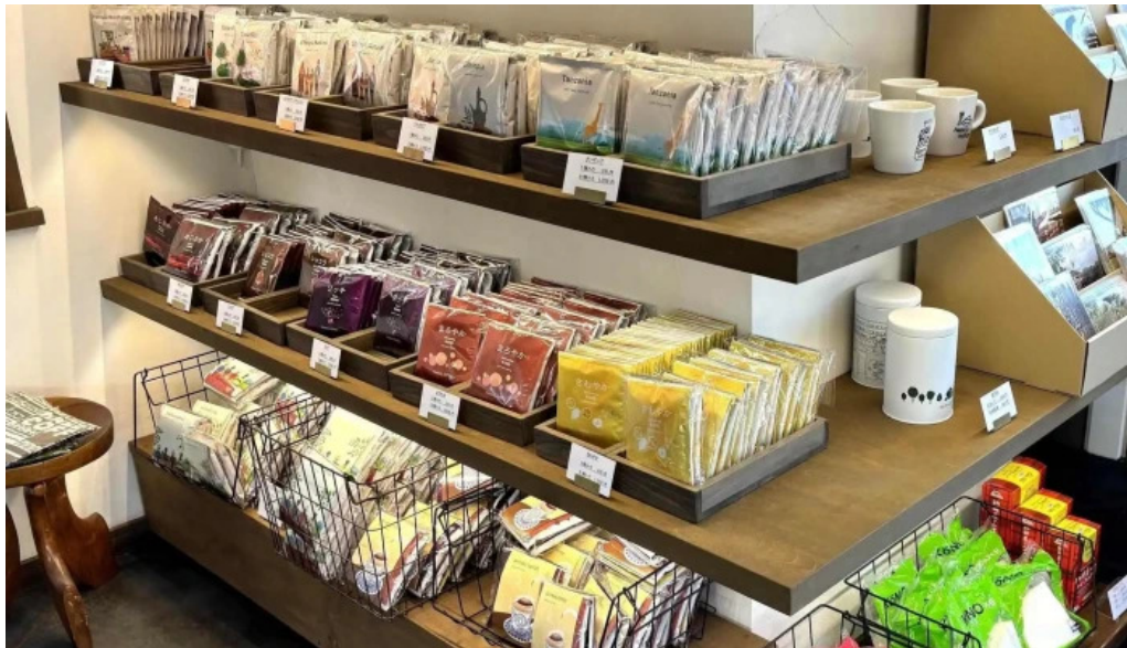
はぜや珈琲 comentario 3