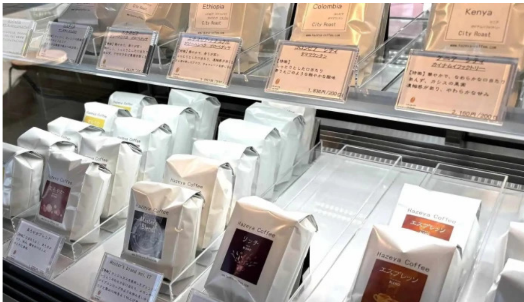
はぜや珈琲 comentario 4