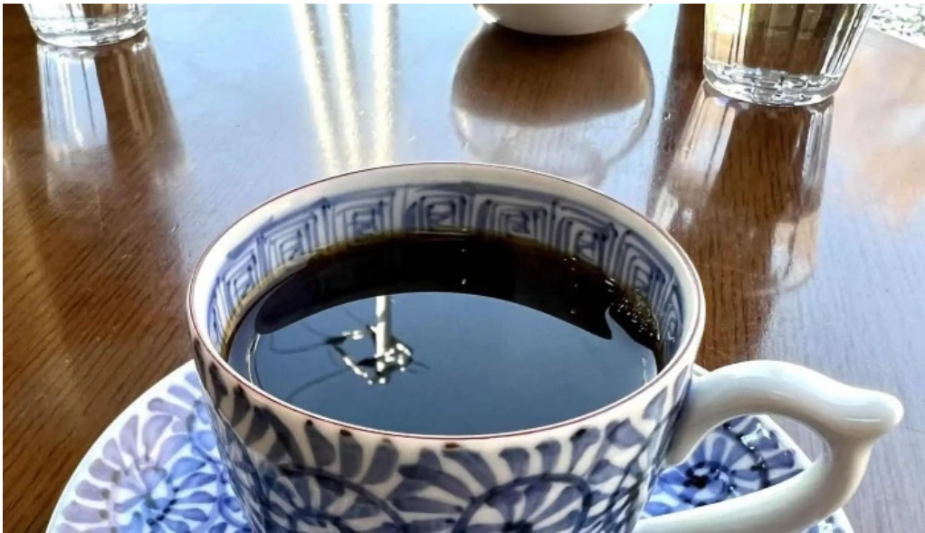
はぜや珈琲 comentario 6