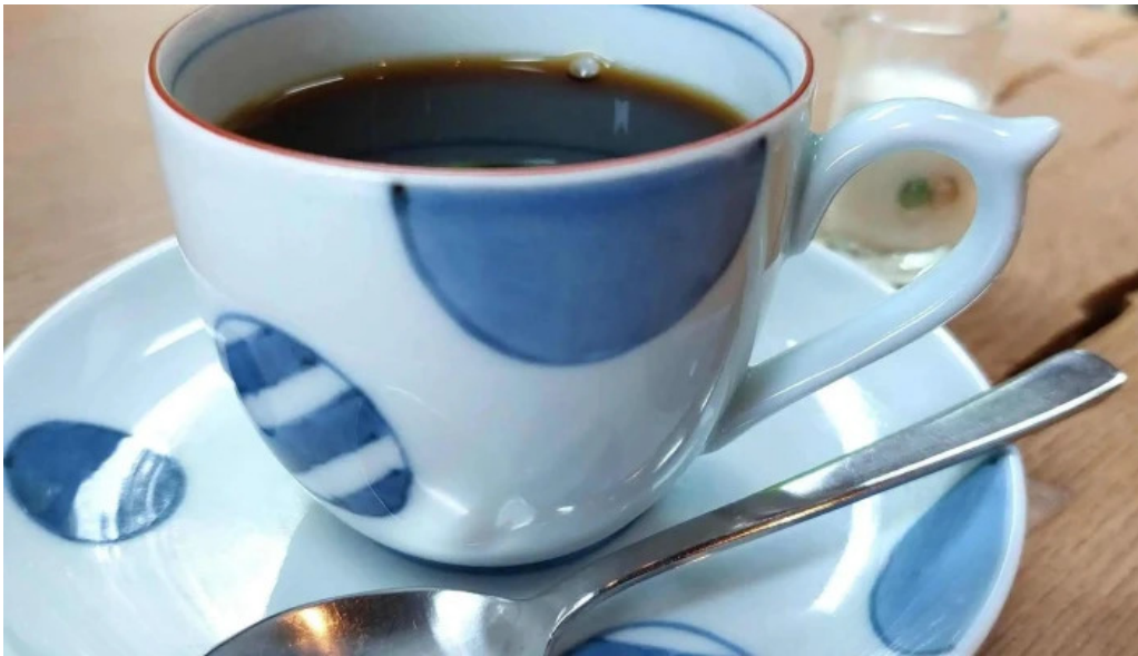
はぜや珈琲 comentario 11