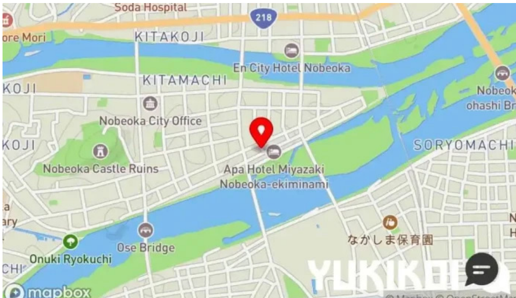
ギョーザ専門店 黒兵衛 延岡 地図