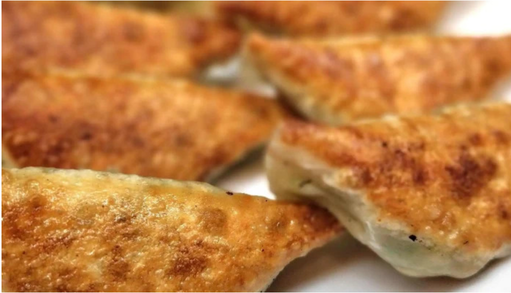
ギョーザ専門店 黒兵衛 延岡 料金