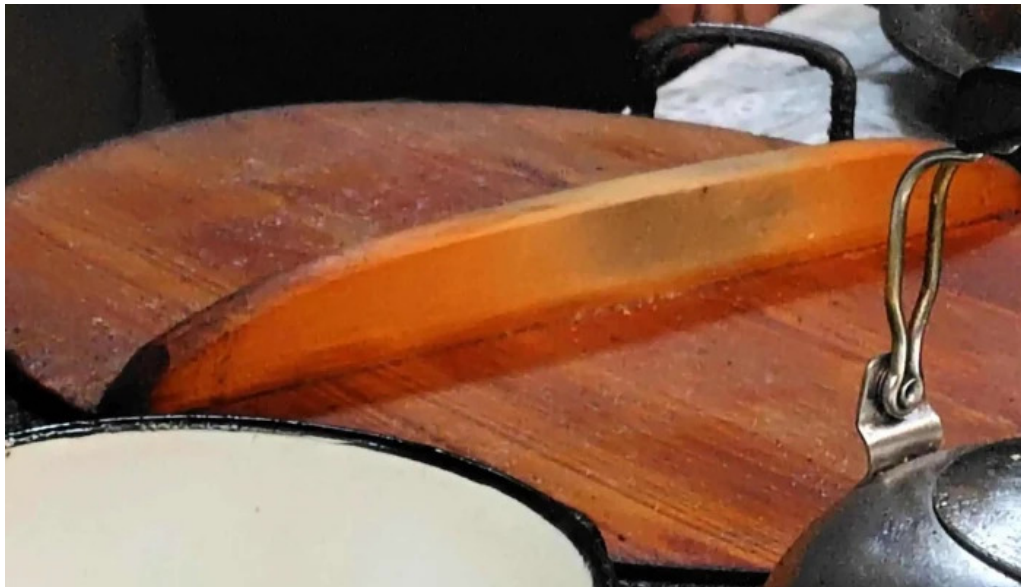
ギョーザ専門店 黒兵衛 延岡 プロモーション