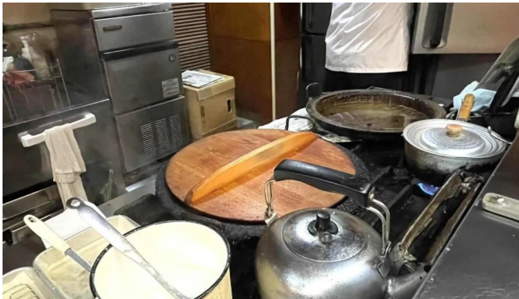
ギョーザ専門店 黒兵衛 延岡 近く