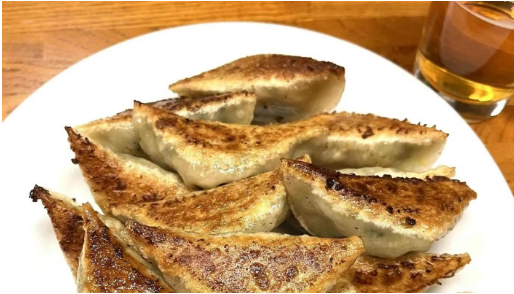
ギョーザ専門店 黒兵衛 延岡 所在地