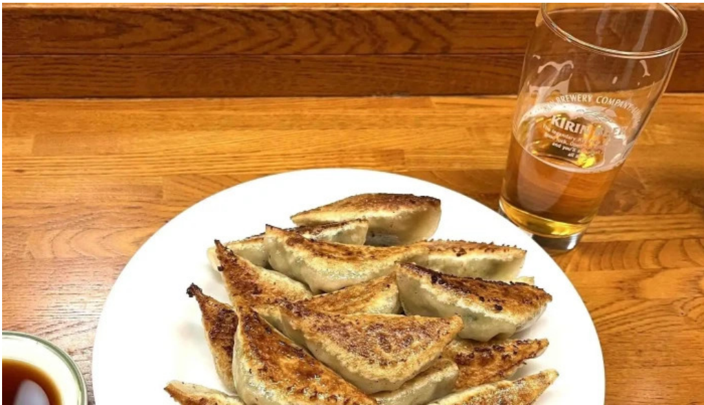
ギョーザ専門店 黒兵衛 延岡 住所