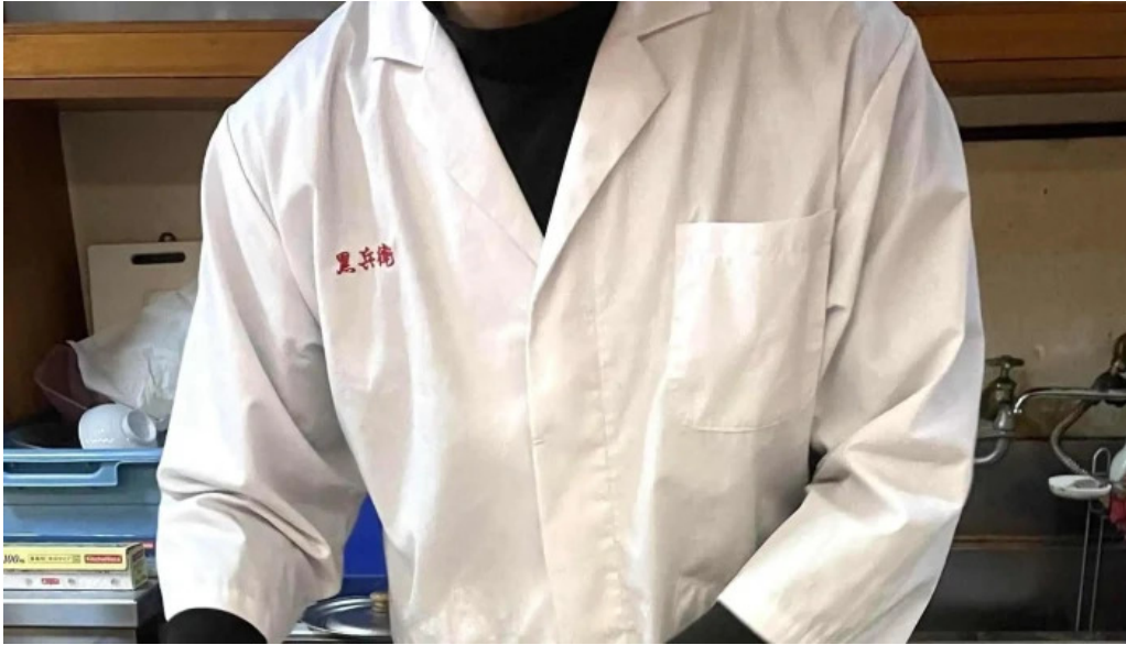
ギョーザ専門店 黒兵衛 延岡 割引