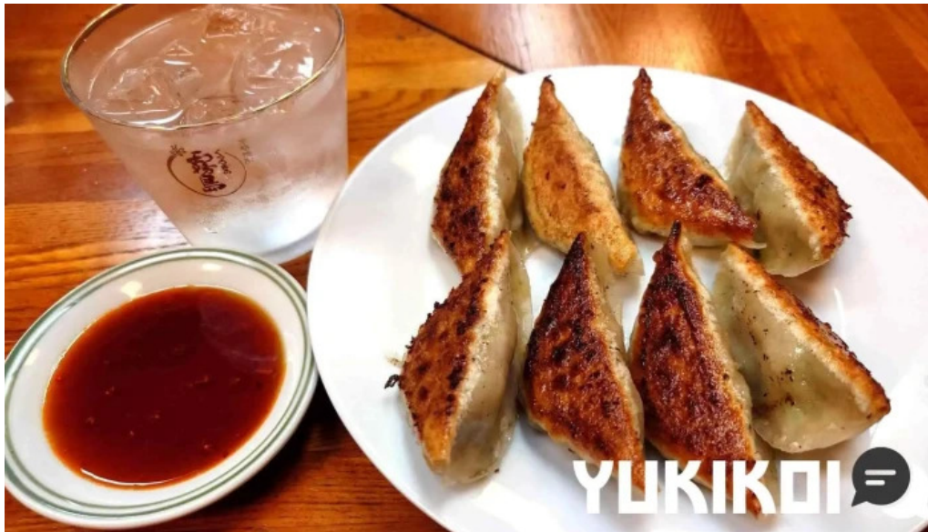
ギョーザ専門店 黒兵衛 延岡 ダンプリング