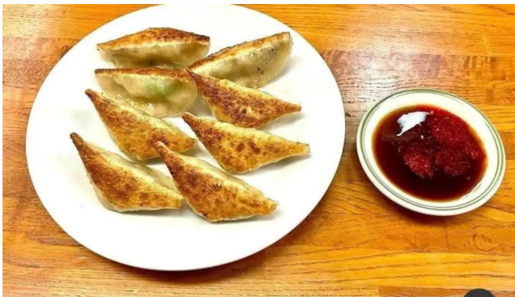
ギョーザ専門店 黒兵衛 延岡 餃子