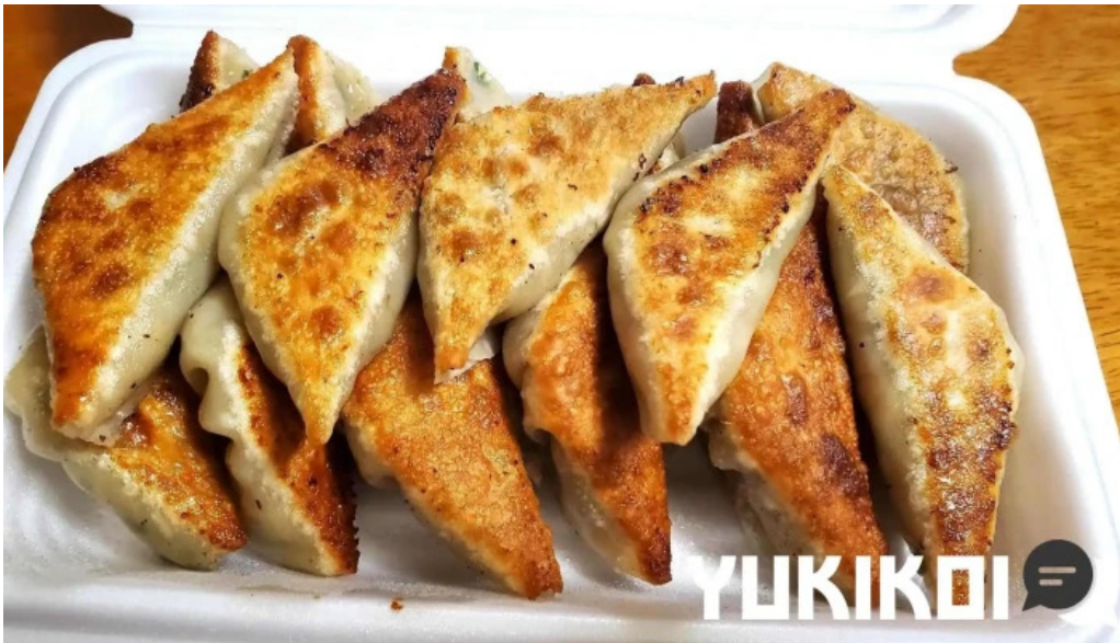
ギョーザ専門店 黒兵衛 延岡 料理飲み物