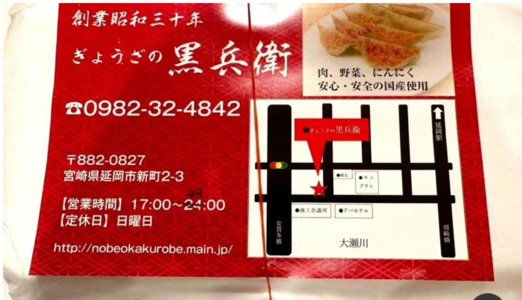
ギョーザ専門店 黒兵衛 延岡 メニュー