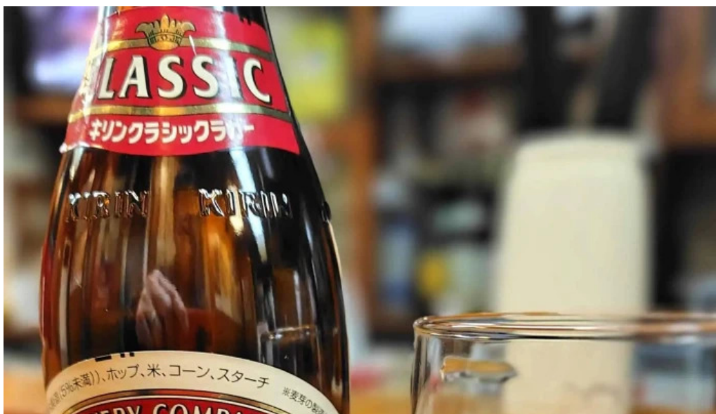
ギョーザ専門店 黒兵衛 延岡 行き方