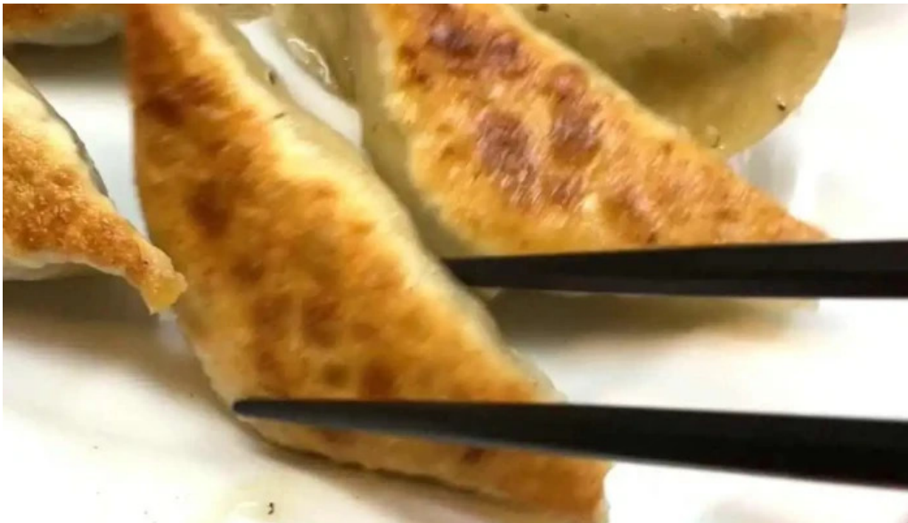
ギョーザ専門店 黒兵衛 延岡 動画