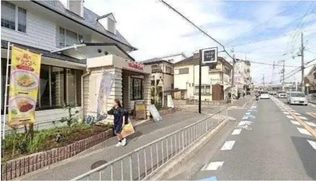
ポムの樹カフェ 枚方店 枚方市