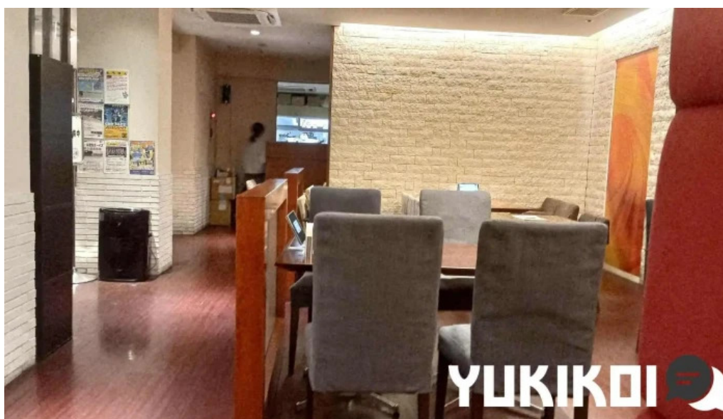
ポムの樹カフェ 枚方店 雰囲気