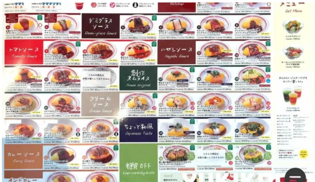
ポムの樹カフェ 枚方店 メニュー