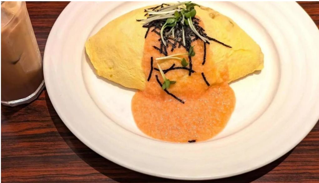
ポムの樹カフェ 枚方店 料金