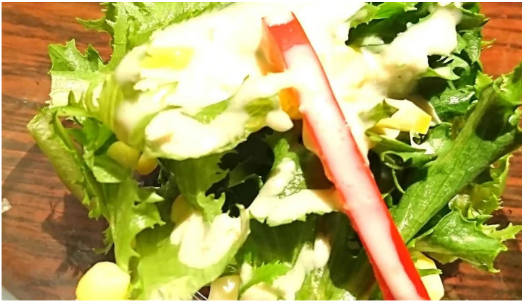
ポムの樹カフェ 枚方店 スコア