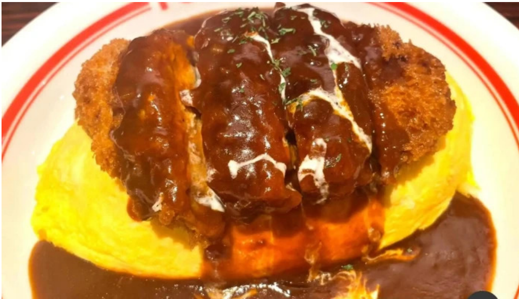
ポムの樹カフェ 枚方店 オムライス