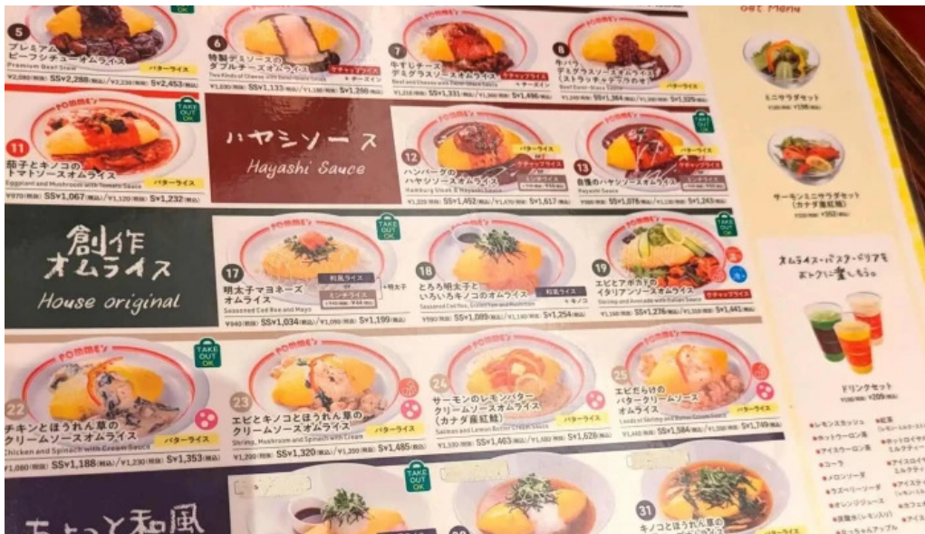
ポムの樹カフェ 枚方店 番号