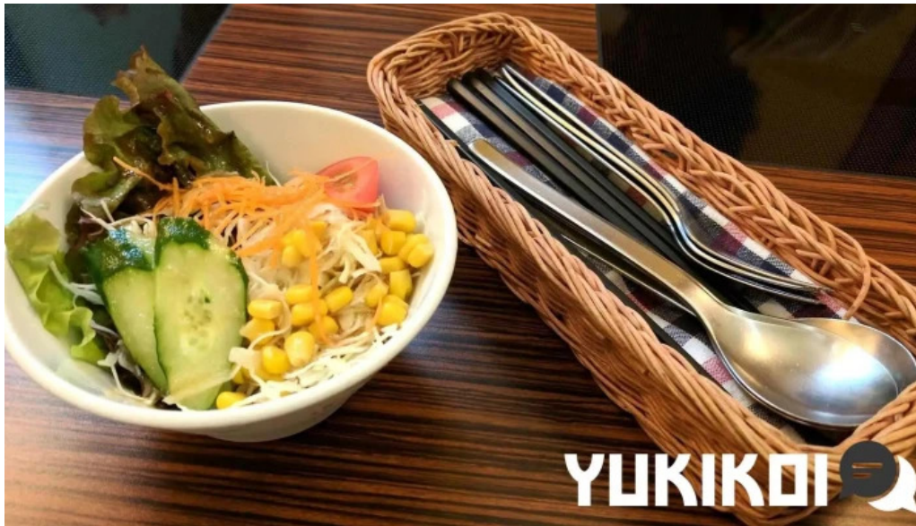
ポムの樹カフェ 枚方店 料理飲み物