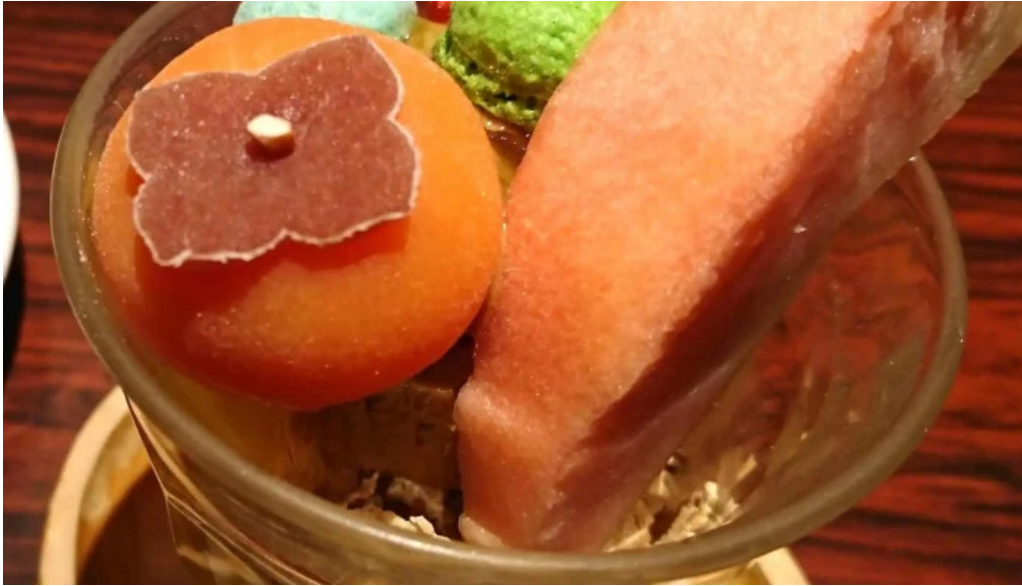
ポムの樹カフェ 枚方店 口コミ