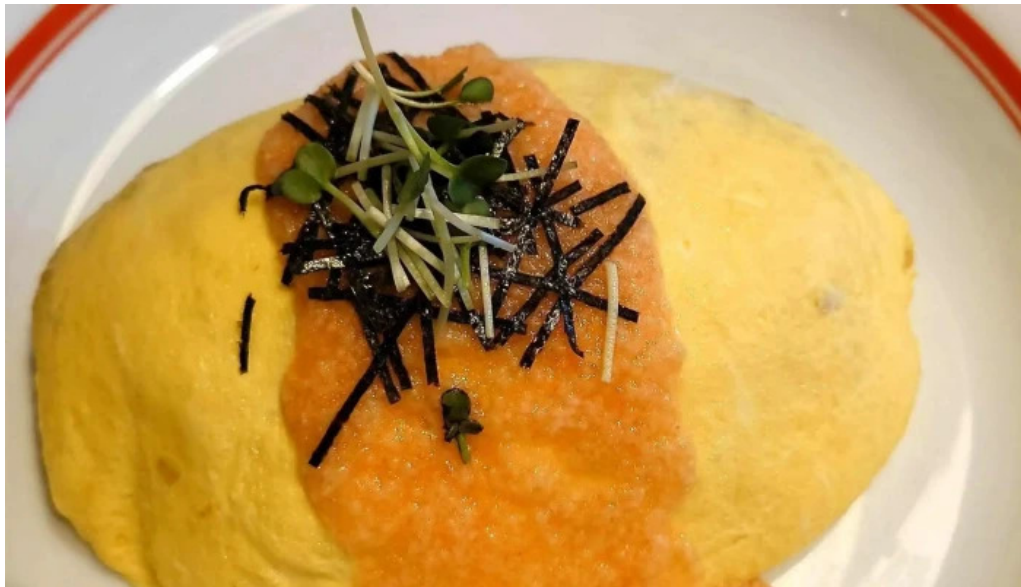
ポムの樹カフェ 枚方店 行き方