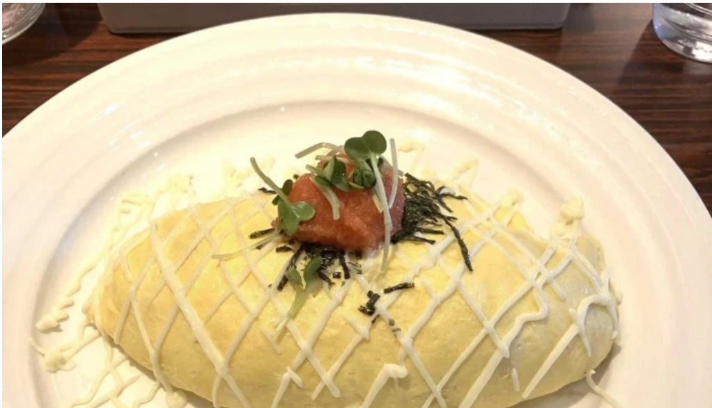
ポムの樹カフェ 枚方店 割引