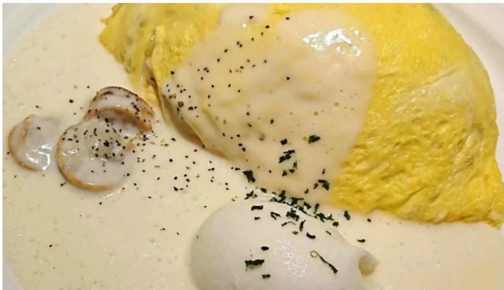
ポムの樹カフェ 枚方店 どこ