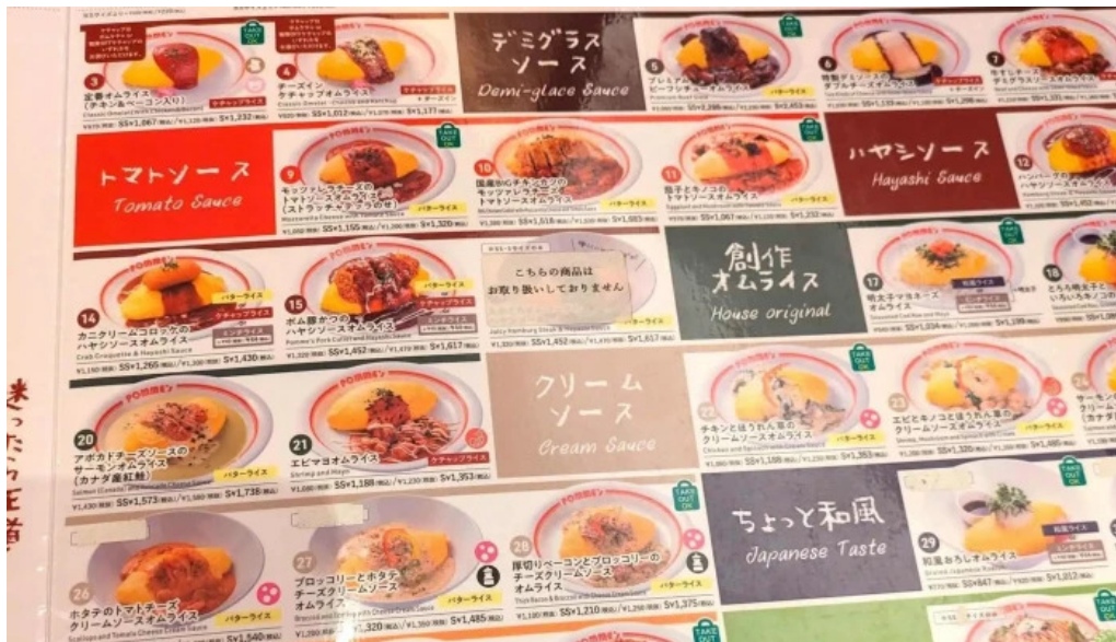
ポムの樹カフェ 枚方店 エリア