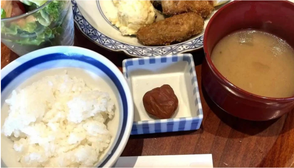
洋食katsui 山の辺の道 最新