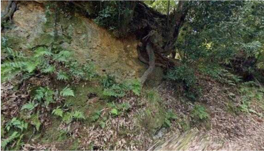
洋食katsui 山の辺の道 天理市