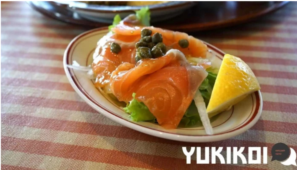
洋食katsui 山の辺の道 料理飲み物