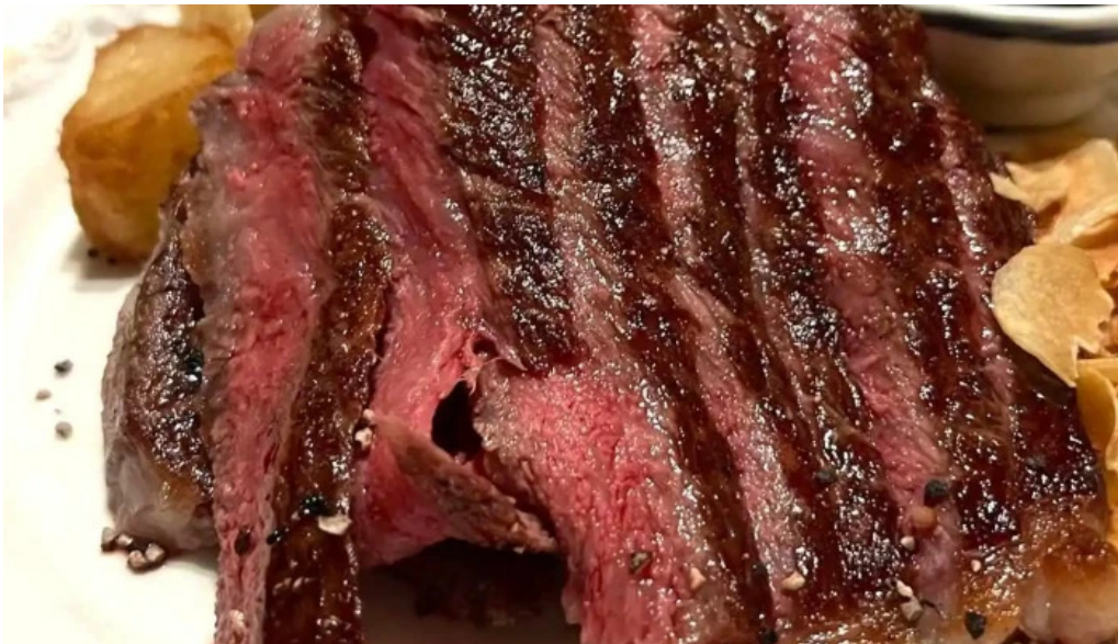
洋食katsui 山の辺の道 フランク