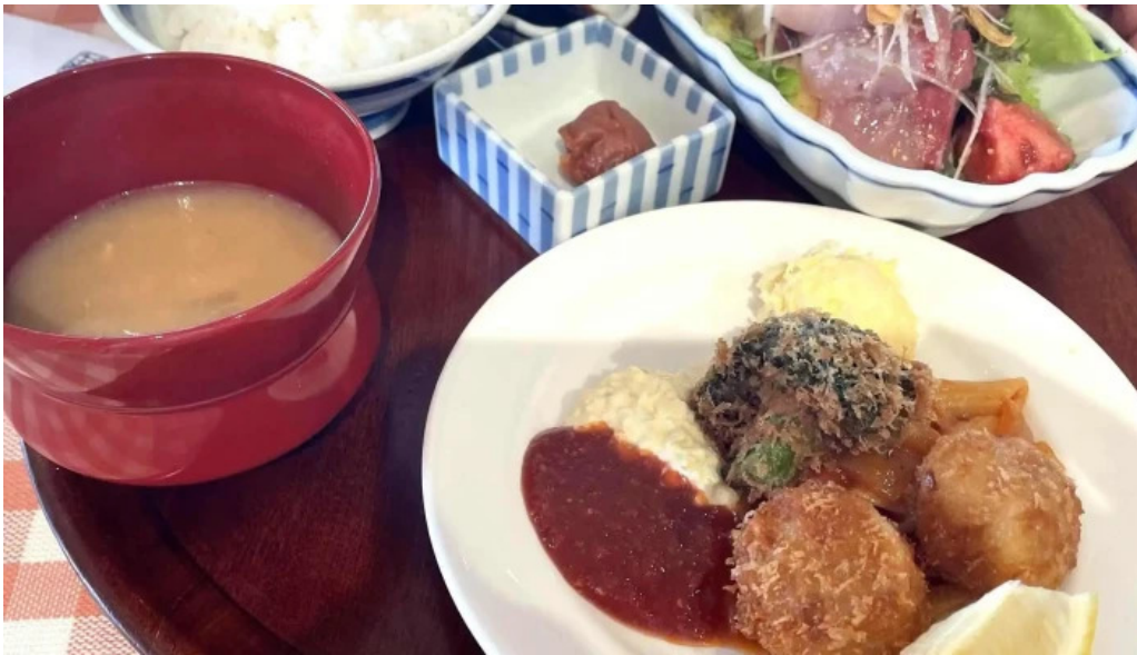
洋食katsui 山の辺の道 エリア