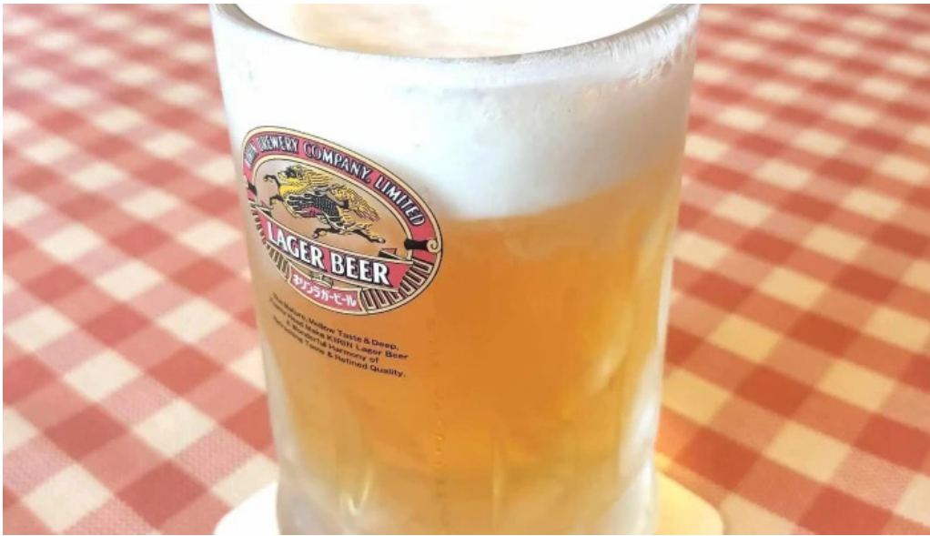
洋食katsui 山の辺の道 ビール