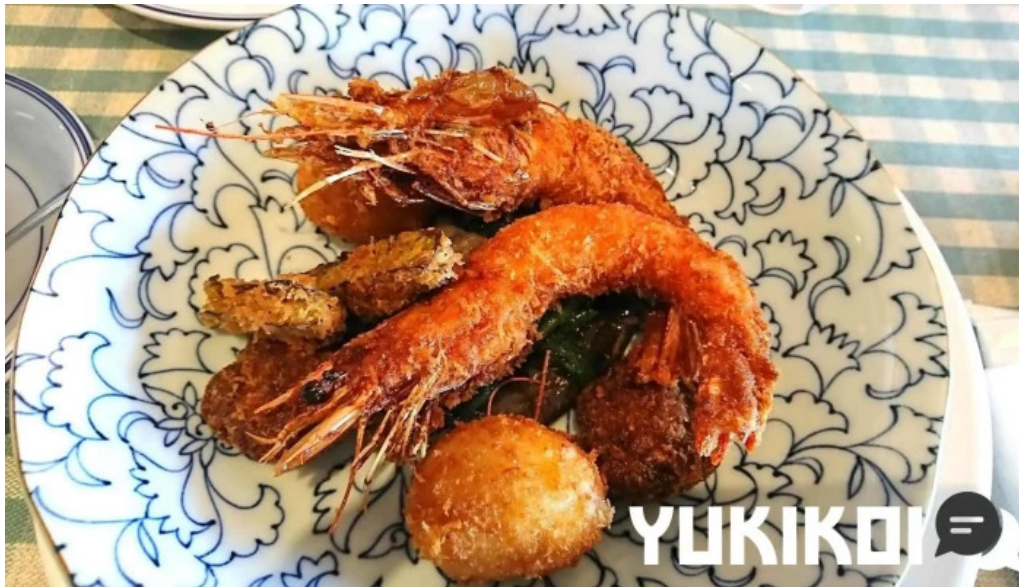
洋食katsui 山の辺の道 エビフライ