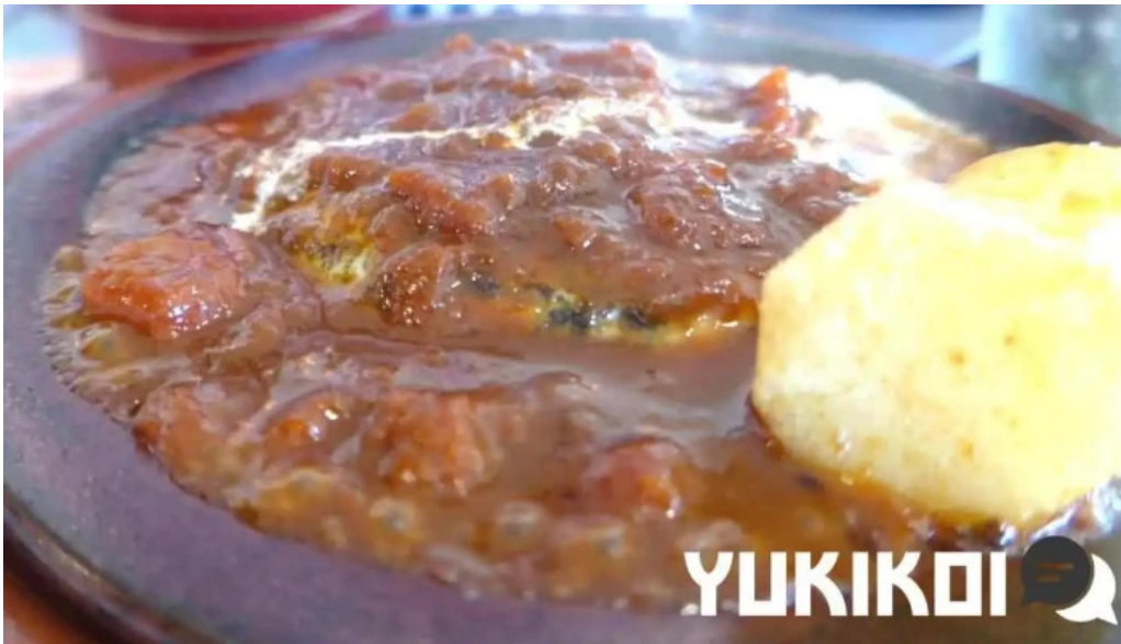
洋食katsui 山の辺の道 動画