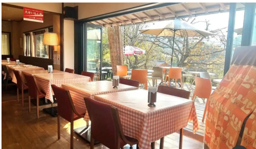
洋食katsui 山の辺の道 雰囲気