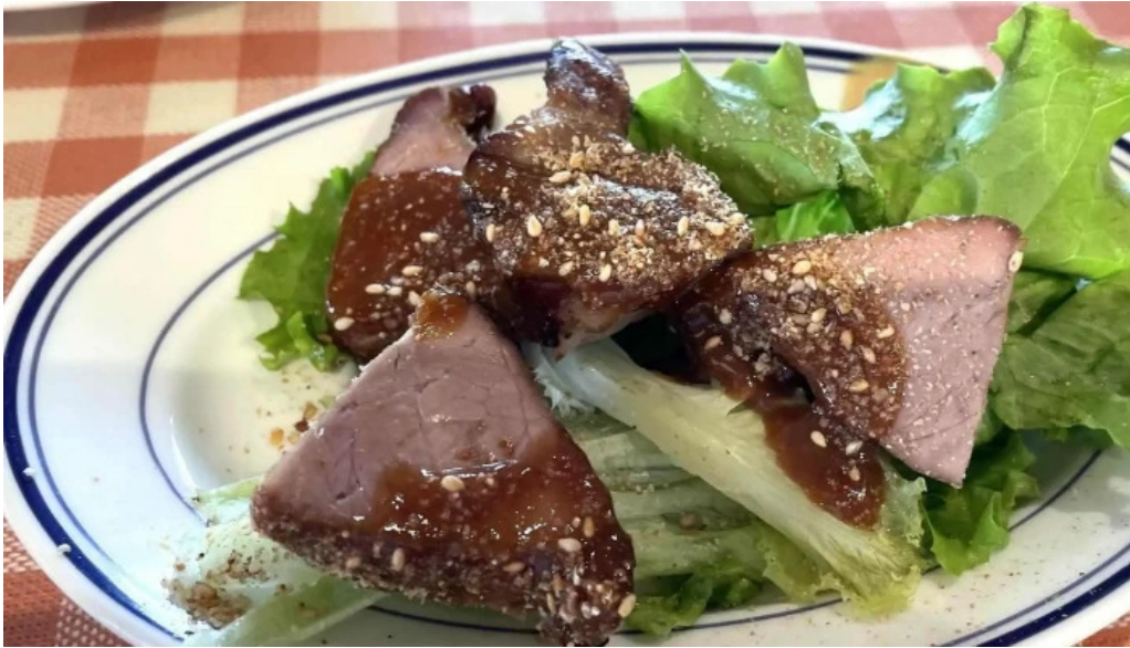
洋食katsui 山の辺の道 営業中