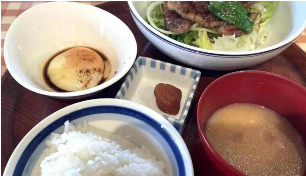
洋食katsui 山の辺の道 カタログ