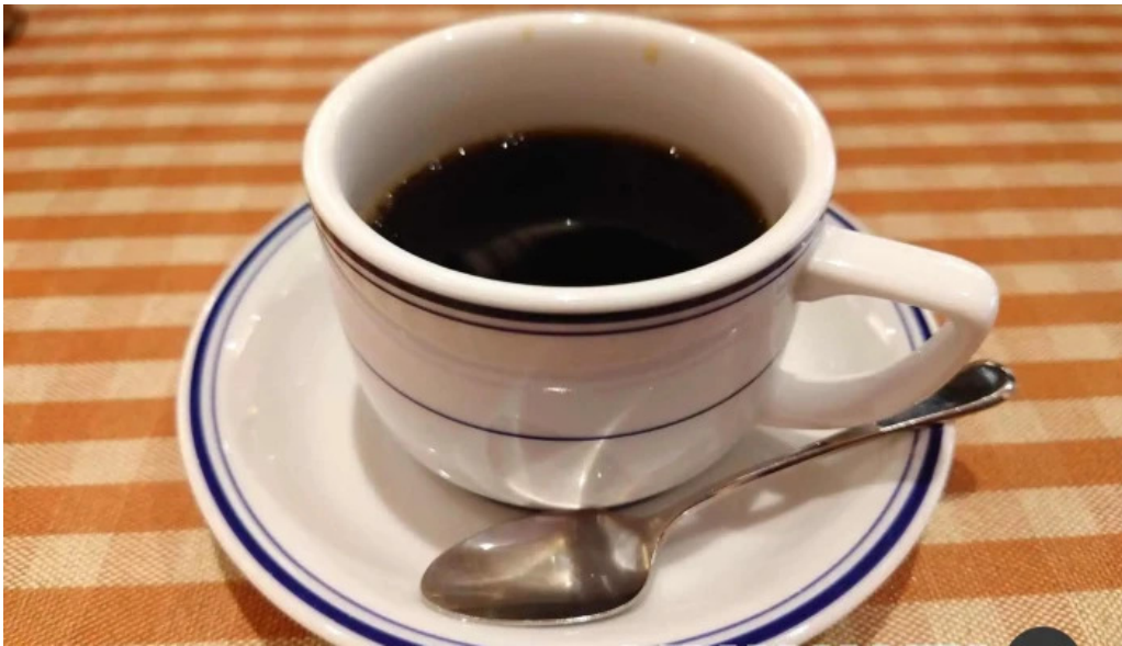
洋食katsui 山の辺の道 コーヒー