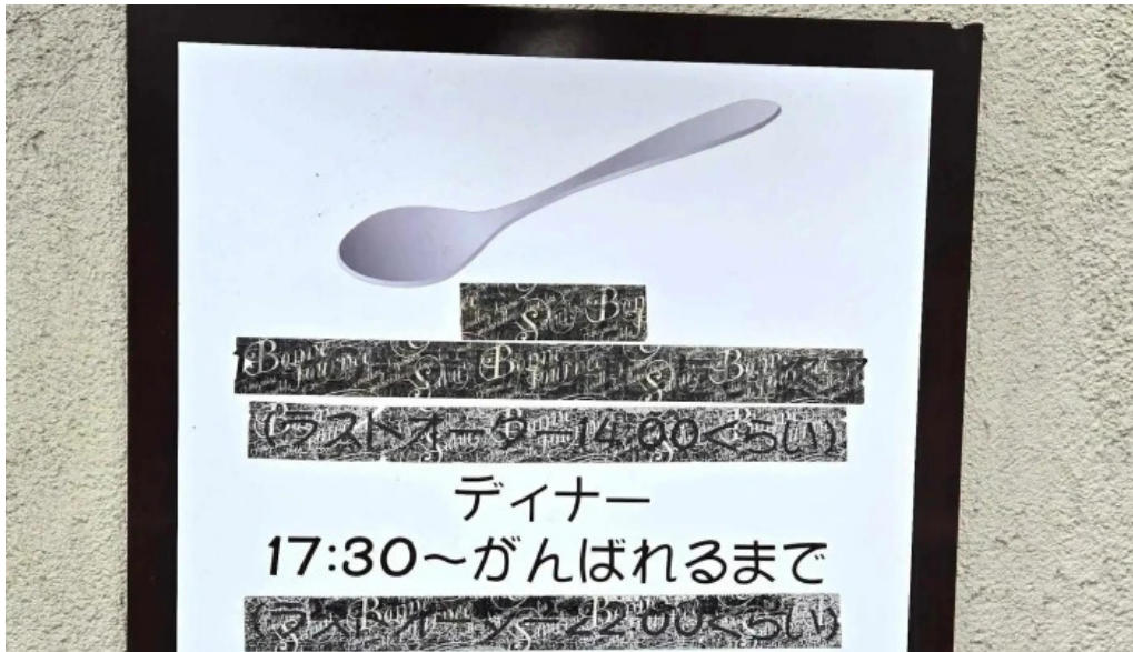
シルバースプーン プロモーション