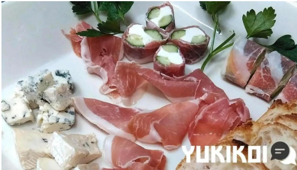
シルバースプーン 料理飲み物