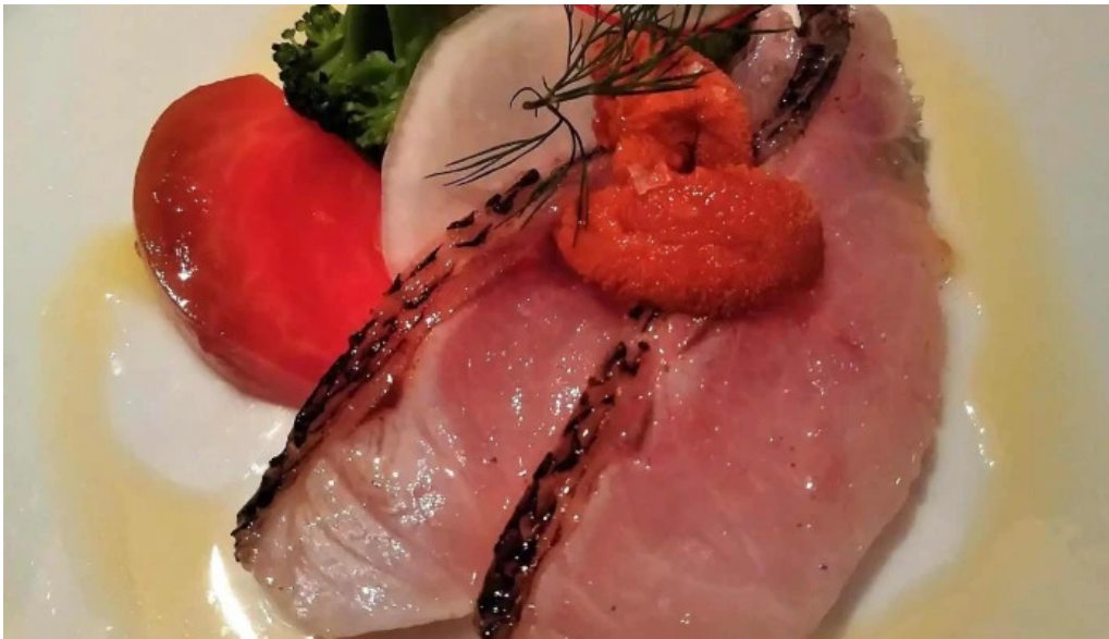
シルバースプーン オーナー提供