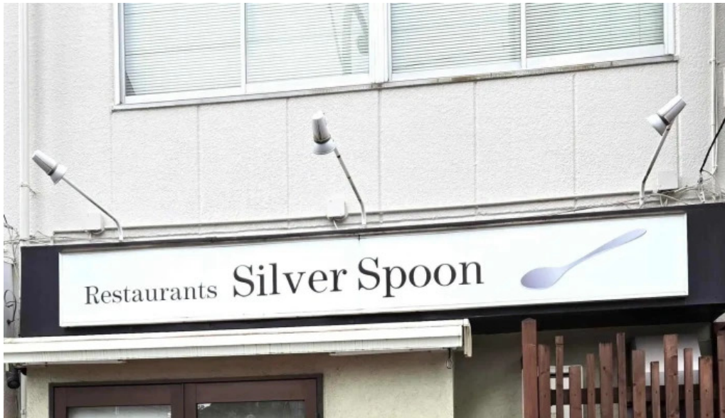
シルバースプーン どこ