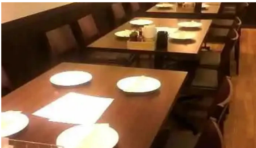
シルバースプーン 雰囲気