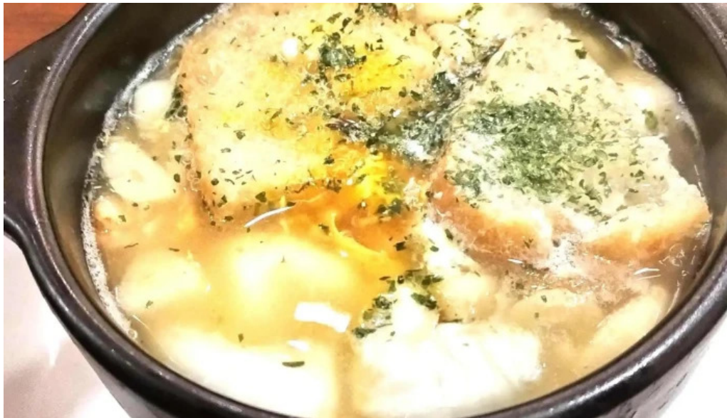
シルバースプーン 料金