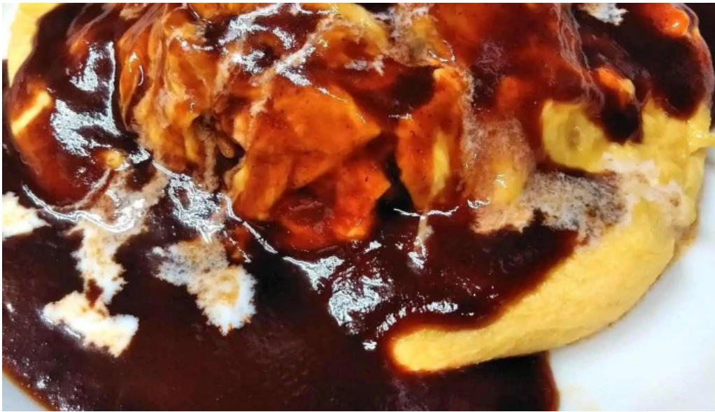
シルバースプーン オムライス