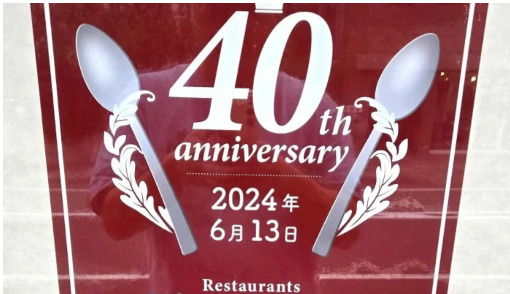
シルバースプーン 営業中