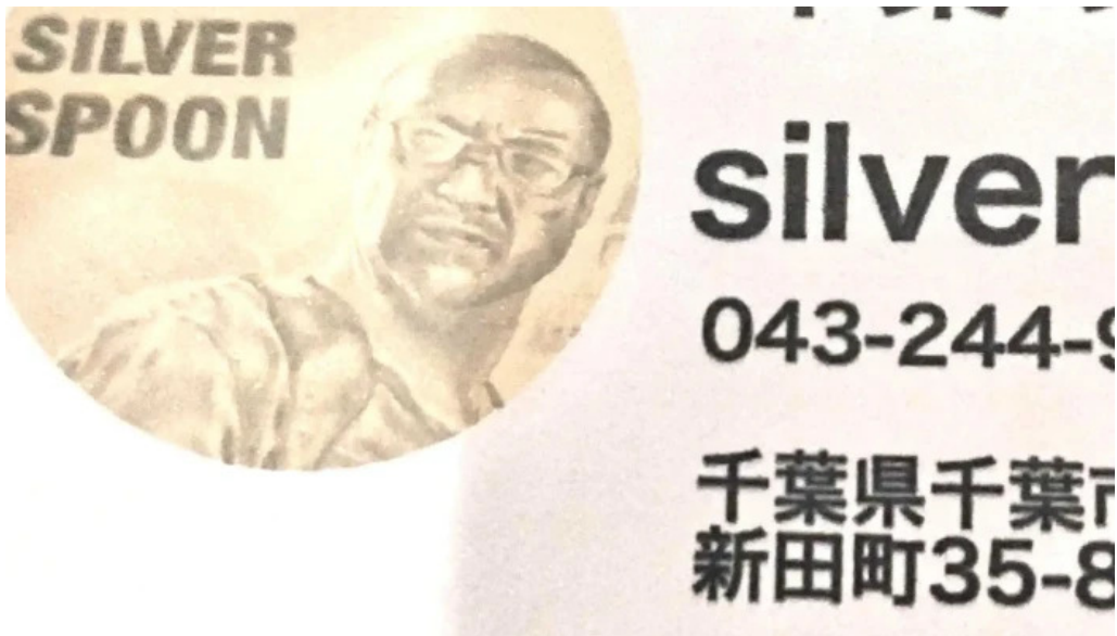
シルバースプーン 動画