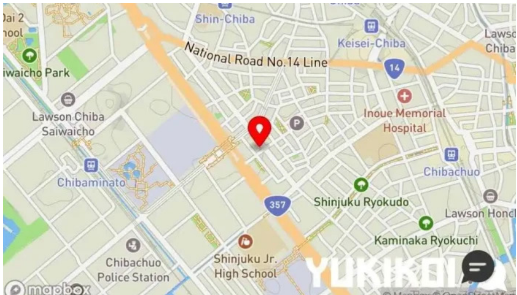
シルバースプーン 地図