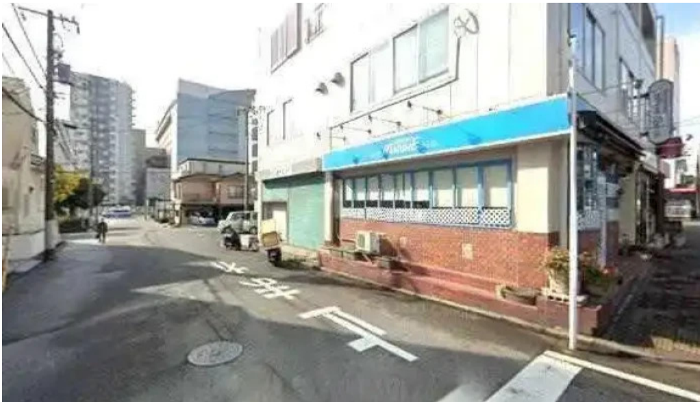
シルバースプーン 千葉市