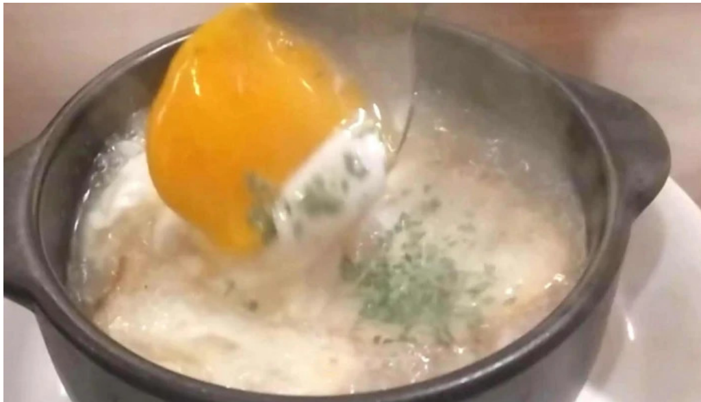
シルバースプーン 所在地