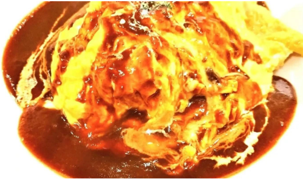
シルバースプーン エリア