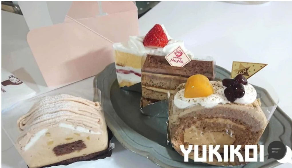
ケーキハウスナナ ケーキ