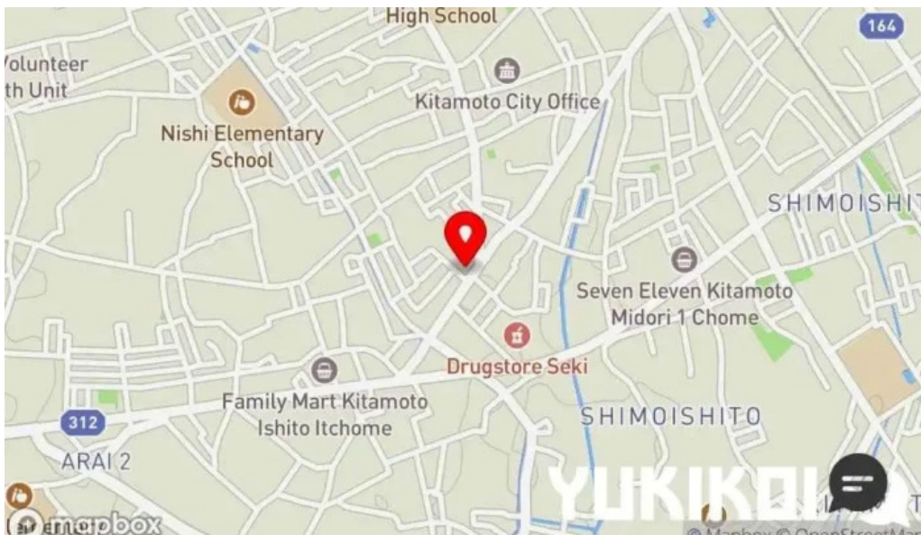
ケーキハウスナナ 地図