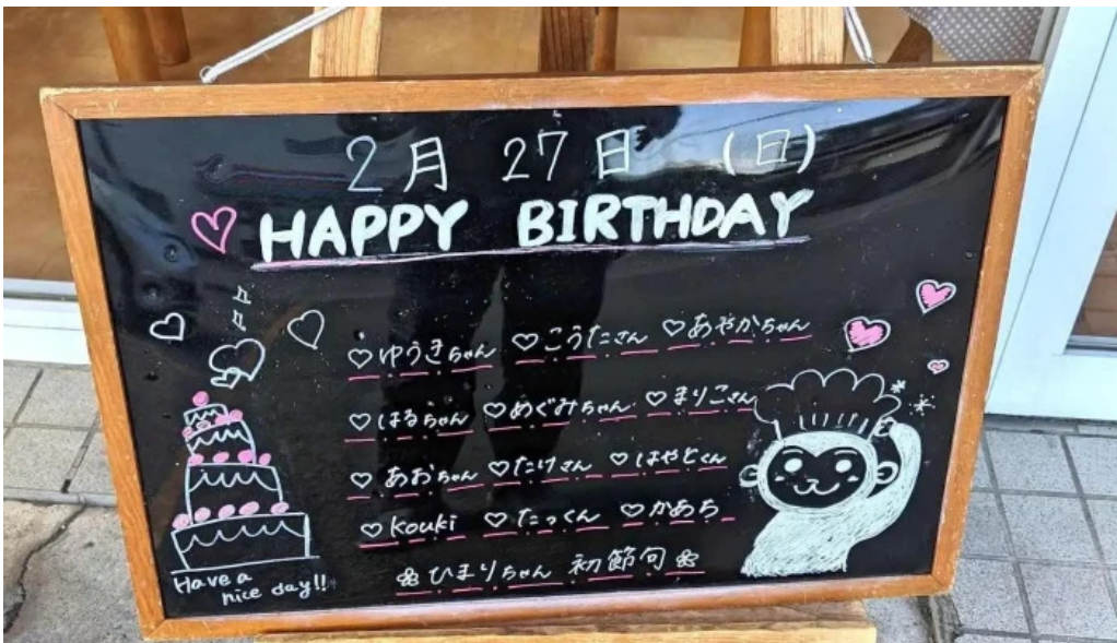
ケーキハウスナナ メニュー