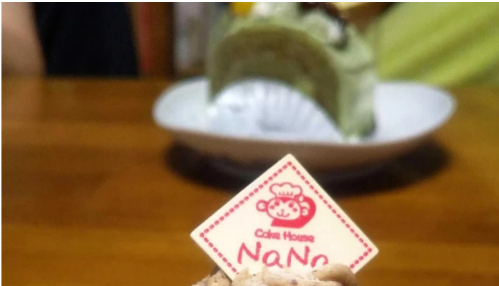
ケーキハウスナナ プロモーション