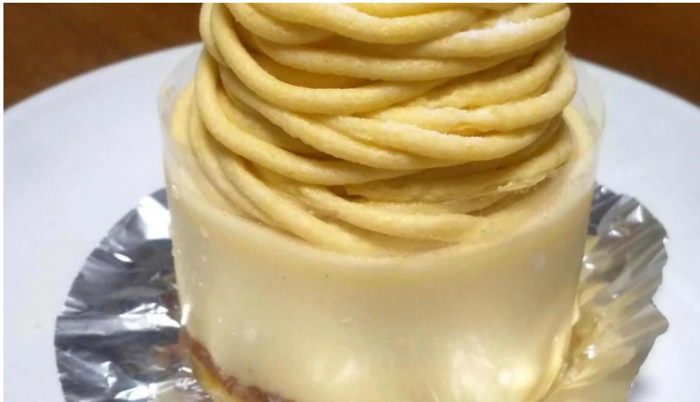
ケーキハウスナナ エリア