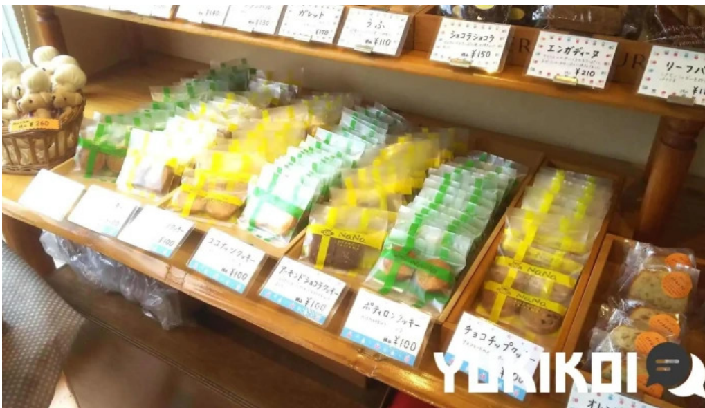
ケーキハウスナナ 料理飲み物