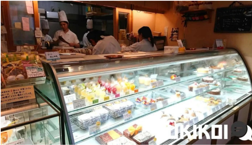
ケーキハウスナナ 焼く