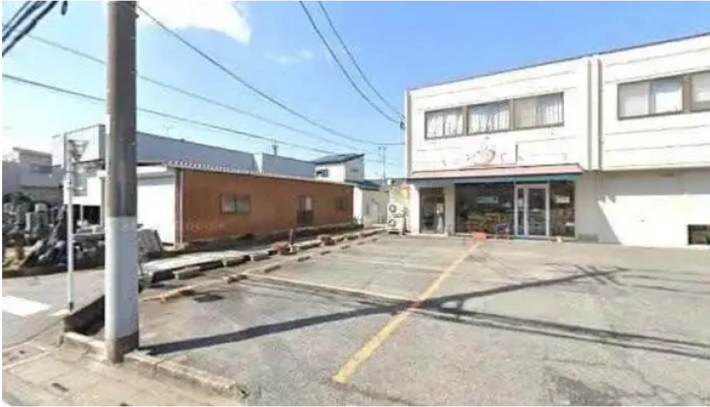
ケーキハウスナナ 北本市