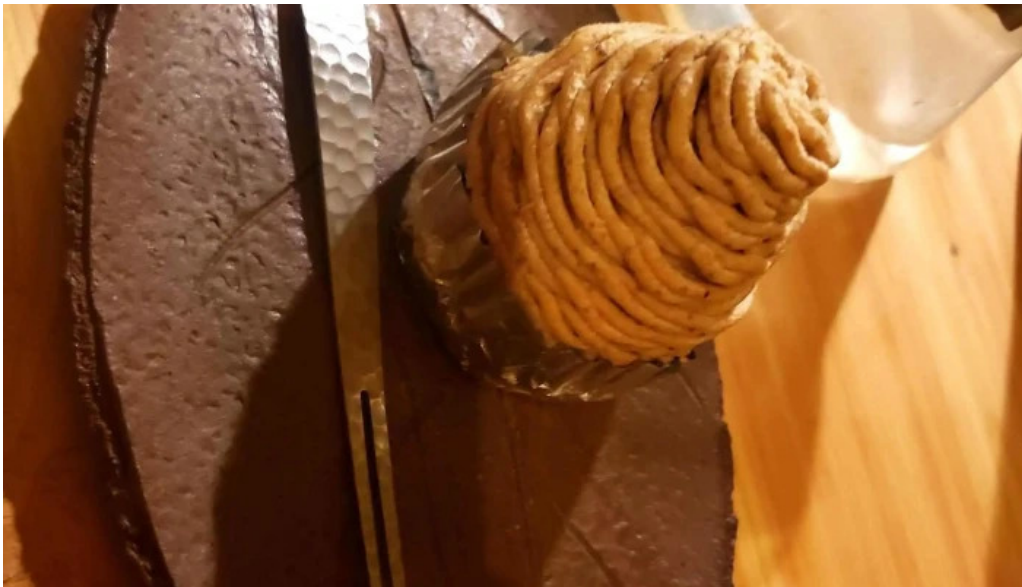
ケーキハウスナナ スコア