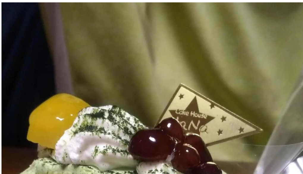
ケーキハウスナナ どこ