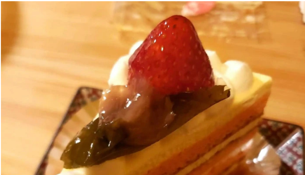
ケーキハウスナナ 住所