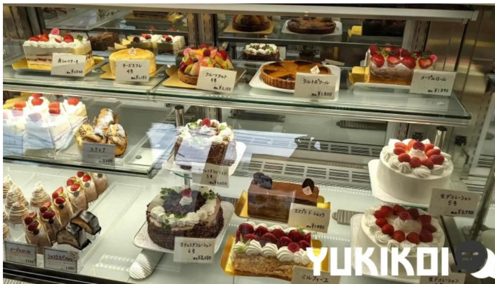
ケーキハウスナナ 霧田気