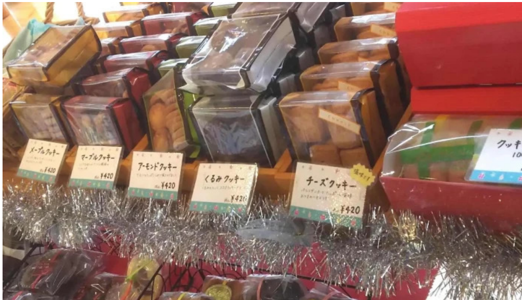
ケーキハウスナナ 所在地