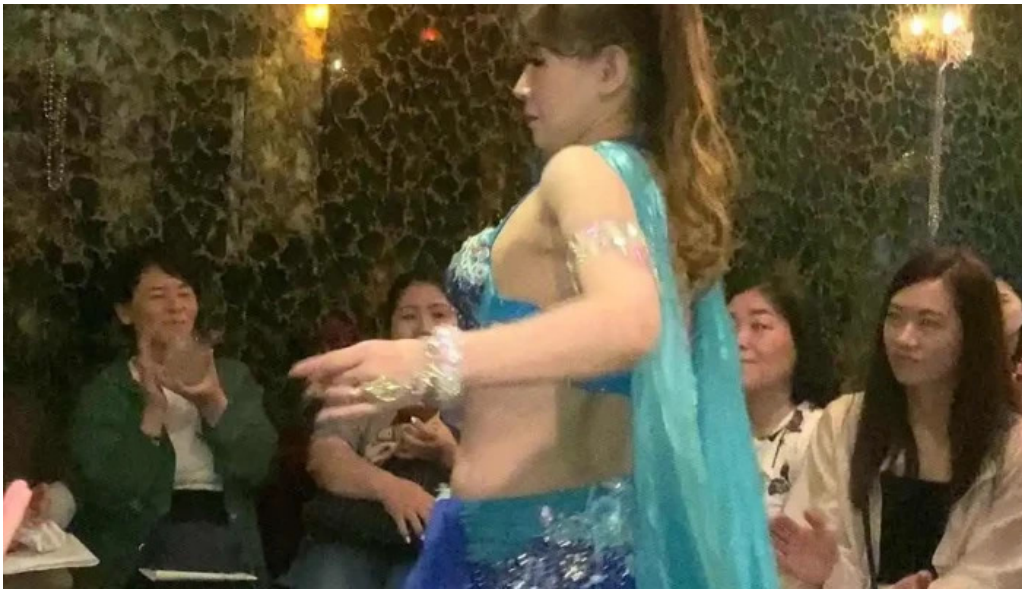
Cafe istanbul シーシャカフェイスタンプル 最新