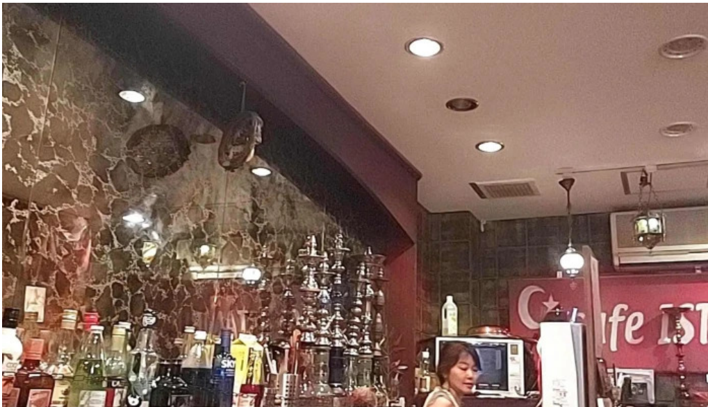
Cafe istanbul シーシャカフェイスタンブールスコア