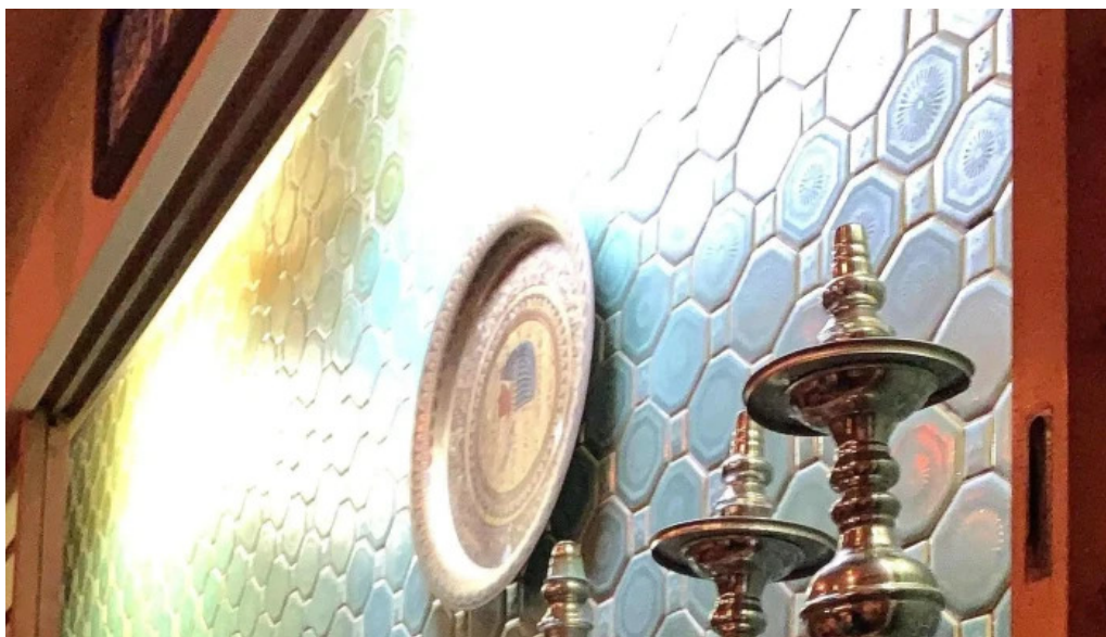
Cafe istanbul シーシャカフェイスタンプル ウェブサイト