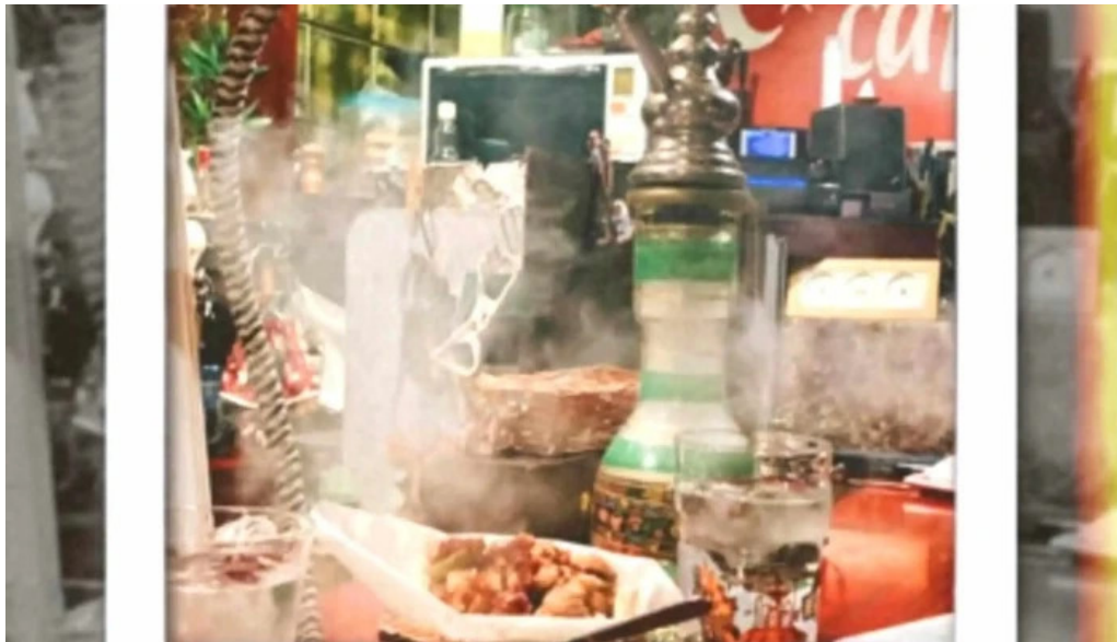
Cafe istanbul シーシャカフェイスタンブール 電話