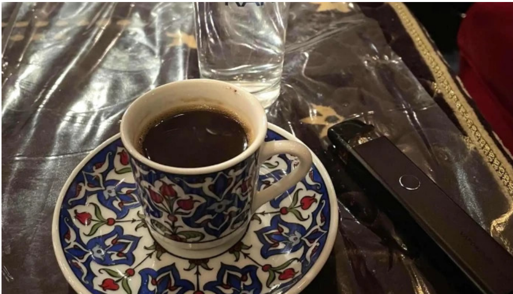
Cafe istanbul シーシャカフェイスタンプル 近く