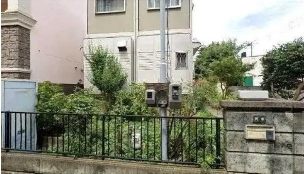
Cafe istanbul シーシャカフェイスタンプル 枚方市