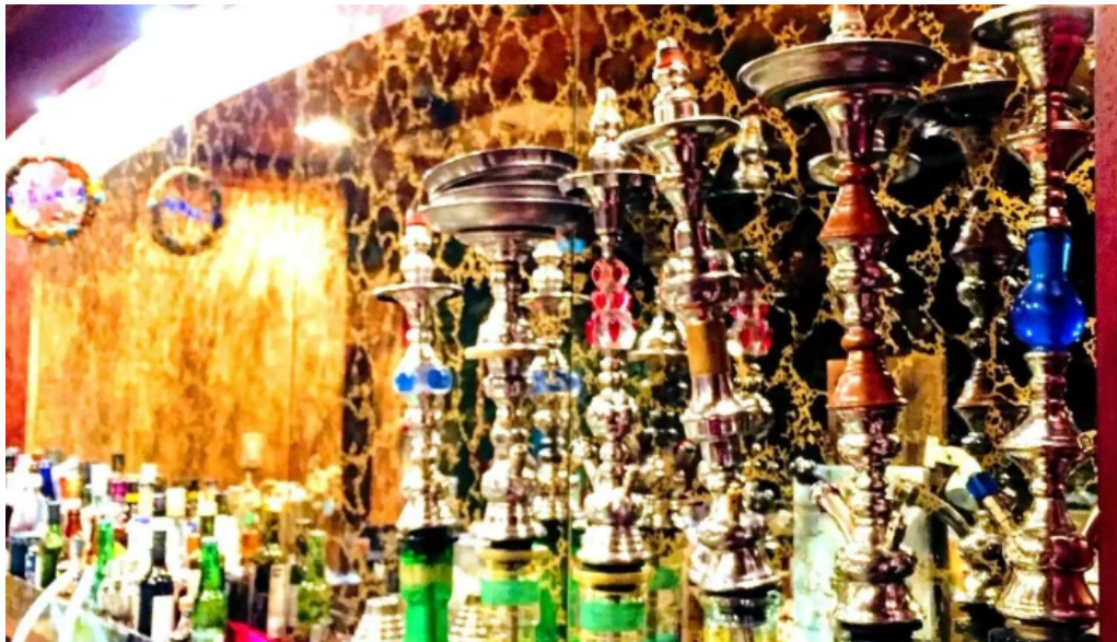
Cafe istanbul シーシャカフェイスタンプル 料理飲み物