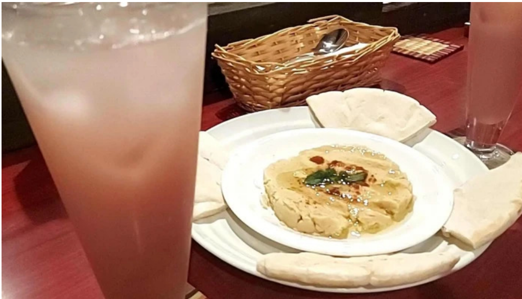
Cafe istanbul シーシャカフェイスタンブール カタログ