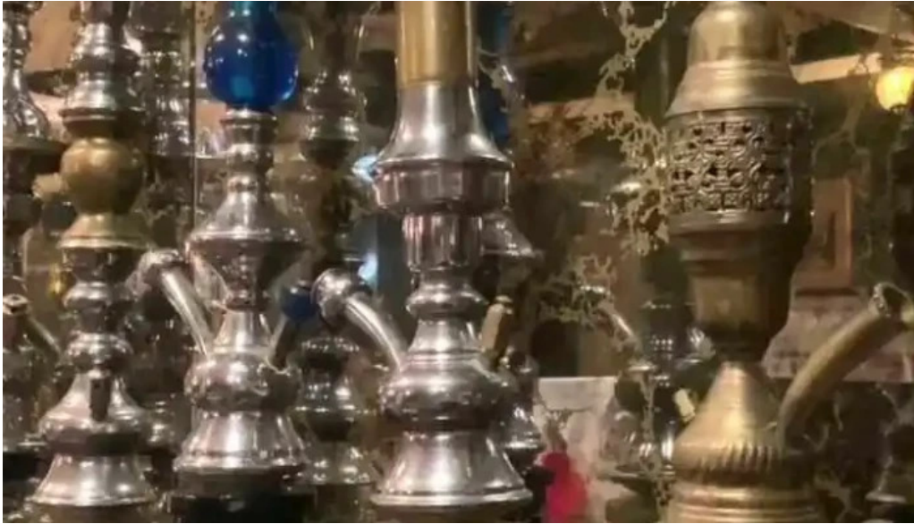
Cafe istanbul シーシャカフェイスタンプル 雰囲気