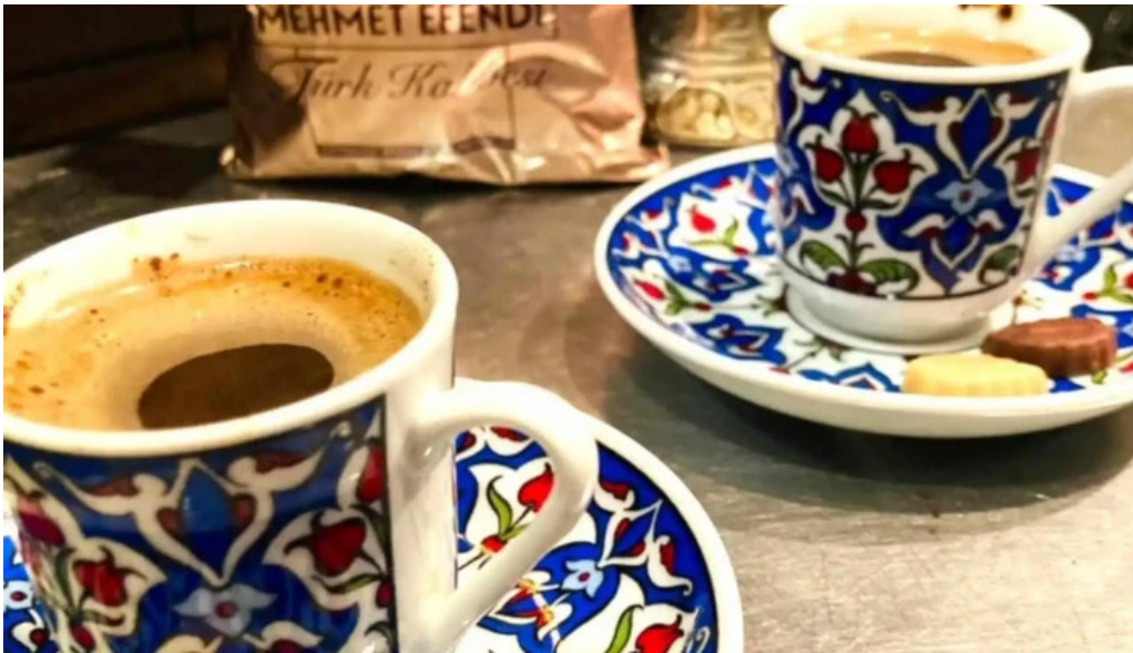
Cafe istanbul シーシャカフェイスタンブール