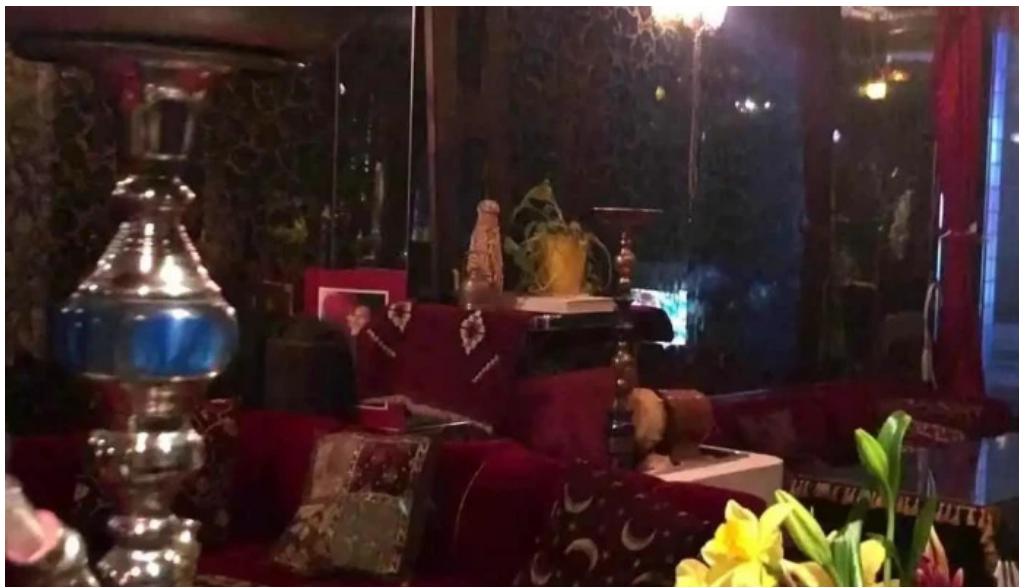
Cafe istanbul シーシャカフェイスタンプル 動画