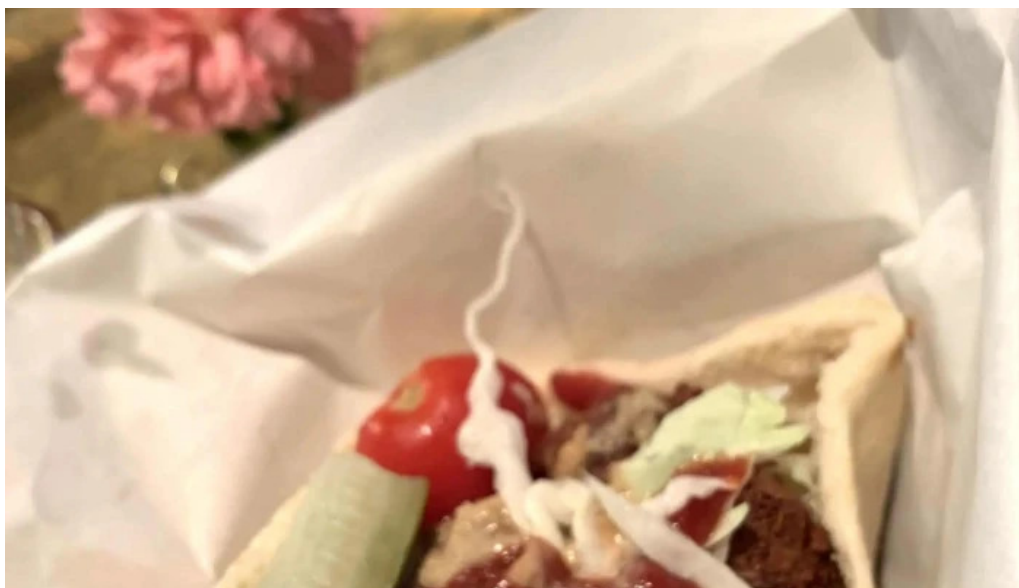
Cafe istanbul シーシャカフェイスタンプル instagram