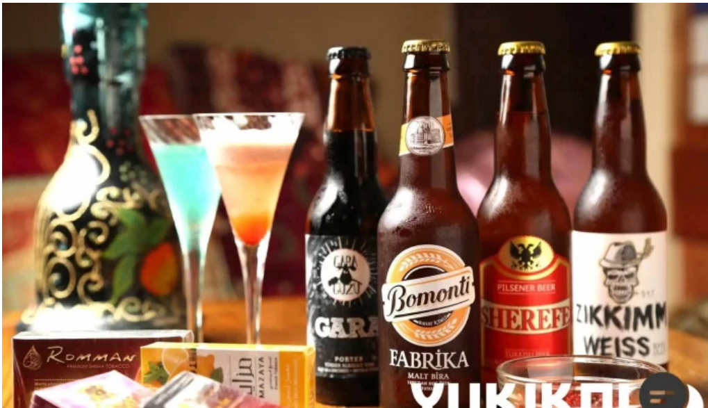
Cafe istanbul シーシャカフェイスタンブールビール