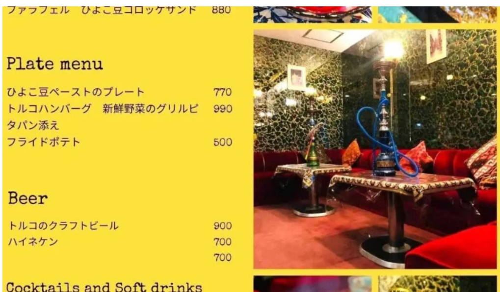
Cafe istanbul シーシャカフェイスタンプル メニュー