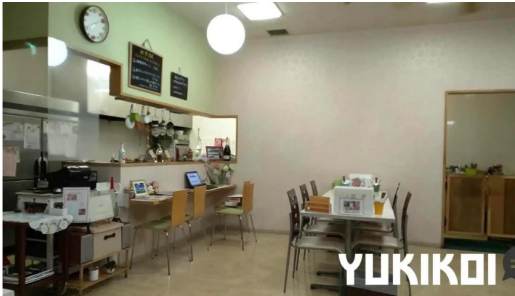
Arukadeia Fen Wei Qi