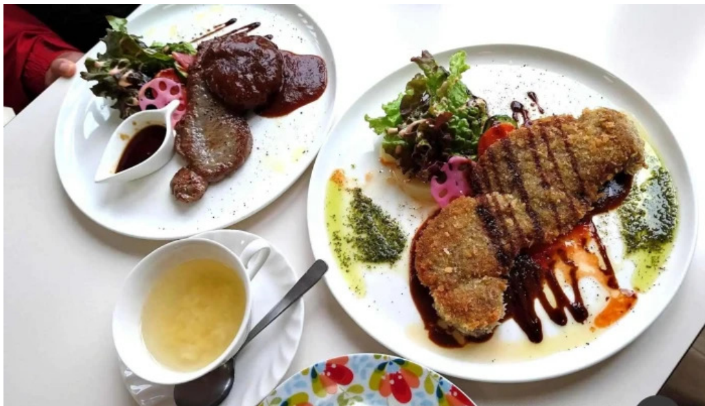
Arukadeia Liao Li Yin miWu