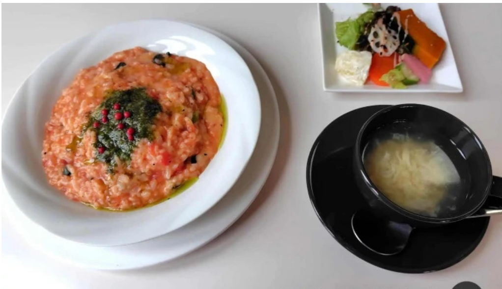
Arukadeia Zui Xin