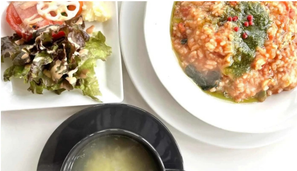
Arukadeia comentario 1