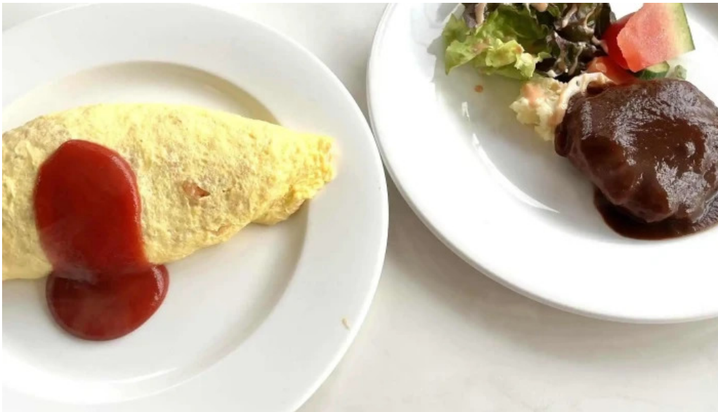
Arukadeia comentario 3