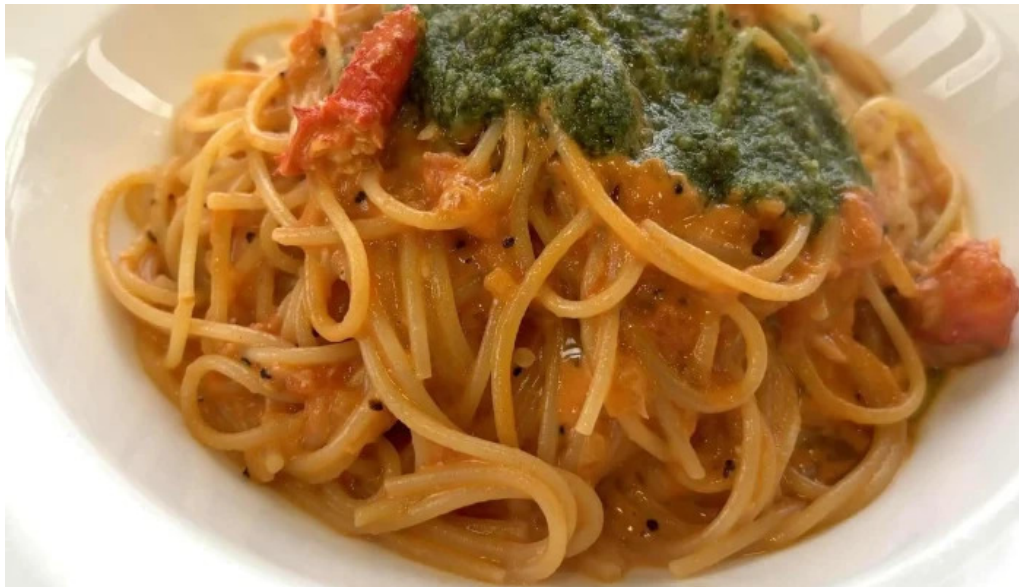
Arukadeia comentario 4