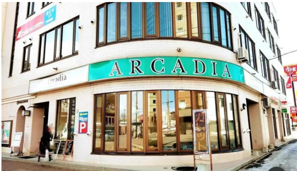
アルカディア 網走市