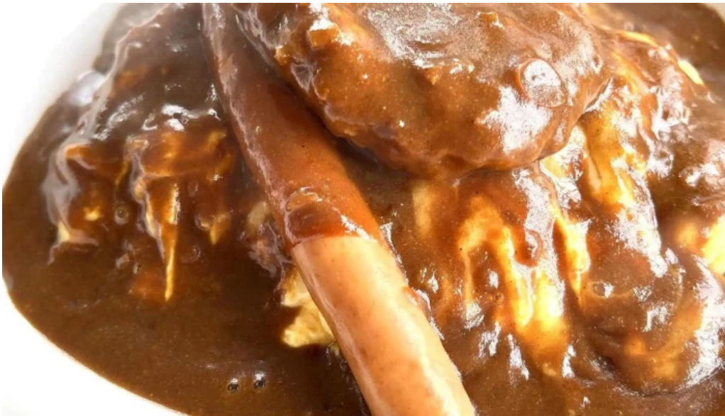
Arukadeia comentario 2