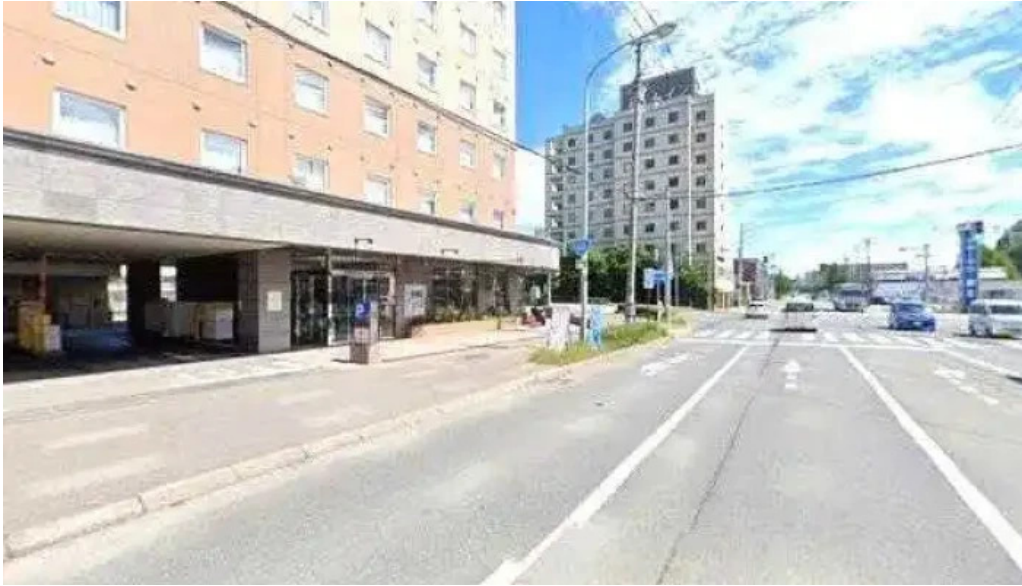
Arukadeia sutori tobiyu to 360 biyu