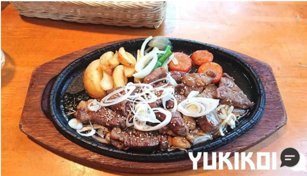
レストラン萩 ステーキ