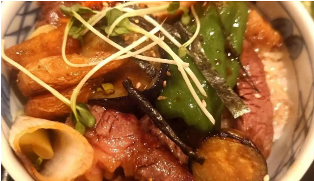
レストラン萩 丼物