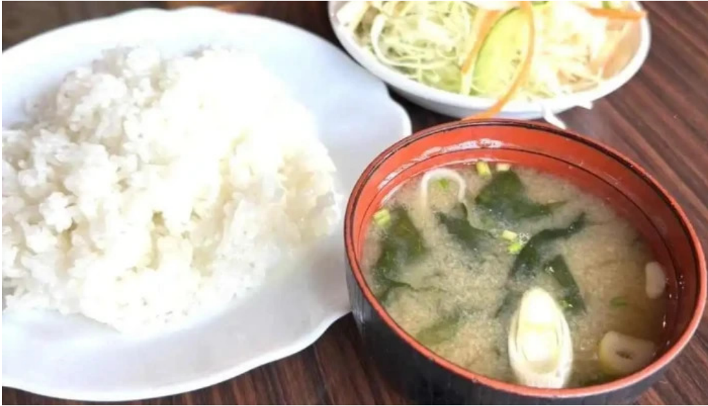
レストラン萩 スープ