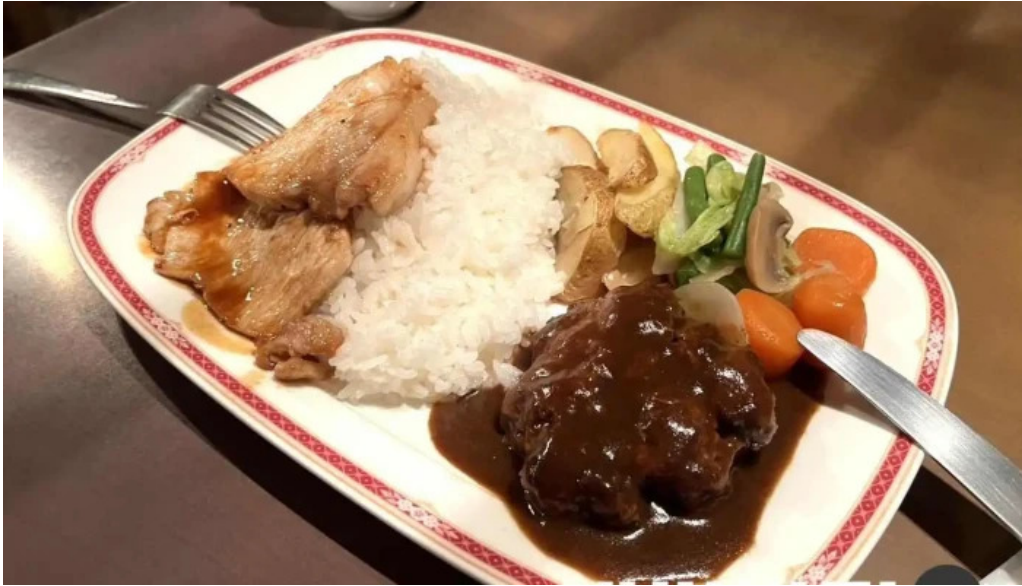
レストラン萩 豚カツ