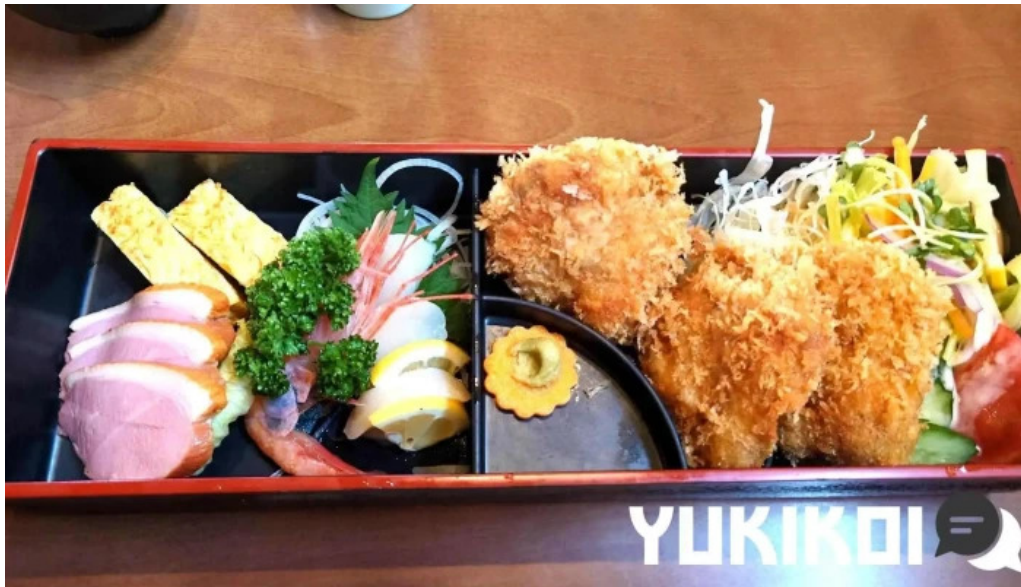
レストラン萩 弁当