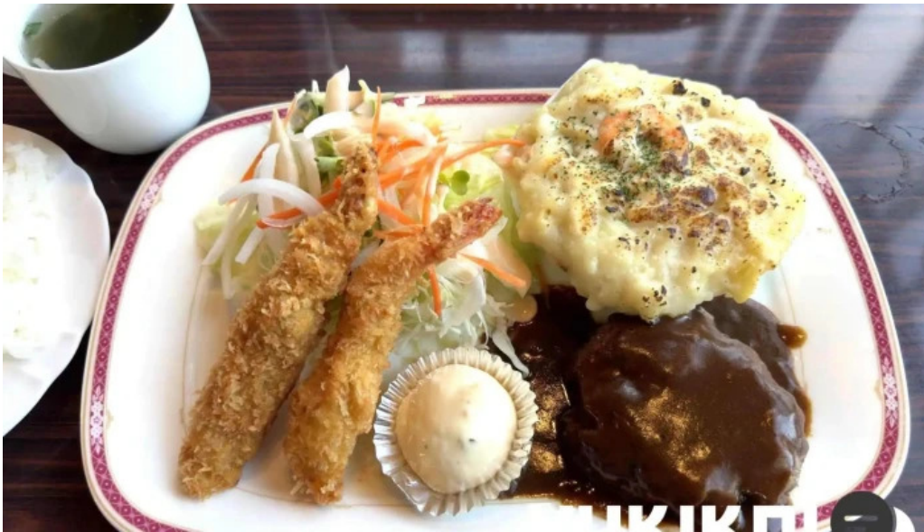
レストラン萩 料理飲み物