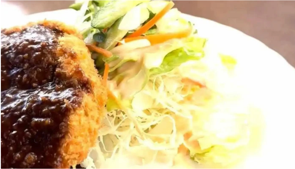
レストラン萩 動画