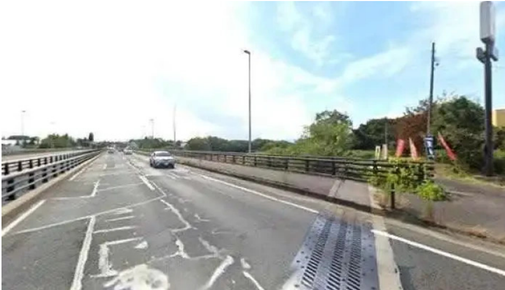
レストラン萩 本宮市