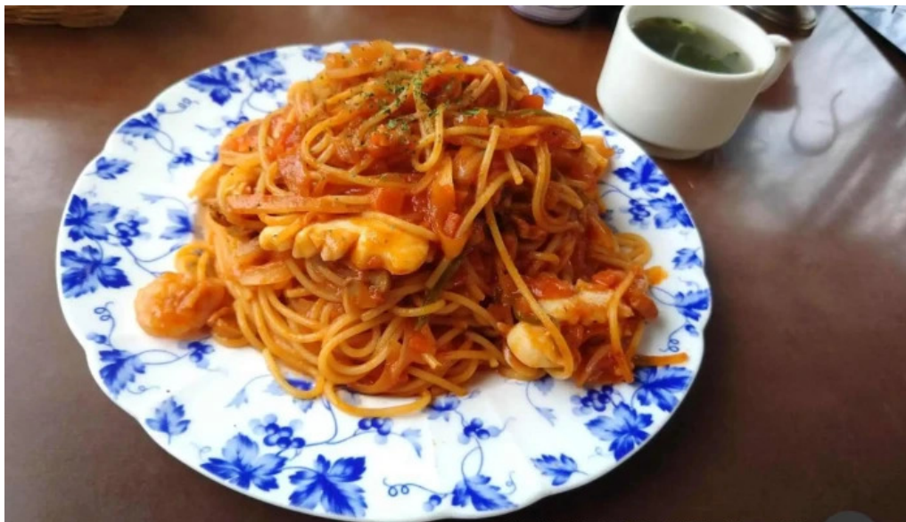
レストラン萩 ナポリタン