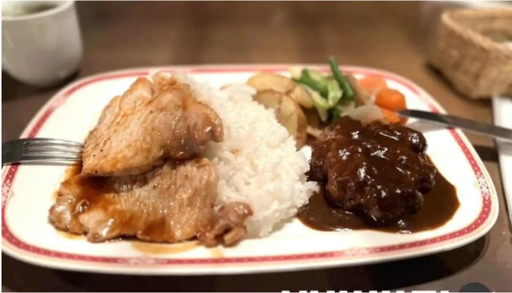
レストラン萩 最新