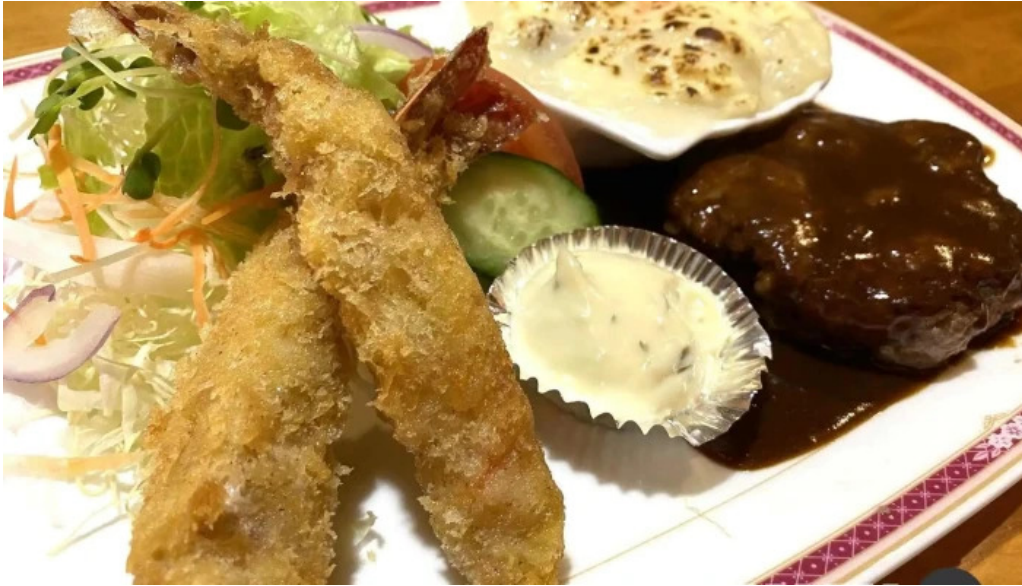
レストラン菰 エビフライ