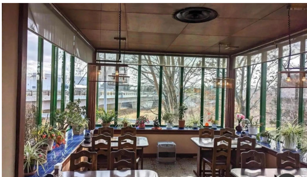
レストラン萩 雰囲気