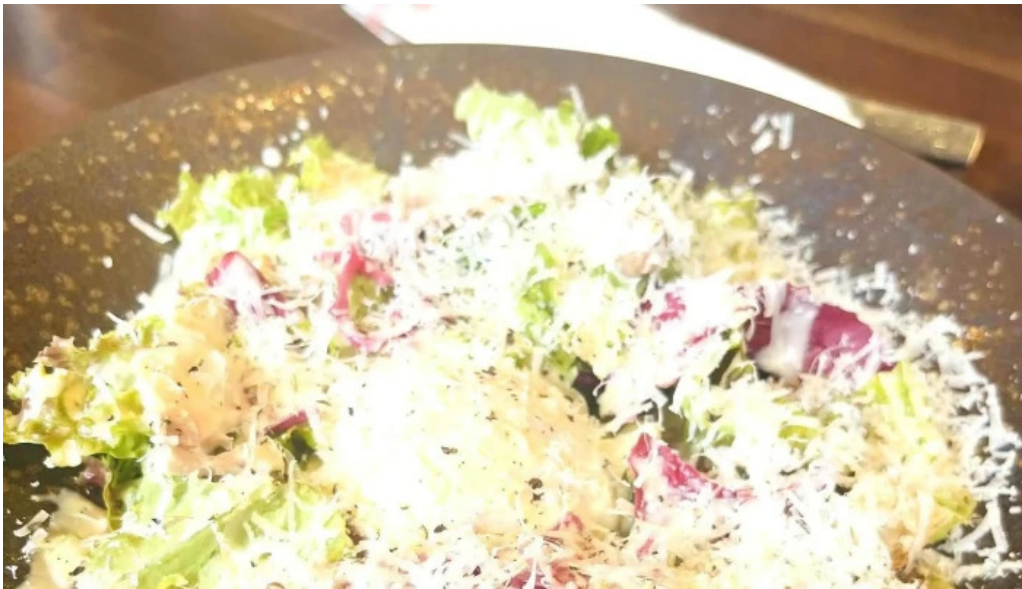
洋食 sugano スコア