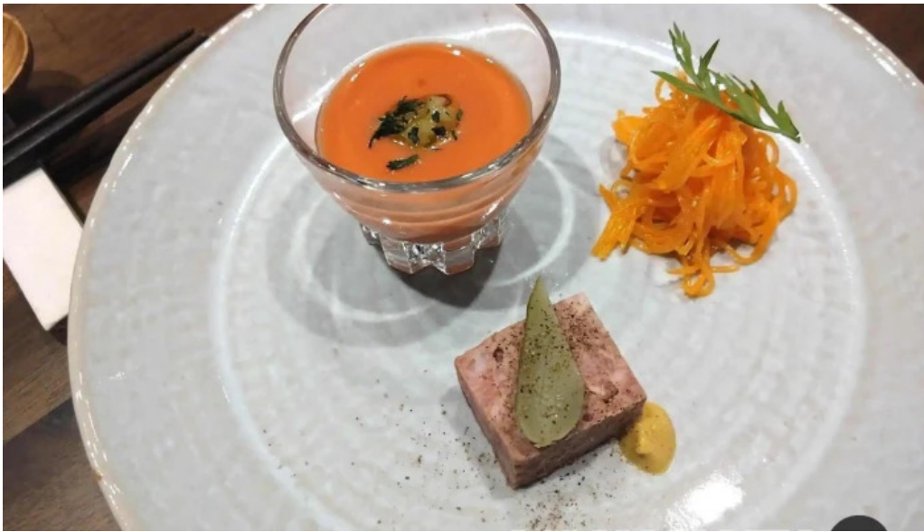
洋食 sugano スープ