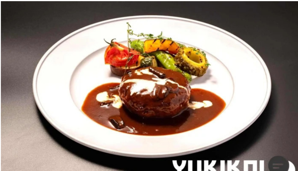
洋食 sugano 料理飲み物