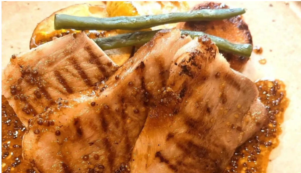
洋食 sugano どこ