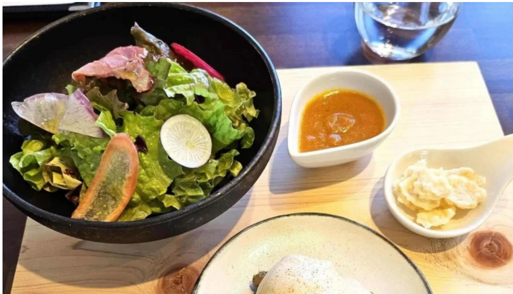
洋食 sugano 営業時間