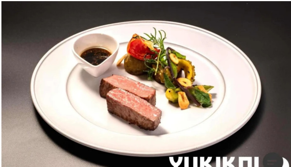
洋食 sugano オーナー提供