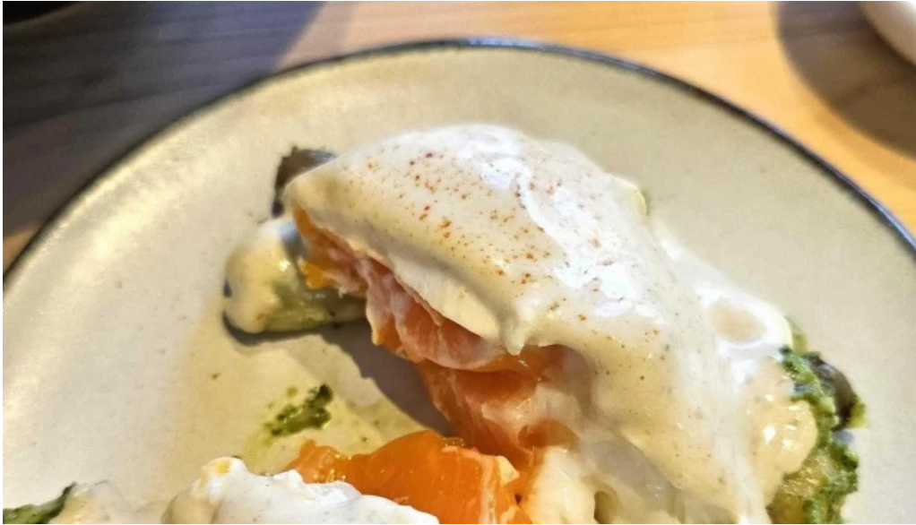
洋食 sugano 行き方