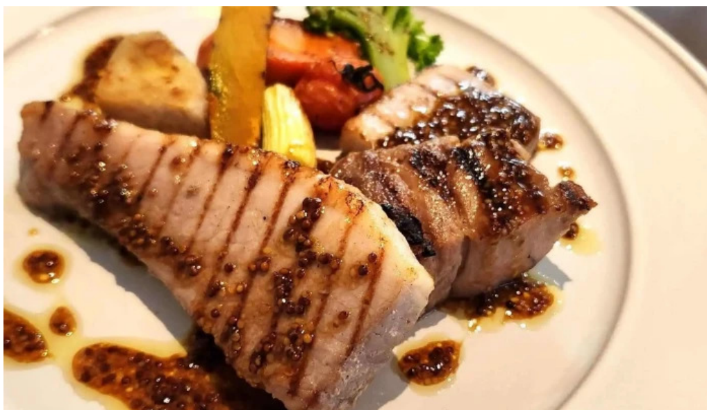
洋食 sugano 近く