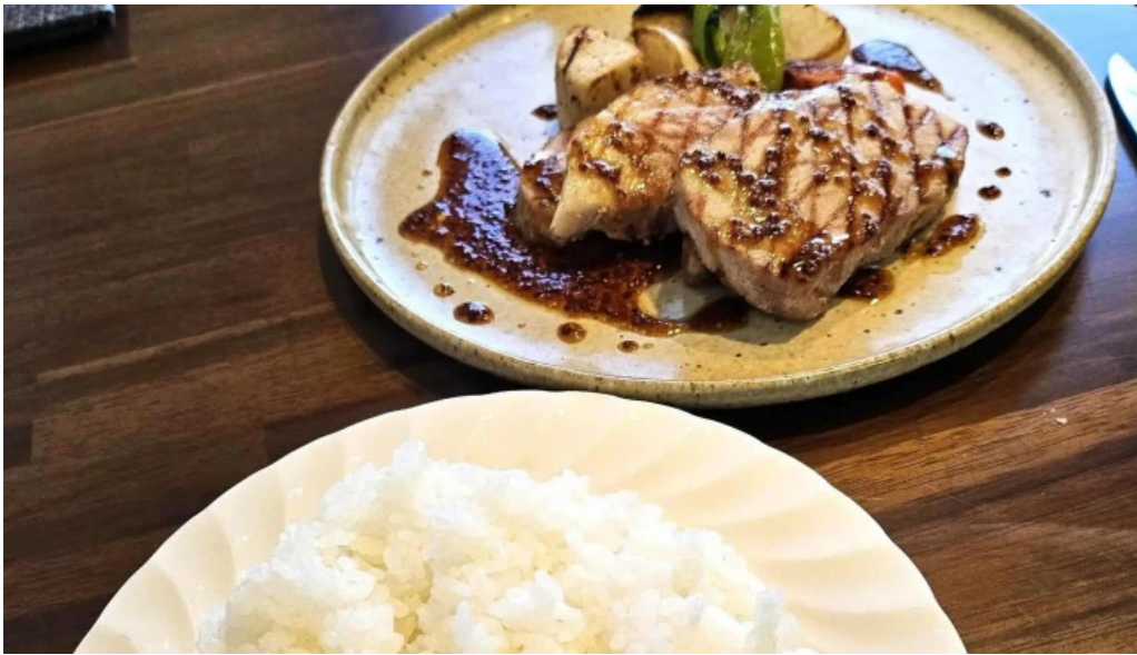
洋食 sugano 料金