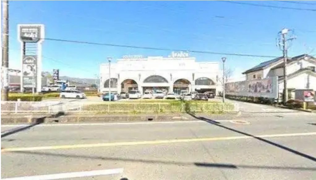
洋食 sugano 御殿場市