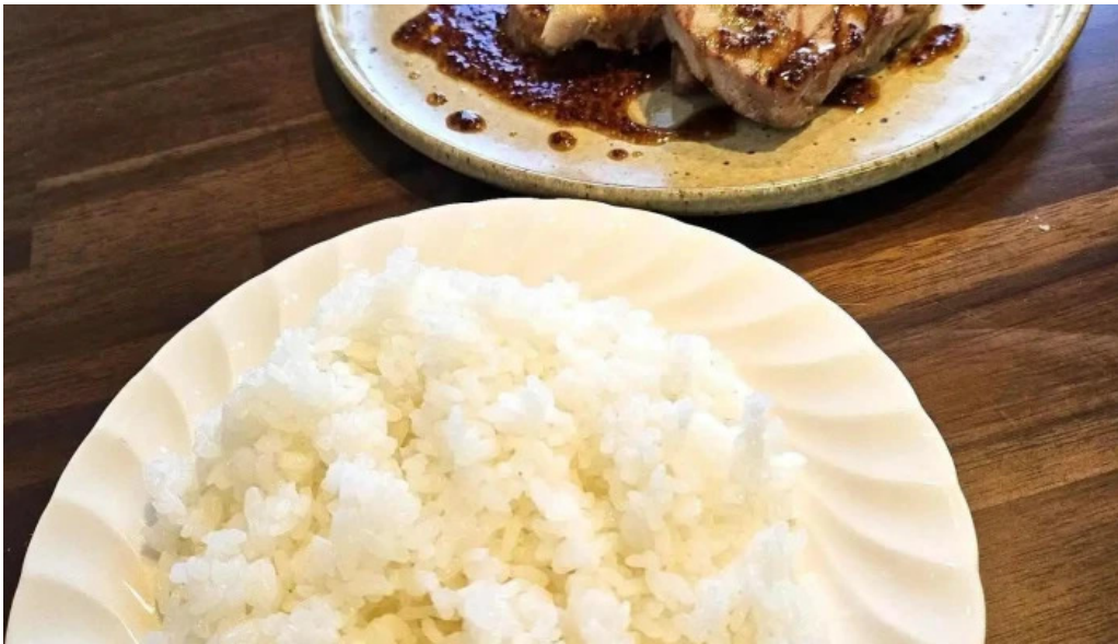
洋食 sugano 最新