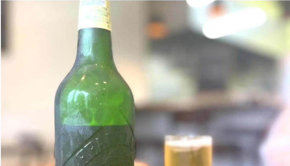
洋食 sugano instagram