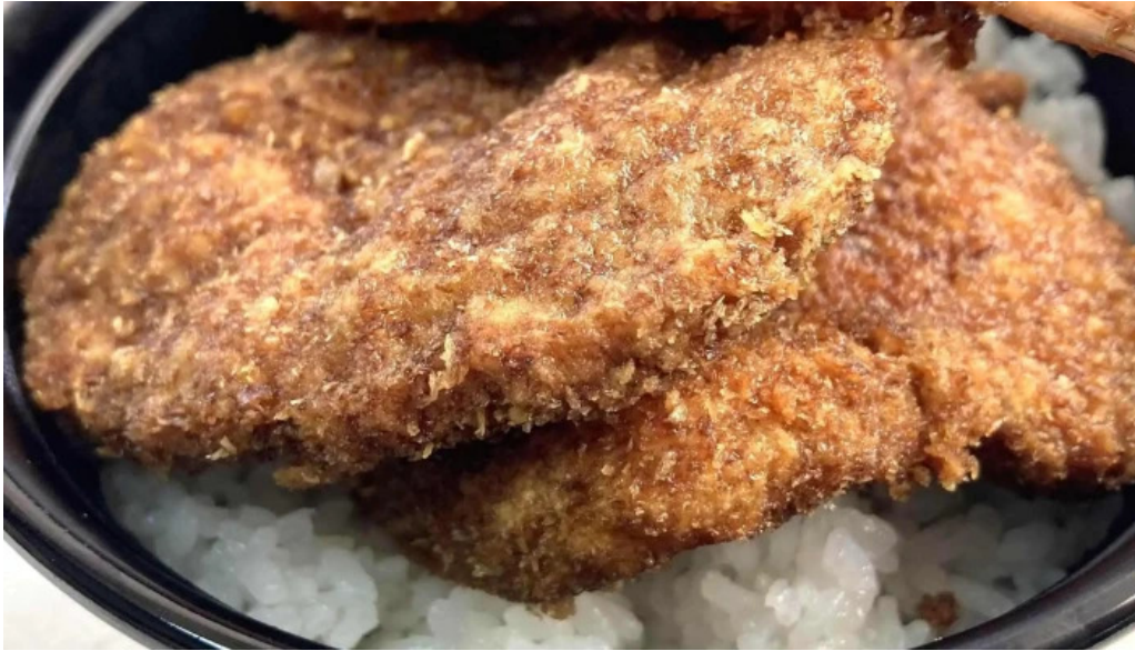
ヨーロッパ軒 春江分店 comentario 4