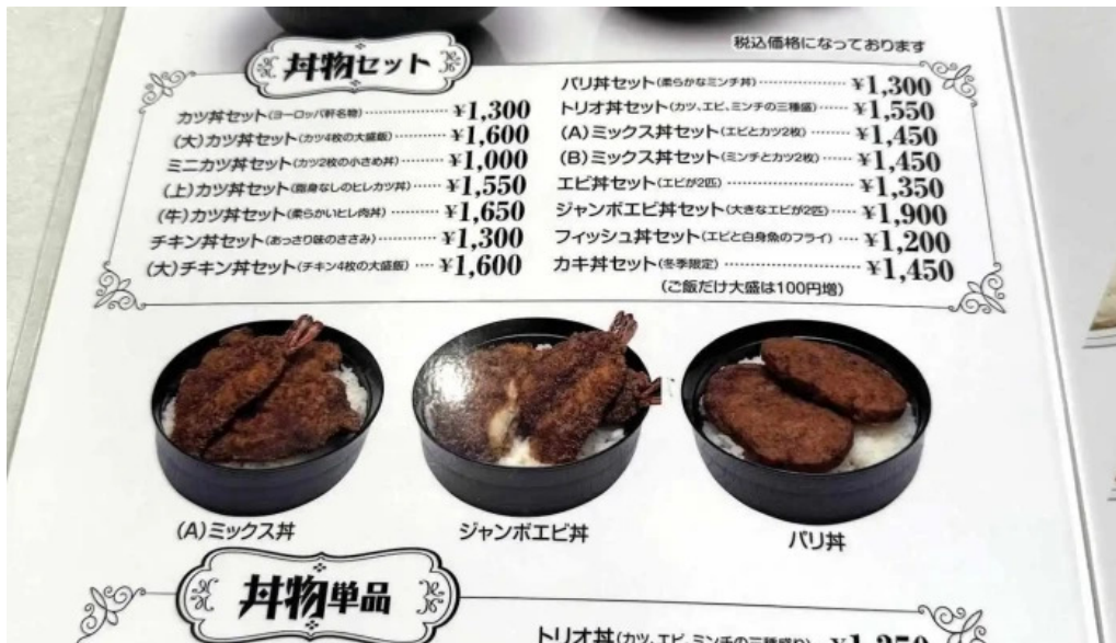
ヨーロッパ軒 春江分店 メニュー