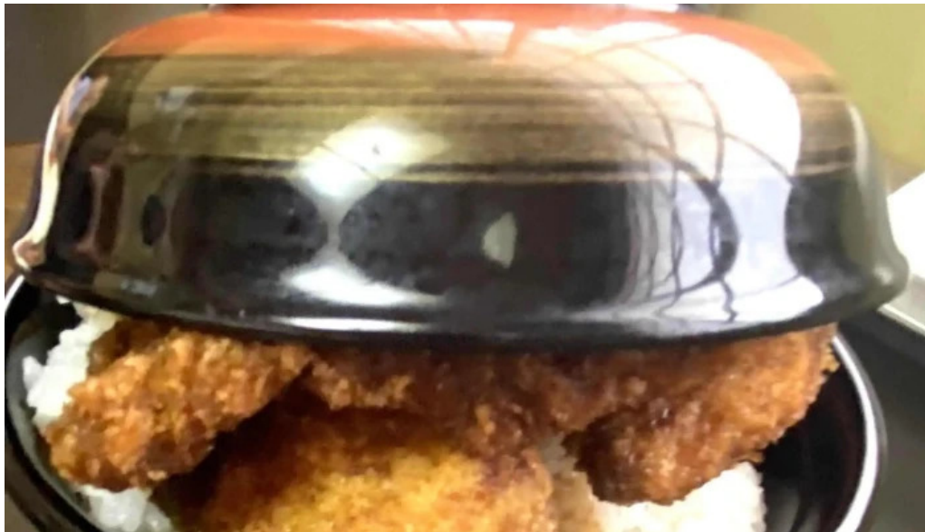
ヨーロッパ軒 春江分店 comentario 5