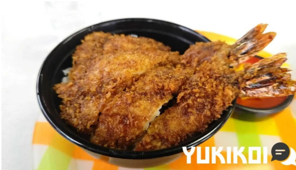
ヨーロッパ軒 春江分店 最新