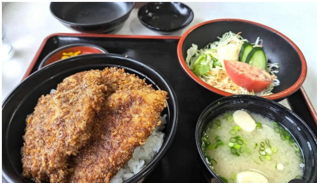
ヨーロッパ軒 春江分店 スープ