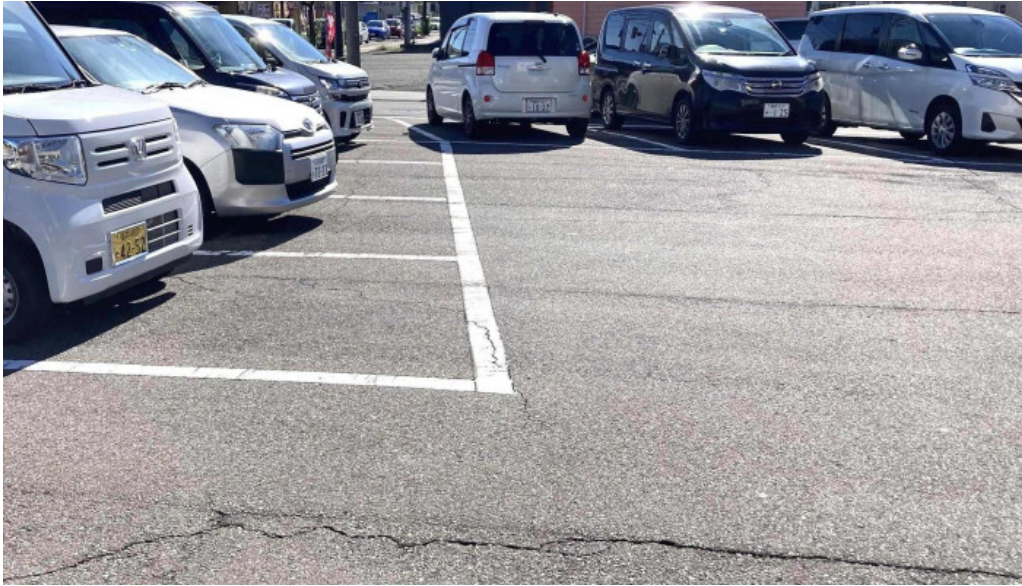
ヨーロッパ軒 春江分店 comentario 2