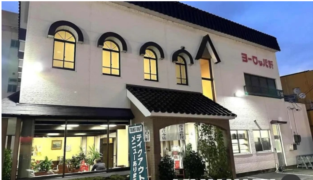
ヨーロッパ軒 春江分店 坂井市