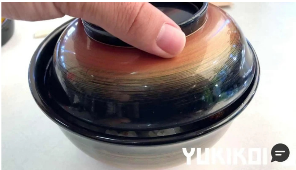
ヨーロッパ軒 春江分店 動画