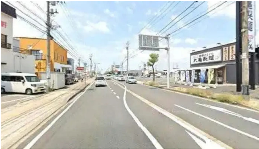
ヨーロッパ軒 春江分店 ストリートビューと 360 ビュー