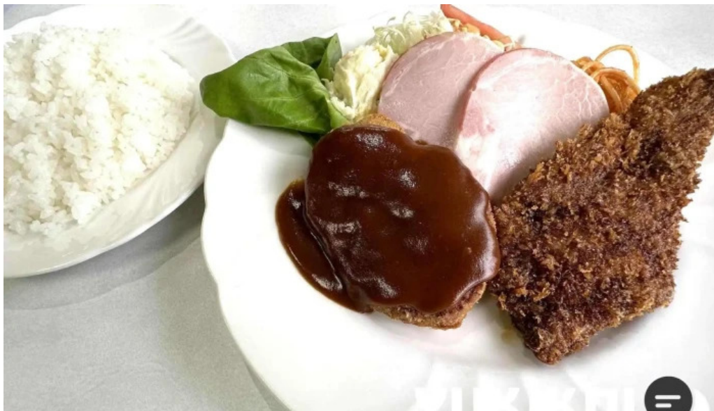
ヨーロッパ軒 春江分店 豚カツ