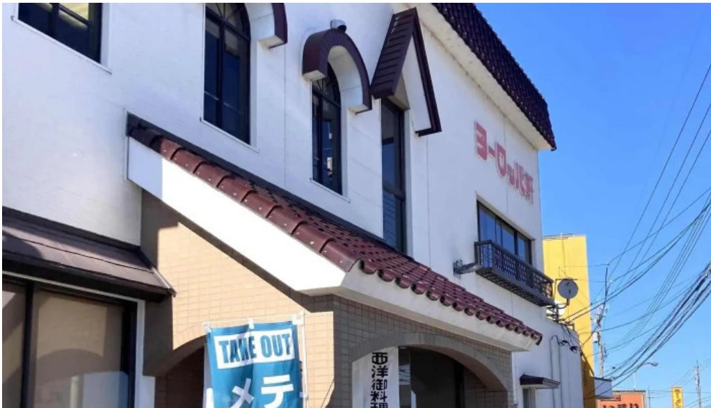
ヨーロッパ軒 春江分店 comentario 1