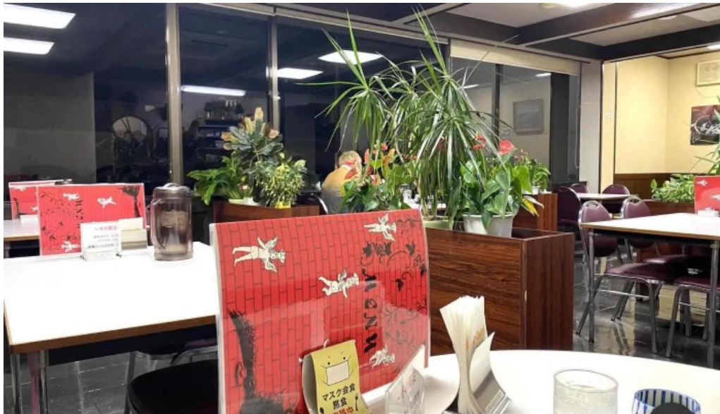
ヨーロッパ軒 春江分店 雰囲気