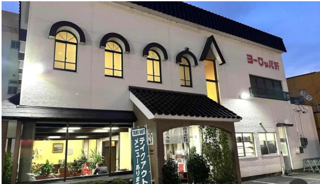
ヨーロッパ軒 春江分店 すべて