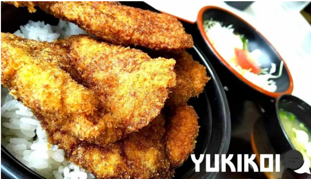
ヨーロッパ軒 春江分店 カツ丼