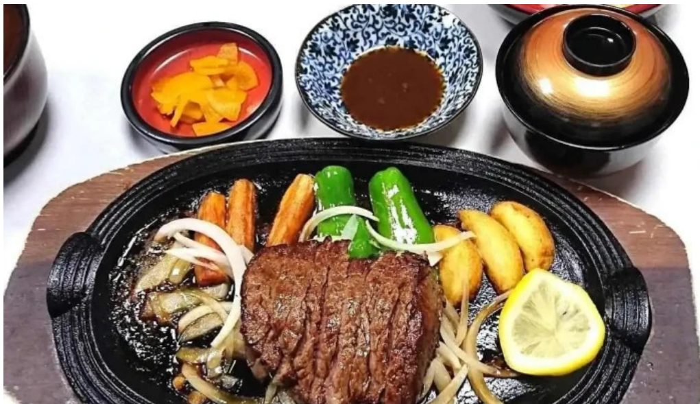
ヨーロッパ軒 春江分店 料理飲み物