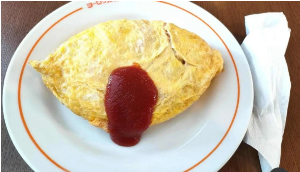
ヨーロッパ軒 丸岡分店 オムライス