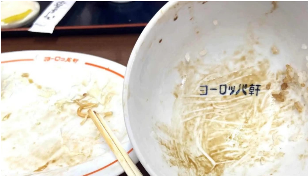
ヨロツパ軒 丸岡分店 comentario 2