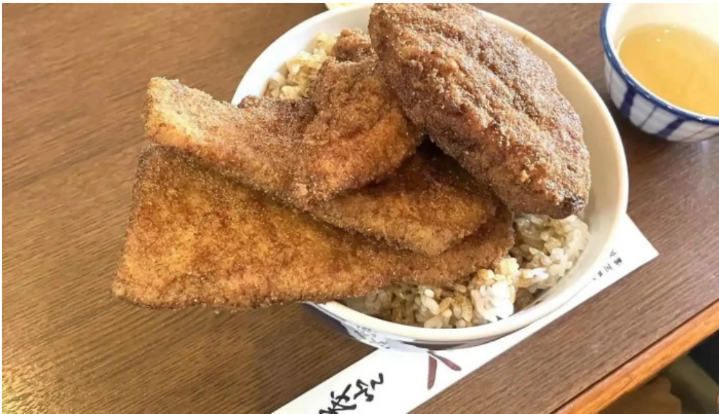
ヨーロッパ軒 丸岡分店 最新