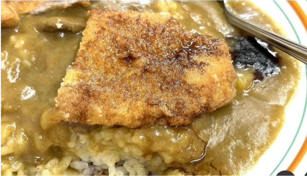
ヨーロッパ軒 丸岡分店 カレー