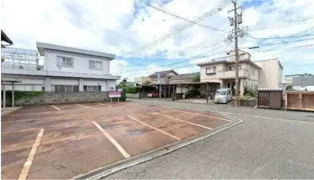
ヨーロッパ軒 丸岡分店 ストリートビューと 360 ビュー