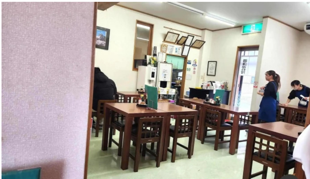
ヨーロッパ軒 丸岡分店 雰囲気