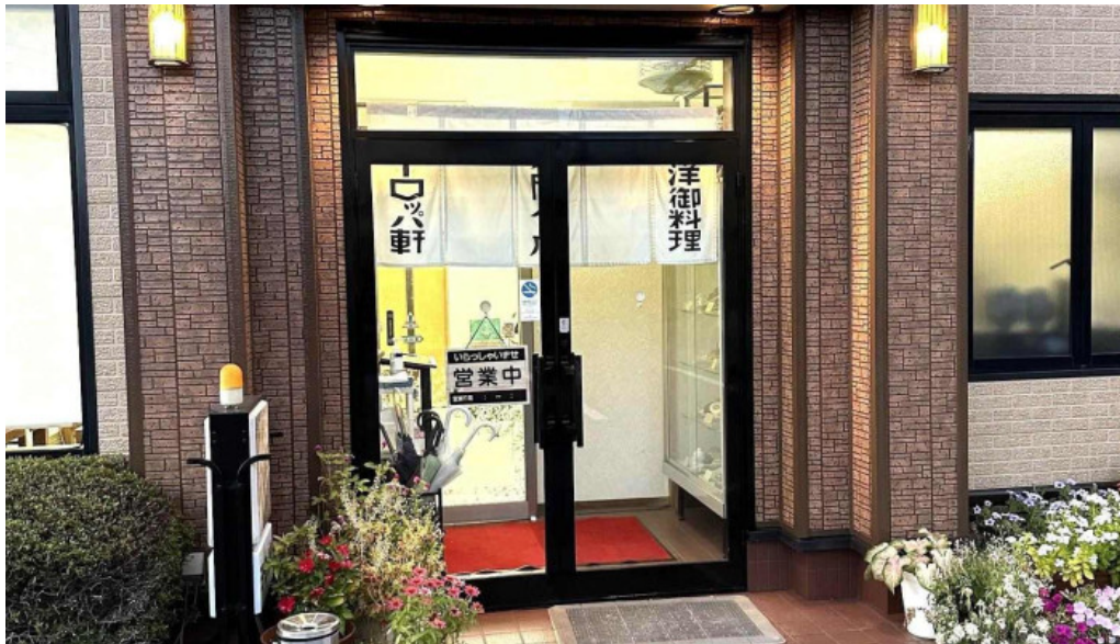
ヨーロッパ軒 丸岡分店 すべて