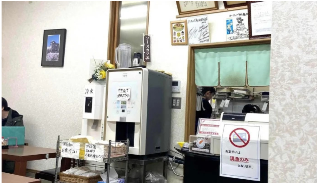
ヨーロッパ軒 丸岡分店 comentario 1