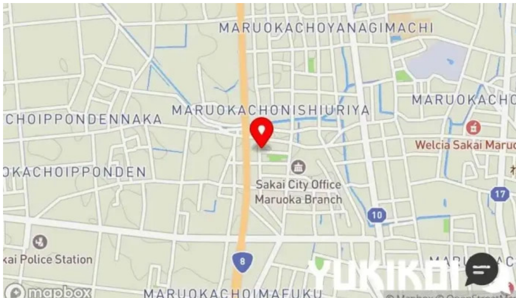
ヨーロッパ軒 丸岡分店地図