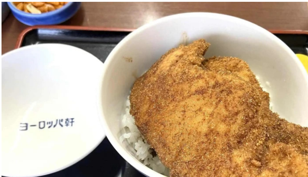
ヨーロッパ軒 丸岡分店 comentario 4