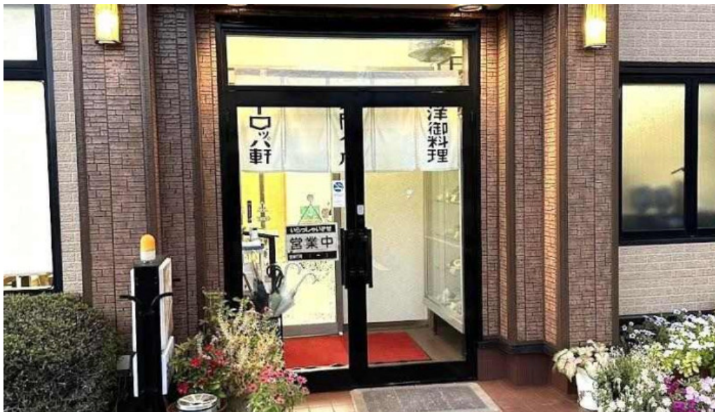
ヨーロッパ軒 丸岡分店 坂井市