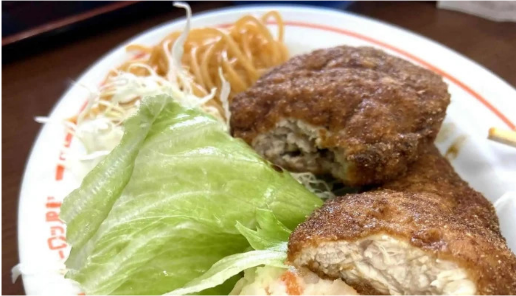
ヨロツパ軒 丸岡分店 comentario 3