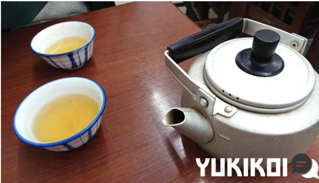
ヨーロッパ軒 丸岡分店 ジャスミン茶