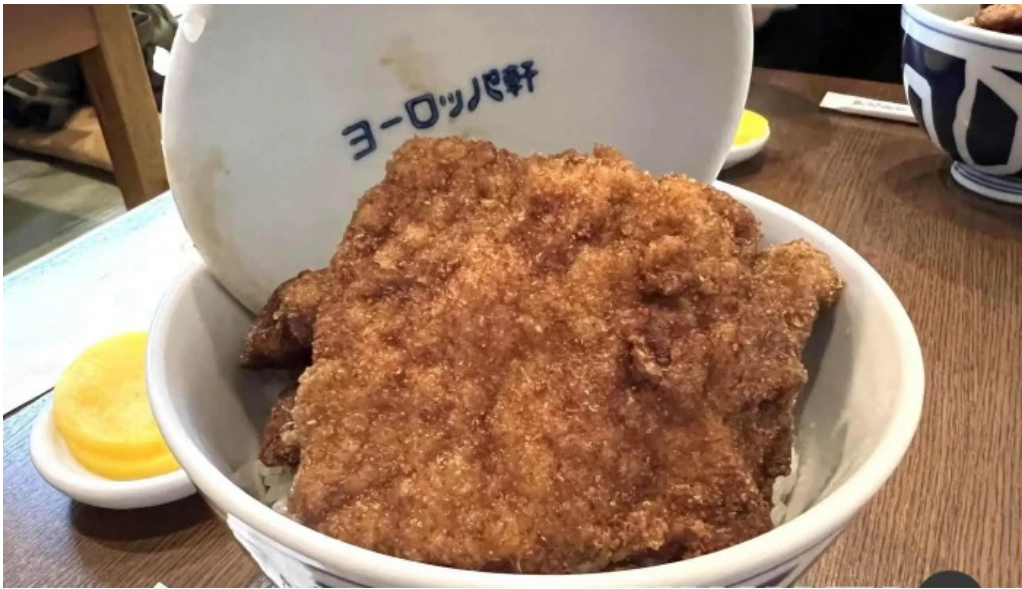
ヨーロッパ軒 丸岡分店 豚カツ