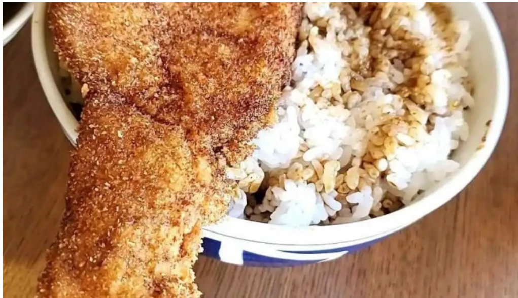
ヨーロッパ軒 丸岡分店 動画