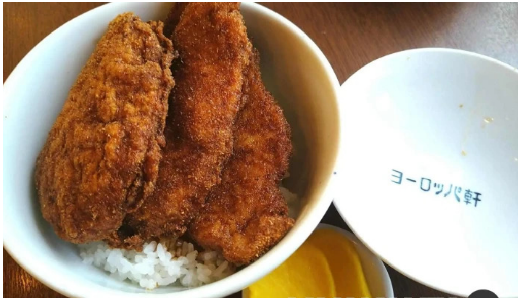
ヨーロッパ軒 丸岡分店 料理飲み物