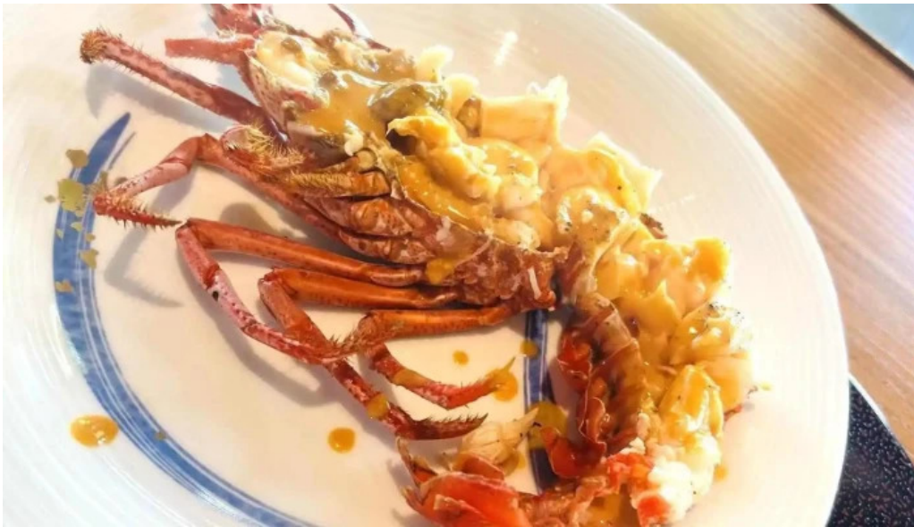
Miyoshiro三好楼 アカザエビ科