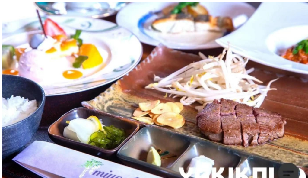
Miyoshiro三好楼 料理飲み物