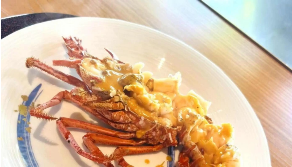
Miyoshiro三好楼 comentario 4