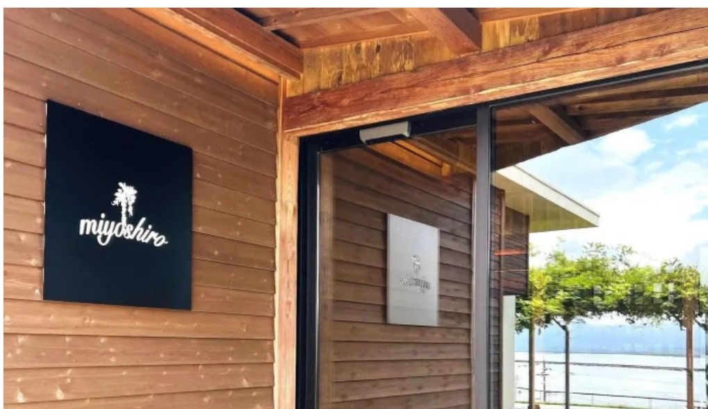
Miyoshiro三好楼 comentario 1