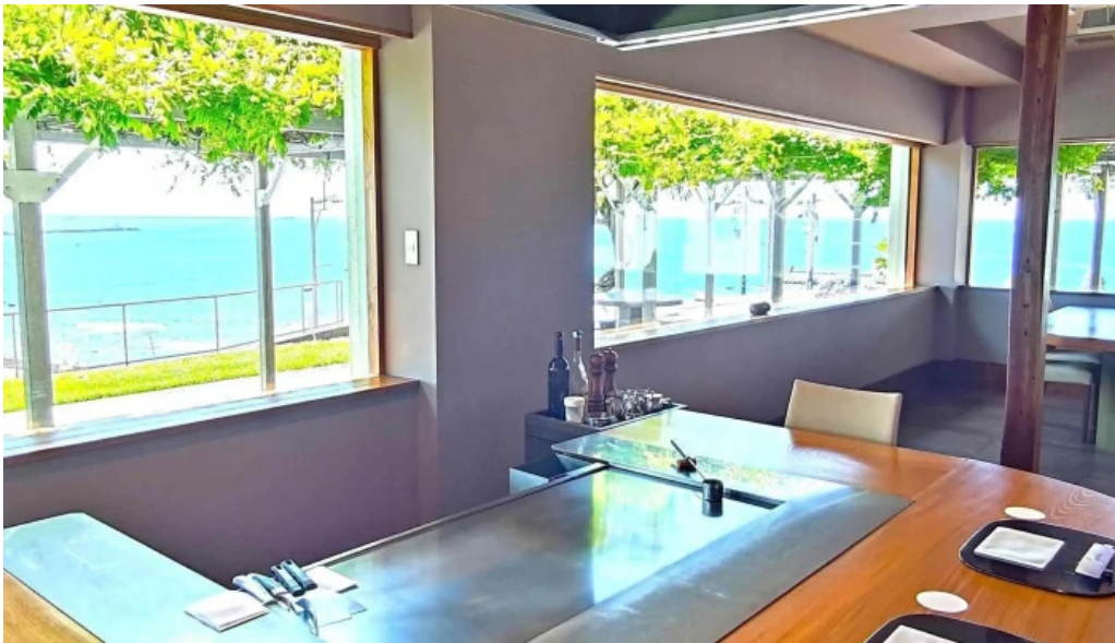
Miyoshiro三好楼 comentario 5