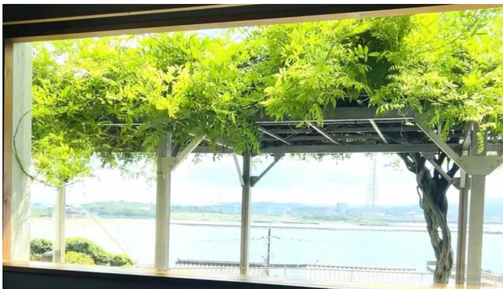
Miyoshiro三好楼 comentario 2