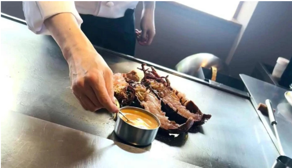
Miyoshiro三好楼 comentario 3