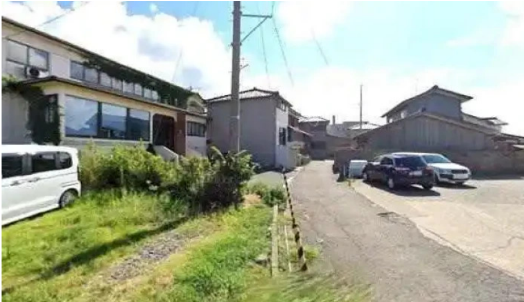
Miyoshiro三好楼 ストリートビューと 360 ビュー