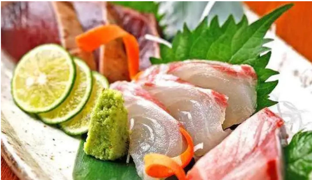
源輝家 料理飲み物