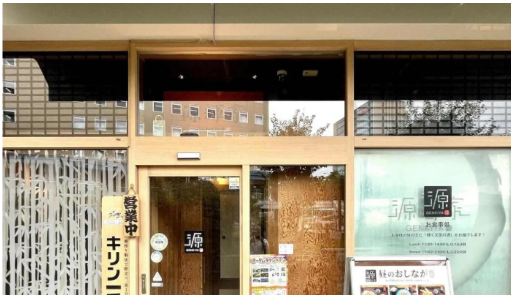
源輝家 ウェブサイト