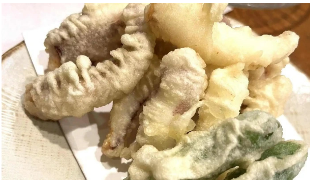
みろく ウェブサイト