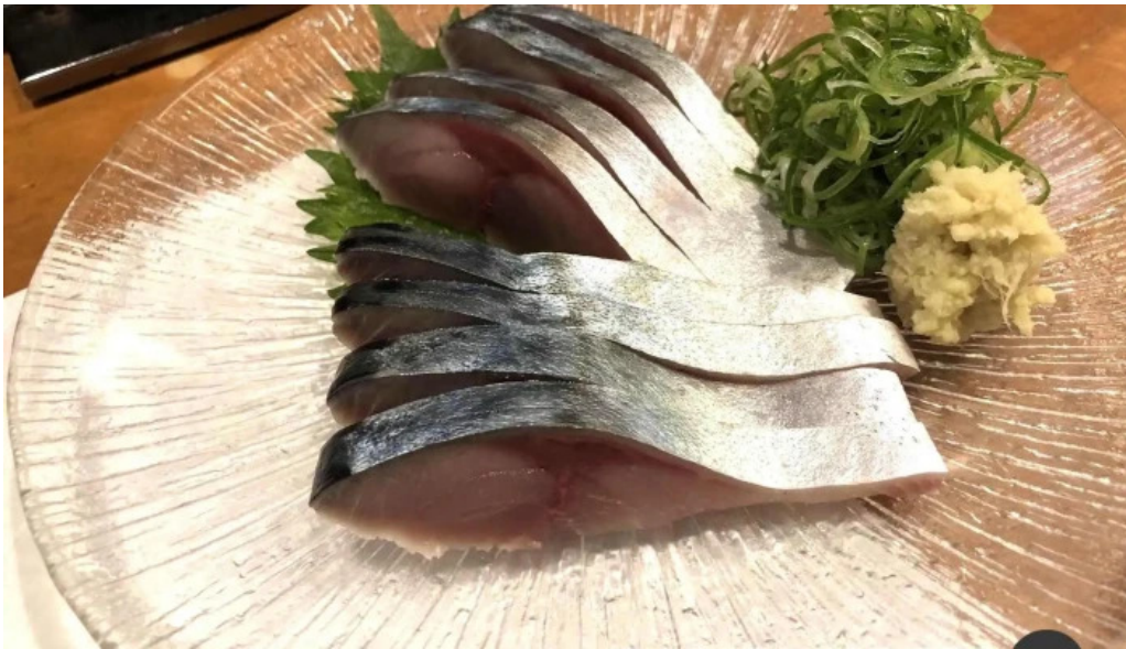
みろく 料理飲み物