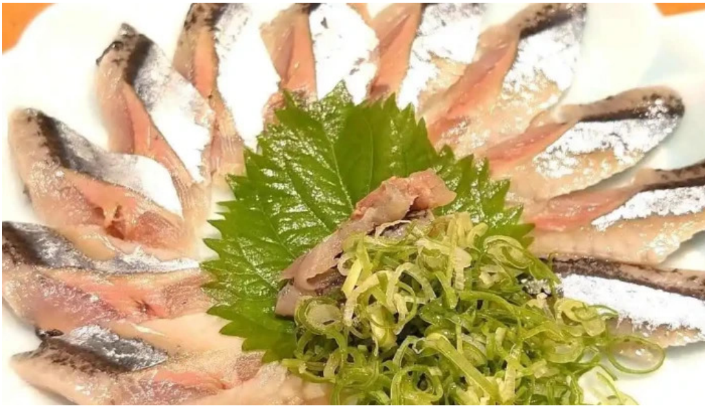
みろく シーフード