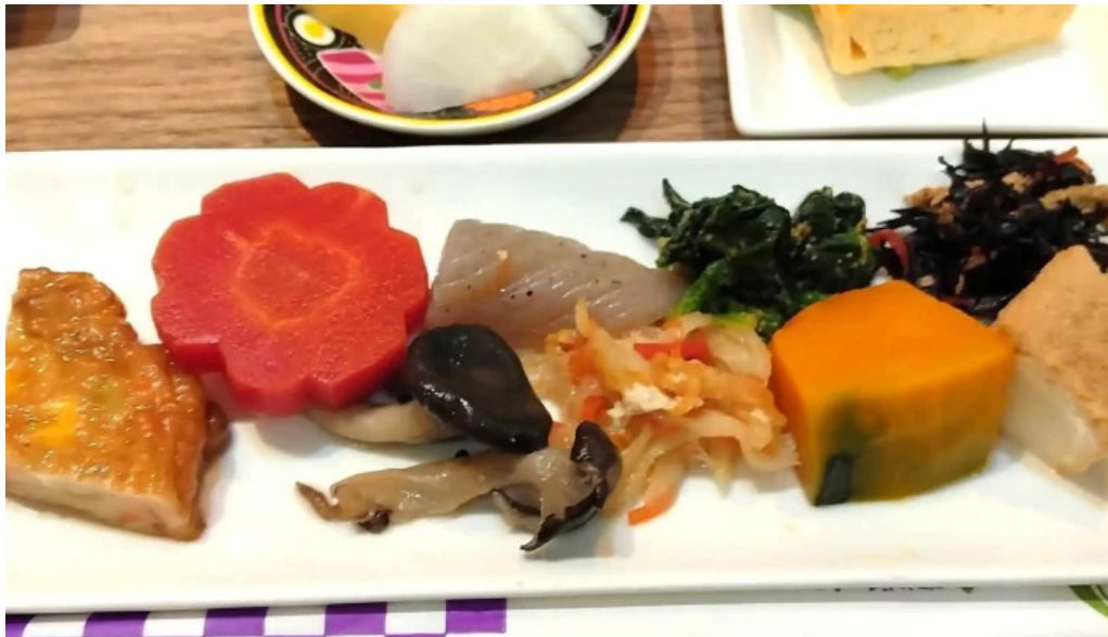
こうた里 カタログ