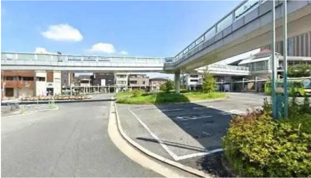
こうた里 長岡京市