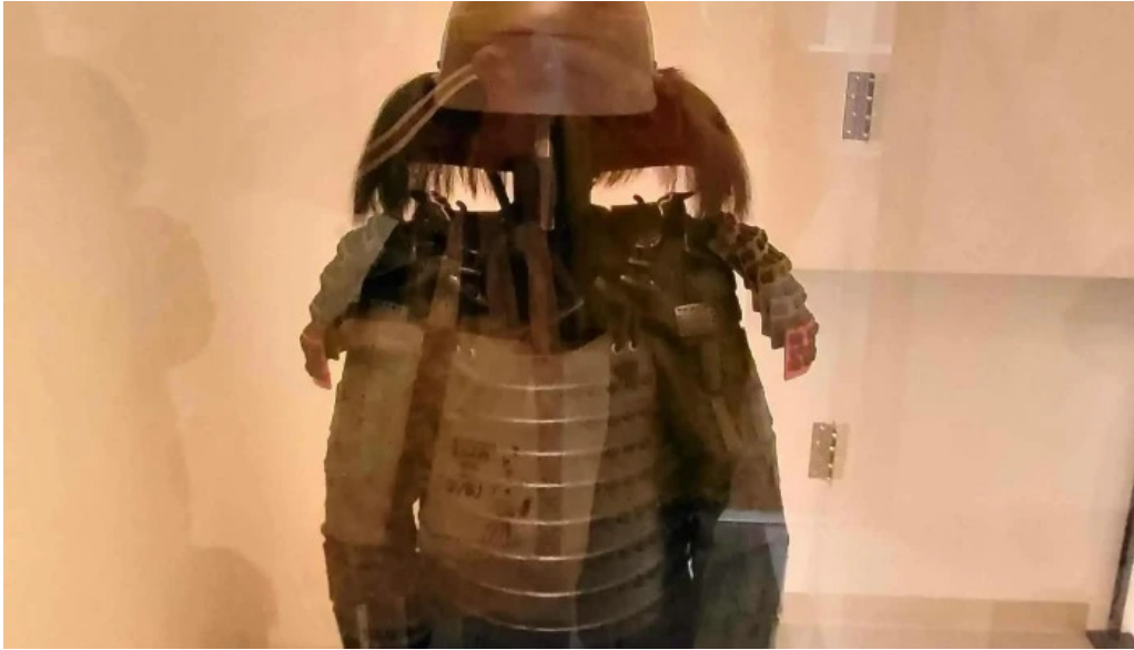
こうた里 プロモーション