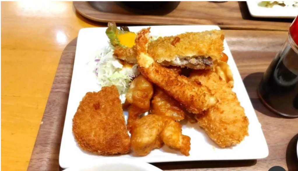
こうた里 料理飲み物