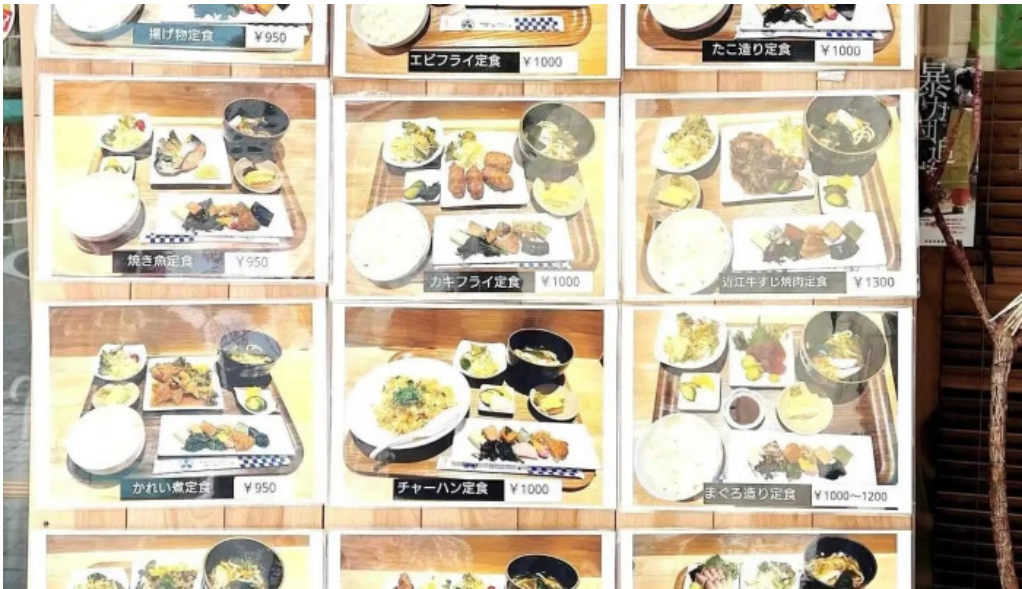
こうた里 メニュー