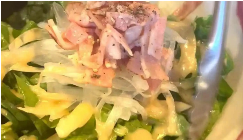
風和利あじち 動画