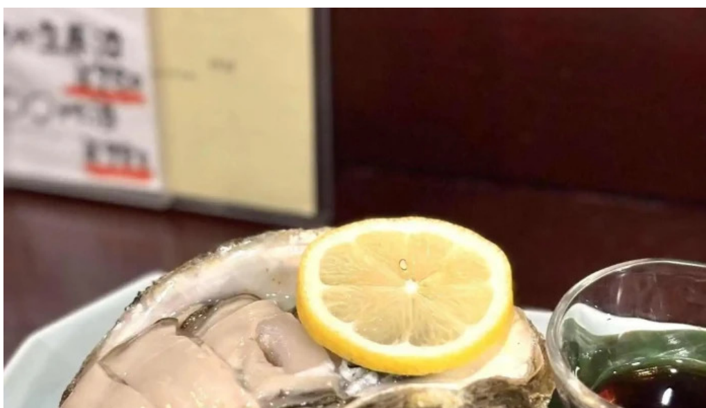
風和利あじち カキ