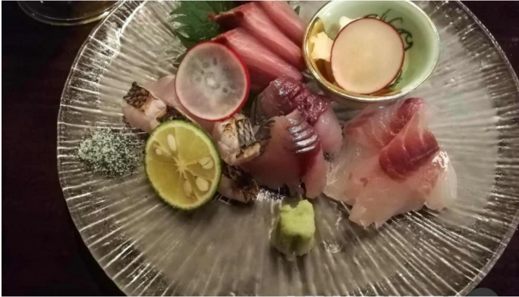
風和利あじち シーフード