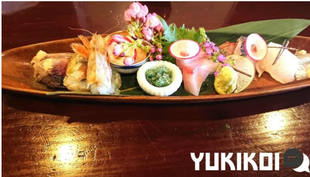
風和利あじち 刺身