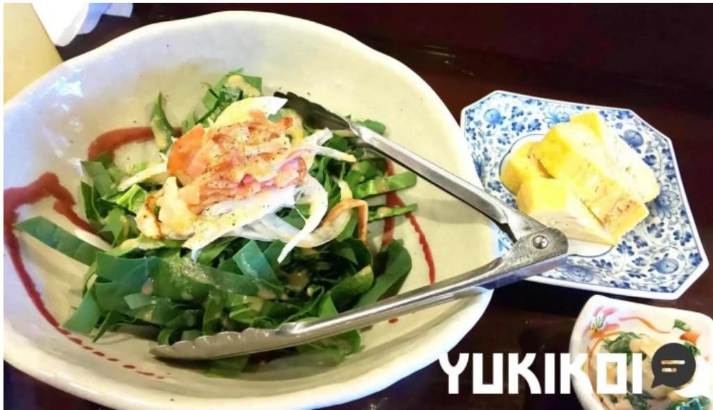
風和利あじち ルッコラ