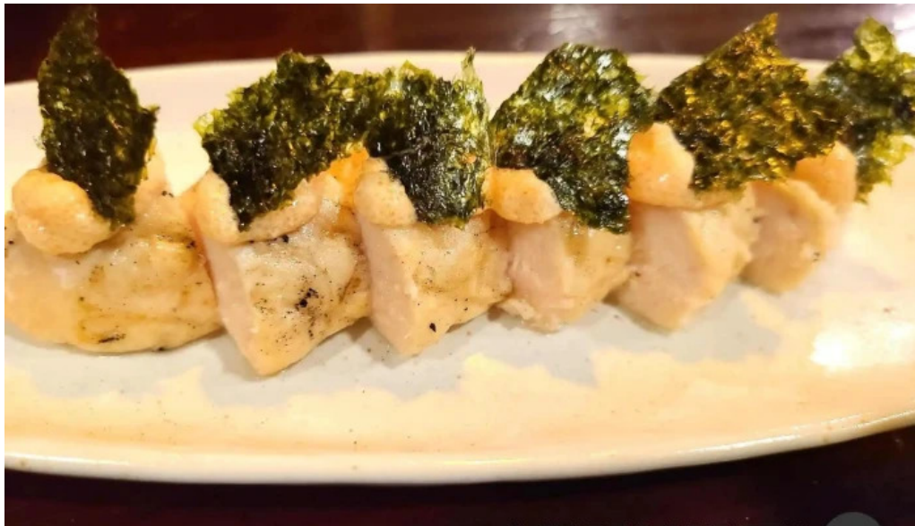
風和利あじち ビンナガ