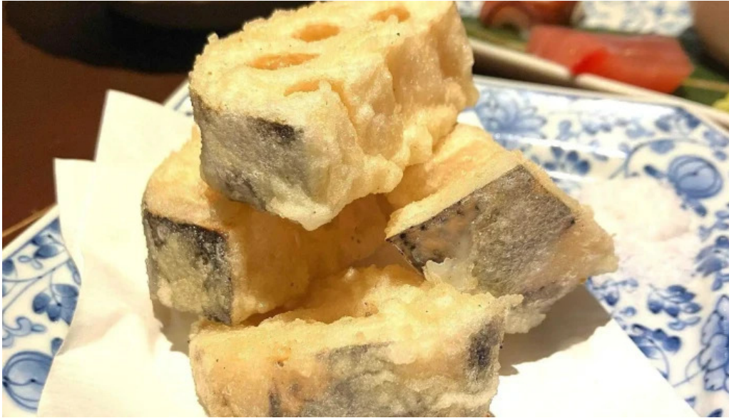
風和利あじち 天ぷら