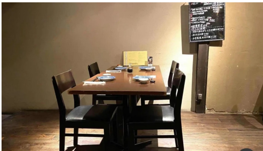
風和利あじち 雰囲気