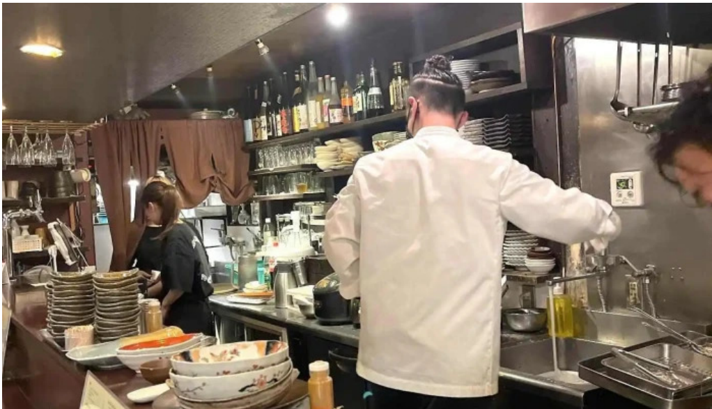
風和利あじち 料理飲み物