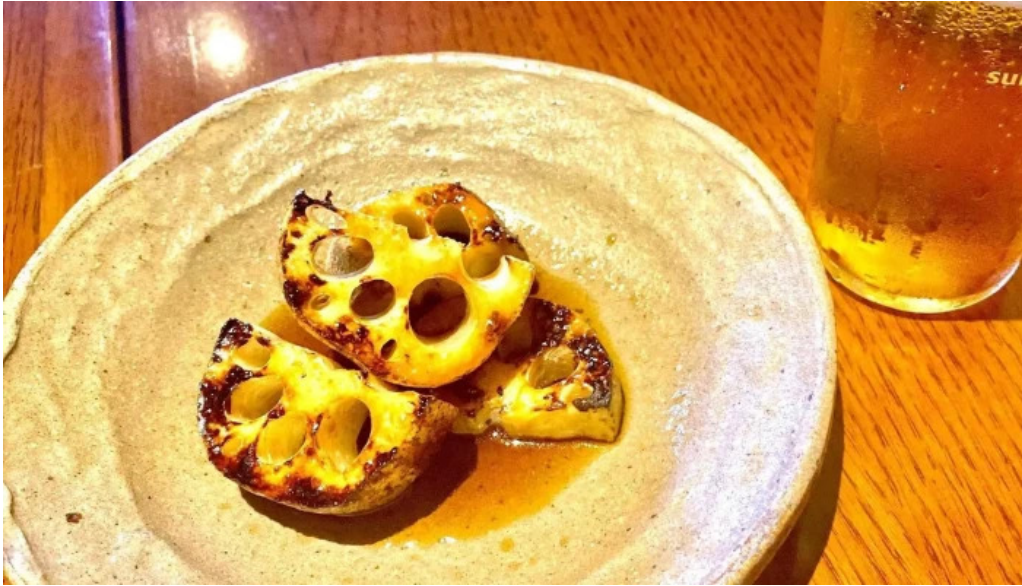
風和利あじち 口コミ