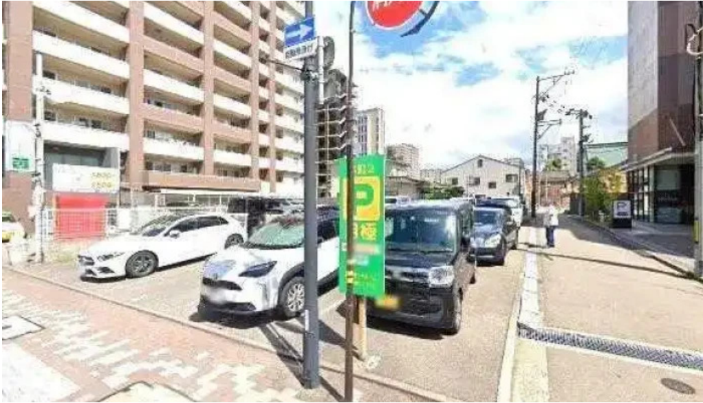
風和利あじち 金沢市