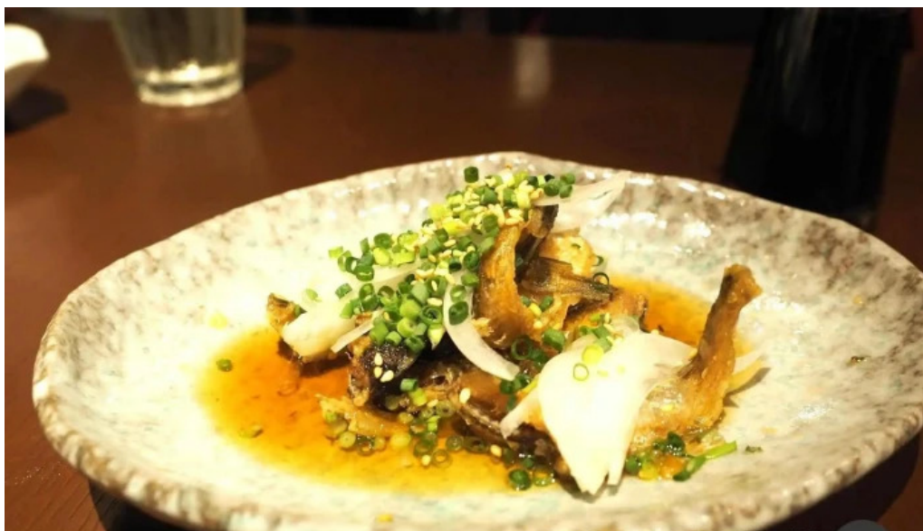
風和利あじち サバ