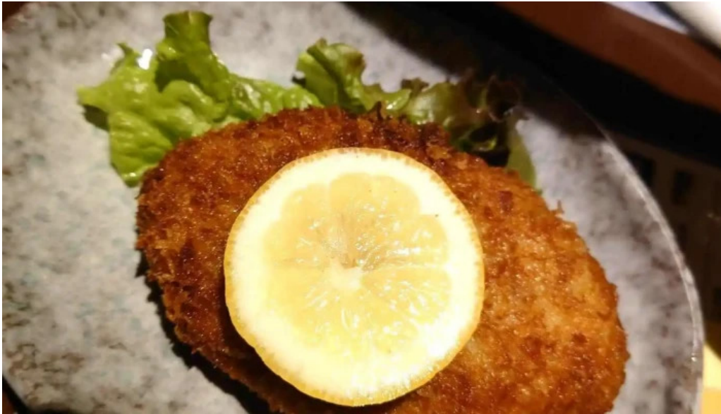
風和利あじち シュニツツエル