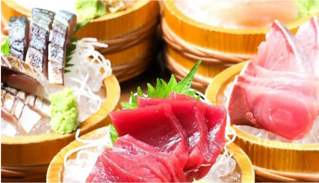
旬魚季菜 とと桜 料理飲み物