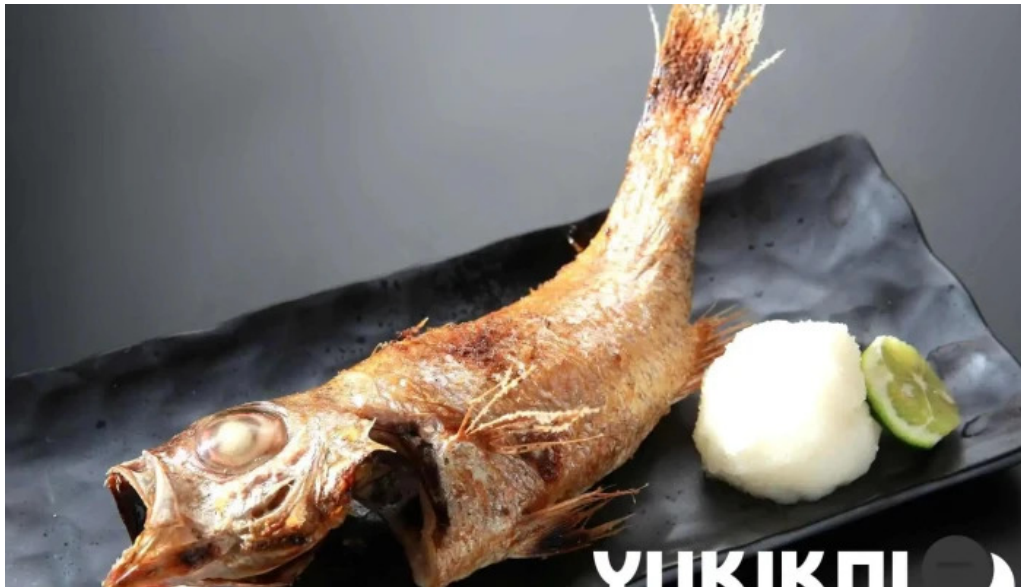
旬魚季菜 とと桜