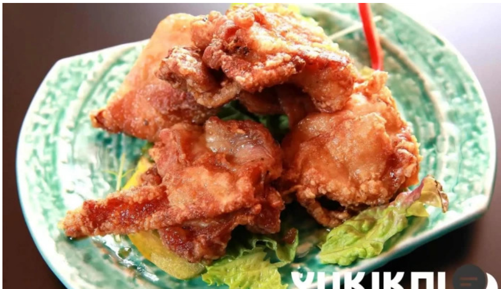
旬魚季菜 とと桜 から揚げ