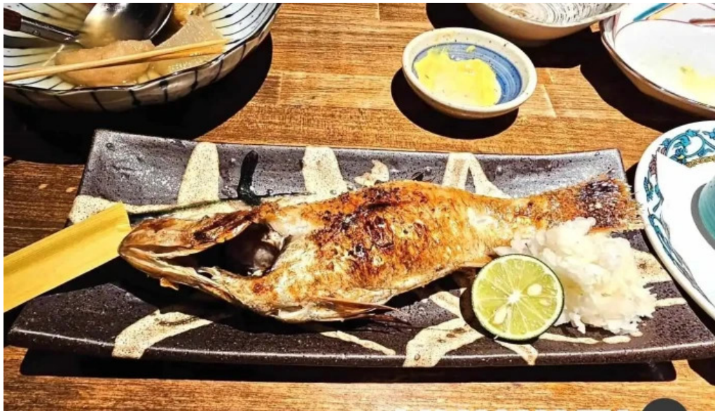
旬魚季菜 とと桜サバ