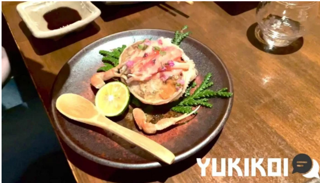
旬魚季菜 とと桜 動画