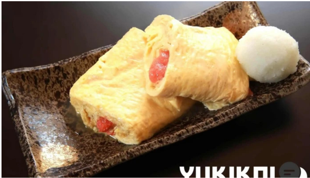
旬魚季菜 とと桜 卵焼き