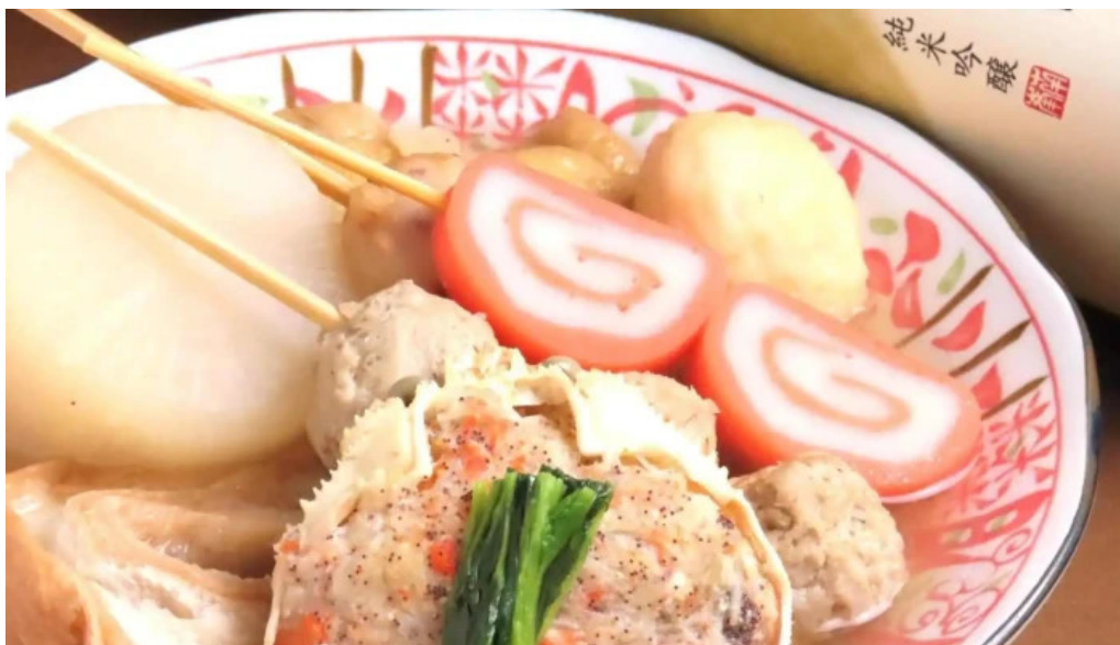
旬魚季菜 とと桜 おでん