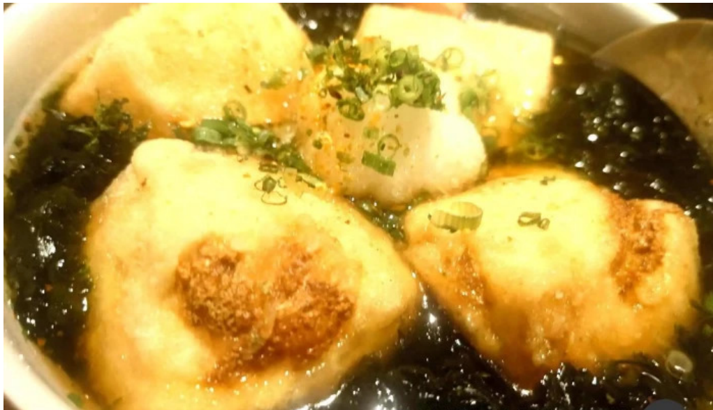
旬魚季菜 とと桜 最新