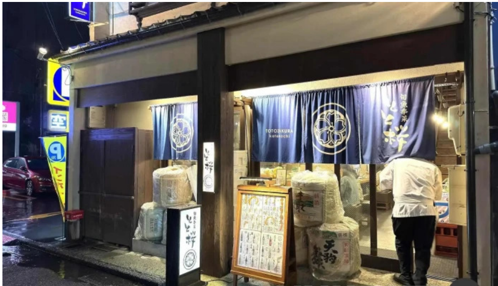
旬魚季菜 とと桜 金沢市