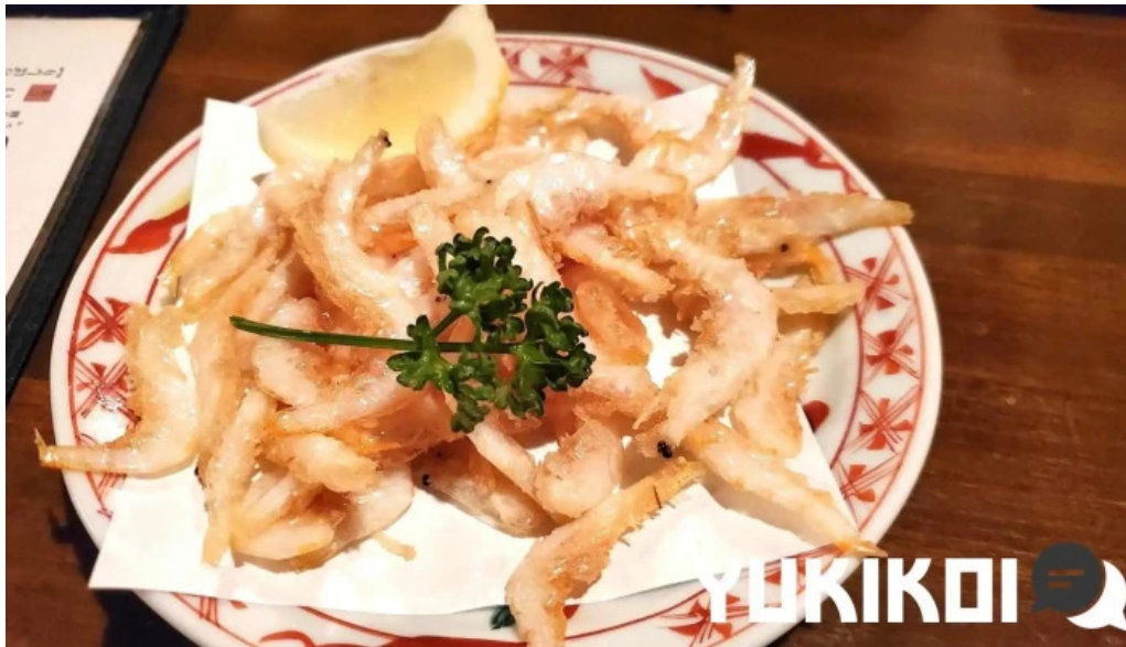
旬魚季菜 とと桜 天ぷら