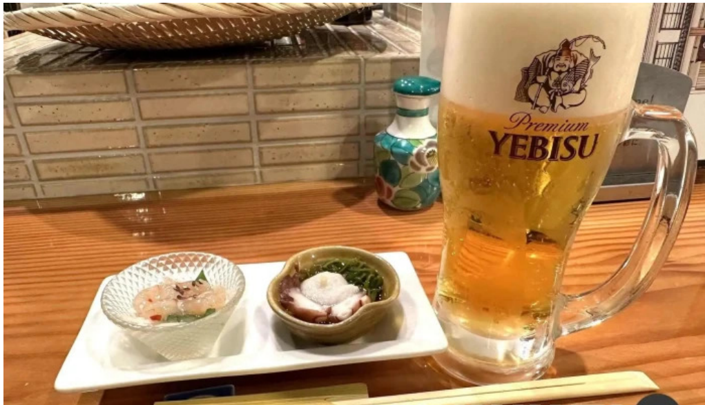
旬魚季菜 とと桜ビール