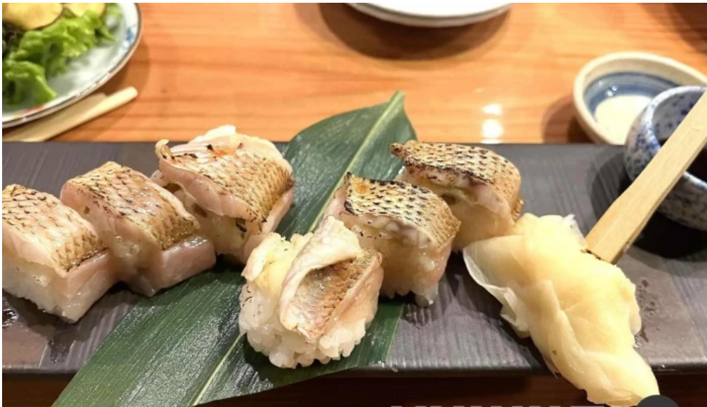
旬魚季菜 とと桜 寿司