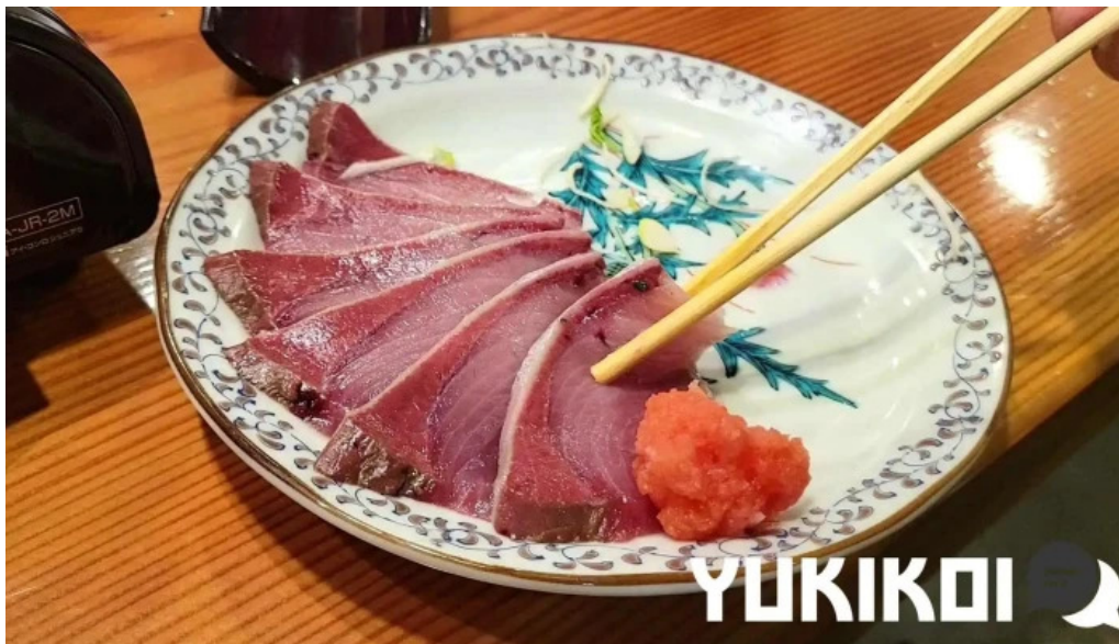
旬魚季菜 とと桜 刺身