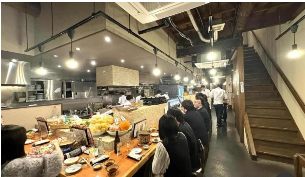
旬魚季菜 とと桜 雰囲気