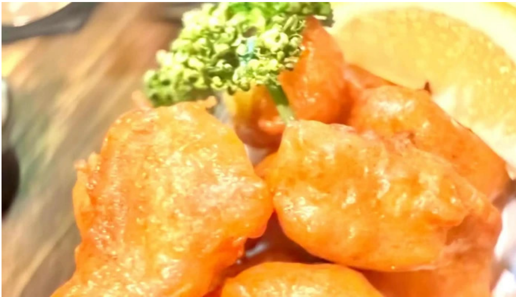
酒菜屋志らい 写真