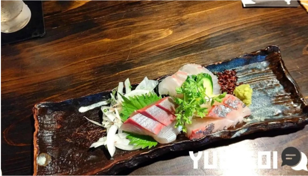
酒菜屋志らい 刺身