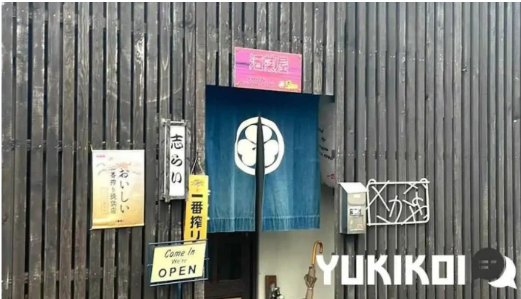
酒菜屋志らい