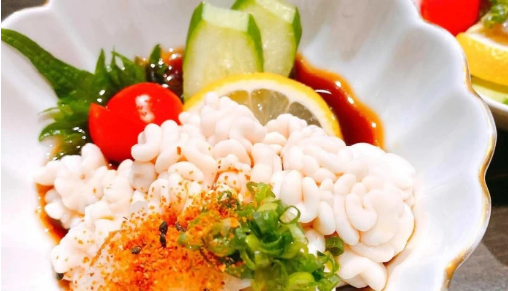
酒菜屋志らい 近く