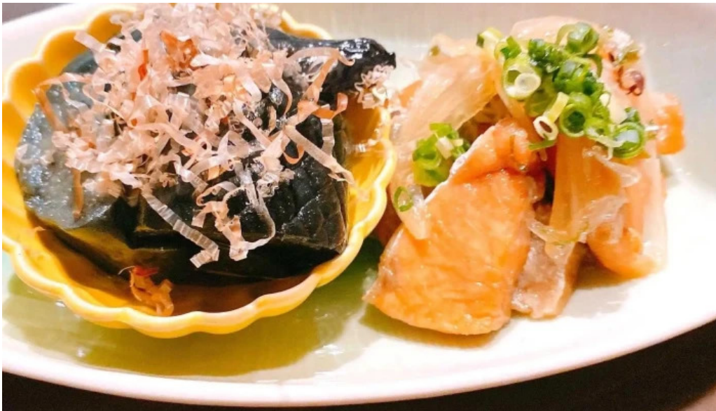
酒菜屋志らい 動画