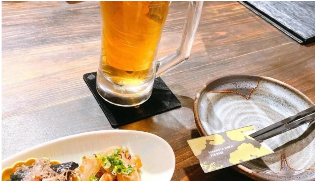
酒菜屋志らいウェブサイト