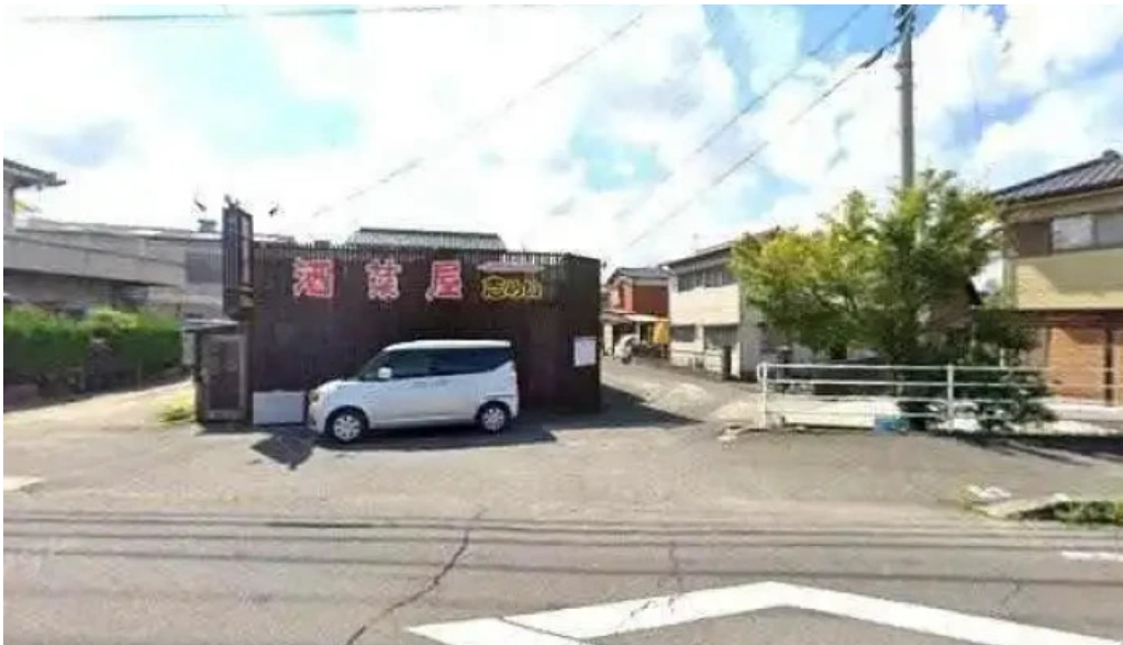
酒菜屋志らい 観音寺市