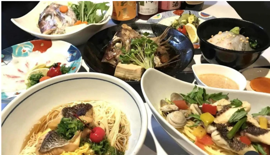
酒菜屋志らい 料理飲み物