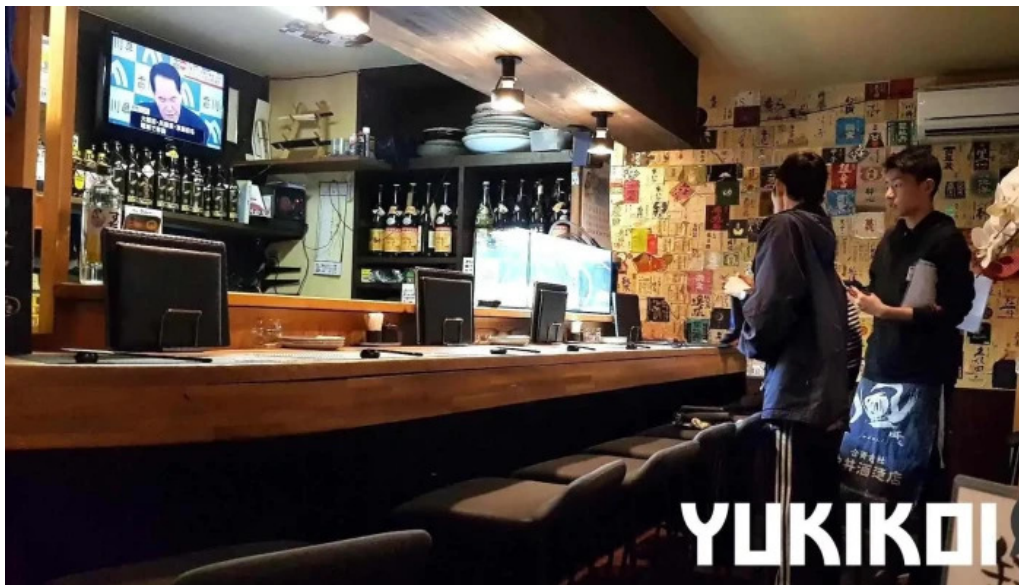
酒菜屋志らい 雰囲気