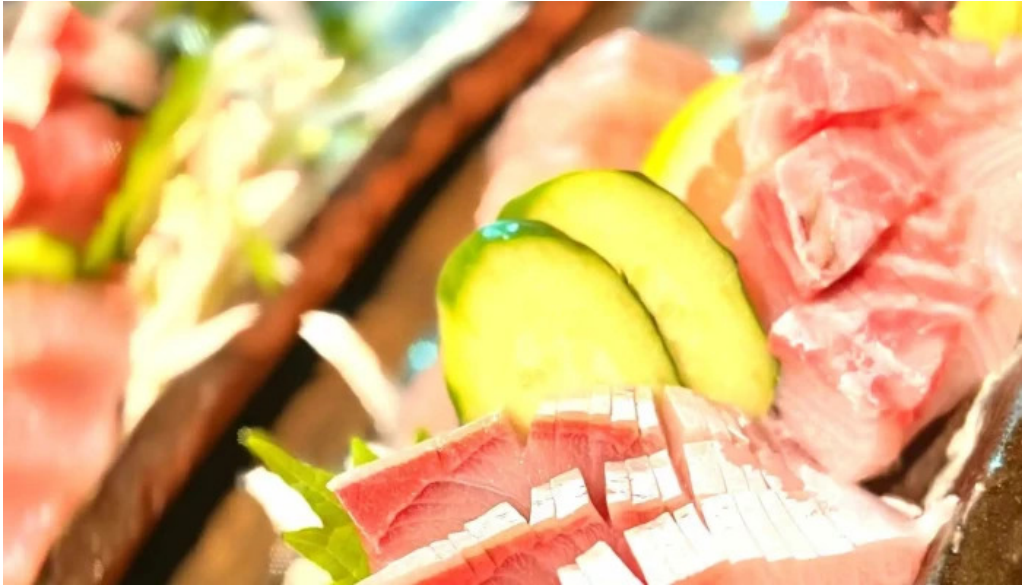
酒菜屋志らい カタログ