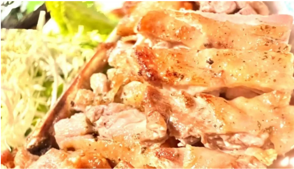
酒菜屋志らい 口コミ