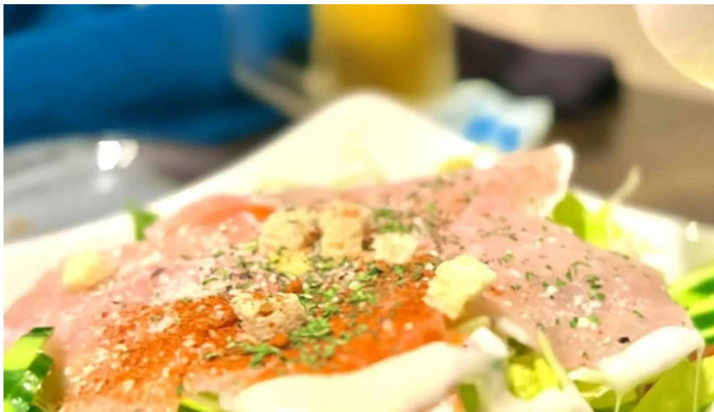
酒菜屋志らいどこ