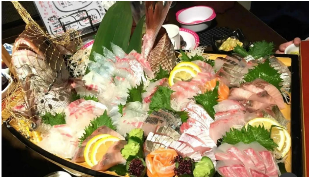
酒菜屋志らいシーフード