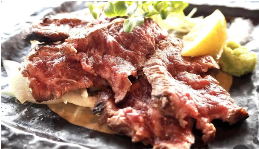
あみ屋 料理飲み物