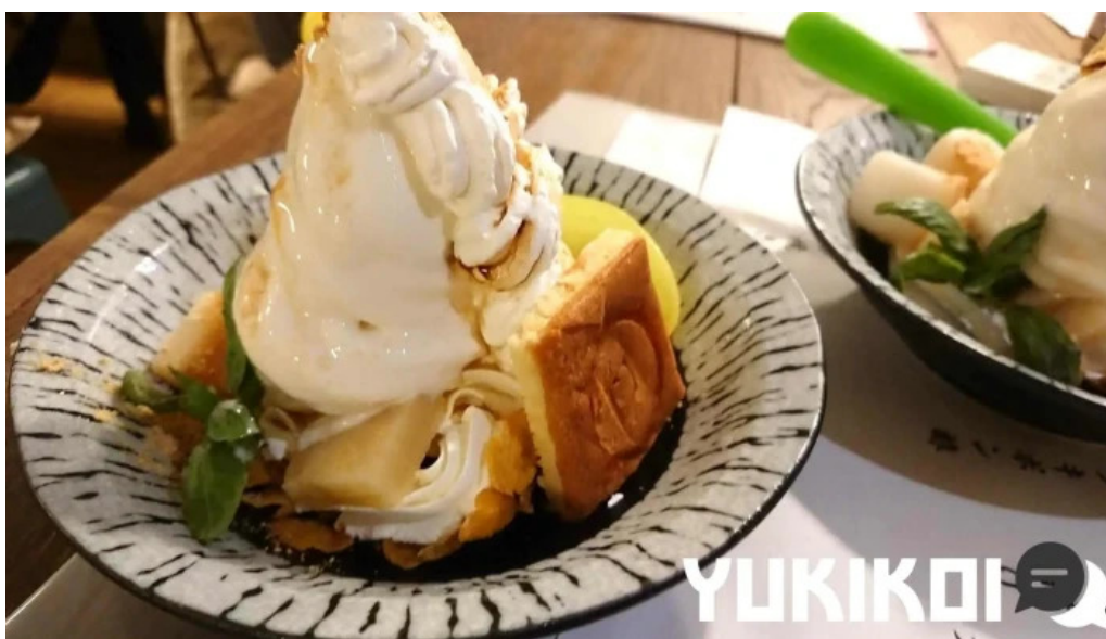
あみ屋 アイスクリーム