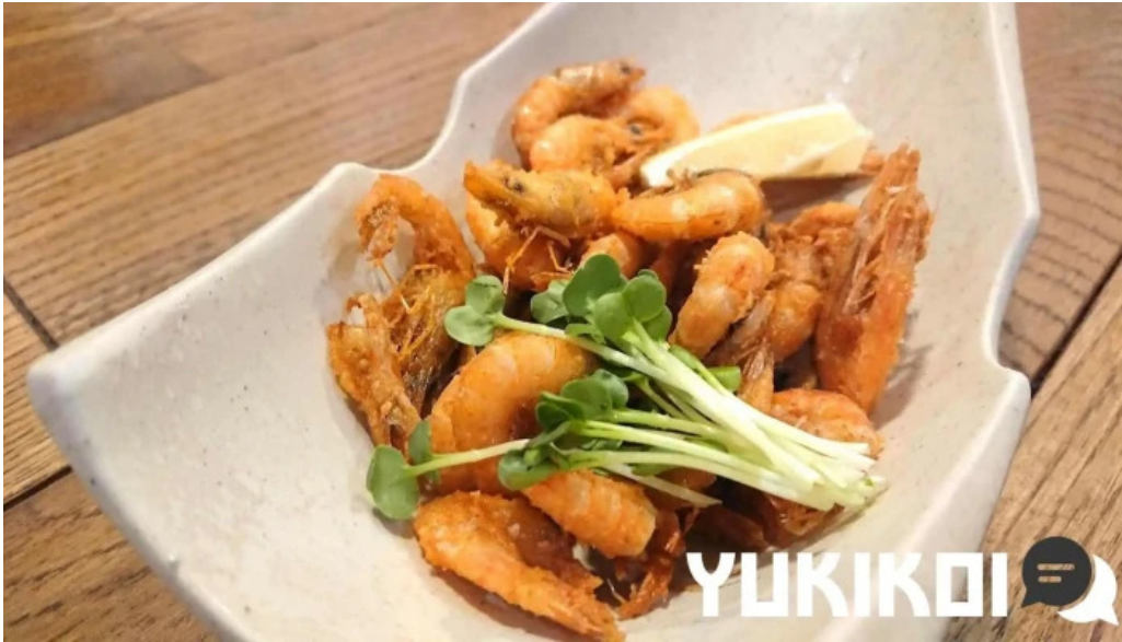
あみ屋 シーフード