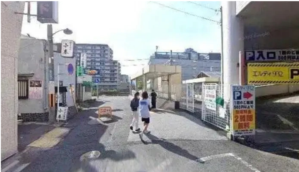
鮮魚とあご出汁おでん トリスタセカンド 草津市