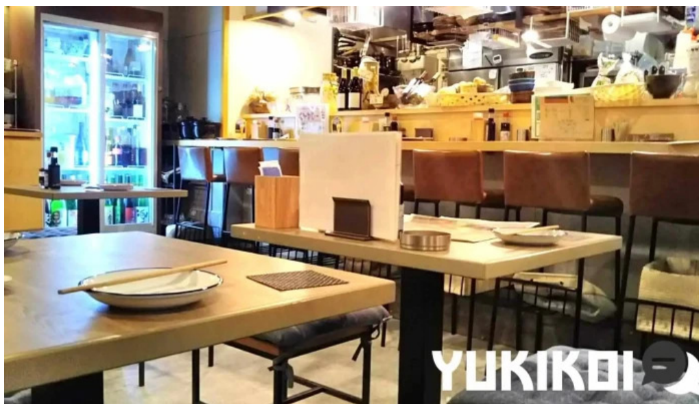
鮮魚とあご出汁おでん トリスタセカンド 雰囲気