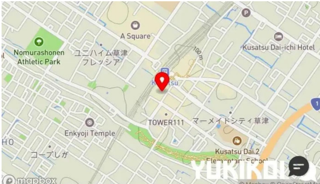
鮮魚とあご出汁おでん トリスタセカンド 地図