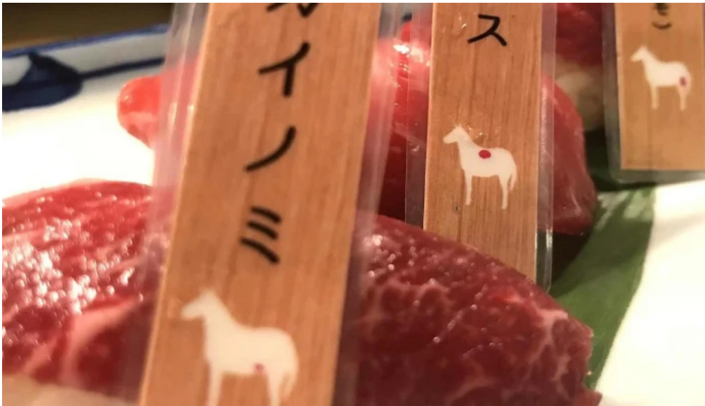
鮮魚とあご出汁おでん トリスタセカンド 近く