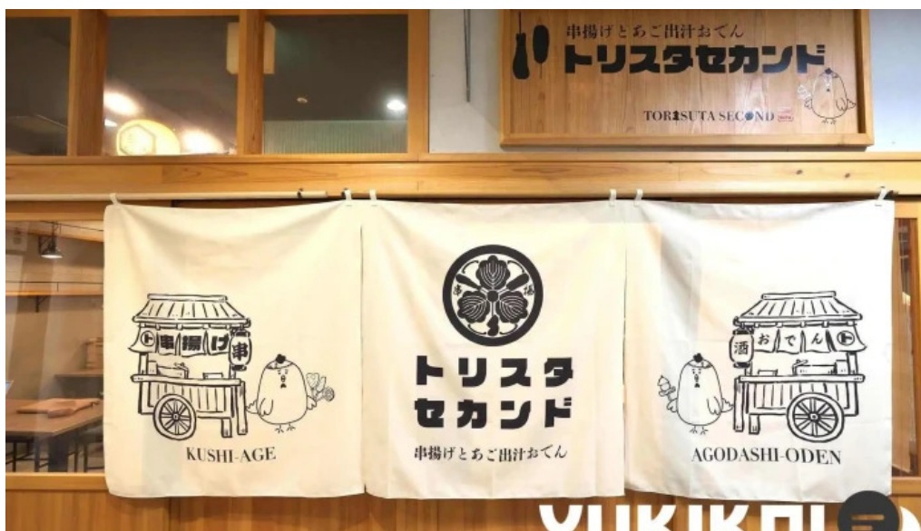
鮮魚とあご出汁おでん トリスタセカンド オーナー提供