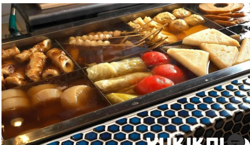
鮮魚とあご出汁おでん トリスタセカンド おでん