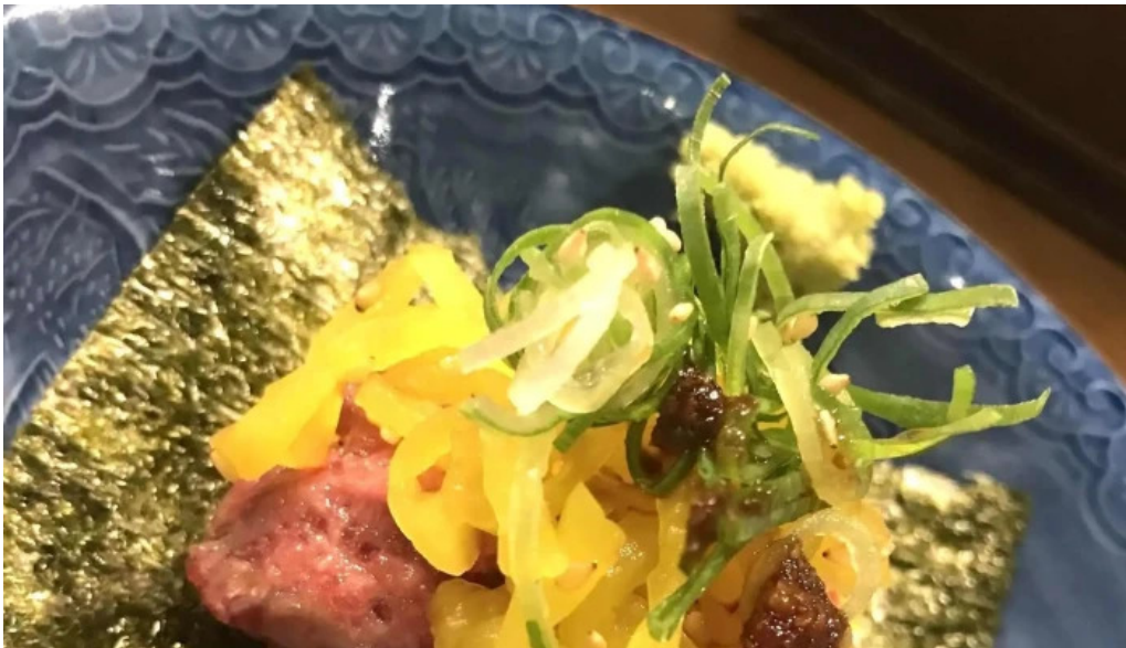
鮮魚とあご出汁おでん トリスタセカンド 割引