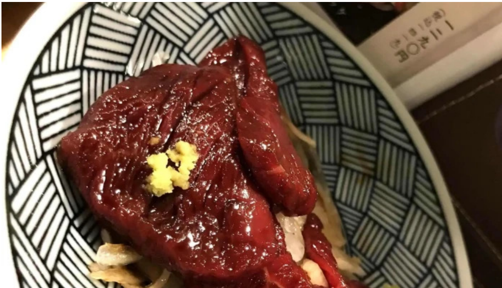
鮮魚とあご出汁おでん トリスタセカンド スコア