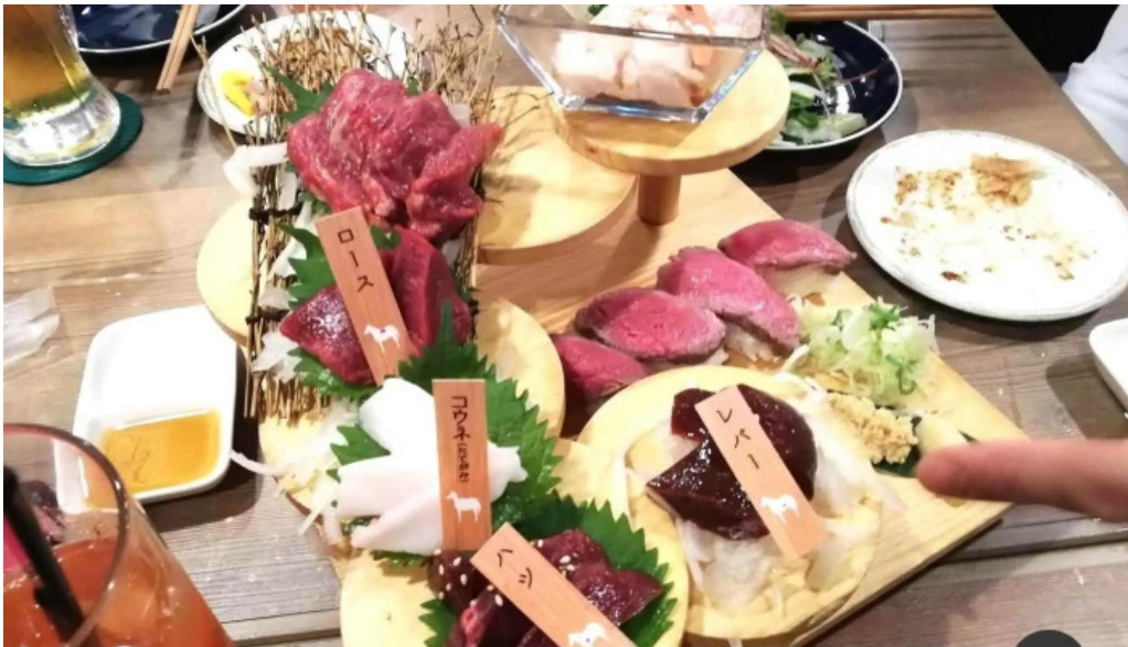
鮮魚とあご出汁おでん トリスタセカンド シャルキュトリー