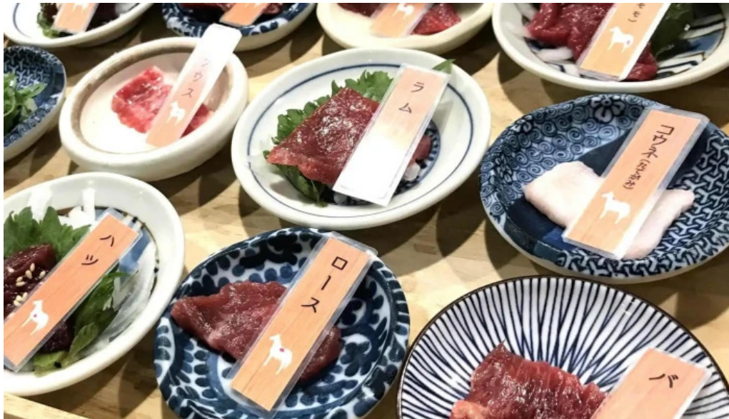
鮮魚とあご出汁おでん トリスタセカンド 住所