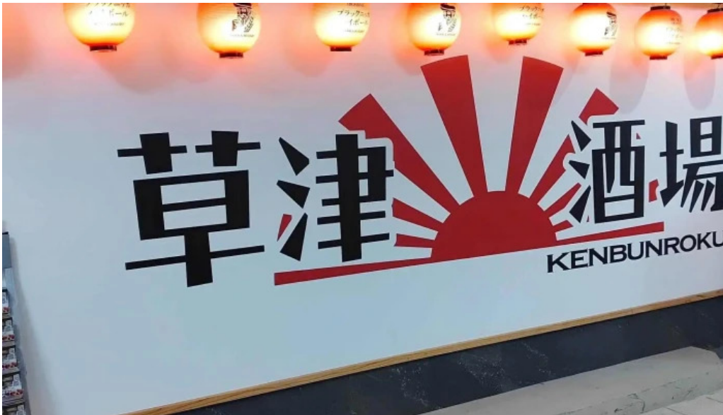
草津酒場 見聞録 口コミ