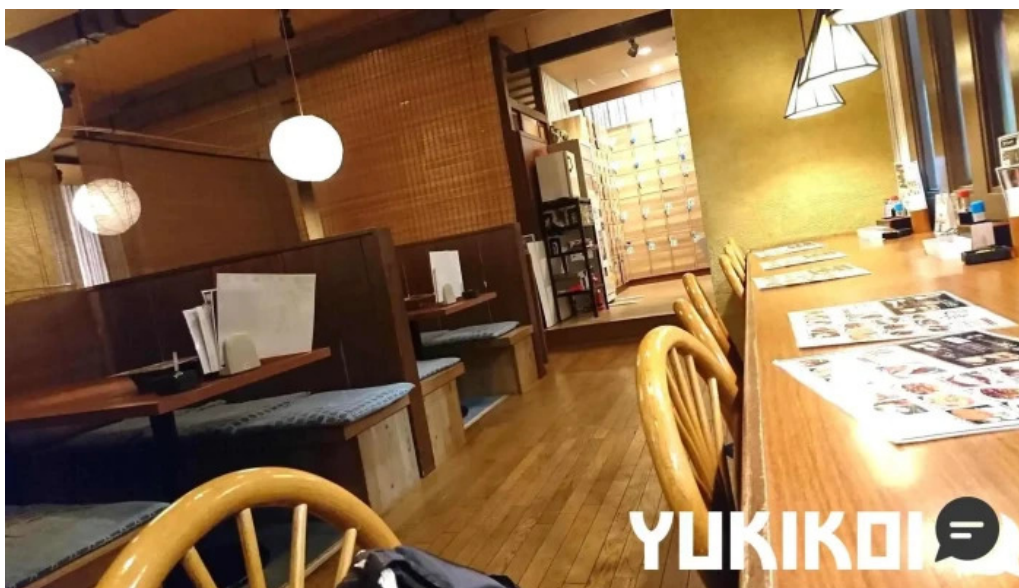
草津酒場 見聞録 雰囲気