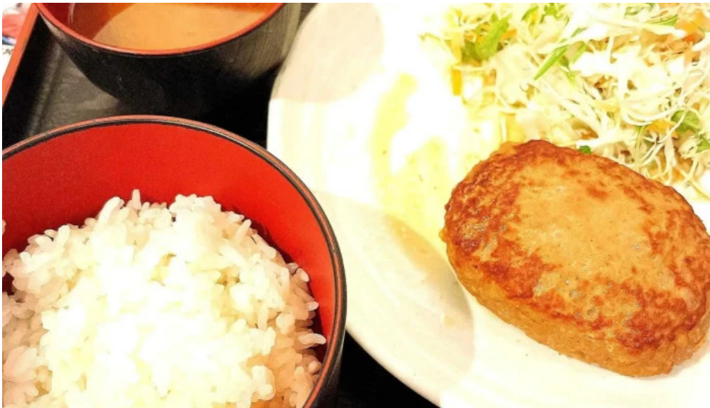
草津酒場 見聞録 ウェブサイト