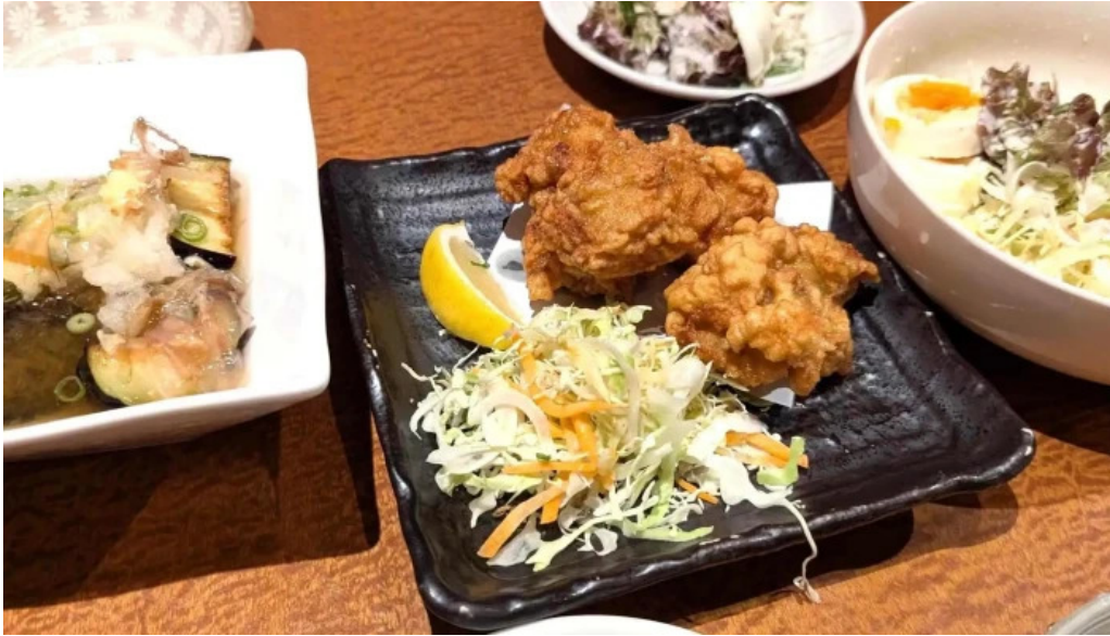
草津酒場 見聞録 営業時間