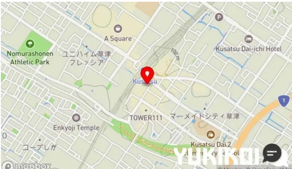
草津酒場 見聞録 地図