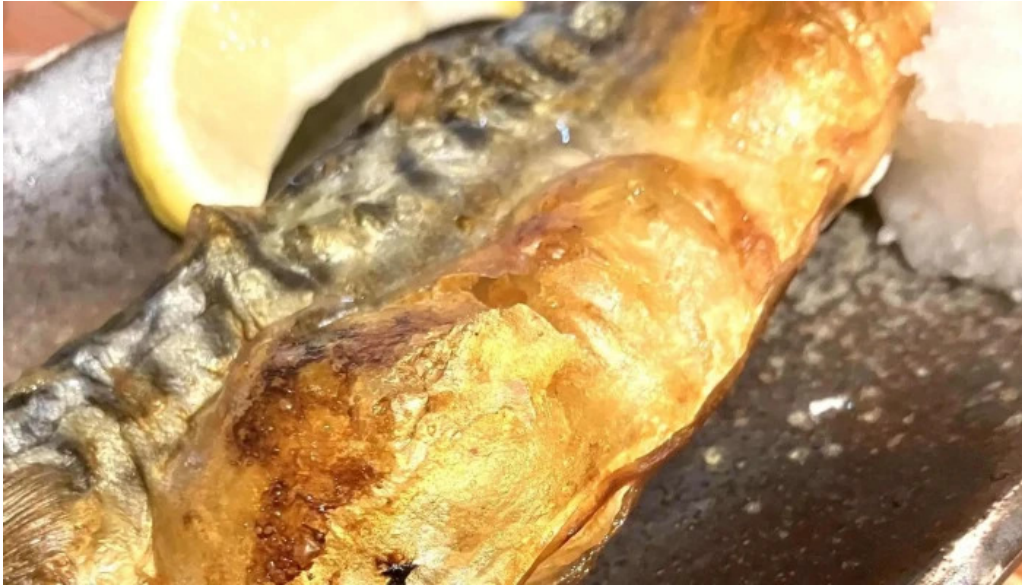
草津酒場 見聞録 行き方