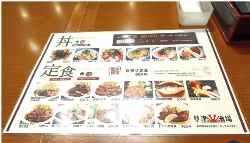
草津酒場 見聞録 メニュー