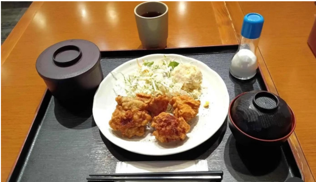
草津酒場 見聞録 料理飲み物