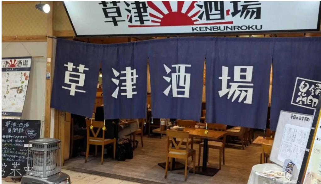
草津酒場 見聞録 動画