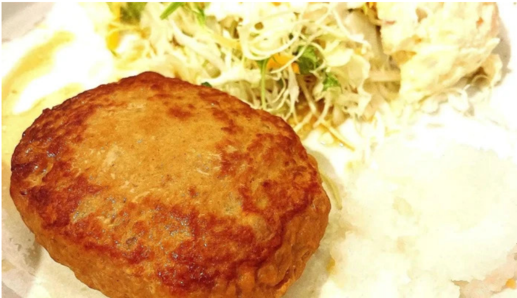
草津酒場 見聞録 料金