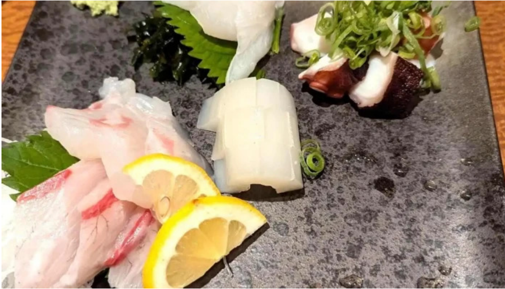
草津酒場 見聞録 最新