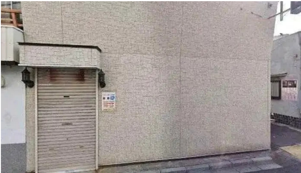
草津酒場 見聞録 草津市