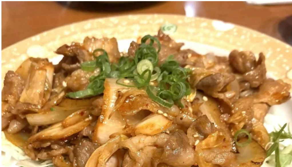
草津酒場 見聞録 写真