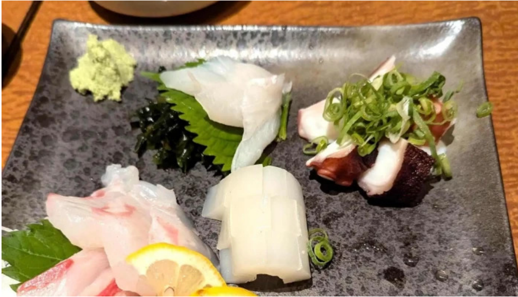
草津酒場 見聞録 プロモーション